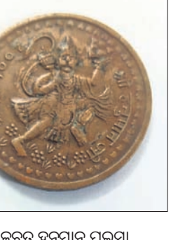
ଜବତ ହନୁମାନ ପଇସା

ପୁରୀ ଜିଲ୍ଲା ସତ୍ୟବାଦୀ ଥାନା ଅଞ୍ଚଳରେ ହନୁମାନ ପଇସା ବିକ୍ରି ପାଇଁ ଯୋଜନା କରୁଥିବା ବେଳେ ପୋଲିସ ଚଢ଼ାଉ କରି ୫ଜଣଙ୍କୁ ଗିରଫ କରି ମଙ୍ଗଳବାର କୋର୍ଟଚାଲାଣ କରିଛି।