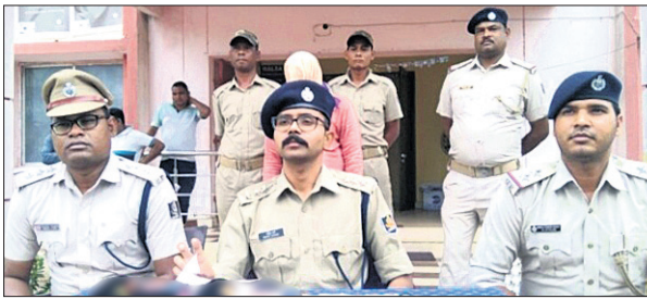
ଖବରଦାତା ସମ୍ମିଳନୀରେ ପୋଲିସ ଅଧିକାରୀଙ୍କ ସହିତ ସମୀକ୍ଷା କରାଯାଇଛି।