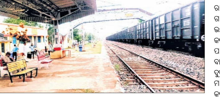
ବାହାନଗା ଷ୍ଟେଶନ ସ୍ୱାଭାବିକ ହେବା ପରେ ଅପେକ୍ଷାରତ ଯାତ୍ରୀ।

ବାହାନଗା, ୨୭.୬.୨୩ (ଅପୂର୍ବ କୁମାର ଦାସ) ଟ୍ରେନ୍ ଦୁର୍ଘଟଣାର ୨୫ ଦିନ ପରେ ସ୍ୱାଭାବିକ ହୋଇଛି ବାହାନଗା ରେଳଷ୍ଟେଶନ। ମଙ୍ଗଳବାର ଏହି ଷ୍ଟେଶନରେ ଅଟକିଥିବା ୩ ପାସେଞ୍ଜର ଟ୍ରେନ୍, କଳେଷ୍ୱର-ପୁରୀ ମେମୁ, ବାଲେଶ୍ୱର-ଭଦ୍ରକ ପାସେଞ୍ଜର, ଭଦ୍ରକ-ଖଟଗପୁର ମେମୁ ଆଦି ପାସେଞ୍ଜର ରହିଛି।