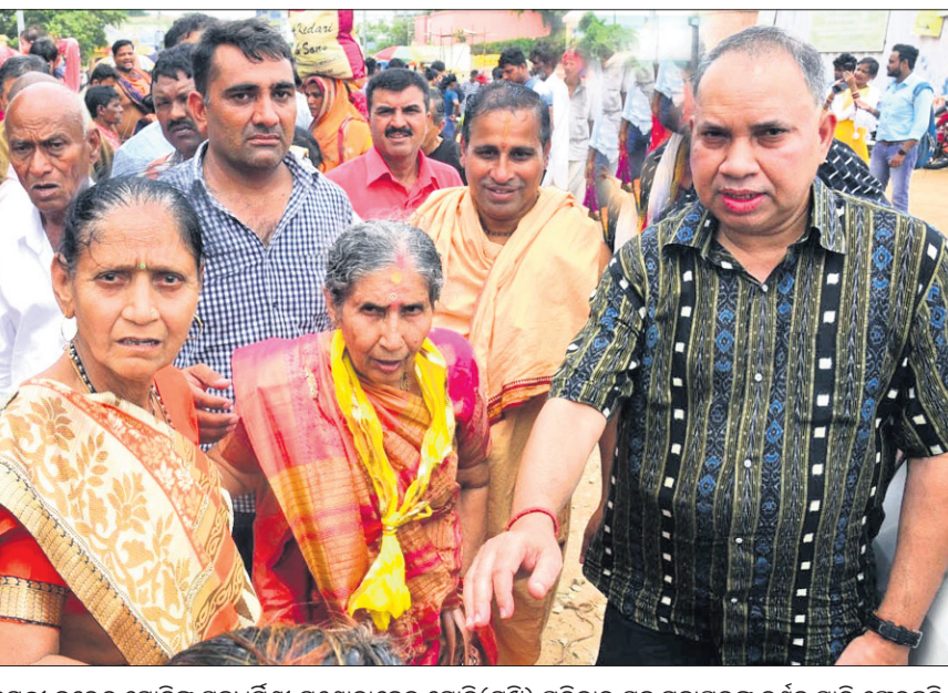
ପ୍ରଧାନମନ୍ତ୍ରୀ ନରେନ୍ଦ୍ର ମୋଦିଙ୍କ ସହଧର୍ମିଣୀ ଯଶୋଦାବେନ ମୋଦି(ମଝି) ପରିବାର ସହ ମହାପ୍ରଭୁଙ୍କ ଦର୍ଶନ ସାରି ଫେରୁଛନ୍ତି।