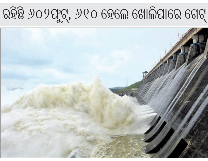
ହୀରାକୁଦ ତ୍ୟାମ୍। ଉପରପୁଞ୍ଜରେ ୫୩.୫୨ମି.ମି. ଓ କରାଯାଇଛି। ଉପରପୁଞ୍ଜରେ ବର୍ଷା ଲାଗି ମଙ୍ଗଳବାର ୪୪.୫୨ମି.ମି. ବର୍ଷା ରେକର୍ଡ ରହିଛି। ଜଳଭଣ୍ଡାରକୁ ପ୍ରତି ସେକେଣ୍ଡରେ ୩୨ ହଜାର ୮୭୮ କ୍ୟୁସେକ ପାଣି ପ୍ରବେଶ କରୁଛି।

ସମସ୍ତ ରାଜ୍ୟରେ ବୁଲିବିନ ହେଲା ବୁଝାକୁ ବୁଝା ବର୍ଷା ଲାଗିରହିଛି। ହୀରାକୁଦ ଜଳଭଣ୍ଡାର ଉପରପୁଞ୍ଜରେ ମଧ୍ୟ ପ୍ରବଳ ବର୍ଷା ହୋଇଛି।