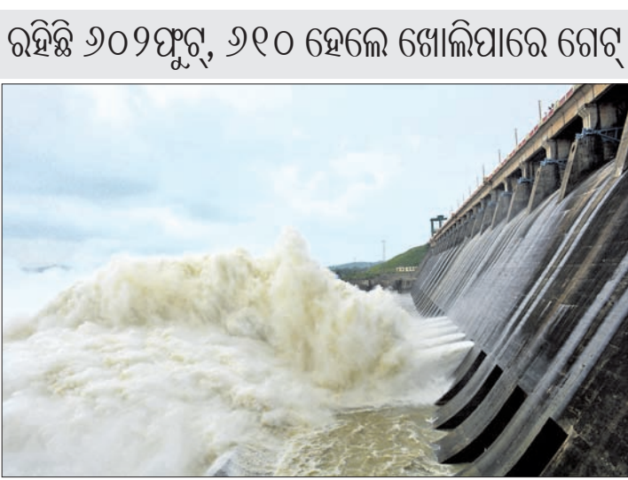
ହିରାକୁଦ ତ୍ୟାମ୍ରେ ଜଳସ୍ତର ବୃଦ୍ଧି ହେଉଛି। ଉପରପୁଞ୍ଜରେ ବର୍ଷା ଲାଗି ମଙ୍ଗଳାକାର ୪୪.୫୬ମି.ମି. ବର୍ଷା ରେକର୍ଡ ହେଉଛି।

ସମଲପୁର, ୨୭ (ଶୁକ୍ରବାର ପାଠ୍ୟ) ସମଗ୍ର ରାଜ୍ୟରେ ବୁଲିବିନ ହେଲା ବୁଝାକୁ ବୁଝା ବର୍ଷା ଲାଗିବିନି ହିରାକୁଦ ଜଳଭଣ୍ଡାର ଉପରପୁଞ୍ଜରେ ମଧ୍ୟ ପ୍ରବଳ ବର୍ଷା ହୋଇଛି।