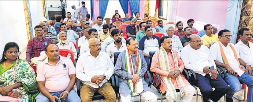
କାର୍ଯ୍ୟକ୍ରମରେ ଉପସ୍ଥିତ ଭାଗ୍ୟା ନେତା ଓ କର୍ମୀ।

ବ୍ରହ୍ମପୁର(ନରସିଂହ ସାହୁ), ୨୭/୬ ବ୍ରହ୍ମପୁର ବିଧାନସଭା ନିର୍ବାଚନ ମଣ୍ଡଳୀ ଭାଙ୍ଗିବା ପାଇଁ ପକ୍ଷରୁ ମଜାଜାରି କରିବା ପାଇଁ ପକ୍ଷରୁ ମୋ ବୁଧୁ ସବୁ ମଜଭୁତ କାର୍ଯ୍ୟକ୍ରମ ଅନୁଷ୍ଠିତ ହୋଇଥିଲା।