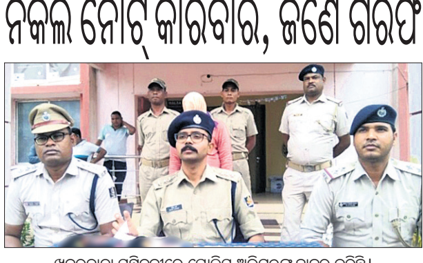
ଖବରଦାତା ସମ୍ମିଳନୀରେ ପୋଲିସ ଅଧିକାରୀଙ୍କୁ ହାଜର କରିଛି।

୨୨ ହଜାର ୮୭୮ କ୍ୟୁସେକ ପର୍ଯ୍ୟନ୍ତ ପ୍ରବେଶ କରୁଛି। ପାଖାପାଖି ୧୧,୩୨୮, ୨୩୫ ପାଇଁ ୩୦୦, ଶହ ଲାଗି ୨୬୮ ଏକମି ମୋଟ ୧୨ ହଜାର ୫୪୮ କ୍ୟୁସେକ ପାଣି ବ୍ୟବହାର ହେଉଛି।