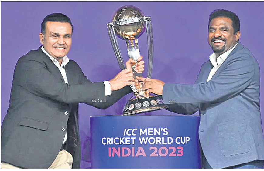
ପୁସ୍ତକଠାରେ ମଙ୍ଗଳବାର ଆଇସିସି ଦିନିକିଆ କ୍ରିକେଟ୍ ବିଶ୍ୱକପ୍ କାର୍ଯ୍ୟକ୍ରମ ଘୋଷଣା କାର୍ଯ୍ୟକ୍ରମ ଅବସରରେ ଗ୍ରୀଟ୍ ସହ ଭାରତର ବାରେନ୍ଦ୍ର ସେହ୍ୱାଗ ଓ ଶ୍ରୀଲଙ୍କାର ପୁଥୁୟା ପୁରଲକ୍ଷ୍ମୀଙ୍କୁ ପୁସ୍ତକ ଉପହାର କରାଯାଇଥିଲା।

ଦିନିକିଆ କ୍ରିକେଟ୍ ବିଶ୍ୱକପ୍-୨୦୨୩ରୁ ୧୦୦ ଦିନ ବାକି ରହିଥିବା ବେଳେ ମଙ୍ଗଳବାର ଅରୁଣାଚଳ କ୍ରିକେଟ୍ କାର୍ଯ୍ୟକ୍ରମ (ଆଇସିସି) ପକ୍ଷରୁ ପ୍ରକାଶ ପାଇଛି ଚୁଡ଼ାଚଳ କାର୍ଯ୍ୟକ୍ରମ। ବିଶ୍ୱର ସର୍ବବୃହତ୍ ଅହମଦାବାଦ ନଗରର ମୋତି କ୍ରିକେଟ୍ ଷ୍ଟାଡ଼ିୟମରୁ ଅଲୋକାରମ୍ଭ ହେବ।