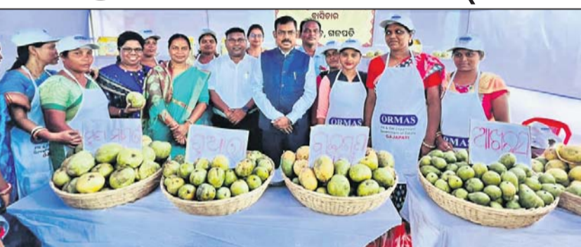
ପାରଳାଖେମୁଣ୍ଡି ୨୭/୬