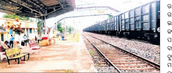
ବାହାନଗା ଷ୍ଟେଶନ ସ୍ୱାଭାବିକ ହେବା ପରେ ଅପେକ୍ଷାରତ ଯାତ୍ରୀ।

ରାଜପଥରେ ଏକ ତକାୟତ ବଳ ମାଲବାହୀ ଗାଡ଼ିକୁ ଅଟକାଇ ଲୁଚେରା କରୁଥିଲେ। ଏମାନଙ୍କ ଭୟରେ ବିକଳିତ ରାତିରେ ଲୋକେ ଯିବାକୁ ଭୟ କରୁଥିଲେ।