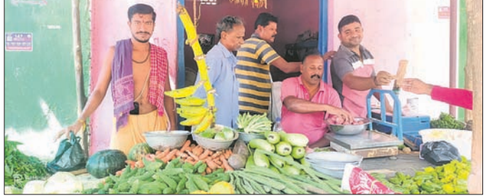
ପରିବା ବ୍ୟବସାୟୀ ।

ବତ ବଜାର ପରିବା ବ୍ୟବସାୟୀ ବଳିଆ ପଲାଇ । ଗଞ୍ଜାମ ରୁକ ଅଞ୍ଚଳରେ ଶୀତଳ ଭଣ୍ଡାରଟିଏ ନାହିଁ । ଫଳରେ ସମସ୍ୟା ବହୁଥିବା ଚାଷୀ ଅଭିଯୋଗ କରିଛନ୍ତି । ଅତ୍ୟଧିକ ଖରାବ ଦିନ ହେଲେ ଶୀତଳ ଭଣ୍ଡାର ଆବଶ୍ୟକ ପଡୁଥିବା ବେଳେ ଏଠାରେ ନ ଥିବା ଯୋଗୁଁ ଅଧିକାଂଶ ଚାଷୀ ଚାଷ କାର୍ଯ୍ୟକୁ ମୁହଁ ଫେରାଇଛନ୍ତି ।