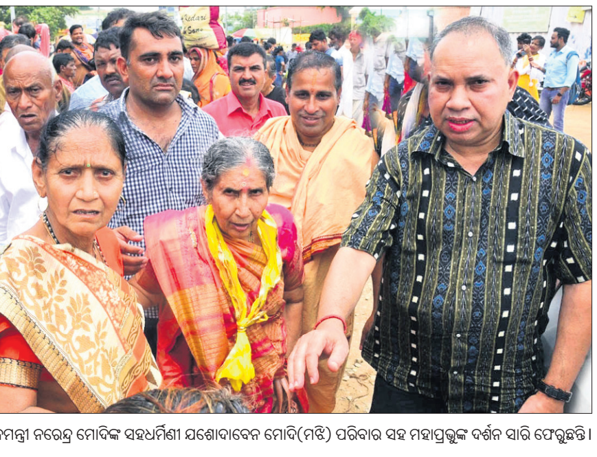
ପ୍ରଧାନମନ୍ତ୍ରୀ ନରେନ୍ଦ୍ର ମୋଦିଙ୍କ ସହଧର୍ମିଣୀ ଯଶୋଦାବେନ ମୋଦି(ମଝି) ପରିବାର ସହ ମହାପ୍ରଭୁଙ୍କୁ ଦର୍ଶନ କରି ଫେରୁଛନ୍ତି।

ପୁରୀ, ୨୭ (ଅଧିକ ମହାନ୍ତି) ଶ୍ରୀକ୍ଷେତ୍ରରେ ସନ୍ଧ୍ୟା ଦର୍ଶନ ଅବସରରେ ଲକ୍ଷ୍ୟଧିକ ଭକ୍ତ ରୁଦ୍ଧିନୀ ମନ୍ଦିର ଯାଇ ଚଳିତବର୍ଷ ଆଡ଼ିପ ମଞ୍ଚପରେ ଚତୁର୍ଦ୍ଧାପର୍ଯ୍ୟନ୍ତ ଶେଷ ଦର୍ଶନ କରିଛନ୍ତି।