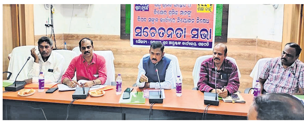
ସଚେତନତା ସଭାରେ ଉପସ୍ଥିତ ଅଧିକାରୀ ।