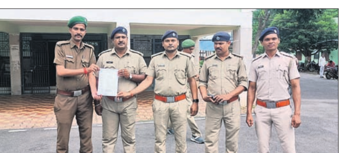
ସ୍ନାନକପତ୍ର ଦେଇ ଫେରୁଛନ୍ତି ।

ଓଡିଶା ଅଣ-ଗେଜେଟେଡ୍ ବନ ସେବା ସଂଘ ପକ୍ଷରୁ ୪ ଦିନ ଦାବି ନେଇ ମଙ୍ଗଳବାର ମୁଖ୍ୟମନ୍ତ୍ରୀଙ୍କ ଉଦ୍ଦେଶ୍ୟରେ ଗଂଜାମ ଜିଲ୍ଲାପାଳଙ୍କୁ ଛତ୍ରପୁର ଠାରେ ସ୍ନାନକପତ୍ର ପ୍ରଦାନ କରାଯାଇଛି । ଉକ୍ତ ଦାବି ବୃତ୍ତିକ ୮ ତାରିଖ ସୁଦ୍ଧା ପୁରଣ କରାଯାଇ ପାରେ ନାହିଁ ତେବେ ୧୦ ତାରିଖରୁ ସମସ୍ତ ଡେପୁଟି ରେଜିଷ୍ଟର, ଫରେଷ୍ଟର, ଫରେଷ୍ଟ ଗାର୍ଡ ମାନେ ସମୁଦ୍ରେ ଛୁଟିରେ ଯିବେ ।