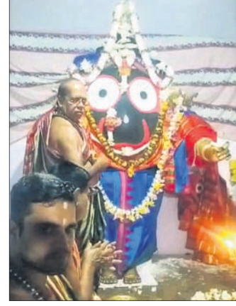
ଏହି ବିଶ୍ୱାସକୁ ଦୃଷ୍ଟିରେ ରଖି ଶ୍ରଦ୍ଧାଳୁମାନଙ୍କ ଭିଡ଼ ପରିଲକ୍ଷିତ ହୋଇଥିଲା ।

ଖଣ୍ଡପଡ଼ା ସହରର ଗୁଣ୍ଡିଚା ମନ୍ଦିରରେ ଏକକ ଜଗନ୍ନାଥ (ପିତରପାବନ) ଓ ମହିମାମେରୁ (ଶ୍ରୀକଗନାଥ, ଶ୍ରୀବଳଭଦ୍ର ଓ ଦେବୀ ସୁଭଦ୍ରା)ଙ୍କ ମଙ୍ଗଳବାର ସନ୍ଧ୍ୟା ଆଳତି ଦର୍ଶନ ନିମନ୍ତେ ବହୁ ଶ୍ରଦ୍ଧାଳୁଙ୍କ ସମାଗମ ହୋଇଥିଲା । ଆତପ ମଞ୍ଚପରେ ଶ୍ରୀକଗନାଥଙ୍କ ଆଳତି ଥିଲା ଶେଷ ଦର୍ଶନ । ବିଶ୍ୱାସ ଅଛି ନବମା ତିଥିରେ ଠାକୁରଙ୍କ ସନ୍ଧ୍ୟା ଆଳତି ଦର୍ଶନ ସହ ନିଜ ପରିବାର ଲୋକଙ୍କୁ ଦେଖିବା ପାଇଁ ପୂର୍ବ ପୂଜ୍ୟମାନେ ଗୁଣ୍ଡିଚା ମନ୍ଦିରରେ ଅପେକ୍ଷା କରିଥାନ୍ତି । ତେଣୁ