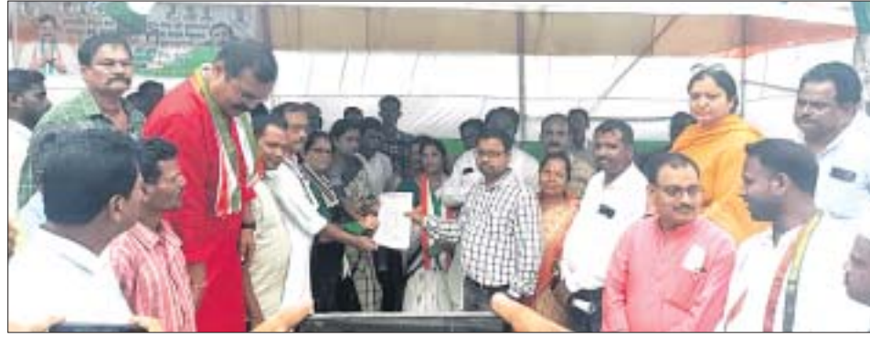
ବିଦ୍ୟୁତ୍ ବିଭାଗ ଅଧିକାରୀ କଂଗ୍ରେସ ନେତୃମଣ୍ଡଳୀ ଦାବିପତ୍ର ପ୍ରଦାନ କରୁଛନ୍ତି।

ଅଯୋଧ୍ୟା ବିଦ୍ୟୁତ୍ କାର୍ ପ୍ରତିବାଦରେ ଯାଜପୁର ଜିଲ୍ଲା କଂଗ୍ରେସ କମିଟି ପକ୍ଷରୁ ମଙ୍ଗଳବାର ଜିଲ୍ଲାପାଳଙ୍କ କାର୍ଯ୍ୟାଳୟ ସମ୍ମୁଖରେ ୫୪୮୦ ଦାବିରେ ଧାରଣା ଦିଆଯିବ ସହ ବିକ୍ଷୋଭ ପ୍ରଦର୍ଶନ କରାଯାଇଛି।