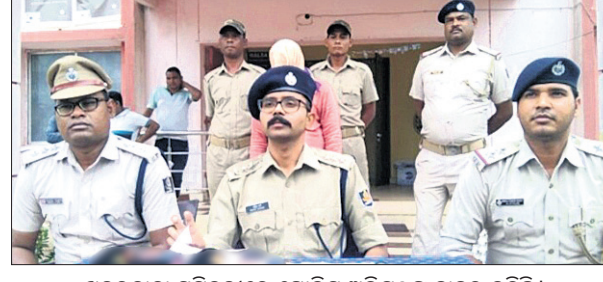
ଖବରଦାତା ସମ୍ମିଳନୀରେ ପୋଲିସ୍ ଅଧିକାରୀଙ୍କୁ ହାଜର କରିଛି।