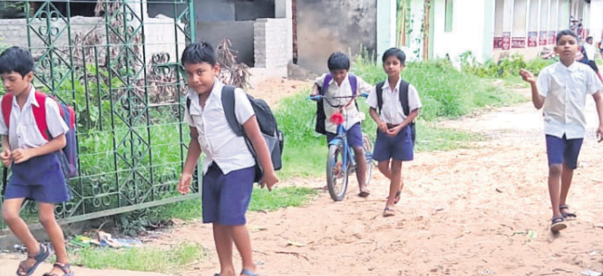
ପଶ୍ଚିମପାର୍ଶ୍ୱ ପାଟକ ପରେ ପିଲାମାନେ ସ୍କୁଲ ଯାଉଛନ୍ତି ।

ଗୋଳହରା ଥାନା ଅନ୍ତର୍ଗତ ଫୋପବାର ରାତିରେ ଜନେକ ସ୍କୁଟି ଆରୋହୀଙ୍କୁ ଚଳାଇବାରେ ଖଣ୍ଡରେ ମରଣାନ୍ତକ ଆକ୍ରମଣ କରିଥିବା ଥାନା ଅଭିଯୋଗ ହୋଇଛି । ଏ ନେଇ ପୋଲିସ ଏକ ହତ୍ୟା ଉଦ୍ୟମ ମାମଲା ରୁଜୁ କରିଛି ।