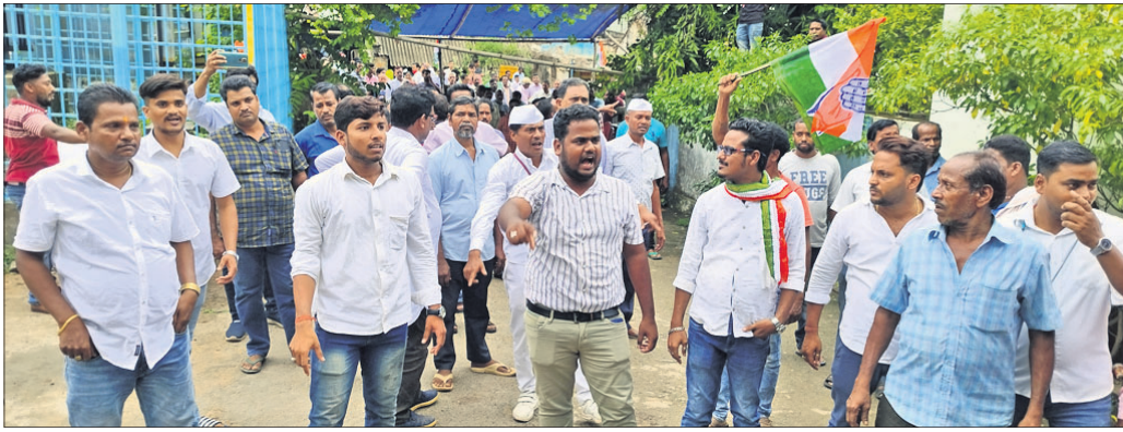
କଂଗ୍ରେସ କର୍ମୀମାନେ ବିରୋଧୀ ପ୍ରଦର୍ଶନ କରୁଛନ୍ତି ।

ଗୀତା ପାଠର କର୍ମୀମାନେ ମନମାନି, ଅପୋଷିତ ବିଦ୍ୟୁତ୍ କାଟି ଓ ଲୋଭୋଲଟେଜର ପ୍ରତିବାଦରେ ନୟାଗଡ଼ ଗୀତା ପାଠର ଉଚ୍ଚତମ କାର୍ଯ୍ୟାଳୟ ସମ୍ମୁଖରେ କଂଗ୍ରେସ ବିରୋଧୀ ପ୍ରଦର୍ଶନ କରିବା ସହ ଅଣ୍ଡା ଓ ଚମାଚୋ ମାଡ଼ କର୍ମୀମାନେ କରିଛନ୍ତି । ଏପରି ଘଟଣାରେ ନୟାଗଡ଼ ବିଦ୍ୟୁତ୍ ଉଚ୍ଚତମ କାର୍ଯ୍ୟାଳୟର ବହୁବାରୁ କର୍ମଚାରୀଙ୍କ ଦାସ ଅପମାନ ହୋଇ ପଡିଛି । ଲିଙ୍ଗରେ ବହୁଦିନ ଧରି ବିଦ୍ୟୁତ୍ ବିଭାଗ ବିରୋଧରେ ଲାଗି ରହିଥିବା ଅପରୋଧ, ଯୋଡ଼ ମଙ୍ଗଳବାର ବିଷୟର ଚାପ ନେବା ପରେ ଅଣ୍ଡା ଓ ଚମାଚୋ ମାଡ଼ କରି କଂଗ୍ରେସ କର୍ମୀମାନେ ନିଜ ରାଗ ଶାନ୍ତ କରିଛନ୍ତି । ବିଦ୍ୟୁତ୍ ବ୍ୟବସ୍ଥାରେ ହୁଆର ନ ଆସିଲେ ଏପରି ବିରୋଧ, ଆନ୍ଦୋଳନ ସହ ଚମାଚୋ ଓ ଅଣ୍ଡା ମାଡ଼ କରାଯିବ ବୋଲି କଂଗ୍ରେସ ନେତାମାନେ ଚେତାବନୀ ଦେଇଛନ୍ତି ।