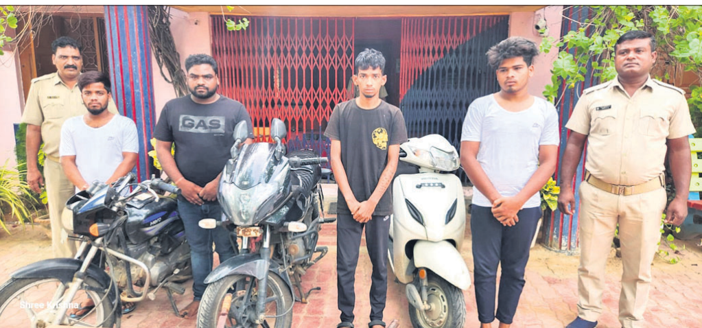
ରିମ୍ପେ ଅଭିଯୁକ୍ତ ସହ କବଚ ବାଇକ ଓ ସ୍କୁଟି ।

ଗଞ୍ଜାମ ଜିଲ୍ଲା ୧୬୦୯ ଜାତୀୟ ରାଜପଥରେ ଗତ ୨୪ ତାରିଖ ଦିନ ବ୍ୟବସାୟୀଙ୍କୁ ଲଙ୍କାଗୁଣ ପିଙ୍ଗି ମରଣାନ୍ତକ ଆକ୍ରମଣ କରି ଲୁଚି ହୋଇଥିଲା। ଗୋଳହରା ଥାନା ପୋଲିସ ମଙ୍ଗଳବାର ଏହି ଘଟଣାର ଫର୍ଦାପାଣ କରିଛି। ଘଟଣାର ମୁଖ୍ୟ ଷଡ଼ଯନ୍ତ୍ରକାରୀଙ୍କ ସମେତ ୪ ଜଣଙ୍କୁ ପୋଲିସ ଗିରଫ କରି କୋର୍ଟ ଚାଲାଇ ଦେଇଛି।