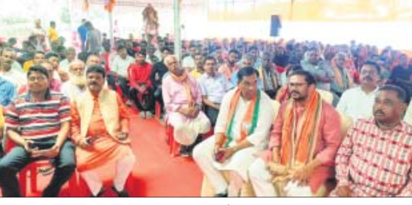
ଆଭାସୀ ସମ୍ମିଳନୀରେ ଯୋଗଦେଇଥିବା ଭାଗ୍ୟା ନେତା ଓ କର୍ମୀ।