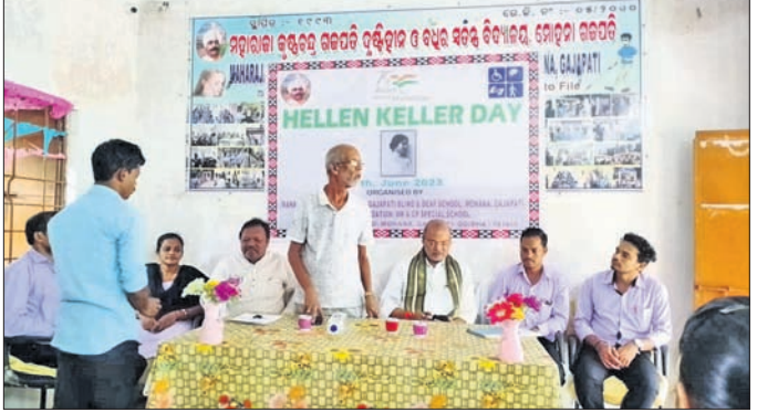
କାର୍ଯ୍ୟକ୍ରମରେ ଉପସ୍ଥିତ ଅତିଥି ।