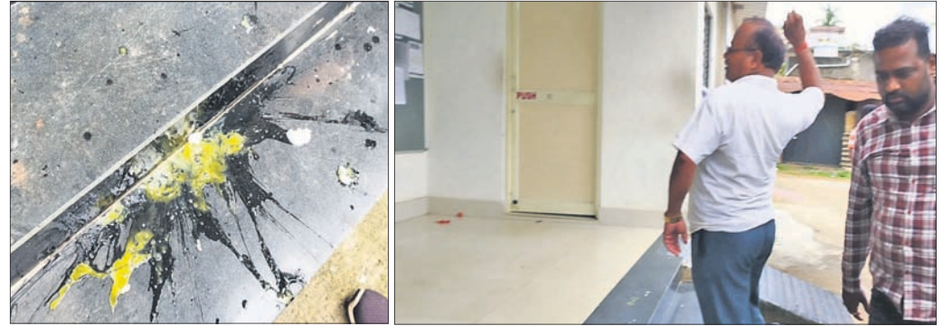
ଗୀତା ପାଠର ଅର୍ପଣକୁ ଲକ୍ଷ୍ୟ କରି ଅଣ୍ଡାମାଡ଼ କରାଯାଇଛି ।

କିନ୍ତୁ ଗାଳିଯାଇଥିଲେ । କଂଗ୍ରେସ କର୍ମୀ ଅର୍ପଣ ଭିତରେ ପଶି ମଧ୍ୟ ଅଣ୍ଡା ଓ ଚମାଚୋ ମାଡ଼ କରିଥିଲେ । ପରବର୍ତ୍ତୀ ପର୍ଯ୍ୟାୟରେ କଂଗ୍ରେସ ପକ୍ଷରୁ ସ୍ମାରକପତ୍ର ପ୍ରଦାନ କରାଯାଇଛି । ଏନେଇ ବହୁବାରୁ କର୍ମଚାରୀଙ୍କ ଦାସ ହୁହୁଛି, ଅଣ୍ଡା ଓ ଚମାଚୋ ମାଡ଼ରେ ପୂର୍ଣ୍ଣ ଅସୁସ୍ଥ ହୋଇଛି । ଏନେଇ ମୁଁ ଆଲନ ଆଣ୍ଡ୍ ନେବ ବୋଲି କହିଛନ୍ତି । କଂଗ୍ରେସ ଲିଙ୍ଗ ସଭାପତି ରକ୍ଷିତ୍ ଦାଶ ହୁହୁଛି, ଲିଙ୍ଗ ୧୦ ଷ୍ଟେସନ୍ କୁଶଳ, ୫ ପିଠୁ ଗୁଣ୍ଡ, ୨୦ ରାଜସ୍ୱ ଲିଙ୍ଗ ୨୪ ଲନ ହୁ ୨ ହାଲ ଲୋଭୋଲଟେଜ ବିଦ୍ୟୁତ୍ ଶକ୍ତି ଯୋଗାଣ ହେଉଛି । ନିଆଣ୍ଡ ବିଦ୍ୟୁତ୍ ଭରଣା ପାଇଁ ଲିଙ୍ଗ ବ୍ୟାପା ଅପୋଷିତ ବିଦ୍ୟୁତ୍ କାଟି କରାଯାଇଛି । ସେହିପରି ଲିଙ୍ଗ ଲକ୍ଷ୍ମଣ ବିଦ୍ୟୁତ୍ ଗ୍ରାହକକଠାରୁ ମାସକୁ କିଛି ଚାର୍ଜରେ ୫୦ ଟଙ୍କା ଲେଖାଏଁ ମାସରେ ୧୨ ୨ କୋଟି ଆଦାୟ ହେଉଛି । ତେବେ କଂଗ୍ରେସ ସରକାର ସମୟରୁ ରାଜ୍ୟପାଟଣାରେ ଗ୍ରାହକ ବିଦ୍ୟୁତ୍ ଖୁଚକର ନିର୍ମାଣ ହୋଇଥିଲା । ଉପଭୋକ୍ତା ବହୁଥିବାବେଳେ ବିଭିନ୍ନ ୨୩ ବର୍ଷ ଶାସନରେ ୨୫ ଖୁଚକର ନିର୍ମାଣ ହୋଇ ପାରିନାହିଁ । ଏହି କଂଗ୍ରେସ କର୍ମୀମାନେ ଏହାର ବଡ଼ ପ୍ରତିବାଦ କରି ଆନ୍ଦୋଳନ କରିଥିଲେ ।