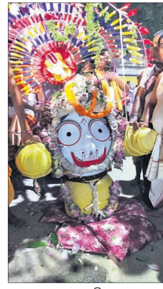
ସୋନପୁର ଗଡ଼ଭିତରରେ ବଳଭଦ୍ରଙ୍କ ପହଣ୍ଡି । ଗୁଣ୍ଡିଚା ମନ୍ଦିର ସମ୍ମୁଖରେ ଜଗନ୍ନାଥଙ୍କୁ ପହଣ୍ଡି କରାଯାଇଛି ।

ମହାପ୍ରଭୁଙ୍କ ନବଦିନାତ୍ୱ ଯାତ୍ରା ଶେଷ ହୋଇଛି । ଏଥିପାଇଁ ସୁବର୍ଣ୍ଣପୁର ଜିଲ୍ଲାର ପୁରପଲ୍ଲୀ ଉତ୍ସବପୁଞ୍ଜର ହୋଇ ଉଠିଥିଲା । ବାହୁଡ଼ା ଯାତ୍ରା ପାଇଁ ମନ୍ଦିରଗୁଡ଼ିକରେ ରୁଧିର ଦୈନିକ ପୂଜାର୍ଚ୍ଚନା ସମାପନ ହୋଇଛି ।