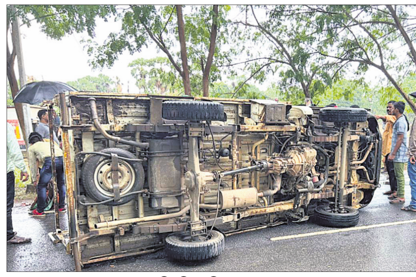
ଓଲଟି ପଡ଼ିଥିବା ପିକ୍‌ଅପ୍ ଭ୍ୟାନ ।

ବଲାଙ୍ଗୀର/ପାଟଣାଗଡ଼, ୨୮।୬ (ବାରେନ୍ଦ୍ର କୁମାର ଝାଙ୍କର/ପ୍ରହଲ୍ଲାଦ ପାଠି)