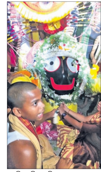
ଅନୁପାୟା ସମସ୍ତ କାର୍ଯ୍ୟକ୍ରମ ଆୟୋଜିତ ହେଉଛି । ପୋଲିସ୍ ପ୍ରଶାସନ ପକ୍ଷରୁ ବିକେ କରିଛନ୍ତି । ଦେବୋତ୍ତର ବିଭାଗ ପାଇଁ ପୋଲିସ୍ ମୁତୟନ ହୋଇଥିଲେ ।