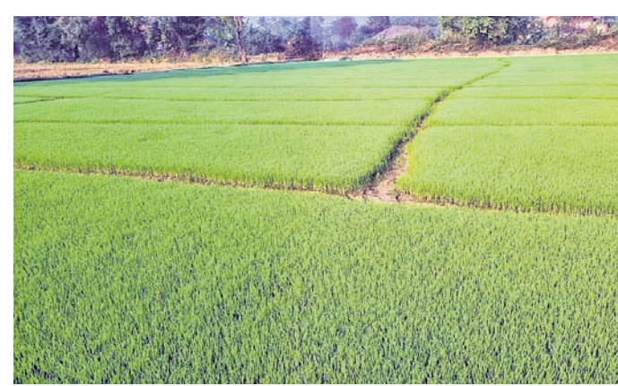
ବରଗଡ଼ ବ୍ଲକ୍ କଳାପାଣି ଅଞ୍ଚଳରେ ଧାନ କିଆରୀ ।