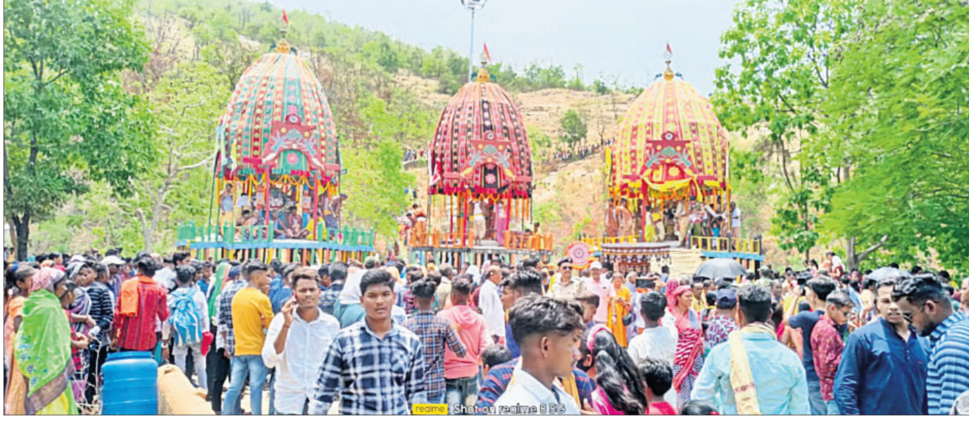
ରୁଧିର ସୁବର୍ଣ୍ଣପୁର ଜିଲାର ପାତାଳି ଶ୍ରୀକ୍ଷେତ୍ରରେ ମହାପ୍ରଭୁଙ୍କ ବାହୁଡ଼ା ଯାତ୍ରାରେ ଶ୍ରଦ୍ଧାଳୁଙ୍କ ଭିଡ଼ ।

ରଥରେ ବିଜେ ହେଲେ ଚତୁର୍ଦ୍ଧା ମୂର୍ତ୍ତି ବିନିକା, ୨୮୬ (ରାମଗୌପାଳ ବାଘୀ): ସୁବର୍ଣ୍ଣପୁର ଜିଲ୍ଲା ବିନିକା ସହରରେ ବାହୁଡ଼ା ଯାତ୍ରା ପାଳିତ ହୋଇଯାଇଛି ।