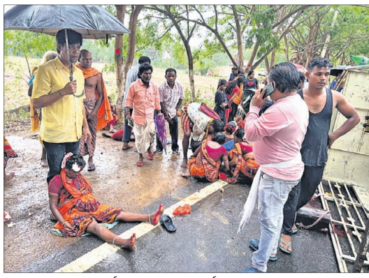
ଦୁର୍ଘଟଣାରେ ଆହତ ସଂକୀର୍ତ୍ତନ ଦଳ ସଦସ୍ୟ ।