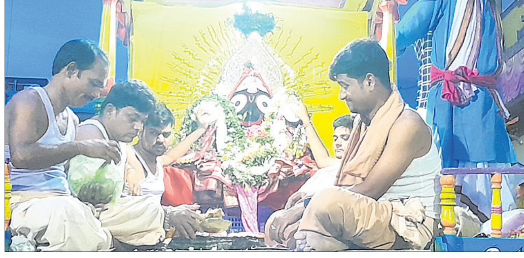
ବଲାଙ୍ଗୀର ଜିଲ୍ଲା ତୁଷୁରାରେ ରଥରେ ଶ୍ରୀଜୀଉଙ୍କୁ ନିଆଯାଉଛି ।

ବଲାଙ୍ଗୀର ଜିଲ୍ଲାରେ ବିଭିନ୍ନ ସ୍ଥାନରେ ରୁଧିରାଚାରଣ ବାହୁଡ଼ା ଯାତ୍ରା ସମ୍ପନ୍ନ ହୋଇଛି । ତିନି ଠାକୁର ମାଉସୀ ମା' ମନ୍ଦିରକୁ ଶ୍ରୀ ମନ୍ଦିରକୁ ପ୍ରତ୍ୟାବର୍ତ୍ତନ କରିଛନ୍ତି ।