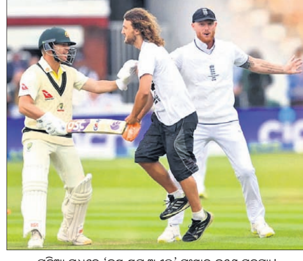
ପଡ଼ିଆ ମଧ୍ୟରେ 'ଜଷ୍ଟ୍ ଷ୍ଟୁ ଅଏଲ୍' ସଂସ୍ମାରଣ କରାଯାଇ ସଦସ୍ୟ ।

ଲଣ୍ଡନ, ୨୮ତା ଲଣ୍ଡନରେ ଅନୁଷ୍ଠିତ ବିତୀତ ଆଶେଷ୍ ଟେଷ୍ଟରେ ଡେଭିଡ୍ ଓଲିଭର୍ ଓ ଷ୍ଟିଭେନ୍ ଫ୍ଲିୟୁଙ୍କ ଅର୍ଦ୍ଧଶତକ ବଳରେ ଅଷ୍ଟ୍ରେଲିଆ ଦୁଇ ଟ୍ରେଜିଟ ରହିଛି । ଟେଷ୍ଟ ଇଂଲଣ୍ଡ ବୋଲି ନିଷ୍ପତ୍ତି ନେଇଥିବା ବେଳେ ପ୍ରଥମ ଦିନର ଖବର ପ୍ରକୃତ ସୁଖା ଅଷ୍ଟ୍ରେଲିଆ ଗା ଉଲ୍ଲେଖ ହରାଇ ୨୩୦ ରନ୍ ସଂଗ୍ରହ କରିଛି । ଲଣ୍ଡନର ଯାହୁଆ ପିନ୍‌ରେ ଇଂଲଣ୍ଡ ଟେଷ୍ଟ ବୋଲି ନିଷ୍ପତ୍ତି ନେଇଥିଲା । ବଲ୍ ସୁଲ୍ ହେଉଥିବା ବେଳେ ଗୋଟିଏ ପଦକ ଉପମାନ ଖୁଲ୍ ଡିଫେଣ୍ଡ କରୁଥିବା ବେଳେ ଡେଭିଡ୍ ଓଲିଭର୍ କାର୍ତ୍ତବ୍ୟ ଆଟାକ୍ କରିଥିଲେ । ଖୁଲ୍ ୭୦ ବଲ୍ ଖେଳି ୧୭ ରନ୍ କରିଥିବା ବେଳେ ଓଲିଭର୍ ୮୮ ବଲ୍‌ରୁ ୬୬ ରନ୍ କରିଥିଲେ । ୨୪ତମ ଓଭରରେ ପଦାର୍ପଣକାରୀ ଜୋସ୍ ଟେଲର ବଲ୍‌ରେ ହୋଲ୍ ହୋଇଥିଲେ ଖୁଲ୍ । ଆଉଟ ହେବା ପୂର୍ବରୁ ପ୍ରଥମ