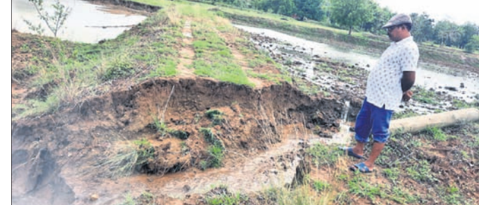
ପଦ୍ମପୁର ବ୍ଲକ୍ ଦଳିଗୁଡ଼ା ଗ୍ରାମରେ ଚାଷଜମିରେ ଘାଲ ସୃଷ୍ଟି ହୋଇଛି ।

ମୌସୁମୀ ପ୍ରଥମ ବର୍ଷରେ ପଦ୍ମପୁର ଉପଖଣ୍ଡ ଅଞ୍ଚଳରେ ରେକର୍ଡ଼ ବର୍ଷା ହୋଇଛି । ସମସ୍ତ ଫାଳରେ ଚାଷଜମି ସାହ୍ୟକେନ୍ଦ୍ର ଆଗରେ ଡ୍ରେନ ନିର୍ମାଣ ହୋଇଛି । ନିମ୍ନମାନର କାମ ଯୋଗୁ ନିର୍ମାଣାଧୀନ ଡ୍ରେନର ସ୍ଲାବ୍ରେ ଫାଟ ସୃଷ୍ଟି ହୋଇଛି । ସେଠାରେ ଖୋଳିଲେ ସ୍ଲାବ୍ ଚଳିଯିବ ବୋଲି ଲୋକେ ଆଶଙ୍କା କରୁଛନ୍ତି । ଏନଏସି ବିଭାଗ କାମରେ ଏପରି ଅନିୟମିତତା ଏବଂ ସାହ୍ୟ କେନ୍ଦ୍ର ଭଳି ଗୁରୁତ୍ୱପୂର୍ଣ୍ଣ ସ୍ଥାନରେ ବିଭାଗର ଖାମଖୁଆଳିକୁ ନେଇ ସାଧାରଣରେ ଅସନ୍ତୋଷ ପ୍ରକାଶ ପାଇଛି । ବରଗଡ଼-ବଲାଙ୍ଗୀର ୨୬ ନଂ କାତାୟ ରାଜପଥ ପ୍ରଶିଷ୍ଟିକରଣ କାମ ଚାଲିଛି । ରାସ୍ତାପାର୍ଶ୍ୱରେ ଡ୍ରେନ ନିର୍ମାଣ ହେଉଛି । ରେକର୍ଡ଼ିଂ ରାସ୍ତାକୁ ଲୋଇସିଂହା ରୋଷ୍ଟା ସାହ୍ୟ କେନ୍ଦ୍ର ସାମାନ୍ୟ ପ୍ରାୟ ୫୦ ମିଟର ଡ୍ରେନ କାମ ହୋଇଛି । ବାଲି, ସିମେଣ୍ଟ ଏବଂ ରେଟି ମିଶ୍ରଣରେ ଅନିୟମିତତା ହୋଇଥିବାରୁ ଡ୍ରେନର ସ୍ଲାବ୍ ସାଧାରଣ ଫାଟ ସୃଷ୍ଟି ହୋଇଛି । ଏହି ଫାଟ ତଥା ଦୁର୍ନୀତିକୁ ଛୁଟାଇବାକୁ ଯାଇ ସ୍ଲାବ୍ ଉପରେ ପୁଣି କାମ କରାଯାଇଥିବା ସ୍ଥାନୀୟ ଲୋକେ କହିଛନ୍ତି । ରୋଗୀଙ୍କୁ ଆଶୁଥିବା ଯାନବାହାନ ନିୟମିତ ସାହ୍ୟ କେନ୍ଦ୍ର ଯିବ । ବୁର୍ବଳ ଡ୍ରେନ ସ୍ଲାବ୍ ଉପର ଗାଡ଼ିମୋଟର ଗଲେ ଲୁହୁଡ଼ିବା ଆଶଙ୍କା ଭୟ ରହିଛି । ଅପରପକ୍ଷେ କେତେକ ସ୍ଥାନରେ ଡ୍ରେନ ମୁକୁଳା ପଡ଼ିଛି । ମୁକୁଳା ଡ୍ରେନରେ ପଡ଼ି ଯୋଗାସର୍ତ୍ତା ଗ୍ରାମର ସାନ ସାହୁ ଗୁରୁତର ହୋଇଛନ୍ତି । ତେବେ ଚାକ୍ ପିଲା ବର୍ଷି ଯାଉଥିବା ସାନ ସାହୁ କହିଛନ୍ତି ।