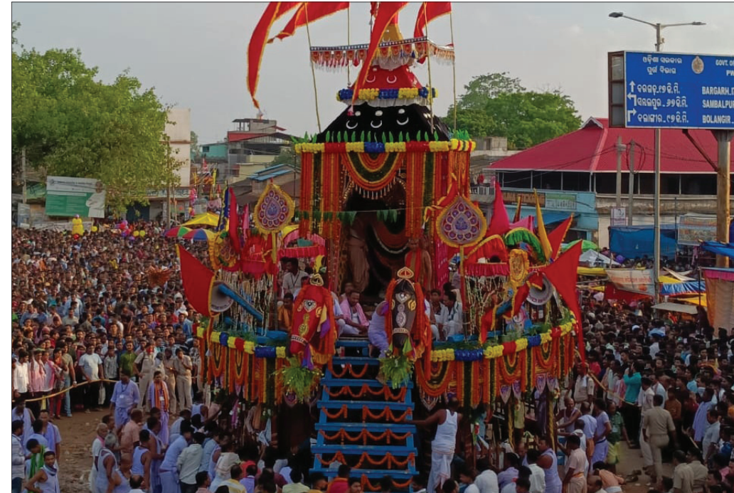
ବରଗଡ଼ ଜିଲ୍ଲା ଭଟଲିରେ ଶ୍ରୀ ଶ୍ରୀ ଦଧିବାମନଙ୍କ ବାହୁଡ଼ା ଯାତ୍ରା ।

ବରଗଡ଼ ଜିଲ୍ଲାର ବିଭିନ୍ନ ସ୍ଥାନରେ ବୁଧବାର ବାହୁଡ଼ା ଯାତ୍ରା ସମ୍ପନ୍ନ ହୋଇଛି। ଭଟଲିର ଶ୍ରୀ ଶ୍ରୀ ଦଧିବାମନ ଧାମରେ ଲକ୍ଷ୍ମୀଙ୍କୁ ଭକ୍ତଙ୍କ ସମାଗନ ହୋଇଥିଲା। ମହାପ୍ରଭୁ ଦଧିବାମନ ଗୁଣ୍ଡିଚା ମନ୍ଦିରକୁ ଆଡ଼ିପ ମଣ୍ଡପ ଛାଡ଼ି ରଥାବହ ହୋଇ ମନ୍ଦିର ଅଭିମୁଖେ ଯାତ୍ରା କରିଥିଲେ। ଏହି ଅବସରରେ ମଙ୍ଗଳବାର ରାତିରେ ଦଧିବାମନଙ୍କୁ ଚାକ୍ ଅତି ପ୍ରିୟ ପୂଜାପାଠା ଲାଗି ହୋଇଥିଲା। ବୁଧବାର ପ୍ରତ୍ୟୁଷକୁ ପ୍ରଭୁଙ୍କ ଦୈନିକ ପୂଜାମାଡ଼ି ହେବା ପରେ ସାହାଣମେଳା ଅନୁଷ୍ଠିତ ହୋଇଥିଲା। ଏହାପରେ ଦଧିବାମନଙ୍କ ବାହୁଡ଼ା ଯାତ୍ରା ପାଇଁ ପହଞ୍ଚି ପୂଜା ହୋଇଥିଲା। ପହଞ୍ଚି ପୂଜା ଏବଂ ମଙ୍ଗଳାର୍ପଣ ଶେଷ ହେବା ପରେ ଭଟଲି ଗୋଣିଆଳ ଦ୍ୱାରା ଛେରାପହରା ହୋଇଥିଲା। ଏହାପରେ ପ୍ରଭୁ ବଡ଼ବାଣକୁ ବିଜେ ହୋଇଥିଲେ। ମନ୍ଦିର ପ୍ରଶାସନ, ଜିଲ୍ଲା ପ୍ରଶାସନ ଓ ପୋଲିସ ପ୍ରଶାସନ ଉପସ୍ଥିତିରେ ଶ୍ରୀ ଶ୍ରୀ ଦଧିବାମନ ପୁରୋହିତଙ୍କ