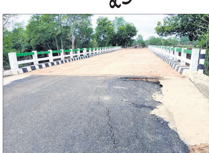
ଦେଇ ଯାଇଥିବା ସେତୁ ସଂଯୋଗ ରାସ୍ତା।

ଲୋକସିଂହା, ୨୮।୬(ସୁଶାନ୍ତ ବାରିକ) ଗ୍ରାମ୍ୟ ଉନ୍ନୟନ ବିଭାଗ ପକ୍ଷରୁ ବଲାଙ୍ଗୀର ଜିଲ୍ଲା ଲୋକସିଂହା ବ୍ଲକ୍ ପନେସରାକୁ କେଉଁଠିପାଲିକୁ ସଂଯୋଗ କରୁଥିବା ଯେଉଁଠା ନାଳରେ ବିକୃତ ସେତୁ ନିର୍ମାଣ ହୋଇଛି।