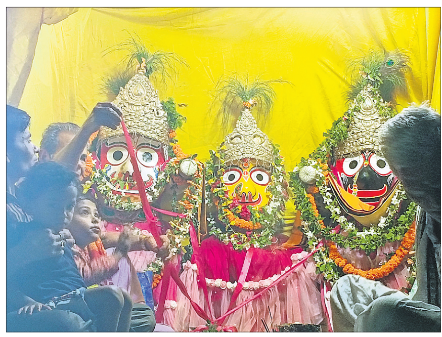
ଲୋକସିଂହାରେ ରଥାଚାରଣ ଶ୍ରୀଜୀଉ ।