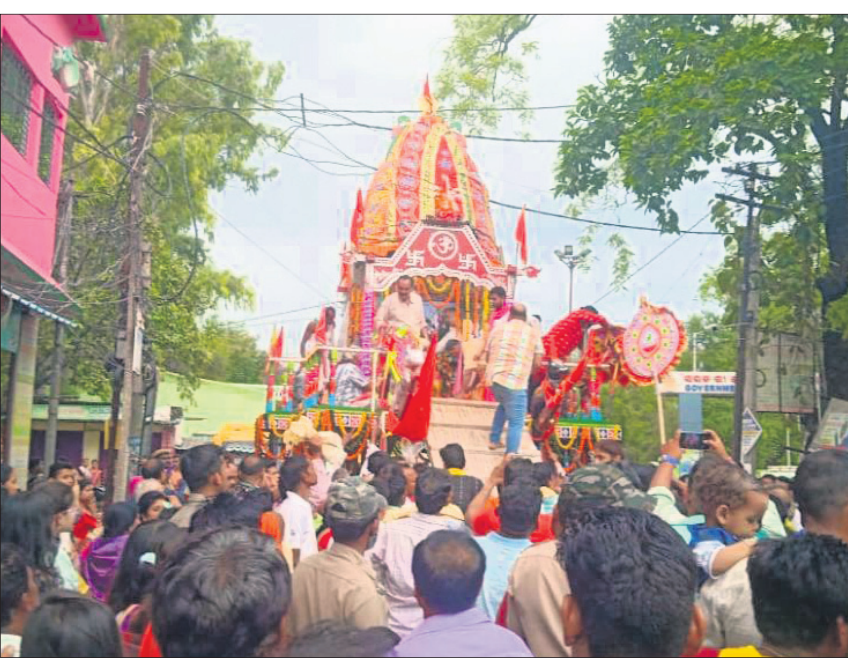
ବଲାଙ୍ଗୀର ବାହୁଡ଼ା ଯାତ୍ରାରେ ଦେବୋତ୍ତର ରଥକୁ ଶ୍ରୀଜୀଉମାନେ ଚାଣ୍ଡିଛନ୍ତି ।