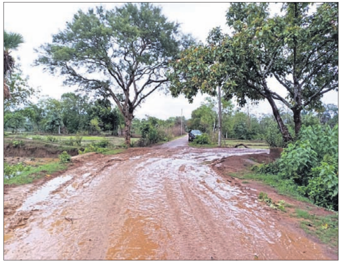
ବର୍ଷା ପରେ ରାସ୍ତା କର୍ଦ୍ଦାଳ ହୋଇଯାଇଛି।

ରାସ୍ତାକାମ ଅସମ୍ପୂର୍ଣ୍ଣ, ଲୋକେ ହଇରାଣ ଲୋକସିଂହା, ୨୮।୬(ସୁଶାନ୍ତ ବାରିକ) ବଲାଙ୍ଗୀର ଜିଲ୍ଲା ଲୋକସିଂହା ବ୍ଲକ୍ ସଦର ମହକୁମାରୁ ୧୦କିମି ଦୂର ଛେଳିବାହାଲ ଗ୍ରାମକୁ ଭଲ ରାସ୍ତା ନାହିଁ।