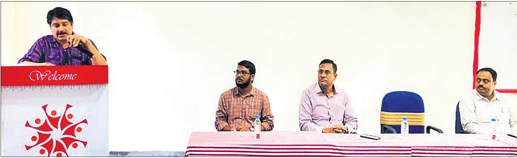
ବିକାଶ ଶିକ୍ଷାନୁଷ୍ଠାନରେ ଜଗନ୍ନାଥ ସଂସ୍କୃତି ଆଲୋଚନାଚକ୍ରରେ ଉପସ୍ଥିତ ଆଲୋଚକଗଣ ।