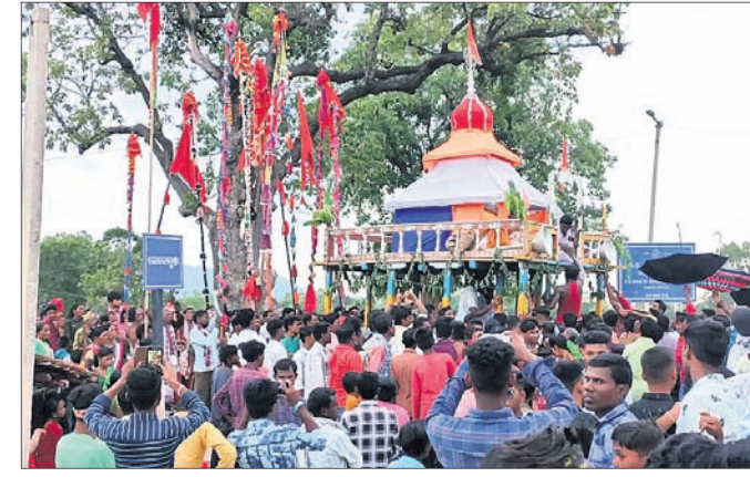
ଦେବଦେବୀଙ୍କ ଲାଠି ସହ ବାହୁଡ଼ା ଯାତ୍ରା ।

ରଥକୁ ଶ୍ରୀଜୀଉମାନେ ଚାଣ୍ଡି ମନ୍ଦିର ଯାଏ ଆଣିଥିଲେ । ପରେ ତିନି ଠାକୁରଙ୍କୁ ମନ୍ଦିର ନିଆଯାଇଥିଲା ।