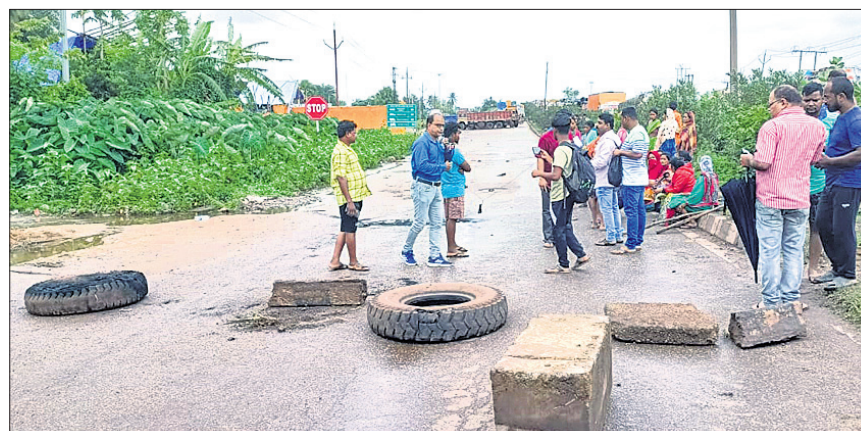
ସ୍ଥାନୀୟ ଲୋକେ ଏକ୍ସ-ବ୍ଲକ୍-୨୦ ଅବରୋଧ କରିଛନ୍ତି।

କେନ୍ଦୁଝର, ୨୮।୬ (ଦୀପକ ମିଶ୍ର/ନବରଶ୍ମି ପଟ୍ଟନାୟକ) ରୋଶିଶା, ତିଳେଇ ତାଳେ ତାଳେ ନାଉଥିଲେ ବରଯାତ୍ରୀ। ଆଉ ମାତ୍ର ୨୦ ମିଟର ଯାଇଥିଲେ କନ୍ୟାଘରେ ପହଞ୍ଚିଥାନ୍ତେ। ଭୋଳି ଆୟୋଜନ ସାରି କନ୍ୟାପକ୍ଷ ଲୋକେ ଅପେକ୍ଷା କରି ରହିଥିଲେ। କିନ୍ତୁ ବିଧିର ବିଧାନ ଥିଲା ଅଲଗା। ଏହା ପୂର୍ବରୁ ଘଟିଥିଲା ଏକ ମର୍ମହୀନ ଦୁର୍ଘଟଣା। ମନ ଖୁସିରେ ନାଉଥିବା ବେଳେ ଯମଦୂତ ସାଜି ଏକ ଟ୍ରକ୍ ବରଯାତ୍ରୀଙ୍କ ଉପରେ ମାଡ଼ିଯାଇଥିଲା। ଘଟଣାସ୍ଥଳରେ ୫ ଜଣଙ୍କ ମୃତ୍ୟୁ ଘଟିଥିବା ବେଳେ ୯ ଜଣ ଗୁରୁତର ହୋଇଛନ୍ତି। ଏଭଳି