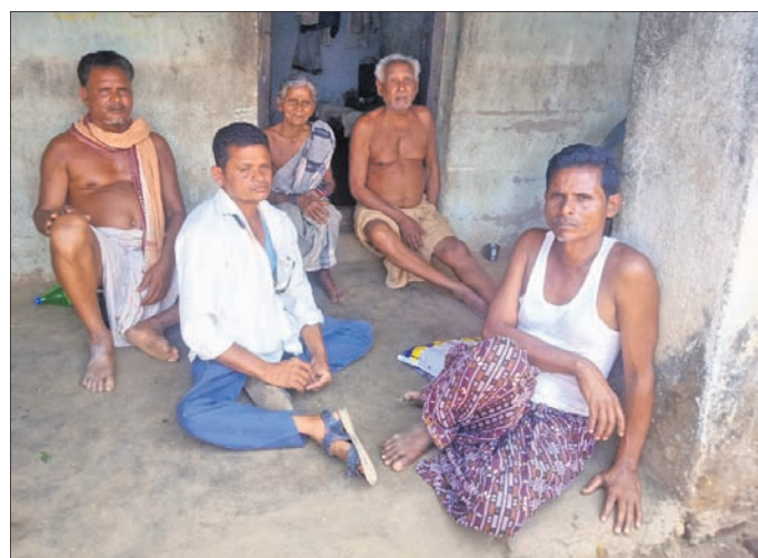
ପରଧିଆପାଲି ଗାଁର ଜଣେ ପରିବାର ଗାଁର ଶେଷ ବିସ୍ଥାପିତ ପରିବାର ଭାବେ ରୁଧିରୀ କରାଯାଇଛି।

ଲୋକସିଂହା ସୁକ୍ଷେପରେ ଘାଣ୍ଟି ପଶିଲା ପରଧିଆପାଲି ଗାଁ ହେଲା ସମ୍ପୂର୍ଣ୍ଣ ବିସ୍ଥାପିତ ଜିଲ୍ଲା ପ୍ରଶାସନକୁ ମିଳିଲା ବଡ଼ ସଫଳତା ଗାଁ ମାଟିକୁ ଶେଷ ପ୍ରଶାମ କଲେ ଗଡ଼ତ୍ୟା ପରିବାର