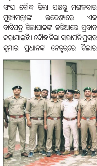
ଜିଲ୍ଲାପାଳଙ୍କ କାର୍ଯ୍ୟାଳୟ ଆଗରେ ବନ କର୍ମଚାରୀ

ଓଡ଼ିଶା ଅଣଗେଜେଟେଡ଼ ବନ କର୍ମଚାରୀ ସଂଘ ବୌଦ୍ଧ ଜିଲ୍ଲା ପକ୍ଷରୁ ମଙ୍ଗଳବାର ମୁଖ୍ୟମନ୍ତ୍ରୀଙ୍କ ଉଦ୍ଦେଶ୍ୟରେ ଏକ ଦାବିପତ୍ର ଜିଲ୍ଲାପାଳଙ୍କୁ ଜରିଆରେ ପ୍ରଦାନ କରାଯାଇଛି ।