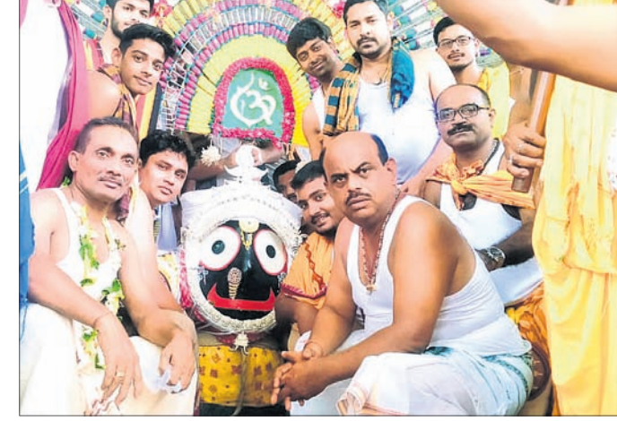
ବୌଦ୍ଧରେ ଠାକୁରଙ୍କୁ ପହଣ୍ଡି କରାଯାଇଛି ।

ଗଡ଼ଜାତ ବୌଦ୍ଧରେ ରୁଧିର ଦିନ ଧୂମଧାମରେ ବାହୁଡ଼ା ଯାତ୍ରା ପାଳିତ ହୋଇଛି । ସକାଳୁ ସାମାନ୍ୟ ବର୍ଷା ହୋଇଥିବା ବେଳେ ଅପରାହ୍ନରେ ପାଗ ପୁରା ଶୁଖିଲା ରହିଥିଲା ।