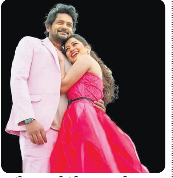
'ପ୍ରିୟେ ତୁ ମୋର ସିଏ' ଫିଲ୍ମରେ ଅମ୍ମାନ-ଏଲିନା