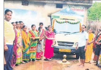
ଖପ୍ରାଖୋଳ, ୨୮।୬(ଅଭୟ ତ୍ରିପାଠୀ)

ସୁକ୍ଷେପ ପ୍ରକଳ୍ପ ଜଳଭଣ୍ଡାରରେ ଜଳସ୍ତର ଲୋକସିଂହା ସୁକ୍ଷେପ ପ୍ରକଳ୍ପ (ଡ୍ୟାମ୍)ରେ ପ୍ରଥମ ବର୍ଷାକଳ ଆସି ପହଞ୍ଚିବା ପରେ ମଙ୍ଗଳବାର ରାତି ସୁଦ୍ଧା ୧୮୧ ଆରବଲ୍ ପର୍ଯ୍ୟନ୍ତ ପାଣି ଭରି ହୋଇଥିଲା।