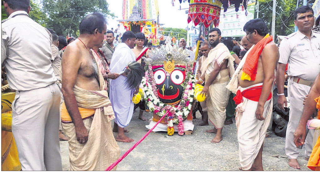
ଦେଢ଼ାମାଳ ବାଲିଚୌକସ୍ଥିତ ଶ୍ରୀଗୁଣ୍ଡିଚା ମନ୍ଦିରରୁ ମହାପ୍ରଭୁ ଶ୍ରୀକରନାଥଙ୍କୁ ପହଞ୍ଚିବେ ରଥାଚାରଣ ପାଇଁ ଅଣାଯାଇଛି ।

ଅନୁଗୋଳ, ୨୮୬(ଅମିତ କୁମାର ସାମଲ) : ବିପ୍ଳବୀ ଯୁବ ସଙ୍ଗଠନ ଅଲ୍ ଇଣ୍ଡିଆ ଡେମୋକ୍ରାଟିକ ୟୁଥ୍ ଅର୍ଗାନାଇଜେସନର ୫୮ତମ ପ୍ରତିଷ୍ଠା ଦିବସ ଯୋଗବାନ ଶିକ୍ଷକପଠାଗୃହ କାର୍ଯ୍ୟାଳୟରେ ପାଳିତ ହୋଇଯାଇଛି ।