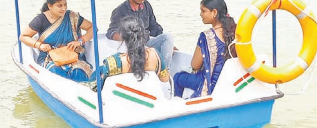
ଉଦ୍‌ଘାଟନ ପରେ ପର୍ଯ୍ୟଟକମାନେ ନୌକାବିହାର କରୁଛନ୍ତି ।