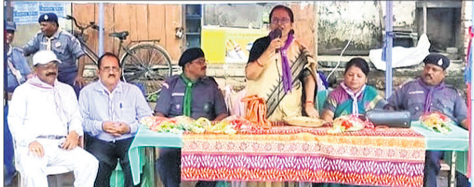
ରେଡ଼କ୍ରସ୍ ପକ୍ଷରୁ ରଥଯାତ୍ରା ସେବା ଶିବିରରେ ମଞ୍ଚାସନ ଅତିଥି ଓ ଅନ୍ୟମାନେ ।