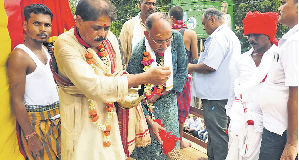
ରଥ ଉପରେ ଛେରାପହଁରା ନୀତି ସମ୍ପନ୍ନ କରାଯାଇଛି ।