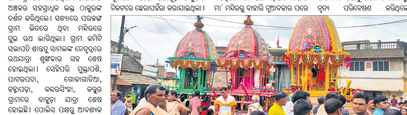
ରଥ ଉପରେ ଠାକୁରଙ୍କୁ ଶ୍ରୀକାଳୀଙ୍କୁ ଦର୍ଶନ କରୁଛନ୍ତି ।