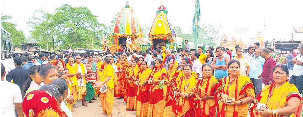
ରଥ ସମ୍ମୁଖରେ ଶ୍ରୀକାଳୀଙ୍କ ସହ ସଂକୀର୍ତ୍ତନ ମଣ୍ଡଳୀ ।

ଗୁରୁଦିନୀଚରଣ ଦେଇ ବଡ଼ବାଣ୍ଡ ରଥ ଖଳାରେ ପହଞ୍ଚିଥିଲା । ଯାତ୍ରାରେ ଭୁବନେଶ୍ୱର ଅଞ୍ଚଳର ଶତାଧିକ ସଂକୀର୍ତ୍ତନ ମଣ୍ଡଳୀ ଓ କର୍ମୀଙ୍କୁ ଉପସ୍ଥାପନ କଲେଜ ପାରମ୍ପରିକ ଘଣ୍ଟବାଦ୍ୟ ସାଙ୍ଗରେ ଭଜନ ଓ ଗୋଟିପୁଅ ନୃତ୍ୟ ପରିବେଷଣ କରିଥିଲେ ।