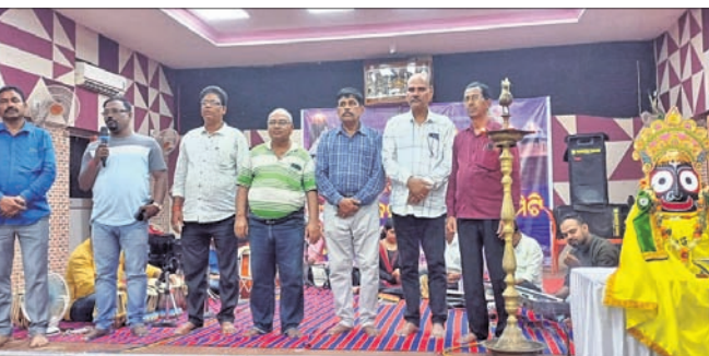
୩୪ତମ ବାହୁଡ଼ାଯାତ୍ରା ଭଜନ ସମାରୋହ ଉଦ୍‌ଘାଟନ ଅବସରରେ ଅତିଥିମାନେ ।

ଦେଢ଼ାମାଳ ସହର ଗୋପବନ୍ଧୁ ଗାଉଁଶଲ ପରିସରରେ ରୁଧିର ରଥ ସନ୍ଧ୍ୟାରେ ୪ଦିନ ଧରି ଆୟୋଜିତ ହେବାକୁ ଥିବା ୩୪ତମ ବାହୁଡ଼ାଯାତ୍ରା ଭଜନ ସମାରୋହ ଉଦ୍‌ଘାଟିତ ହୋଇଯାଇଛି ।