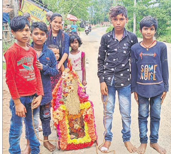
କାଏମା ବନ୍ଦରରେ ଛୋଟ ପିଲାମାନେ ରଥ ଚାଣୁଛନ୍ତି।