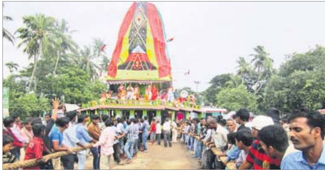
ବ୍ରହ୍ମ ତାଳଧ୍ୱଜ ରଥକୁ ପ୍ରଣାସନ ଓ ଶ୍ରୀକଳେବର ଦକ୍ଷିଣ ମୋଡ଼ କରୁଛନ୍ତି ।

କୂଳସାକ୍ଷେତ୍ରର କ୍ଷେତ୍ରାଧିପତି ଶ୍ରୀକଳେବରଜୀଉଙ୍କ ବାହୁଡ଼ା ଯାତ୍ରା ରଥରେ ଆରମ୍ଭ ହୋଇଛି । ବାହୁଡ଼ା ଦଶମୀରେ ପାରମ୍ପରିକ ରୀତିନୀତି ଅନୁଯାୟୀ ସକାଳ ୬ଟାରେ କଳ୍ପାପୁରସ୍ଥ ବୁଢ଼ିଗା ମନ୍ଦିରରେ ଶ୍ରୀକଳେବର ମଙ୍ଗଳ ଆକୃତି କରାଯାଇଥିଲା । ସକାଳ ସାଢ଼େ ୮ଟାରେ ଗୋପାଳବଳଭ ଧୂପ, ମଧ୍ୟାହ୍ନରେ ଖେଚୁଡ଼ି ଧୂପ ପରେ ସେନାପଟା ଲାଗି କରାଯାଇଥିଲା । ଅପରାହ୍ନ ୨ଟାରେ ଶ୍ରୀକଳେବର ଓ ଜିଲ୍ଲା ପୋଲିସବାହିନୀ ବ୍ରହ୍ମ ତାଳଧ୍ୱଜ ରଥକୁ ଦକ୍ଷିଣମୋଡ଼ ଦେଇଥିଲେ । ସନ୍ଧ୍ୟା ୬ଟାରେ ମନ୍ଦିରର ବାହୁଡ଼ା ଦ୍ୱାର ବାଟ ଦେଇ ଧାଡ଼ି ପହଞ୍ଚିବେ ଶ୍ରୀକଳେବର