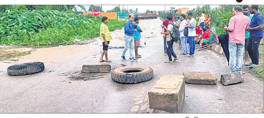
ଦୁର୍ଘଟଣା ଘଟଣାସ୍ଥଳରେ ଟ୍ରକ୍।