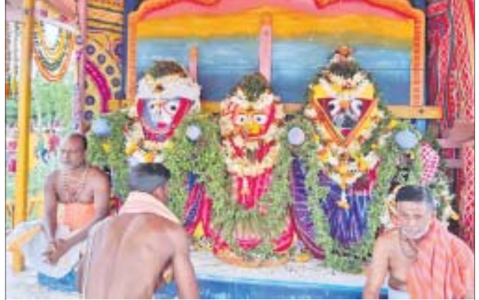
ରଥାରୁ ଚତୁର୍ଦ୍ଧା ମୂର୍ତ୍ତି ।

ବିରିଡି ବ୍ଲକ ଅଞ୍ଚଳରେ ଥିବା ବିରିଡି ଜଗନ୍ନାଥ ମନ୍ଦିରରେ କୁଧିବାର ଶ୍ରୀଜଗନ୍ନାଥଙ୍କ ବାହୁଡ଼ା ଯାତ୍ରା ଅନୁଷ୍ଠିତ ହୋଇଯାଇଛି । ହାଲିପୁରସ୍ଥିତ ମାଲିକା ପ୍ରସିଦ୍ଧ ମହାପୁରୁଷ ପଞ୍ଚସଖାଙ୍କ ସାଧନାର କ୍ଷେତ୍ର ଧାନକୁଦ ପୀଠରେ ଥିବା ଶ୍ରୀଜଗନ୍ନାଥ ମନ୍ଦିରରେ ବାହୁଡ଼ା ଯାତ୍ରା ହୋଇଯାଇଛି । ଏହି ଉପଲକ୍ଷେ ପ୍ରଭାତରୁ ଦ୍ୱାରପିଟା, ମଙ୍ଗଳଆଳତି, ମଇଳାମ, ଚତୁପଲାଗି, ରୋଷ ହୋମ, ଅବକାଶ, ପୂର୍ଣ୍ଣମୁକ୍ତା, ଦ୍ୱାରପାଳ ପୂଜା, ସକାଳ ଧୂପ, ସେନାପଟା ଲାଗି, ମଙ୍ଗଳାର୍ପଣ, ଗହିଆ ବିଜେ, ପହଣ୍ଡି, ମଦନମୋହନ ବିଜେ, ମନ୍ଦିର