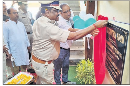
ସିସିଟିଭି ବ୍ୟବସ୍ଥାକୁ ଜିଲାପାଳ ଓ ଏସ୍ପି ମିଳିତଭାବେ ଉଦ୍‌ଘାଟନ କରୁଛନ୍ତି ।