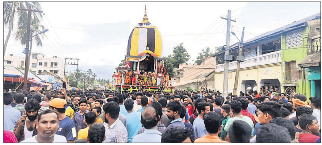
ଶ୍ରୀଜୀଉମାନେ ରଥକୁ ଚାଣିଛନ୍ତି ।