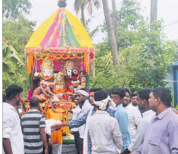
ନରସିଂହପୁର ଛକଠାରେ ଶ୍ରଦ୍ଧାଳୁ ରଥକୁ ଚାଣିନେଉଛନ୍ତି।