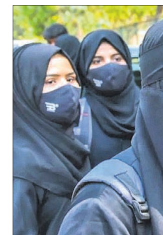
କନ୍ଧର ହିଜାବ ପିନ୍ଧିବାକୁ ଅନୁମତି ଦିଆ ନ ଯିବା ନେଇ ସେମାନେ ତିରାସକ୍ତ କରିଛନ୍ତି। କାହା ହାତ ଥିବା ସ୍ତବ୍ଧ ଲବ୍ଧକେ