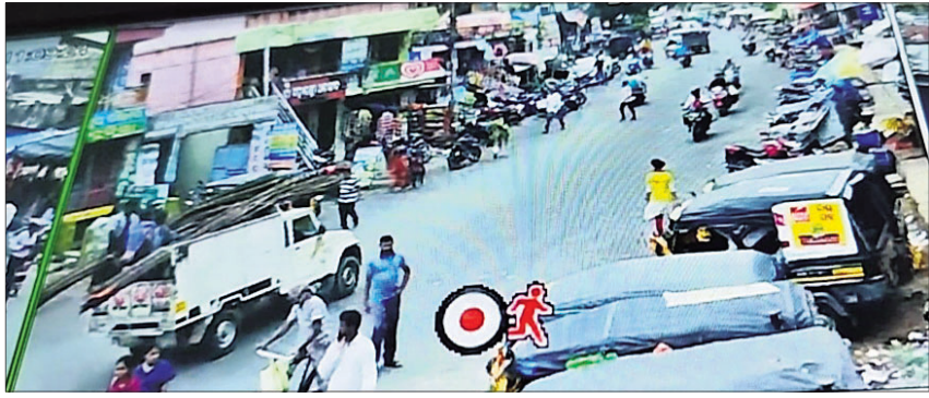
ସିସିଟିଭିରେ ସହରର ଦୃଶ୍ୟ ।

ନୟାଗଡ଼, ୨୮।୬ (ଲୋକନାଥ ମିଶ୍ର) ନୟାଗଡ଼ ସହରକୁ ରୁଧିରା ଠାରୁ କିଛି ଦୂରରେ ସିସିଟିଭି ଏକାଧାରରେ ନୟାଗଡ଼ ଏସ୍ପିଏଓଙ୍କ କାର୍ଯ୍ୟାଳୟରେ ସିସିଟିଭି କ୍ୟାମେରା ଓ ପୋଲିସ୍ ଅଧିକାରୀଙ୍କ ଦ୍ୱାରା ଉଦ୍‌ଘାଟନ କରାଯାଇଛି । ଏହାକୁ ଜିଲାପାଳ ରବୀନ୍ଦ୍ର ନାଥ ସାହୁ ଓ ଏସ୍ପି ଅଲୋକ ଚନ୍ଦ୍ର ପରି ମିଳିତ ଭାବେ ଉଦ୍‌ଘାଟନ