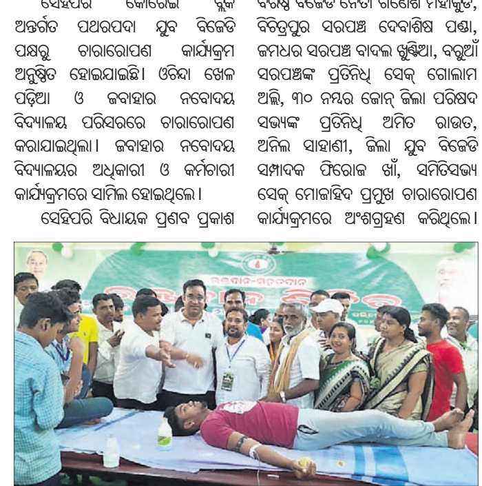
ରଗଡ଼ି ପଲିଟେକନିକରେ ଅନୁଷ୍ଠିତ ରକ୍ତଦାନ ଶିବିର।

ମାନବ ସମ୍ବଳ ଅଭାବରେ ସରକାରଙ୍କ ବିଭିନ୍ନ ଅନୁଦାନକୁ ଖର୍ଚ୍ଚ କରିବା, ରେକିଷ୍ଟରଗୁଡ଼ିକୁ ପ୍ରୟା ସଫ୍ଟ କରିବାରେ ଅନଳାଭନ କରିବା, ଏମ୍ବ୍ଲିଏନ୍‌ଆରୁଲିଭିଏ କାର୍ଯ୍ୟକୁ ଅନଳାଭନ କରିବା, ବିଭିନ୍ନ ଭରଣନିମ୍ନକ କାର୍ଯ୍ୟକୁ ଜିଠି ଫାଟା ଉତ୍ତୋଳନ ଭଳି କାର୍ଯ୍ୟକୁ କମ୍ପ୍ୟୁଟରରେ କରିବାକୁ ପଡୁଛି। ମାତ୍ର ଦୁର୍ବଳ ଭିତ୍ତିଭୂମି ଯୋଗୁ ଏସବୁ କାର୍ଯ୍ୟ ବିଳମ୍ବିତ ହେଉଛି। ପିଇଓ ଏବଂ ଜିଆର୍‌ଏସ୍‌ଏ ମଧ୍ୟ ଅଧିକାଂଶକ କମ୍ପ୍ୟୁଟର ଖାତ ଅଭାବକୁ ଅନଳାଭନ କାର୍ଯ୍ୟରେ ବାଧା ଉଠୁଛି। ଏଭଳି ଦୁର୍ବଳ ଭିତ୍ତିଭୂମି ଉପରେ ପଞ୍ଚାୟତର ସର୍ବାଙ୍ଗୀନ ବିକାଶ ଆଶା ଏବେ ସୁଧାବାସ୍ତବ ରୂପରେ ନେଇ ପାରିନାହିଁ। ବ୍ଲକରେ ୨୮ ଯନ୍ତ୍ରୀ, ପିଇଓ ଏବଂ ଜିଆର୍‌ଏସ୍‌ଏ ଆବଶ୍ୟକତା ଥିବାବେଳେ ବାସ୍ତବରେ ୫ ଯନ୍ତ୍ରୀ, ୧୮ ପିଇଓ, ୨୦ ଜିଆର୍‌ଏସ୍‌ଏ ଅଛନ୍ତି। ପଞ୍ଚାୟତରୁ ଜଣେ ଲେଖାଏଁ ତା'ର ଏଣ୍ଟି ଅପରେଟର ନିଯୁକ୍ତି ପାଇଁ ଘୋଷଣା କାର୍ଯ୍ୟକାରୀ ହୋଇ ପାରିନାହିଁ। ଏଭଳି ଘଣ୍ଟା ବିକାଶର ପ୍ରୟାସକୁ ପ୍ରାଧାନ୍ୟ ଦିଆଯିବ ବୋଲି କୁହାଯାଉଛି। ବ୍ଲକରେ ଏହି ଲକ୍ଷ୍ୟ ହାସଲ ଏକ ପ୍ରକାର କଷ୍ଟସାଧ୍ୟ ବ୍ୟାପାର ବୋଲି ମନେହେଉଛି। ତା'ର ମୂଳକାରଣ ହେଉଛି ମାନବ ସମ୍ବଳର ଅଭାବ। ପ୍ରତ୍ୟେକ ପଞ୍ଚାୟତକୁ ଜଣେ ଲେଖାଏଁ କମିଷ୍ନି ସମ୍ପ୍ରା, ପଞ୍ଚାୟତ ମଙ୍ଗଳ ସାଧନ ହୋଇପାରିବ। ସମାଜକୁ ଶୁଖିଳିତ ଓ ସହଜ କାନ୍ଦନୀୟ କରିବାରେ ସହାୟକ ହେବ। ଏଭଳି ଘଟିପାରିଲେ ତା'କୁ ହିଁ ଘଣ୍ଟା ବିକାଶ ବୋଲି କୁହାଯାଇ ପାରିବ। ବିଶ୍ୱରେ ଘଣ୍ଟା ବିକାଶ ହାସଲ ପାଇଁ ୧୨ଟି ଲକ୍ଷ୍ୟକୁ ଭେଦ କରିବାକୁ ପଡ଼ିବ। ଏହି ୧୨ ଲକ୍ଷ୍ୟକୁ ଓଡ଼ିଶାରେ ୯ଟି ଧୂମରେ ବିଭକ୍ତ କରାଯାଇଛି। ଉକ୍ତ ଧୂମଗୁଡ଼ିକୁ କାର୍ଯ୍ୟକାରୀ କରିବା ସହ ଏ ଦିଗରେ ଘଣ୍ଟା ବିକାଶର ପ୍ରୟାସକୁ ପ୍ରାଧାନ୍ୟ ଦିଆଯିବ ବୋଲି କୁହାଯାଉଛି। ବ୍ଲକରେ ଏହି ଲକ୍ଷ୍ୟ ହାସଲ ଏକ ପ୍ରକାର କଷ୍ଟସାଧ୍ୟ ବ୍ୟାପାର ବୋଲି ମନେହେଉଛି। ତା'ର ମୂଳକାରଣ ହେଉଛି ମାନବ ସମ୍ବଳର ଅଭାବ।