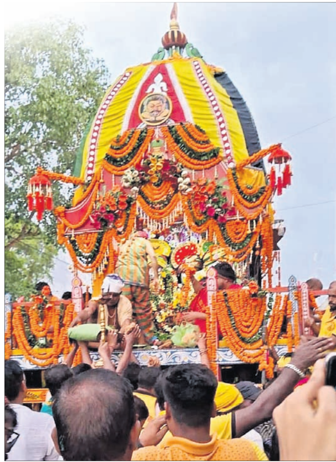
ଧର୍ମଶାଳା ମାଉସୀ ମା' ମନ୍ଦିରରୁ ଭାଲୁଖାଇସ୍ଥିତ ମନ୍ଦିରକୁ ଫେରୁଛନ୍ତି ୩ ଠାକୁର।