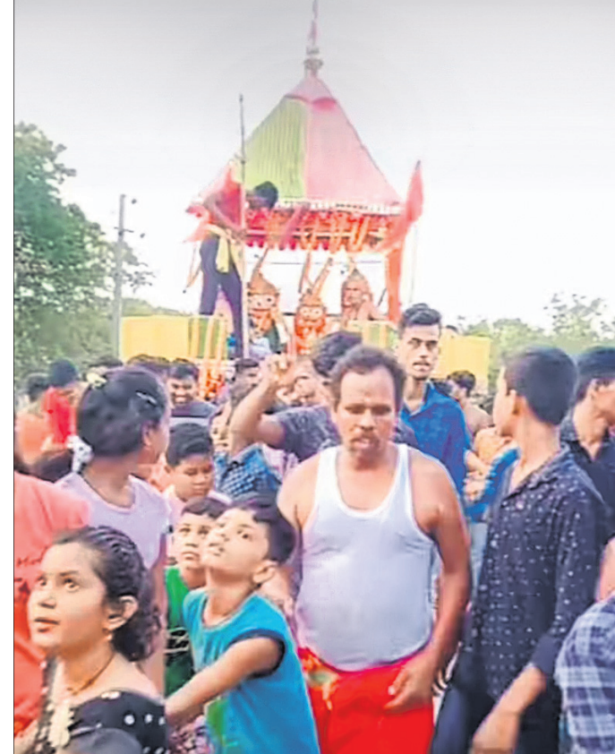
ପାଣିକୋଇଲି ଅଞ୍ଚଳରେ ଶ୍ରଦ୍ଧାଳୁ ରଥ ଚାଣୁଛନ୍ତି।

ସେହିପରି ବ୍ଲକ ଅନ୍ତର୍ଗତ ଭରଣପ୍ରତାପ ପଞ୍ଚାୟତର ନରସିଂହପୁର ଛକଠାରେ ବାହୁଡ଼ା ଯାତ୍ରା ଅନୁଷ୍ଠିତ ହୋଇଛି। ଜଗନ୍ନାଥ ମନ୍ଦିର କମିଟି ଓ ସ୍ଥାନୀୟ ସେବାୟତଙ୍କ ମିଳିତ ସହଯୋଗରେ ଗୁଣ୍ଡିଚାରେ ସମସ୍ତ ପୂଜା କାର୍ଯ୍ୟ ନୀତିନୀତି କରାଯାଇ ନରସିଂହପୁର ମଠ ମାଉସୀ ମା' ମନ୍ଦିରରେ ପହଞ୍ଚିଥିଲେ ଠାକୁର। ବୁଧବାର ଅପରାହ୍ଣ ୪ଟାରେ ଶ୍ରୀଜୀଉମାନଙ୍କୁ ପୂଜାର୍ଚ୍ଚନା କରି ହରିବୋଲ, ବୁଦ୍ଧଭୂଜି ଓ ଘଣ୍ଟଘଣ୍ଟା ତାଳେ ପହଞ୍ଚି କରାଯାଇଥିଲା। ଶାନ୍ତି ଶୁଖିଳା ସହ ରଥ ଚଣା ଶେଷ ହୋଇଥିଲା। ଆଖପାଖ ଅଞ୍ଚଳରୁ ଶହଶହ ଲୋକଙ୍କ ସମାଗମ ହେଇଥିଲା।