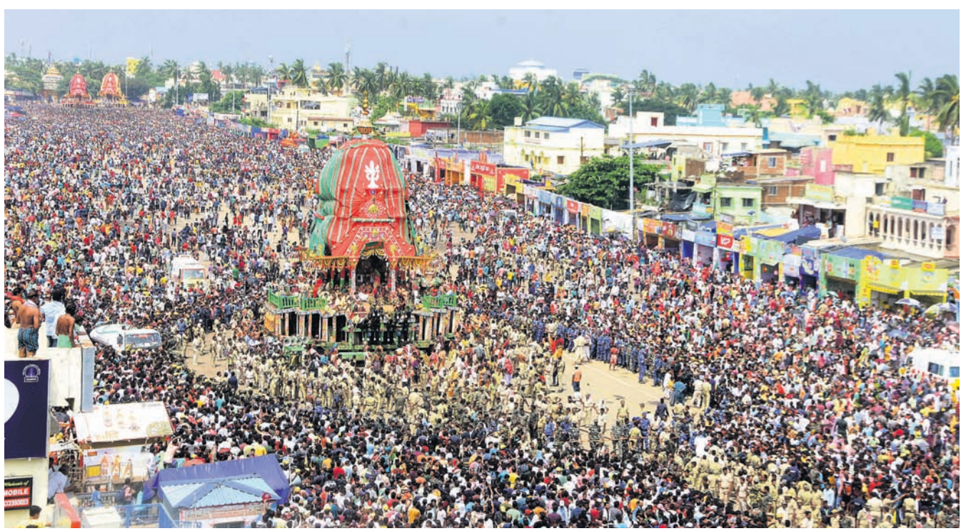
ବାହୁଡ଼ାଯାତ୍ରା ଅବସରରେ ବୁଧବାର ଶ୍ରୀକଳ୍ପନାରେ ଗୁରୁତ୍ରା ମନ୍ଦିରରୁ ୩ ରଥକୁ ଶ୍ରୀମନ୍ଦିର ସିଂହଦ୍ୱାର ଅଭିମୁଖେ ଚାଣିନେଇଛନ୍ତି।