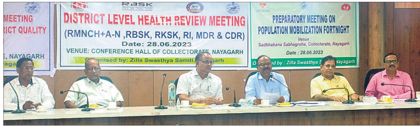
ପିସିଏନଡିଟି ପରାମର୍ଶ ସମିତି ବୈଠକରେ ଯୋଗଦେଇଥିବା ବିଭାଗୀୟ ଅଧିକାରୀ ।