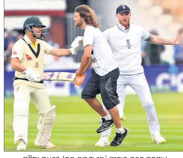
ଓଡ଼ିଆ ମଧ୍ୟରେ 'ଜଷ୍ଟ୍ ଷ୍ଟ୍ ଅଫ୍' ସଂଗ୍ରହ କରେ ସଦସ୍ୟ ।

ଲଣ୍ଡନ, ୨୮ତା ଲଣ୍ଡନରେ ଅନୁଷ୍ଠିତ ବିତୀୟ ଆଶେଷ୍ ଟେଷ୍ଟରେ ଓଡ଼ିଆ ଓଷ୍ଟିଏନ୍‌ସ୍ ଓଷ୍ଟିଏନ୍‌ସ୍ ଅର୍ଦ୍ଧଶତକ ବଳରେ ଅଷ୍ଟ୍ରେଲିଆ ଦଳରୁ ଛିଡ଼ା ହେଇଥିବା ବେଳେ ପ୍ରଥମ ଦିନର ଖବର ପ୍ରଭୁତ ହୁଇ ଅଷ୍ଟ୍ରେଲିଆ ଗା ଉଲ୍‌କେଟ୍ ହରାଇ ୨୩୦ ରନ୍ ସଂଗ୍ରହ କରିଛି । ଲଣ୍ଡନର ଯାହୁଆ ପିନ୍‌ରେ ଲଂଲଣ୍ଡ ଟେଷ୍ଟ ବୋଲି ନିଷ୍ପତ୍ତି ନେଇଥିଲା । ବଲ୍ ହୁଇ ହେଉଥିବା ବେଳେ ଗୋଟିଏ ପଦକ ଉପମାନ ଖୁଲ୍ ଡିଫେଣ୍ଡ କରୁଥିବା ବେଳେ ଓଷ୍ଟିଏନ୍‌ସ୍ ଲଣ୍ଡନର କାଉଣ୍ଟର ଆଟାକ୍ କରିଥିଲେ । ଖୁଲ୍ ୬୦ ବଲ୍ ଖେଳି ୧୭ ରନ୍ କରିଥିବା ବେଳେ ଓଷ୍ଟିଏନ୍‌ସ୍ ୮୮ ବଲ୍‌ରୁ ୬୬ ରନ୍ କରିଥିଲେ । ୨୪ତମ ଓଭରରେ ପଦାର୍ପଣକାରୀ ଗୋସ୍ ଟେଷ୍ଟ ବଳରେ ବୋଲ୍ ହୋଇଥିଲେ ଖୁଲ୍ । ଆଉଟ୍ ହେବା ପୂର୍ବରୁ ପ୍ରଥମ