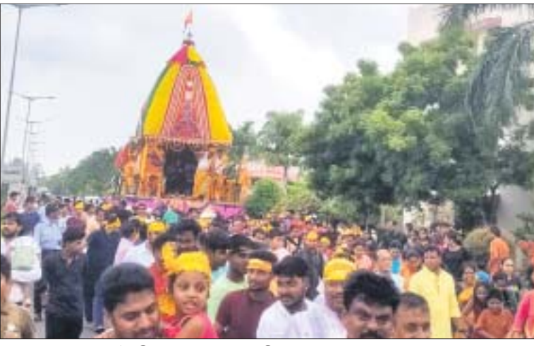
ପାରାଦୀପ ତିନି ବିଶୋଧନାଗାର ବାଉଁଶପଥରେ ରଥାରୁ ଠାକୁରଙ୍କ ବାହୁଡ଼ା ଯାତ୍ରା ।