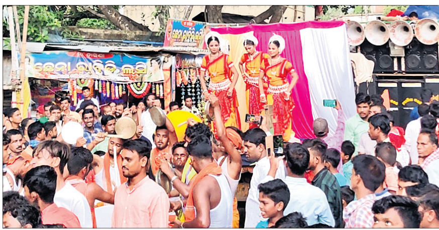
ନୂତ୍ୟାଙ୍ଗନାମାନେ ଚତୁର୍ଦ୍ଦାମୂର୍ତ୍ତିଙ୍କ ସମ୍ମୁଖରେ ଓଡ଼ିଶା ନୃତ୍ୟ ପରିବେଷଣ କରୁଛନ୍ତି।