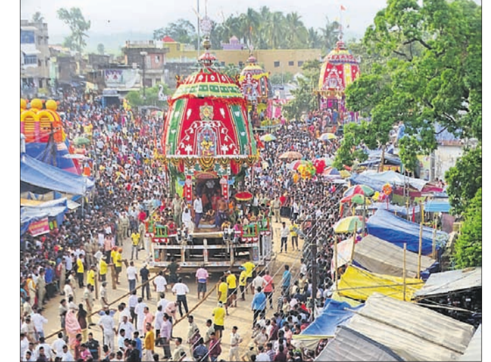
ତାଳଧ୍ୱଜ ରଥକୁ ଶ୍ରୀଜୀଉମାନେ ଚାଣି ନେଉଛନ୍ତି ।

ରୁଧିରା ବାହୁଡ଼ା ଯାତ୍ରା ଅବସରରେ ଶ୍ରୀଜୀଉ ଜଗନ୍ନେଦୀଙ୍କୁ ରତ୍ନବେଦୀ ଅଭିମୁଖେ ଯାତ୍ରା ଆରମ୍ଭ କରିଛନ୍ତି । ତାଳଧ୍ୱଜ ରଥ ସିଂହଦ୍ୱାରରେ ପହଞ୍ଚି ଥିଲା ବେଳେ ମହିଳାମାନେ ମା' ସୁଭଦ୍ରାଙ୍କ ଦର୍ପଦଳନ ରଥକୁ ଚାଣି ସିଂହଦ୍ୱାର ଅଭିମୁଖେ ଯାଉଥିଲେ । ହେଲେ ରାତି ହୋଇଯିବାରୁ ରଥ ଚଣା ବନ୍ଦ ହୋଇଥିଲା । ଫଳରେ ମା' ସୁଭଦ୍ରାଙ୍କ ରଥ ଅଧାବାଟରେ ଅଟକି ରହିଛି । ଗୁରୁବାର ପୁଣି ସୁଭଦ୍ରାଙ୍କ ରଥକୁ ମହିଳାମାନେ ଚାଣିବେ । ହେଲେ ଶ୍ରୀଜଗନ୍ନାଥଙ୍କ ନନ୍ଦିଘୋଷ ରଥ ଚଣା ଆରମ୍ଭ ହୋଇ ପାରି ନ ଥିଲା । ଗୁରୁବାର ଉଭୟ ରଥକୁ ସିଂହଦ୍ୱାର ସମ୍ମୁଖରେ ପହଞ୍ଚାଇବା ପାଇଁ ପ୍ରସ୍ତୁତି ଆରମ୍ଭ ହୋଇଛି । ବାଟରେ ଲକ୍ଷ୍ମୀ ନାରାୟଣ ଭେଟ ହେବ । ଶୁକ୍ରବାର ରତ୍ନବେଦୀ ସମ୍ମୁଖରେ ପହଞ୍ଚିବେ । ଗୁରୁବାର ବାହୁଡ଼ା ଯାତ୍ରାରେ ଲକ୍ଷ୍ମୀଙ୍କ ଭକ୍ତଙ୍କ ସମାଗମ ହେଇଥିଲା । ଗୁରୁବାର