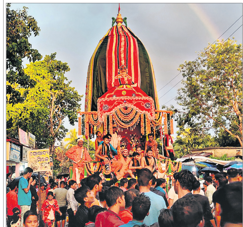
ବ୍ରହ୍ମବରଦା ହାଟ ନିକଟରେ ଥିବା ଦୁର୍ଗାମଣ୍ଡପରୁ ରଥଟଣା ହେଉଛି।