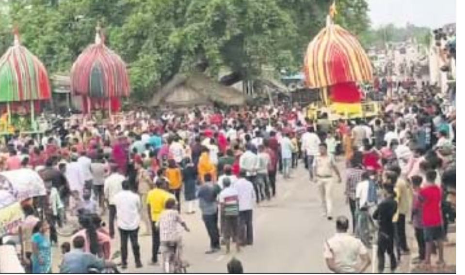
ବଡ଼ ଗୁମୁରା ମାଉସୀ ମା' ମନ୍ଦିରରୁ ୩ ରଥକୁ ଛତିଆ ଅଭିମୁଖେ ନିଆଯାଇଛି ।