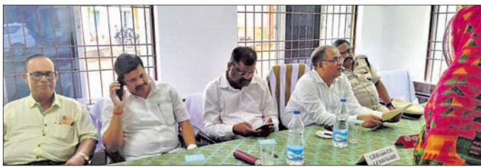
ଜନଶୁଣାଣି ଶିବିରରେ ଜିଲାପାଳ ଓ ପ୍ରଶାସନିକ ଅଧିକାରୀମାନେ ।