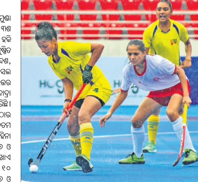
ଉତ୍ତର ପ୍ରଦେଶ ଏବଂ ଦାଦ୍ରା ଓ ନଗର ହାବେଲି ମଧ୍ୟରେ ଅନୁଷ୍ଠିତ ମ୍ୟାଚ ।

ଭୁବନେଶ୍ୱର, ୨୮।୬ (ତପନ ସାଲ୍) ଉତ୍ତରାଞ୍ଚଳ ୩୦୬/୬ ଉତ୍ତର ପ୍ରଦେଶ, ଛତିଶଗଡ଼, ଦିଲ୍ଲୀ ବିଜୟୀ ହୋଇଛି । ଉତ୍ତରାଞ୍ଚଳ ୩୦୬/୬ ଉତ୍ତର ପ୍ରଦେଶ, ଛତିଶଗଡ଼, ଦିଲ୍ଲୀ ବିଜୟୀ ହୋଇଛି ।