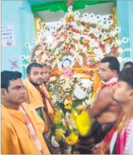
କେନ୍ଦ୍ରାପଡ଼ା ଜଗନ୍ନାଥପୁରୀ ମାଉସୀ ମା' ଘରୁ ଶ୍ରୀକଳେବରଜୀଉ, ଦେବୀ ସୁଭଦ୍ରା, ଶ୍ରୀଜଗନ୍ନାଥଜୀଉଙ୍କୁ ସେବାୟତମାନେ ପହଞ୍ଚିବେ ରଥକୁ ନେଉଛନ୍ତି ।