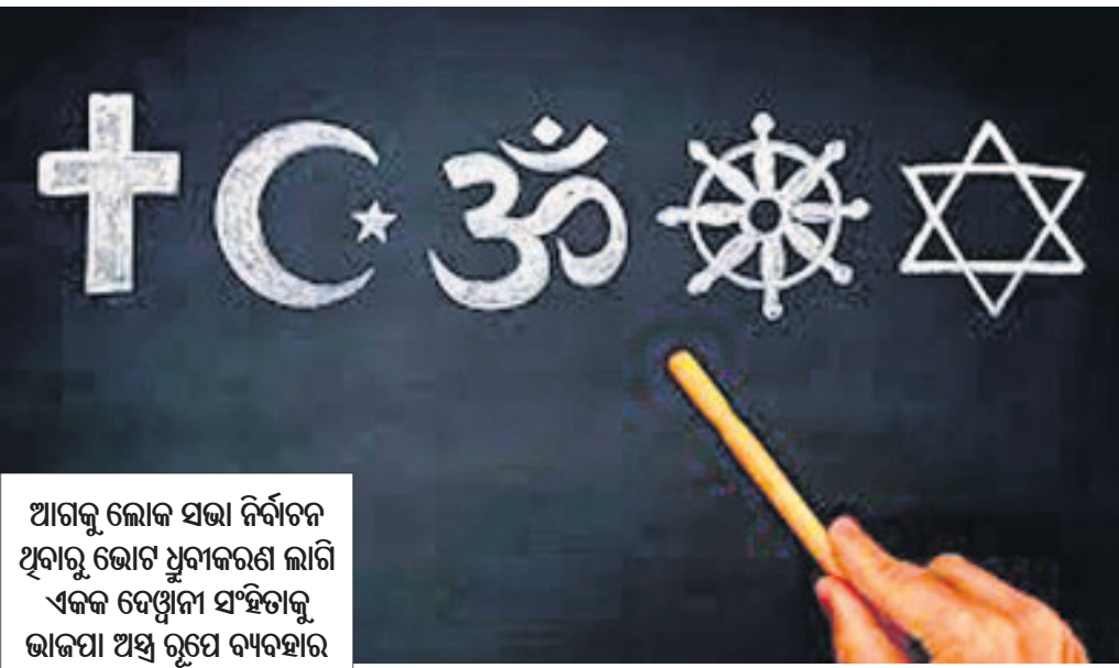
ଆଗକୁ ଲୋକ ସଭା ନିର୍ବାଚନ ଥିବାରୁ ଭୋଟ ଧୁବାକରଣ ଲାଗି ଏକ ଦେଖାଣି ସଂହିତାକୁ ଭାଙ୍ଗି ଯାଏଁ ରୂପେ ବ୍ୟବହାର କରୁଛି ବୋଲି ବିରୋଧୀ ଦଳଗୁଡ଼ିକ ଟାଣିବା କରିଛନ୍ତି।