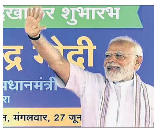
ଗୋଟିଏ ପରିବାରରେ ଯେପରି ଭିନ୍ନ ଭିନ୍ନ ନିୟମ ଚାଲେନାହିଁ ସେହିପରି ଦେଶରେ ମଧ୍ୟ ୨ଟି ଆଇନ ଚାଲିପାରିବ ନାହିଁ। ମୁସଲମାନଙ୍କୁ ବୁଝିବାକୁ ପଡ଼ିବ ଯେ, ସେମାନଙ୍କୁ କେଉଁ ରାଜନୈତିକ ଦଳ ଉତ୍ତମାଦେଶ୍ୟ ଓ ନିଜ ସ୍ୱାର୍ଥ ପାଇଁ ଧ୍ୟାନ କରୁଛି। ସମ୍ଭାଷଣରେ ସମସ୍ତ ନାଗରିକଙ୍କ ପାଇଁ ସମାନ ଆଧାର ସମ୍ପର୍କରେ ଉଦ୍ଦେଶ୍ୟ କରାଯାଇଛି। ସୁପ୍ରିମକୋର୍ଟ ମଧ୍ୟ ଏକ ସମାନ ନାଗରିକ ସଂହିତା ପ୍ରଣୟନ ଲାଗି ପରାମର୍ଶ ଦେଇଛନ୍ତି।