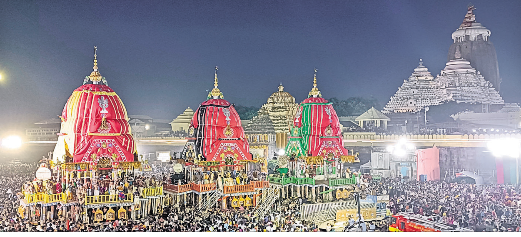
ଜନ୍ମଦିନ ବାହୁଡ଼ା ପରେ ଶ୍ରୀମନ୍ଦିର ସିଂହଦ୍ୱାର ସମ୍ମୁଖରେ ପହଞ୍ଚିଥିବା ୩ ରଥ।