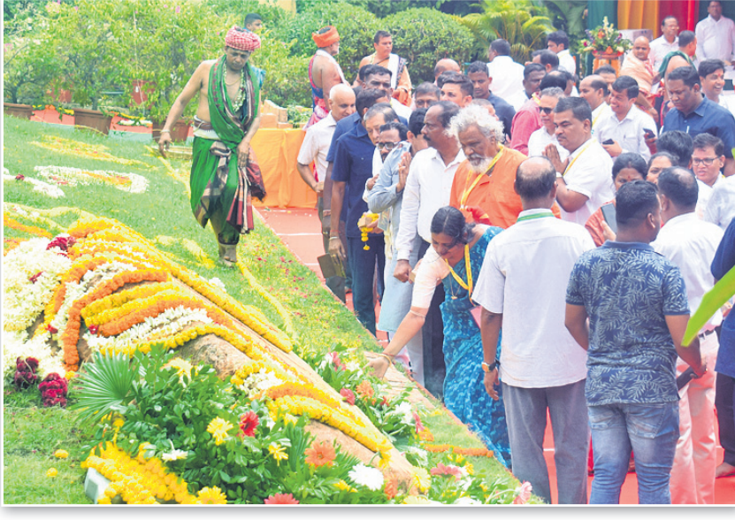
‘ଏକାମ୍ର ପ୍ରକଳ୍ପ’ ଶିଳାନ୍ୟାସ ସ୍ଥଳରେ ମୁଖ୍ୟ ଶାସନ ସଚିବ ପ୍ରଦୀପ ଜେନାଙ୍କ ସମେତ ନେତା, ମନ୍ତ୍ରୀ, ଅଧିକାରୀ ଓ ଅନ୍ୟମାନେ ।