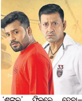
'ଶକର' ଫିଲ୍ମରେ ଦେବା-ସିଦ୍ଧାନ୍ତ

ଭାଇ-ଭାଇ ଭିତରେ ସମ୍ପର୍କ ଅତି ନିବଡ଼। ହେଲେ ପରିସ୍ଥିତିରେ ପଡ଼ି ଏହି ସମ୍ପର୍କ ଭିନ୍ନ ରୂପ ନେଇଥାଏ। ତେବେ ନିଜ କର୍ତ୍ତବ୍ୟକୁ ଓହରି ଯାଉନି ବଡ଼ ଭାଇ। ଆକ୍ରମ, ରୋମାଞ୍ଚିକ ଓ ସଂସ୍କୃତି ଭରା ଏକ ଭଲ ଧରଣର କାହାଣୀକୁ ନେଇ ନିର୍ମିତ ହୋଇଛି ଓଡ଼ିଆ ସିନେମା 'ଶକର : ଦ ତ୍ରେଷ୍ଣୟର'। ଖାସ୍ତା କଥା ହେଲା ଏହି ଫିଲ୍ମଟି ଖୁବ୍ ଶୀଘ୍ର ରିଲିଜ ହେବ ବୋଲି ପ୍ରଯୋଜନା ସଂସ୍ଥା ପକ୍ଷରୁ ସୂଚନା ନିଶାକୁ ଜୀବନର ସର୍ବସ୍ୱ ଭାବି ଚାଲୁଥିବା ବେଳେ ଦେଖାହୁଏ ଦିବ୍ୟା ସହିତ। ତୁହେଁ ହୁଏଁକୁ ଭଲ ପାଇଁ ବସନ୍ତି। ବଦଳିଯାଏ ନିଶାକୁ ଜୀବନର ସର୍ବସ୍ୱ ଭାବି ଚାଲୁଥିବା ବେଳେ ଦେଖାହୁଏ ଦିବ୍ୟା ସହିତ। ତୁହେଁ ହୁଏଁକୁ ଭଲ ପାଇଁ ବସନ୍ତି। ବଦଳିଯାଏ