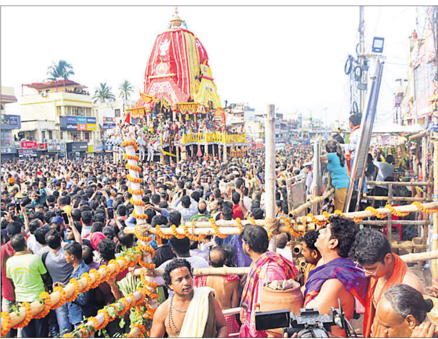
ମାଉସୀ ମା' ମନ୍ଦିର ନିକଟରେ ମହାପ୍ରଭୁଙ୍କୁ ପୋଡ଼ିପିଠା ଲାଗି କରିବାକୁ ଅପେକ୍ଷାରତ ସେବାୟତ।