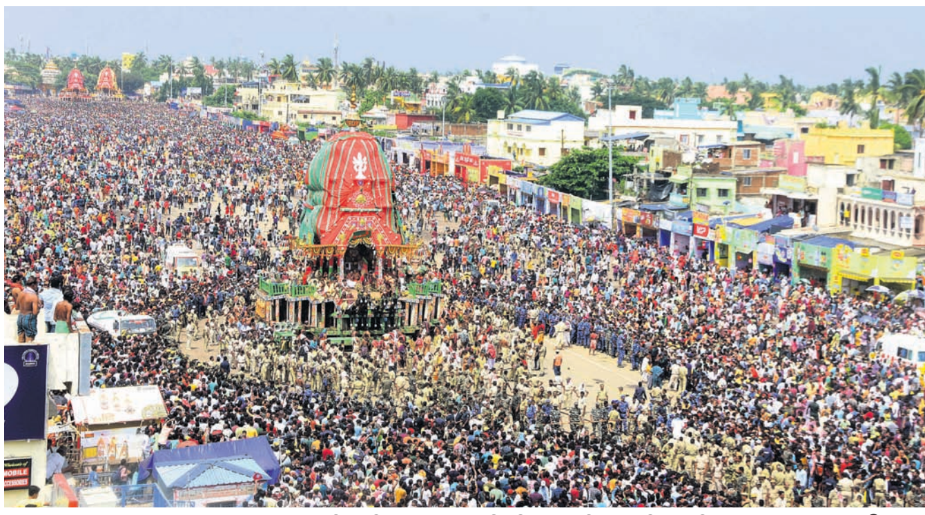
ବାହୁଡ଼ାଯାତ୍ରା ଅବସରରେ ରୁଧିରା ଶ୍ରୀମନ୍ଦିରରୁ ୩ ରଥକୁ ଶ୍ରୀମନ୍ଦିର ସିଂହଦ୍ୱାର ଅଭିମୁଖେ ଚାଣିନେଇଛି ।