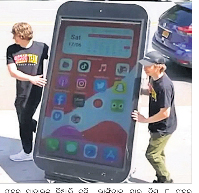
୬ ଫୁର୍ ମାଟ୍ରର ଦିଅୁ କରି ଭାଙ୍ଗିବାକୁ ଯାଇ ବିମ୍ ୮ ଫୁର୍ ର ଚର୍ଚ୍ଚା କରିଥିଲେ । ପୂର୍ବ ଚର୍ଚ୍ଚାକୁ ଫୋନ୍ ଦିଅୁ କରିଥିବା କହିଛନ୍ତି ।