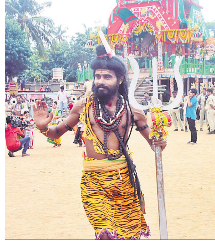
ଶରଧାବାଲିରେ ଥିବା ରଥ ସମ୍ମୁଖରେ ଶିବ ବେଶଧାରୀ ଭକ୍ତ ନୃତ୍ୟ ପରିବେଷଣ କରୁଛନ୍ତି।