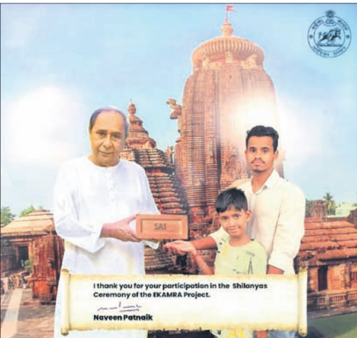
ସେଲ୍ଫି ରୂପରେ ମୁଖ୍ୟମନ୍ତ୍ରୀଙ୍କ ସହ ଫଟୋ ।

ଆୟୋଜକଙ୍କ ପକ୍ଷରୁ ବିଏମ୍ପି ମାର୍କେଟ କମ୍ପ୍ଲେକ୍ସରେ ଏକ ମ୍ୟାଜିକାଲ ଫଟୋ ଡ୍ରିପ୍ ଆୟୋଜନ କରାଯାଇଥିଲା । ସେଠାରେ ଲୋକମାନେ ମାଗଣାରେ ନିଜ ଫଟୋ ଉଠାଇଥିଲେ । ତେବେ ଏକୃତ୍ୟା ଫଟୋ ଉଠାଇଥିଲେ ମଧ୍ୟ ଫଟୋ ବାହାରିବା ବେଳକୁ ମୁଖ୍ୟମନ୍ତ୍ରୀଙ୍କ ସହ ଥିବା ଦେଖି ସମସ୍ତେ ଖୁସି ଅନୁଭବ କରୁଥିଲେ । ଏଥିସହ ତଳେ ମୁଖ୍ୟମନ୍ତ୍ରୀଙ୍କ ଦସ୍ତଖତ ମଧ୍ୟ ରହିଥିଲା । ପିଲାଙ୍କଠାରୁ ବୟସ୍କ ପର୍ଯ୍ୟନ୍ତ ଏପରିକି କର୍ପୋରେଟର ଓ ଅଧିକାରୀଙ୍କ ପର୍ଯ୍ୟନ୍ତ ଅଧିକାଂଶ ଏଠାରେ ଫଟୋ ଉଠାଇ ‘ଫଟୋ ଡ୍ରିପ୍ ସିଏମ୍’ ଲେଖି ନିଜ ସୋସିଆଲ ମିଡିଆରେ ପୋଷ୍ଟ କରିଥିଲେ ।