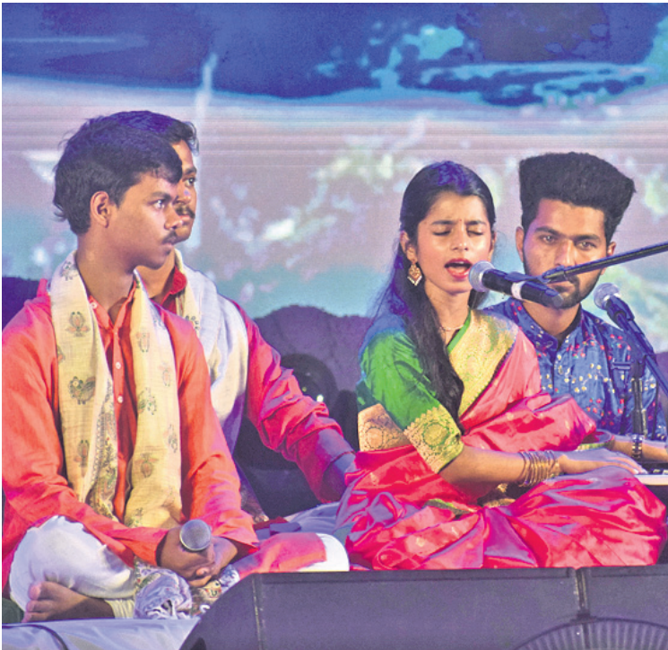
‘ଏକାମ୍ର ପ୍ରକଳ୍ପ’ ଶିଳାନ୍ୟାସ ଉତ୍ସବର ରୂପବାର ଅତିମ ସନ୍ଧ୍ୟାରେ ବିଶିଷ୍ଟ କଣ୍ଠଶିଳ୍ପୀ ଏ. ହରିହରନ୍, ନୈଥିଲି ଠାକୁର ଶିବ ଭଜନ ପରିବେଷଣ କରୁଛନ୍ତି ।