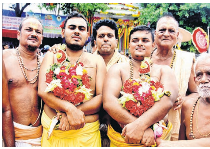
ଶ୍ରୀମାତମୁଖକୁ ରଥକୁ ପହଞ୍ଚି କରାଯାଉଛି।

ତାହାକୁ ସାଥରେ ନେଇଥିଲେ। କିଏ ବୋତଲରେ ତ କିଏ ଗାମୁଛା ଓ ପଣତ କାନିରେ ବାଲି ନେଇଥିବା ପରିଲକ୍ଷିତ ହୋଇଥିଲା। ସେହିପରି ଅନେକ ଭକ୍ତ ଶରଧାବାଲିରେ ସାଷ୍ଟାଙ୍ଗ ପ୍ରଣାମ କରି ଏବଂ ଦୀପ ଜଳାଇ ଓ ନଡ଼ିଆ ବାଡେଇ ମହାପ୍ରଭୁଙ୍କୁ ନିଜର ଗୁହାରି ଜଣାଇଥିବା ଦେଖିବାକୁ ମିଳିଥିଲା।