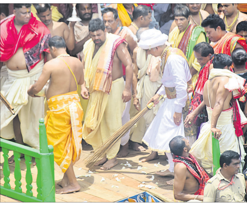
ଗଜପତି ମହାରାଜା ବିଷ୍ଣୁସିଂହ ଦେବ ରଥରେ ଛେରାପର୍ଯ୍ୟନ୍ତ କରୁଛନ୍ତି।