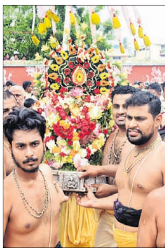
ଶ୍ରୀମଦନମୋହନଙ୍କ ପହଞ୍ଚି ବିଜେ।