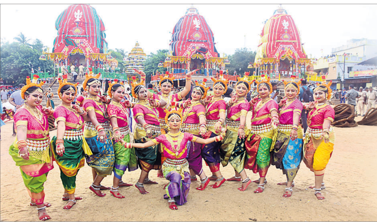
୩ ରଥ ସମ୍ମୁଖରେ ଶ୍ରଦ୍ଧାଳୁଙ୍କ ଦ୍ୱାରା ଓଡ଼ିଶୀ ନୃତ୍ୟ ପରିବେଷଣ।