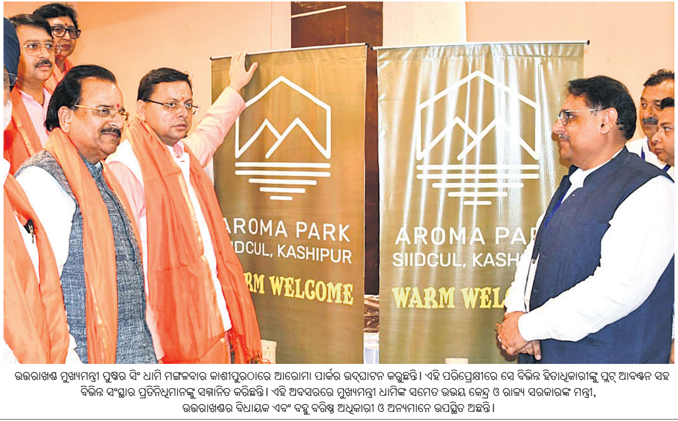
ଉତ୍ତରାଖଣ୍ଡ ମୁଖ୍ୟମନ୍ତ୍ରୀ ପୁଷ୍ପର ସିଂ ଧାମି ମଙ୍ଗଳବାର କାଶୀପୁରଠାରେ ଆରୋମା ପାର୍କର ଉଦ୍ଘାଟନ କରୁଛନ୍ତି । ଏହି ପରିପ୍ରେକ୍ଷାରେ ସେ ବିଭିନ୍ନ ହିରାଧାରୀଙ୍କୁ ମୁହଁ ଆବଦ୍ଧନ ସହ ବିଭିନ୍ନ ସ୍ଥାନର ପ୍ରତିନିଧିମାନଙ୍କୁ ସମ୍ମାନିତ କରିଛନ୍ତି । ଏହି ଅବସରରେ ମୁଖ୍ୟମନ୍ତ୍ରୀ ଧାର୍ମିକ ସମେତ ଉତ୍ତର ଛନ୍ଦ୍ର ଓ ରାଜ୍ୟ ସରକାରଙ୍କ ମନ୍ତ୍ରୀ, ଉତ୍ତରାଖଣ୍ଡର ବିଧାୟକ ଏବଂ ବହୁ ବରିଷ୍ଠ ଅଧିକାରୀ ଓ ଅନ୍ୟମାନେ ଉପସ୍ଥିତ ଅଛନ୍ତି ।