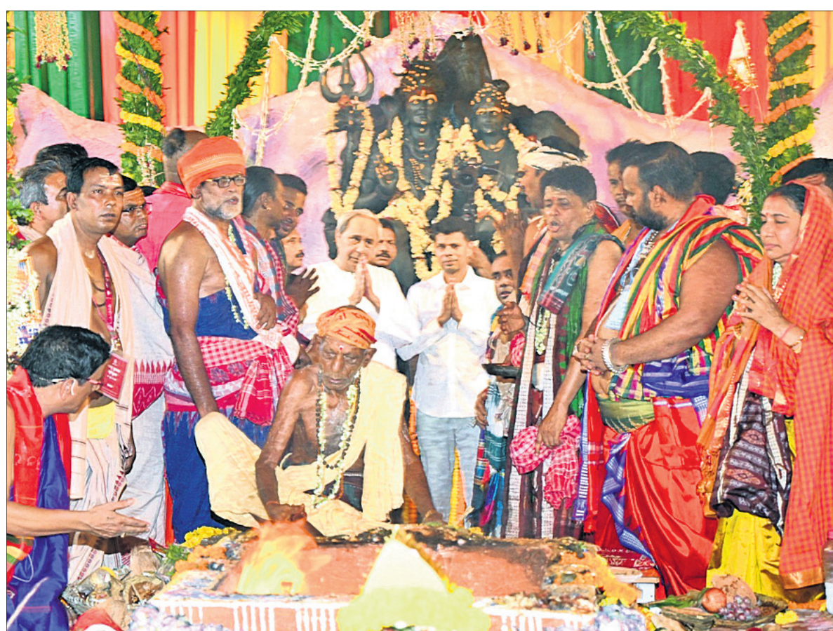
ଯଜ୍ଞ ପୂର୍ଣ୍ଣାହୁତିରେ ମୁଖ୍ୟମନ୍ତ୍ରୀ ନବୀନ ପଟ୍ଟନାୟକ ଓ ୫-୮ ବର୍ଷର ଭି.କେ. ପାଠିଆନ ।