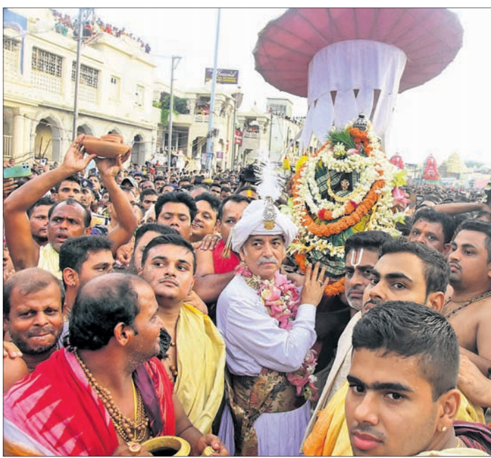
ଶ୍ରୀଅର ସମ୍ମୁଖରେ ଗଜପତି ମହାରାଜା ଲକ୍ଷ୍ମୀନାରାୟଣ ଭେଟ ନୀତି ସମ୍ପନ୍ନ କରୁଛନ୍ତି।