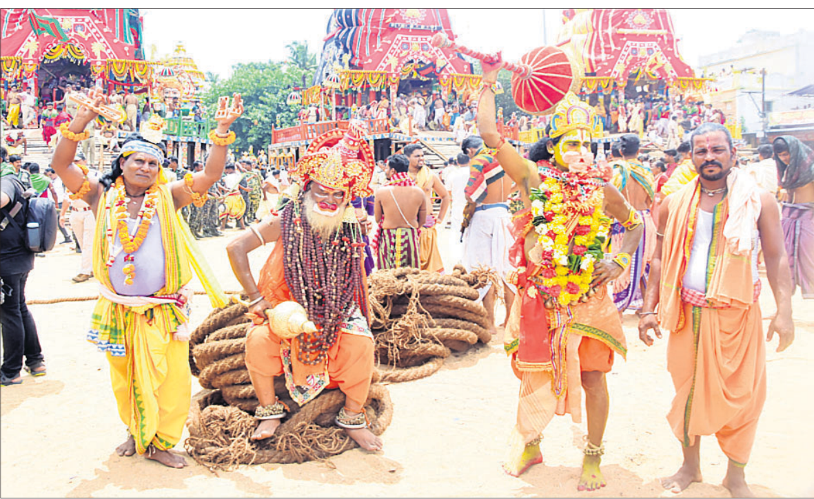
ରଥଗଣା ପୂର୍ବରୁ ଶ୍ରୀହରୁମାନ ବେଶଧାରୀ ଶ୍ରଦ୍ଧାଳୁଙ୍କ ନୃତ୍ୟ ପ୍ରଦର୍ଶନ।