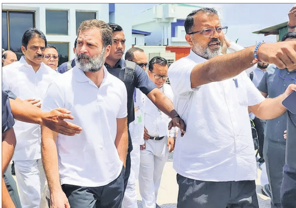
ଈମାଲ ବିମାନବନ୍ଦରେ କଂଗ୍ରେସ ନେତା ରାହୁଲ ଗାନ୍ଧି, କେସି ଭେନ୍‌ଗୋପାଳ ଓ ନେତାମାନେ ।