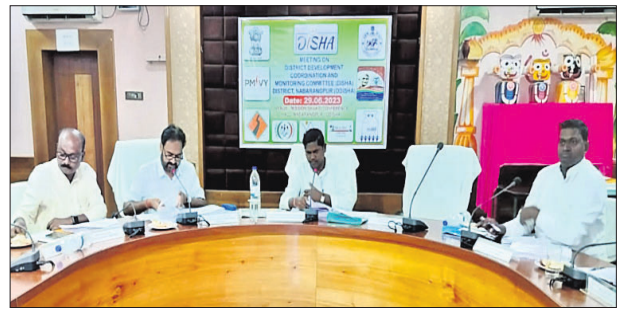
ବୈଠକରେ ନବରଙ୍ଗପୁର ଏମ୍ପି ଉପରେ ହେବାର ସମ୍ଭାବନା ।

ଆଧାର ବୈଠକ ଶାନ୍ତିରେ ଉପସ୍ଥାପନ ହୋଇଛି । ନବରଙ୍ଗପୁର, ୨୯.୬ (ସୋନିଟ ପ୍ରହରାଜ) ନବରଙ୍ଗପୁର ଜିଲ୍ଲାସ୍ତରୀୟ ବିଶା ବୈଠକ ଏମ୍ପି ଉପରେ ହେବାର ସମ୍ଭାବନା ରହିଛି ।