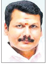
ଭି. ସେଇଲ ବାଲାଜୀ

ତେନ୍ତାଇ, ୨୯।୬ ଏକ ବିବାହ ଘଟଣାକ୍ରମରେ ତାମିଲନାଡୁ ରାଜ୍ୟପାଳ ଆର୍.ଏନ୍. ରବି ଭୁବ୍ୱନାର ମୁଖ୍ୟମନ୍ତ୍ରୀ ଏମ୍.କେ. ଷ୍ଟାଲିନ୍ଙ୍କ ବିନା ପରାମର୍ଶରେ ବିଦ୍ରୁତ୍ ଓ ଅବକାରୀ ମନ୍ତ୍ରୀ ଭି. ସେଇଲ ବାଲାଜୀଙ୍କୁ କ୍ୟାବିନେଟରୁ ବହିଷ୍କାର କରିଛନ୍ତି। ଜଣେ ରାଜ୍ୟପାଳ ଏଭଳି ପଦକ୍ଷେପ ନେବା ଦେଶରେ ପ୍ରଥମ ଘଟଣା। ଏହାକୁ ନେଇ ରାଜ୍ୟର ଦ୍ରାବିଡ଼ ମୁନେତ୍ରା କାଝରାମ୍ (ଡିଏମ୍‌କେ) ସରକାର ଏବଂ ରାଜ୍ୟପାଳ ମୁହଁମୁହିଁ ହୋଇଛନ୍ତି। ମନ୍ତ୍ରିମଣ୍ଡଳର ଜଣେ ଟ୍ରାପ୍ସ-୪