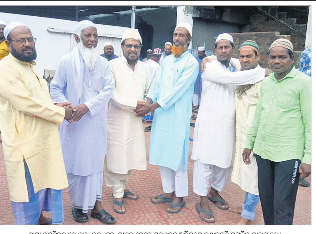
କାମା ମସଜିଦ୍‌ରେ ଇଦ୍-ଉଲ୍-ଜୁହା ପାଳିତ ବେଳେ ପରସ୍ପରକୁ ଅଭିନନ୍ଦନ ଜଣାଇଛନ୍ତି ପୂର୍ବଲମ୍ପ ଭାଇମାନେ।