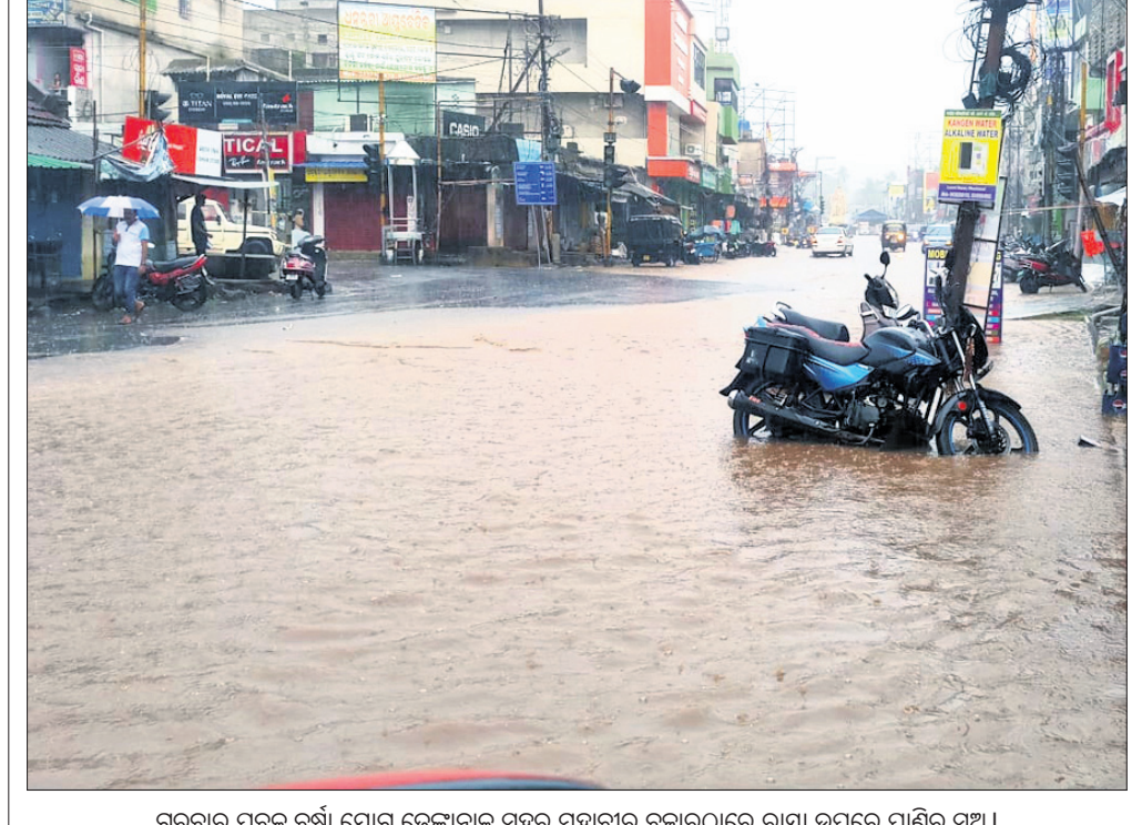
ଗୁରୁବାର ପ୍ରବଳ ବର୍ଷା ଯୋଗୁ ଦେଶାନ୍ତର ସହର ମହାବୀର ବଜାରଠାରେ ରାସ୍ତା ଉପରେ ପାଣିର ସୁଅ।