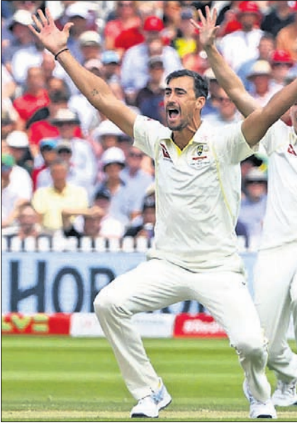
ଉଇକେଟ ପାଇଁ ଅପିଲ କରୁଛନ୍ତି ମିଚେଲ ଷ୍ଟାର୍କ।

ଲକ୍ଷ୍ନୱରେ ଅନୁଷ୍ଠିତ ଦ୍ୱିତୀୟ ଆଶେସ୍ ଟେଷ୍ଟରେ ଶତକ ହାସଲ କରିଛନ୍ତି ସ୍ଲିପ୍ସ୍ ୩୨୦ତମ ଶତକ ସହିତ ସ୍ଲିପ୍ସ୍ ଫୁଲ୍ ସମକକ୍ଷ ହୋଇଥିବା ସ୍ଲିପ୍ସ୍ ୧୧୦ ରନ୍ ବଳରେ ଅଷ୍ଟ୍ରେଲିଆ ୪୧୨ ରନ୍ କରିଛି।