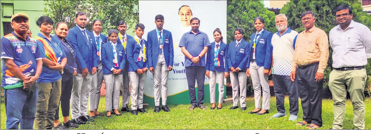
ସେବାଳ ଅଭିଯୋଗ ଖୁଲି ଥପାଳି ହେବା ପରେ କୃତୀ ଆଧିକାରୀଙ୍କୁ ଆର୍ଥିକ ପ୍ରୋତ୍ସାହନ ଦେଇ ସମର୍ଥନ ଦେବାକୁ ନିର୍ଦ୍ଦେଶ ଦିଆଯାଇଛି।

କୃତୀ ଆଧିକାରୀଙ୍କୁ ଆର୍ଥିକ ପ୍ରୋତ୍ସାହନ ପ୍ରଦାନ କରିବା ଉପରେ ଉଚ୍ଚ ମାନକ ପ୍ରଦାନ କରିବା ପ୍ରତିଶ୍ରୁତି ଦେବା ଆଧିକାରୀଙ୍କୁ କୃତୀ ଆଧିକାରୀଙ୍କୁ ଆର୍ଥିକ ପ୍ରୋତ୍ସାହନ ଦେଇ ସମର୍ଥନ ଦେବାକୁ ନିର୍ଦ୍ଦେଶ ଦିଆଯାଇଛି।