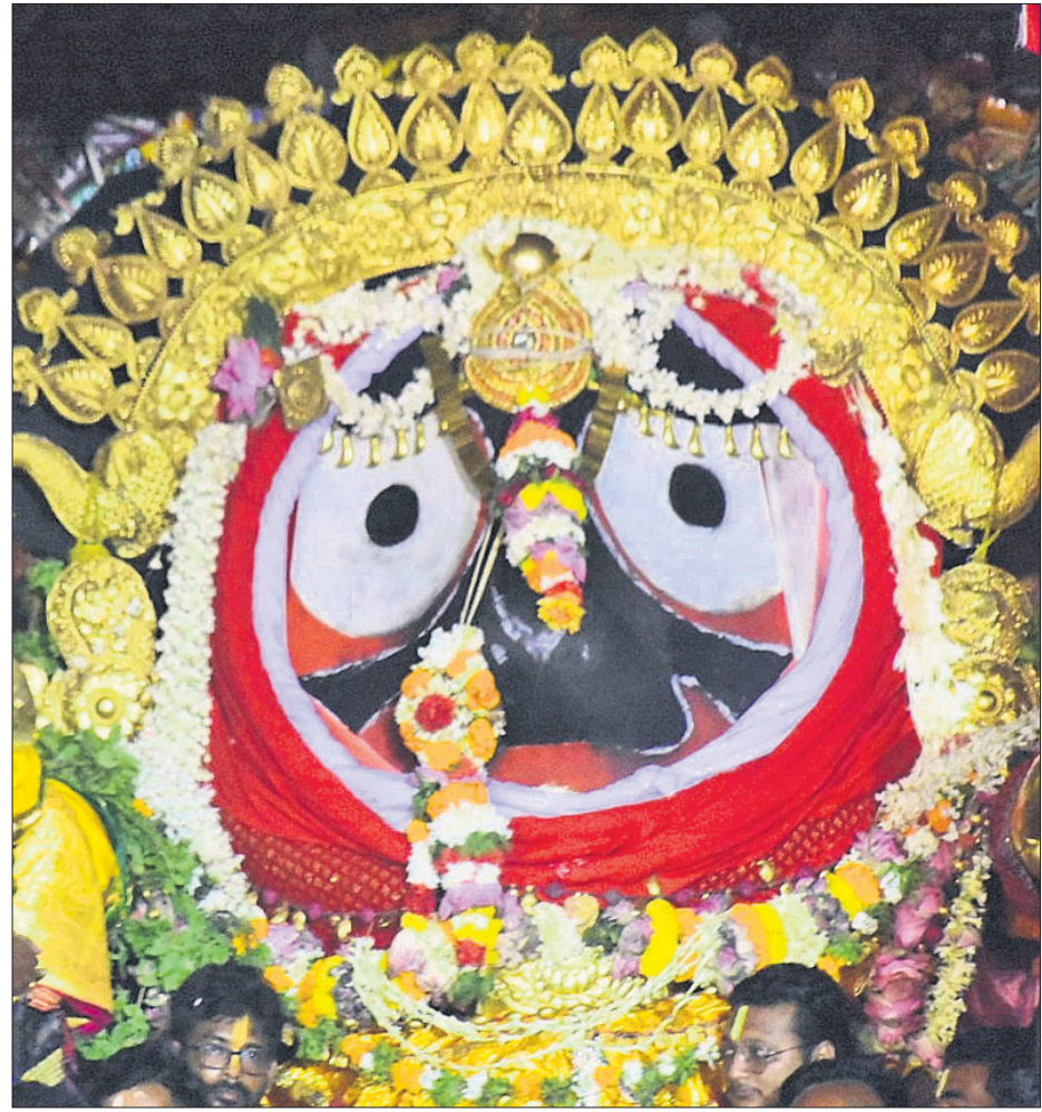
ପୁରୀ: ଗୁରୁବାର ତିନି ରଥରେ ବଡ଼ଠାକୁର ପ୍ରଭୁ ବଳଭଦ୍ର, ଦେବୀ ସୁଭଦ୍ରା ଏବଂ ମହାପ୍ରଭୁ ଶ୍ରୀଜଗନ୍ନାଥ ସୁନାବେଶରେ ଦର୍ଶନ ଦେଉଛନ୍ତି ।