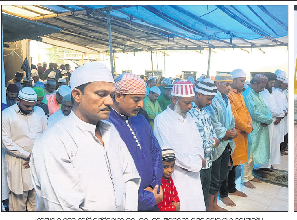
ଦେଶାନ୍ତର ସହର ମୋତି ମସଜିଦ୍‌ରେ ଇଦ୍-ଉଲ୍-ଜୁହା ଅବସରରେ ସମୂହ ନମାଜ ପାଠ କରାଯାଇଛି।

ଦେଶାନ୍ତର ସହରରେ ଗୁରୁବାର ପୂର୍ବଲମ୍ପ ସମ୍ପ୍ରଦାୟର ବଳିଦାନର ପର୍ବ ଇଦ୍-ଉଲ୍-ଜୁହା ମହାସମାରୋହରେ ପାଳିତ ହୋଇଯାଇଛି। ଏହି ଅବସରରେ ମିନାବଜାରସ୍ଥିତ କାମା ମସଜିଦ୍ ଓ କାଞ୍ଚନ ବଜାରସ୍ଥିତ ମୋତି ମସଜିଦ୍ରେ ସକାଳେ ସାମୁହିକ ନମାଜ ପାଠ ହୋଇଥିଲା। ମୁସଲମାନ ଭାଇମାନେ ପରସ୍ପରକୁ ଅଭିନନ୍ଦନ ଜଣାଇଥିଲେ। ଏହି ପର୍ବ ହେଉଛି ଶାନ୍ତି, ତ୍ୟାଗ ଓ ବଳିଦାନର ପର୍ବ। ଚଳିତବର୍ଷ ସହରରେ ଇଦ୍-ଉଲ୍-ଜୁହା ଆନନ୍ଦଭରାଣୀ ସହ ପାଳିତ ହୋଇଥିଲା।