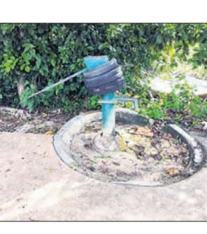
ଖାର୍ତବାସୀ ବାରମ୍ବାରାସ୍ତାକୁ ଡହଲି ଆନ୍ଦୋଳନ କରିବେ ବୋଲି ଚେତାବନୀ ଦେଇଛନ୍ତି।

କରଞ୍ଜିଆ, ୨୯।୬(କବିତା ମହାନ୍ତ) କରଞ୍ଜିଆ ଏନ୍‌ଏସ୍ ଅଧୀନ ୧୩୯ ଖାର୍ତ ନଳକୂପ ଦୀର୍ଘ ଦିନ ହେଲା ଅଚଳ ହୋଇପଡ଼ିଛି। ସ୍ଥାନୀୟ କାଉନସିଲର ବାରମ୍ବାର ଏନ୍‌ଏସ୍ କାର୍ଯ୍ୟାଳୟରେ ଅଭିଯୋଗ କଲେ ମଧ୍ୟ ପ୍ରଶାସନ ପକ୍ଷରୁ କିଛି ପଦକ୍ଷେପ ଗ୍ରହଣ କରାଯାଇନାହିଁ। ଫଳରେ ଖାର୍ତବାସୀ ପାଣିର ଘୋର ଅଭାବକୁ ନେଇ ହଇରାଣ ହେଉଛନ୍ତି। ତୁରନ୍ତ ସମସ୍ୟାର ସମାଧାନ ନ ହେଲେ