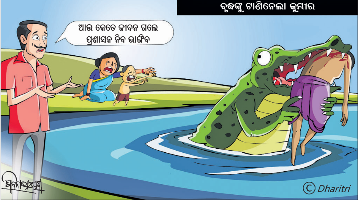
ବୁଦ୍ଧଙ୍କୁ ଚାଣିନେଲା କୁମ୍ଭୀର

ଓଡ଼ିଆ ଜଗତମାଳି ଓ ଲୋକଗୀତ - ଫ୍ରେଣ୍ଡସ ପବ୍ଲିଶର୍ସ