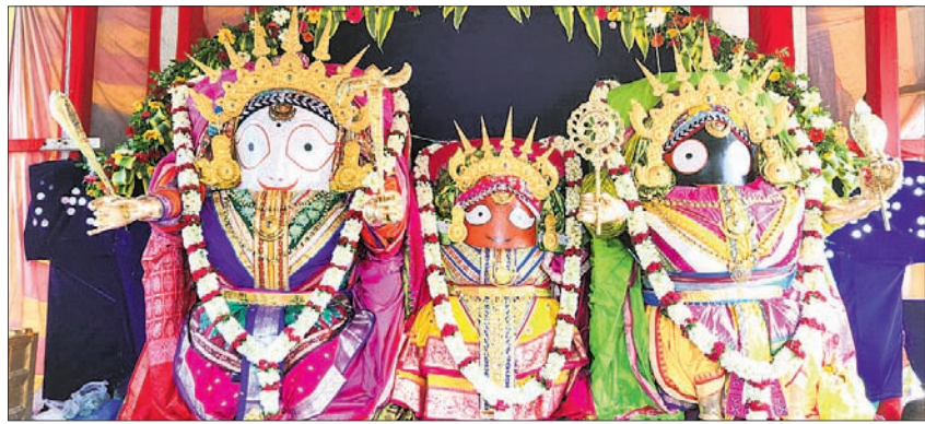
ସୁନା ବେଶରେ ଦର୍ଶନ ଦେଉଛନ୍ତି ଶ୍ରୀଜୀଉ ।

କେନ୍ଦୁଝର, ୨୯।୮ (ନଗର ଚନ୍ଦ୍ର ପଟ୍ଟନାୟକ/ବାପକ ମିଶ୍ର)