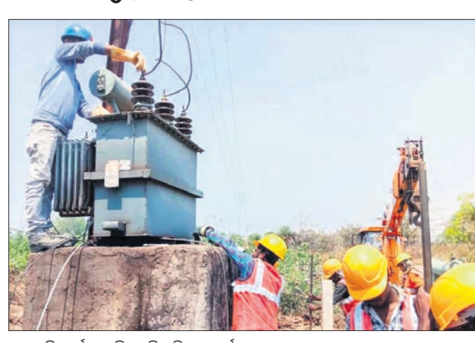
ମରାମତି କାର୍ଯ୍ୟରେ ନିୟୋଜିତ ବିଦ୍ୟୁତ୍ କର୍ମଚାରୀ।

ବାଲେଶ୍ୱର ଜିଲ୍ଲା ରେମୁଣ୍ଡା ଗୋଲେଇ ନିକଟସ୍ଥ ଗାଟା ପାଖର ଓ ଓଡ଼ିଶା ସରକାରଙ୍କ ଯୌଥ ଉଦ୍ୟୋଗ ଚିପି ନର୍ଦନ ଓଡ଼ିଶା ଡିସ୍ଟ୍ରିକ୍ଟୁଶନ ଲିମିଟେଡ୍ (ଚିପିଏନ୍‌ଓଡିଏଲ୍) ପକ୍ଷରୁ ମୌସୁମୀ ପ୍ରଭୃତି ଅଭିଯାନର ଅଂଶସ୍ୱରୂପ ବିଜଳ ପଦକ୍ଷେପ ଗ୍ରହଣ କରାଯାଇଛି। ମୌସୁମୀ ସମୟରେ ଗ୍ରାହକମାନଙ୍କୁ ନିରବଚ୍ଛିନ୍ନ ବିଦ୍ୟୁତ୍ ଯୋଗାଣ ସୁନିଶ୍ଚିତ କରିବା ଏବଂ ଏହାର ଗ୍ରାହକ, କର୍ମଚାରୀଙ୍କ ପାଇଁ ସମସ୍ତ ସୁରକ୍ଷା ପଦକ୍ଷେପ ଗ୍ରହଣ କରିବାକୁ କମ୍ପାନୀ ଲକ୍ଷ୍ୟ ରଖିଛି।