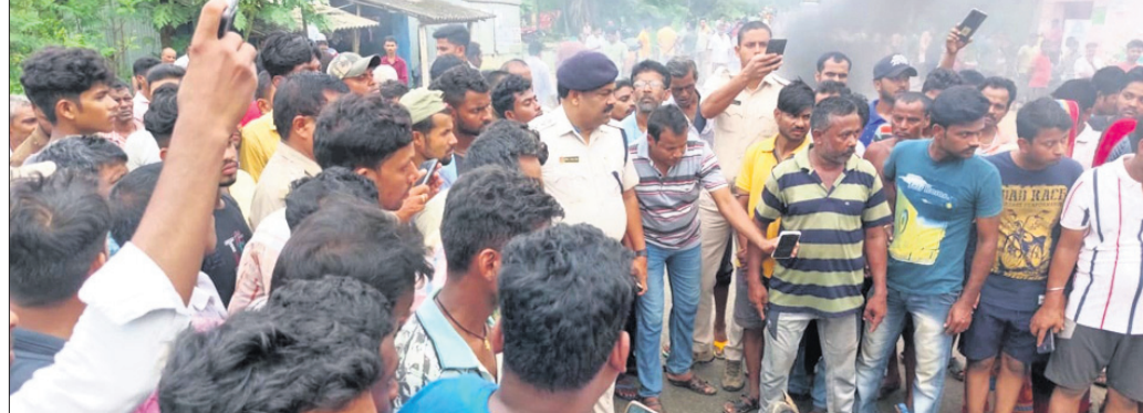
ଦୁର୍ଘଟଣାସ୍ଥଳରେ ଲୋକେ ଉତ୍ତେଜନା ପୂର୍ଣ୍ଣ କରୁଛନ୍ତି।