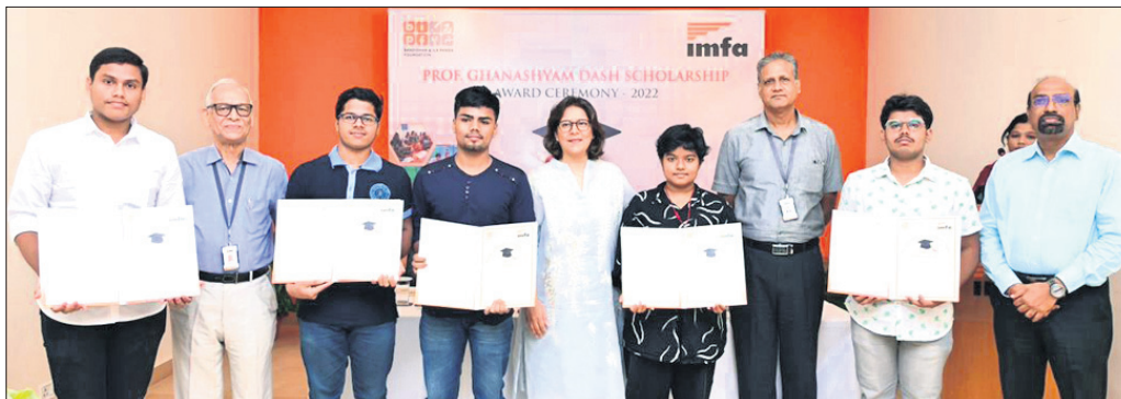
କୃତୀ କ୍ଷାତ୍ରୀକ୍ଷାତ୍ରୀମାନଙ୍କ ସହ ବିଆଇପିଏଫର ଗ୍ରନ୍ଥ ତଥା ପ୍ରତିଷ୍ଠାତା ସିଦ୍ଧାନ୍ତ ପାଠ୍ୟପୁସ୍ତକ ପଢ଼ା ଓ ଅନ୍ୟାନ୍ୟ ଉପସ୍ଥିତ ଅଛନ୍ତି ।

ପ୍ରତିବର୍ଷ ଭଳି ଚଳିତବର୍ଷ ମଧ୍ୟ ବ୍ୟାପାର ଓ ଇଲା ପଞ୍ଚା ପାଠକୋଶ୍ୟାନ (ବିଆଇପିଏଫ) ପକ୍ଷରୁ ଉତ୍କଳିକା ପାଇଁ ପ୍ରଦାନ କରାଯାଉଥିବା ପ୍ରଫେସର ଘନଶ୍ୟାମ ଦାଶ ବୃତ୍ତି (ପିଜିଡିଏସ୍)-୨୦୨୨ର ବିଜେତା କ୍ଷାତ୍ରୀକ୍ଷାତ୍ରୀମାନଙ୍କୁ ସମ୍ମାନିତ କରାଯାଇଛି । ବିଶେଷକରି ଇଞ୍ଜିନିୟରିଂ, ମେଡିସିନ ଏବଂ ଉପାଦାନ ଡିଗ୍ରୀ ହାସଲ କରିବା ପାଇଁ ପ୍ରତ୍ୟେକ ବର୍ଷ ୬ ଯୋଗ୍ୟ କ୍ଷାତ୍ରୀକ୍ଷାତ୍ରୀଙ୍କୁ ବିଆଇପିଏଫ ପକ୍ଷରୁ ଉପରୋକ୍ତ ବୃତ୍ତି ପ୍ରଦାନ କରାଯାଇଥାଏ । ଉକ୍ତ ବୃତ୍ତି ଅନ୍ତର୍ଗତ ଏକାଡେମିକ୍ ଫିଂର ୯୦% ଓ ୪ ବର୍ଷ ମଧ୍ୟରେ ହେବାକୁ ଥିବା ଅନ୍ୟାନ୍ୟ ଖର୍ଚ୍ଚକୁ ମିଶାଇ ପ୍ରତ୍ୟେକ ବୃତ୍ତିଧାରୀଙ୍କୁ ୬ ଲକ୍ଷ ଟଙ୍କା ପର୍ଯ୍ୟନ୍ତ ଆର୍ଥିକ ସହାୟତା ବିଆଇପିଏଫ ପକ୍ଷରୁ