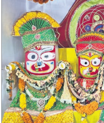
ସୁନାବେଶରେ ସଜିତ ରଥାରୁଡ଼ ଚତୁର୍ଦ୍ଧା ମୂର୍ତ୍ତି ।

କେନ୍ଦୁଝର ଜିଲ୍ଲା ଡେକିକୋଟ ଜଗନ୍ନାଥ ମନ୍ଦିର ପରିଚାଳନା କମିଟି ଦ୍ୱାରା ଆୟୋଜିତ ରଥଯାତ୍ରାରେ ଗୁରୁବାର ରଥାରୁଡ଼ ଚତୁର୍ଦ୍ଧା ମୂର୍ତ୍ତିଙ୍କ ସୁନାବେଶ କରାଯାଇଛି। ସୁନାବେଶକୁ ପୂଜକ କଳାକର ପଣ୍ଡା ଯଥା ରୀତିନୀତି ପୂଜା ସମ୍ପୂର୍ଣ୍ଣ କରିବା ପରେ ସୁନାଗହଣାକୁ