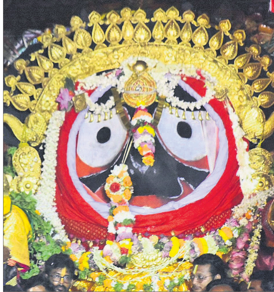
ପୁରୀ: ଗୁରୁବାର ତିନି ରଥରେ ବଡ଼ଠାକୁର ପ୍ରଭୁ ବଳଭଦ୍ର, ଦେବୀ ସୁଭଦ୍ରା ଏବଂ ମହାପ୍ରଭୁ ଶ୍ରୀଜଗନ୍ନାଥ ସୁନାବେଶରେ ଦର୍ଶନ ଦେଉଛନ୍ତି ।