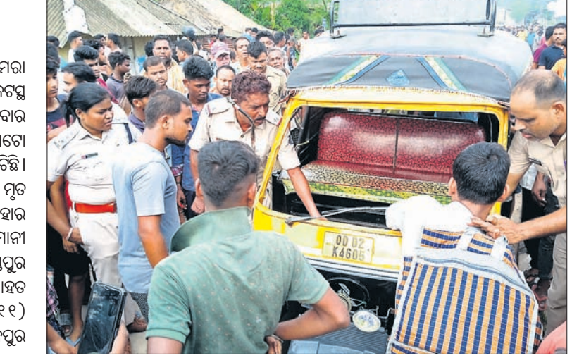
ପୋଲିସ୍ ଦୁର୍ଘଟଣାଗ୍ରସ୍ତ ଅଟୋକୁ ଧାଳୁ ନେଇଛି।

ଭଦ୍ରକ ଜିଲ୍ଲା ବାସୁଦେବପୁର-ଧାମରା ରାସ୍ତାର ମହାରୀ ଚାବେରି ଛକ ନିକଟସ୍ଥ ହରିଜନବନ୍ଧୁ ଛକଠାରେ ଶୁକ୍ରବାର ଅପରାହ୍ଣରେ ଏକ ଘଟଣାରେ ସ୍କୁଲ ଅଟୋ ଓଲଟି ଜଣେ ଛାତ୍ରୀଙ୍କ ମୃତ୍ୟୁ ଘଟିଛି। ଏଥିରେ ୨ ଜଣ ଆହତ ହୋଇଛନ୍ତି।