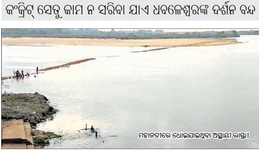
ମହାନଦୀରେ ଧୋଇଗଲା ଅସ୍ଥାୟୀ ରାସ୍ତା।