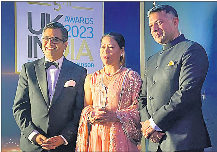
ପୁରସ୍କାର ଗ୍ରହଣ ଅବସରରେ ଏମ୍.ସି. ମେରୀ କମ୍ (ମଝି)।

ଅନ୍ତର୍ଜାତୀୟ ସ୍ତରର ଇଣ୍ଡିଆ ଗ୍ଲୋବାଲ ମେରୀ କମ୍ ପୁରସ୍କାର ଗ୍ରହଣ ଅବସରରେ ମେରୀ କମ୍ (ମଝି) ଶ୍ରୀମତୀ ଶ୍ରୀମତୀ କମ୍ପ୍ୟୁ ଗ୍ଲୋବାଲ ଇଣ୍ଡିଆନ ଆଇକନ୍ ପୁରସ୍କାର ପାଇଥିଲେ। ଉଭୟ ଦେଶରେ ଚଳିଥିବା କ୍ଷେତ୍ରରେ ତାଙ୍କର ଉଲ୍ଲେଖନୀୟ ଅବଦାନ ରହିଛି। ଏହି ଗୌରବ ଅର୍ଜନ କରି ଡାକ୍ତରୀ ପୁରସ୍କାର ପାଇଁ ସୁପାରିସ ହେବା ପରେ ତାଙ୍କର ଅବଦାନ ରହିଛି। ଲକ୍ଷ୍ୟରେ ଥିବା ଭାରତୀୟ ହାଇକମ୍ପିଶନର ଏକ ସାଂସ୍କୃତିକ ଶାଖା ନେହେରୁ ସେଣ୍ଟର ଯୁକ୍ତ-ଇଣ୍ଡିଆ ପୁରସ୍କାର ଲାଭ କରିଛି। ଯୁକ୍ତ-ଭାରତ ଦ୍ୱିପାକ୍ଷିକ ସମ୍ପର୍କକୁ ମଜବୁତ କରିବା କ୍ଷେତ୍ରରେ ଏହି ସେଣ୍ଟରର ଉଲ୍ଲେଖନୀୟ ଅବଦାନ ରହିଛି। ଯୁକ୍ତ-ଇଣ୍ଡିଆ ବାର୍ଷିକ ପୁରସ୍କାର ୫ମ ବର୍ଷ ପର୍ଯ୍ୟନ୍ତ ପ୍ରଦାନ କରାଯାଇଛି। ବ୍ୟବସାୟ ଦୃଷ୍ଟିରେ ସେବା, ସରକାରୀ, ସାଂସ୍କୃତିକ ଓ ସାମାଜିକ ପ୍ରଭାବ ଆଦି କ୍ଷେତ୍ରରେ ଦ୍ୱିପାକ୍ଷିକ ସମ୍ପର୍କକୁ ମଜବୁତ କରିବା କ୍ଷେତ୍ରରେ ଉଲ୍ଲେଖନୀୟ ଅବଦାନ ପାଇଁ ଏହି ପୁରସ୍କାର ଦିଆଯାଇ ଆସୁଛି।