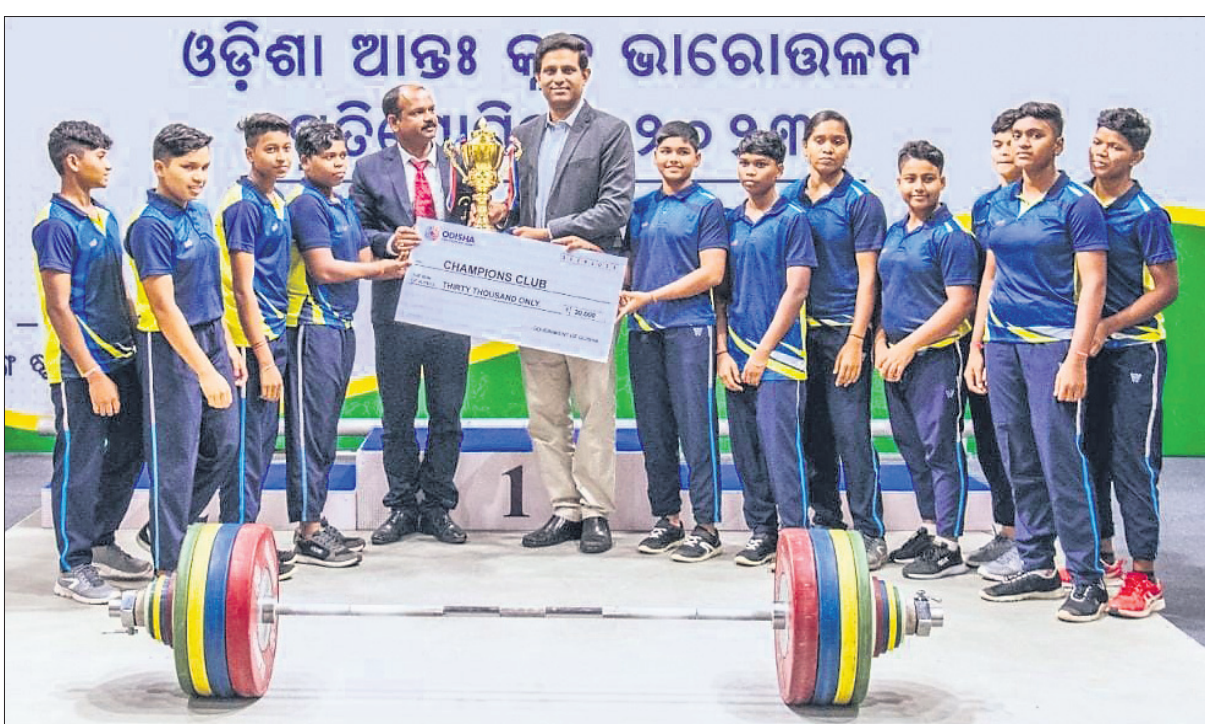
ଅଲ୍ ଓଡ଼ିଶା ଆନ୍ତର୍ଜାତୀୟ କ୍ରୀଡ଼ା ଭାରୋତ୍ତମନ ଚାମ୍ପିୟନ ଲିଗ୍ ପୁରସ୍କାର ହାସଲ କରିଛନ୍ତି।

ଉପରେ ଯୁକ୍ତ-ଇଣ୍ଡିଆ ଆଇକନ୍ ପୁରସ୍କାର ପ୍ରଦାନ କରାଯାଇଛି। ପୂର୍ବରୁ ରାଜ୍ୟ ସଭା ସଦସ୍ୟା ମେରୀ କମ୍ ଗ୍ଲୋବାଲ ଇଣ୍ଡିଆନ ଆଇକନ୍ ପୁରସ୍କାର ପାଇଥିଲେ।