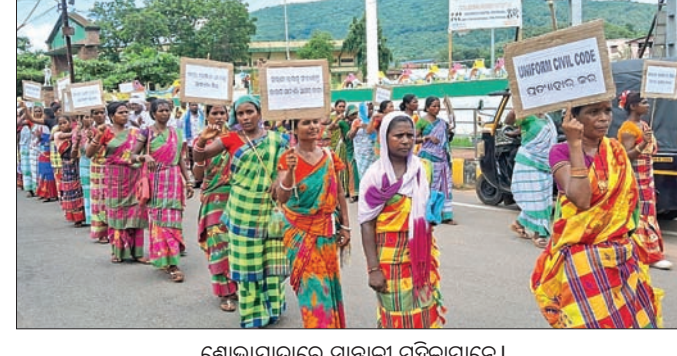
ଶୋଭାଯାତ୍ରାରେ ସାଞ୍ଜଳୀ ମହିଳାମାନେ।

ହୋଇଥିବା ଇଡିଏସ୍ ସିଷ୍ଟମରେ ହାତୀ-ମଣିଷ ସଂଘର୍ଷ ରୋକିବାରେ ବାରମ୍ବାର ବିଫଳ ହେଉଥିବା ବନ ବିଭାଗ ପୁଣି ଥରେ ବୈଷୟିକ ଜ୍ଞାନକୌଶଳ ଉପରେ ନିର୍ଭର କରିଛି। ଗାଁ ସୀମାନ୍ତରେ ହାତୀ ଉପସ୍ଥିତି ସମ୍ପର୍କରେ ଜନସାଧାରଣଙ୍କୁ ଅବଗତ କରାଇବା ଲାଗି ପ୍ରାରମ୍ଭିକ ଚେତାବନୀ ବ୍ୟବସ୍ଥା (ଏଲି ଖୁନ୍ସି ସିଷ୍ଟମ ବା ଇଡିଏସ୍) ଆରମ୍ଭ କରାଯାଇଛି। ଫଳରେ ହାତୀ ଚଳପ୍ରଚଳ ଲାଗିବା ମାତ୍ରେ ୫ ମିନିଟ୍ ଧରି ସାଇରନ୍ ବାଜିବ। ଏଥିସହ ନାଲି ଲାଇଟ୍ ମଧ୍ୟ ଜଳିଉଠିବ। ହିସାବରେ ରେଡ୍‌ର ହାତୀ ଉପସ୍ଥିତି ବ୍ୟାପକ ବନ ବ୍ରାହ୍ମଣୀଆପାଳ ବିଏ ଅର୍ଗନାଇଜେସନ୍ ଗ୍ରାମରେ ଶୁଣ୍ଠିବାର ପରୀକ୍ଷାମୂଳକ ଭାବେ ଏହାର ଶୁଭାରମ୍ଭ ହୋଇଛି। ଏହା ସଫଳ ହେଲେ ଏହାକୁ ଅନ୍ୟତ୍ର ପ୍ରୟୋଗ କରାଯିବ ବୋଲି ବନ ବିଭାଗ ପକ୍ଷରୁ ସୂଚନା ଦିଆଯାଇଛି।