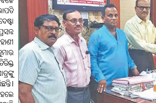
ଅତିରିକ୍ତ ଜିଲ୍ଲାପାଳଙ୍କୁ ଦାବିପତ୍ର ପ୍ରଦାନ କରାଯାଇଛି।

ଦେଶାଳୀ, ୩୦।୬(ରତନ ନାୟକ) ଦେଶାଳୀ ଜିଲ୍ଲାରେ ଗାଈର ଦୁଗ୍ଧ ଉତ୍ପାଦନ ପାଇଁ ଉପଯୋଗୀ ହେଉଥିବା କିଛି ଉପକରଣର ଉପକ୍ରମ ସମାଧାନ ଦାବି କରିବା ପାଇଁ ଜିଲ୍ଲା ପ୍ରଶାସନରୁ ଅନୁରୋଧ କରାଯାଇଛି।