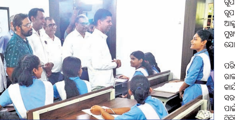
ସେକେଣ୍ଡାରୀ ବୋର୍ଡ ହାଇସ୍କୁଲରେ ୫-ଟି ସର୍ବିସ ଭି.କେ. ପାଣ୍ଡିଆନ ଛାତ୍ରୀଙ୍କ ସହ ଆଲୋଚନା କରୁଛନ୍ତି। କୋଟି ଟଙ୍କା ପ୍ରଦାନ କରିଛନ୍ତି। ଏହି ଅର୍ଥକୁ ବିଭିନ୍ନ ବିଭାଗମୂଳକ କାର୍ଯ୍ୟରେ କିପରି ଲଗାଇ ହେବ ସେନେଇ କିଲାପାଳଙ୍କ ସହ ଆଲୋଚନା କରିଥିଲେ। ପରେ ପାଣ୍ଡିଆନ ସ୍ମାର୍ଟ କ୍ୟାମ୍ପୁସ୍ରେ ୧୦ ମିନିଟ୍ ଧରି ପିଲାଙ୍କ ସହିତ ବାର୍ତ୍ତାଳାପ କରିଥିଲେ। ଉପସ୍ଥିତ ଛାତ୍ରଛାତ୍ରୀଙ୍କୁ ୫-ଟି ସର୍ପିସରେ ବୁଝାଇବା ସହ ସେମାନଙ୍କ ସୁବିଧା, ଅସୁବିଧା ଓ ଭବିଷ୍ୟତ ଲକ୍ଷ୍ୟ ସମ୍ପର୍କରେ