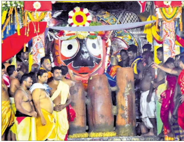
ପୂରୀ: ଶୁକ୍ରବାର ଚାଳଧୂଳି, ବର୍ଦ୍ଧନକନ ଏବଂ ନନ୍ଦିଘୋଷ ରଥରେ ଅଧରପଣା ନାଚି ସମ୍ପନ୍ନ କରାଯାଇଛି ।