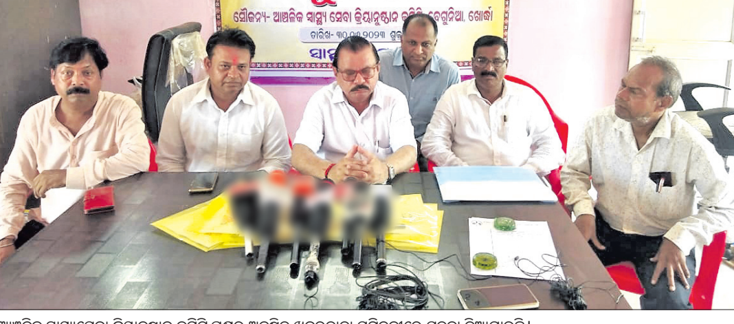
ଆଞ୍ଚଳିକ ସ୍ୱାସ୍ଥ୍ୟସେବା କ୍ରୟାୟତ୍ତନ କମିଟି ସଭାରେ ଉପସ୍ଥିତ ସଭ୍ୟମାନେ ଏକମତରେ ସୂଚନା ଦିଆଯାଇଛି।

ଆଞ୍ଚଳିକ ସ୍ୱାସ୍ଥ୍ୟସେବା କ୍ରୟାୟତ୍ତନ କମିଟି ପକ୍ଷରୁ ଅନୁରୋଧ କରାଯାଇଛି। ଉପସଭାରେ ଉପସ୍ଥିତ ଗୋଷ୍ଠୀ ସ୍ୱାସ୍ଥ୍ୟକେନ୍ଦ୍ର ମାନ୍ୟତା ପାଇଁ ଅନୁରୋଧ ପତ୍ର ସମ୍ପର୍କରେ ସୂଚନା ଦିଆଯାଇଛି।