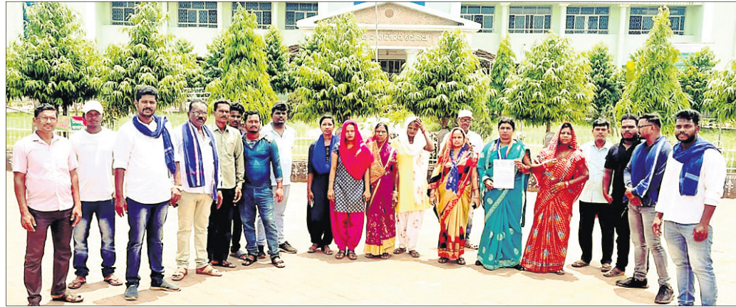
ରାଷ୍ଟ୍ରପତିଙ୍କ ଉଦ୍ଦେଶ୍ୟରେ ଶୁକ୍ରବାର ଜିଲାପାଳଙ୍କୁ ଦାବିପତ୍ର ଦେବାକୁ ଆସିଥିବା ଭାମ୍ପା ଆର୍ମି ଖୋର୍ଦ୍ଧା ଶାଖାର କର୍ମଚାରୀ ।