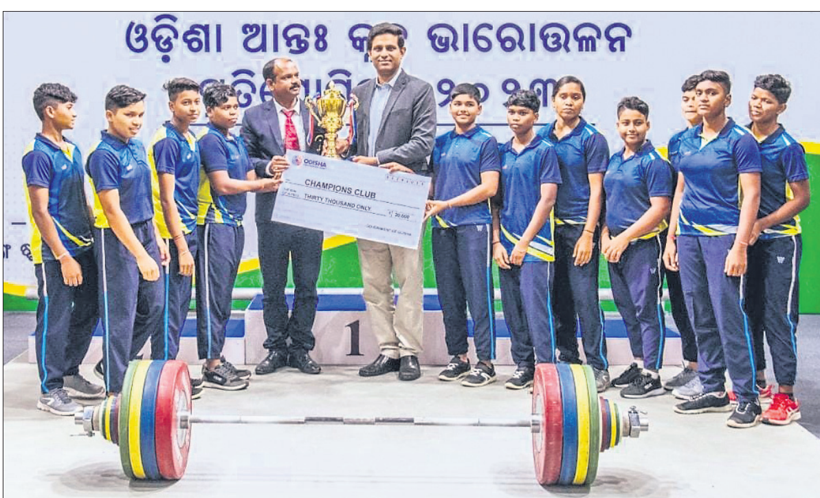
ଅଲ୍ ଓଡ଼ିଶା ଆନ୍ତଃ କ୍ରୀଡ଼ା ଭାରୋତ୍ତମରେ ଚାମ୍ପିୟନ ଭାବେ ଉପାଧି ପ୍ରଦାନ କରାଯାଇଛି।

ଅନ୍ତର୍ଜାତୀୟ ସ୍ତରର ଇଣ୍ଡିଆ ଗ୍ଲୋବାଲ ଇଣ୍ଡିଆନ ଆଇକନ୍ ପୁରସ୍କାର ଗ୍ରହଣ ଅବସରରେ ଏମ୍.ସି. ମେରୀ କମ୍ (ମଝି)।