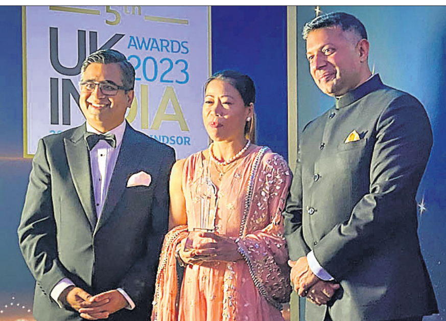
ପୁରସ୍କାର ଗ୍ରହଣ ଅବସରରେ ଏମ୍.ସି. ମେରୀ କମ୍ (ମଝି)।

ଲକ୍ଷ୍ମୀ, ୩୦୬ (ପି.ଟି.) ଇଣ୍ଡିଆନ ଗ୍ଲୋବାଲ ଇଣ୍ଡିଆନ ଆଇକନ୍ ପୁରସ୍କାର ଗ୍ରହଣ ଅବସରରେ ଏମ୍.ସି. ମେରୀ କମ୍ (ମଝି)।