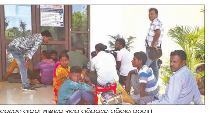
ମୃତଦେହ ପାଇବା ଆଶାରେ ଏମ୍ବ ପରିସରରେ ପରିବାର ସଦସ୍ୟ।

ଭୁବନେଶ୍ୱର, ୩୦।୬ (ଅଜିତ ଦାସ) ଦିବନ୍ଧ ନମୁନା ସଂଗ୍ରହ କରାଯାଇ ପରୀକ୍ଷା ଲାଗି ପଠାଯାଇଥିଲା। ତେବେ ରିପୋର୍ଟ ଆସିବା ବିଳମ୍ବ ହେବାରୁ ଅଧିକାଂଶ ଦାବିଦାର ପରିବାରର ସଦସ୍ୟମାନେ ଗାଁକୁ ଚାଲିଯାଇଥିଲେ। ଆଉ କେତେଜଣ ରେଳଝେଡ଼ି ପକ୍ଷରୁ ନିଜ ପରିବାର ସଦସ୍ୟ, ଆତ୍ମୀୟସ୍ୱଜନଙ୍କୁ ଖୋଜି ଚାଲିଥିବାବେଳେ ଆଉ କିଏ ମୃତଦେହ ପାଇବାକୁ ଭୁବନେଶ୍ୱର ଏମ୍ବରେ ଅପେକ୍ଷା କରି ବସିଛନ୍ତି। ଏମ୍ବରେ ୮୧ ମୃତଦେହକୁ ଚିହ୍ନଟ ଲାଗି ସଂରକ୍ଷିତ କରି ରଖାଯାଇଥିଲା। କେତେକ ମୃତଦେହ ବିକୃତ ହୋଇଯାଇଥିବାରୁ ଚିହ୍ନଟ ସମ୍ଭବ ହୋଇ ନ ଥିବାବେଳେ ଆଉ କେତେକ ମୃତଦେହର ଏକାଧିକ ଦାବିଦାର ରହିଥିଲେ। ତେଣୁ ଏମ୍ବ ପକ୍ଷରୁ ସମସ୍ତ ମୃତଦେହ ଓ ଦାବିଦାର ୮୭ ପରିବାର ସଦସ୍ୟଙ୍କ