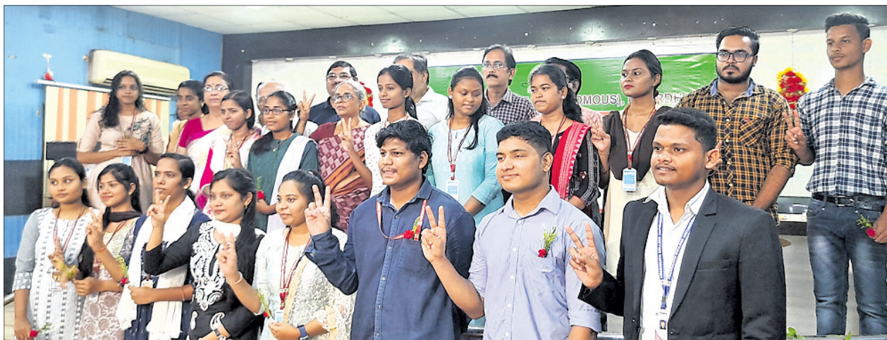
ସ୍ନାତକ ଫଳ ପ୍ରକାଶିତ ପରେ ଅତିଥିଙ୍କ ଗହଣରେ ବିଭିନ୍ନ ବିଭାଗର ଚମ୍ପର ଛାତ୍ରାଛାତ୍ରୀ ।