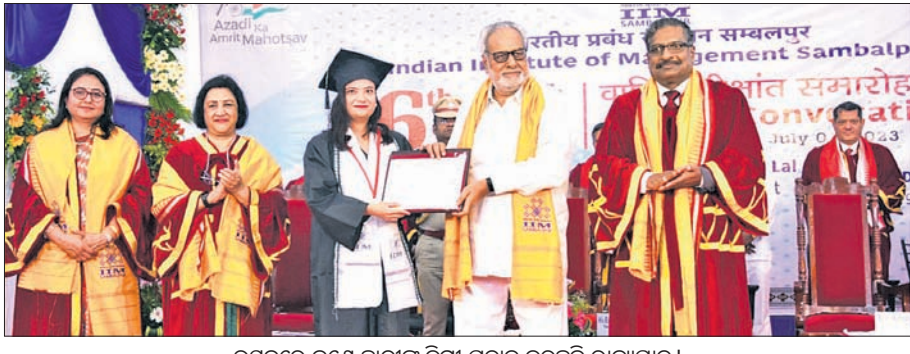
ଉତ୍ସବରେ ଜଣେ ଛାତ୍ରୀଙ୍କୁ ଡିଗ୍ରୀ ପ୍ରଦାନ କରୁଛି ରାଜ୍ୟପାଳ।

ଭୌତିକ ସମ୍ପତ୍ତି ସୀମା ଦୁର୍ଲଭତାରେ ପ୍ରେମର ବ୍ୟାପକତା ଅଧିକ। ପ୍ରେମ କୌଣସି ଆପତ୍ତି, ପ୍ରତିଯୋଗିତା ଓ ବିରୋଧାଭାସକୁ ଉତ୍ତର ଦେଇ ଦେଇ ଦେଇ ଚାଲିଯାଏ।