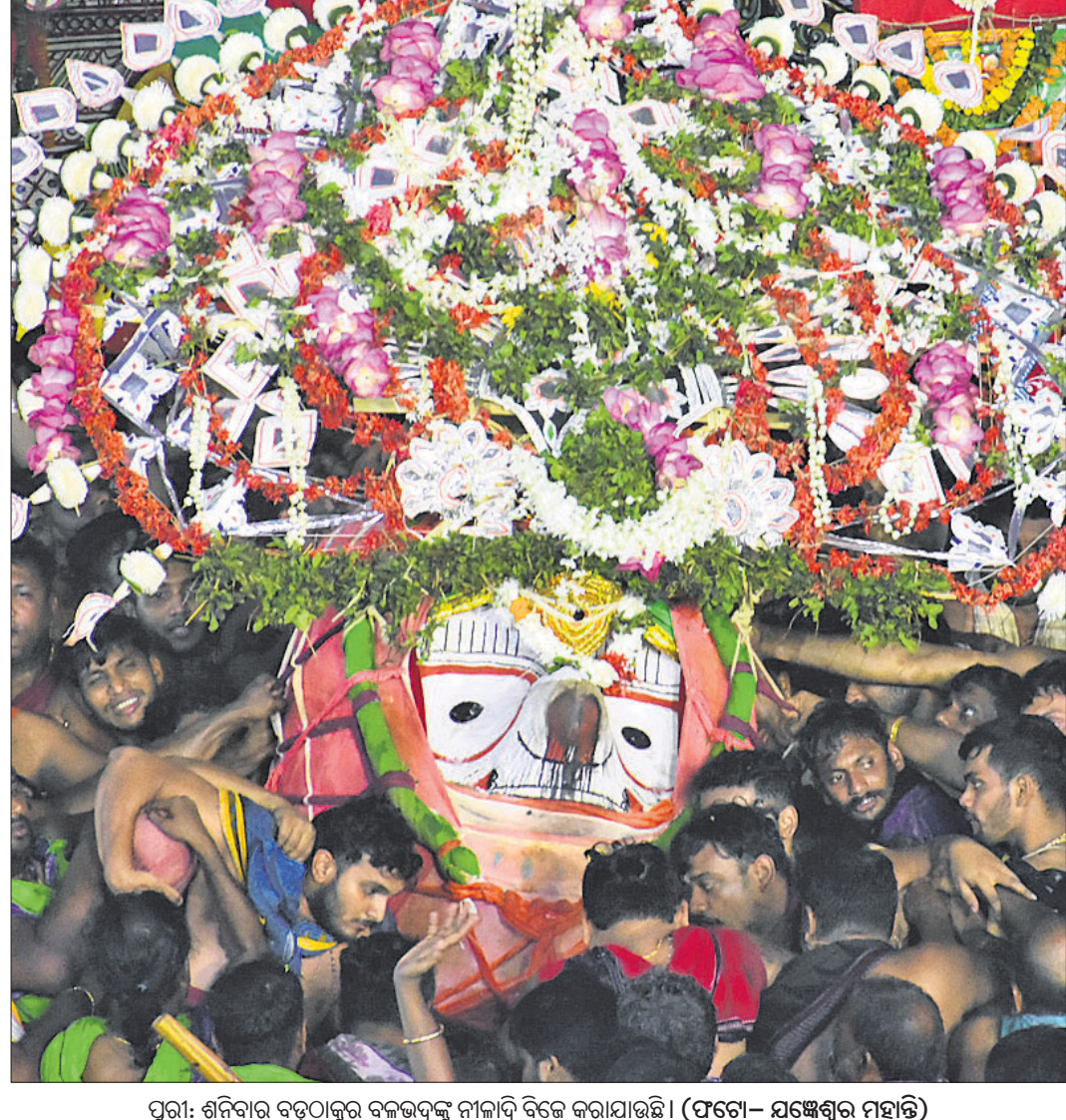
ପୁରୀ: ଶନିବାର ବଡ଼ଠାକୁର ବଳଭଦ୍ରଙ୍କୁ ନାକାନ୍ତ୍ର ବିଜେ କରାଯାଉଛି।

ଆଜିର ମନ୍ତବ୍ୟ ପିଏମ୍- ଜିଷ୍ଟାନ ଯୋଜନାରେ ଗଣମାମାନେ ବର୍ଷକୁ ୫୦ ହଜାର ଟଙ୍କା ଲେଖାଏଁ ପାଉଛନ୍ତି। ଏହା କେବଳ ପ୍ରତିଶ୍ରୁତି ନୁହେଁ, ଗ୍ୟାରେଣ୍ଟି ମଧ୍ୟ। -ନରେନ୍ଦ୍ର ମୋଦି, ପ୍ରଧାନମନ୍ତ୍ରୀ