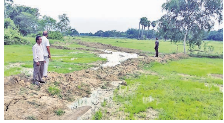
ବଚେଶ୍ୱର-ଚେଳଦିଆ ରାସ୍ତାକଡ଼ ଜମିରେ ପାଇପ ବିଛା କାର୍ଯ୍ୟ ଚାଲିଛି।