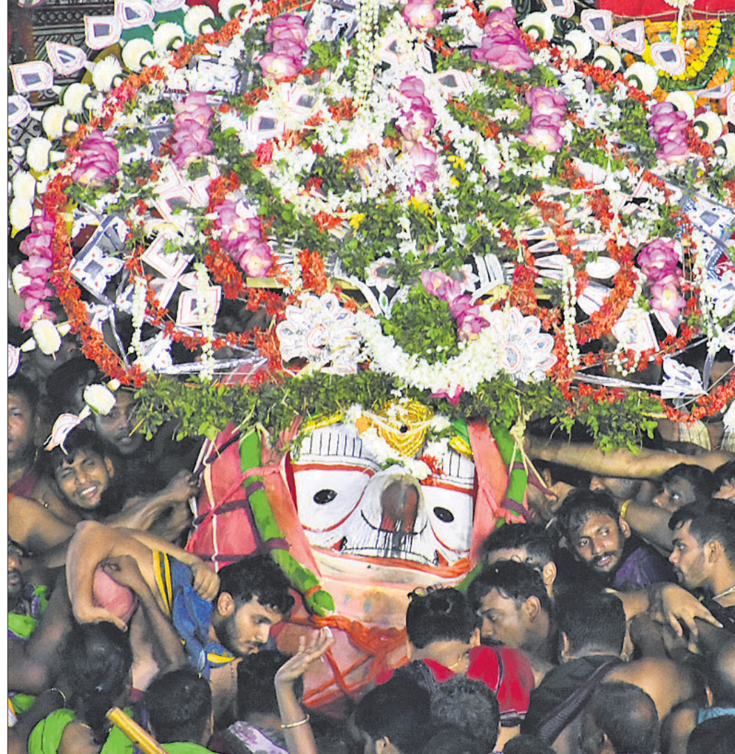
ପୁରୀ: ଶନିବାର ବଡ଼ଠାକୁର ବଜ୍ରଭଦ୍ରଙ୍କୁ ନୀଳାଦ୍ରି ବିଜେ କରାଯାଇଛି।