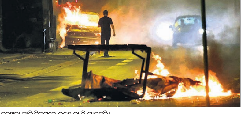
କଳୁଥିବା ଗାଡ଼ି ନିକଟରେ ଜଣେ ବ୍ୟକ୍ତି ଯାଇଛନ୍ତି ।

ପାଟଣା, ୧୯ ପ୍ରାନ୍ତରେ ପୋଲିସ ଚୁଲିରେ ଜଣେ ନାବାଳକ ପ୍ରାଇଭେଟ ମୃତ୍ୟୁ ପ୍ରତିବାଦରେ ହିଂସାମୂଳକ ପ୍ରତିବାଦ ଜାରି ରହିଛି । ବ୍ୟାପକ ପୋଲିସ ମୁହଁରେ ସବୁଜ ଲୁଗାଗତ ଚଳୁଥିବା ରାତି ପାଇଁ ବିଭିନ୍ନ ସହରରେ ଦଙ୍ଗା ଦେଖାଦେଇଛି । ଉତ୍ତର ଭାରତରେ ଦଙ୍ଗା ଲାଗିଲାବେଳେ