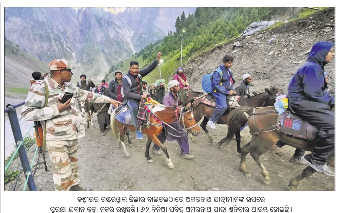
କମ୍ପାନୀର ଗଞ୍ଜରଖିଲା ଜିଲାର ବାଲତଳାଠାରେ ଅମରନାଥ ଯାତ୍ରୀମାନଙ୍କ ଉପରେ ପୁରୁଣା ଯବାନ କଡ଼ା ନଜର ରଖୁଛନ୍ତି । ୬୨ ଦିନିଆ ପବିତ୍ର ଅମରନାଥ ଯାତ୍ରା ଶନିବାର ଆରମ୍ଭ ହୋଇଛି ।

ପ୍ରତି କୃଷକଙ୍କୁ ବର୍ଷକୁ ୫୦ ହଜାର ଟଙ୍କା ମିଳୁଛି: ମୋଦି ନ୍ୟୁଦିଲ୍ଲୀ, ୧୯: କେନ୍ଦ୍ର ସରକାର ପ୍ରତିବର୍ଷ କୃଷି ସେକ୍ଟର ପାଇଁ ୬.୫ ଲକ୍ଷ କୋଟି ଟଙ୍କା ଦେଉଛନ୍ତି । ପ୍ରତି କୃଷକ ବର୍ଷକୁ ବିଭିନ୍ନ ଯୋଜନାରେ ୫୦ ହଜାର ଟଙ୍କା ଲାଭ ପାଉଛନ୍ତି ବୋଲି ପ୍ରଧାନମନ୍ତ୍ରୀ ନରେନ୍ଦ୍ର ମୋଦି ଶନିବାର କହିଛନ୍ତି । ଏହା କେବଳ ପ୍ରତିକୃତି ନୁହେଁ, 'ମୋଦି ଗ୍ୟାରେଣ୍ଟି' ବୋଲି ପ୍ରଧାନମନ୍ତ୍ରୀ ୧୭ତମ ଭାରତୀୟ ସମବାୟ କଂଗ୍ରେସରେ ଉଦ୍‌ଘୋଷଣା କରି କହିଛନ୍ତି । ନିକଟରେ କଂଗ୍ରେସ ଏ ଅନ୍ୟ ବିରୋଧୀ ଦଳଗୁଡ଼ିକ ଦେଇଥିବା ନିର୍ବାଚନ ପ୍ରତିକୃତିକୁ ଆକ୍ଷେପ କରି ପ୍ରଧାନମନ୍ତ୍ରୀ କେନ୍ଦ୍ର ସରକାର ସାର ସର୍ବସିଡି, ଖାଦ୍ୟଶସ୍ୟ କ୍ରୟ, ପିଏମ୍-କିଶଣନ ଆଦି ଯୋଜନାକୁ ଚାଷୀ ପାଉଥିବା ଲାଭ ସମ୍ପର୍କରେ ସୂଚନା ଦେଇଥିଲେ ।