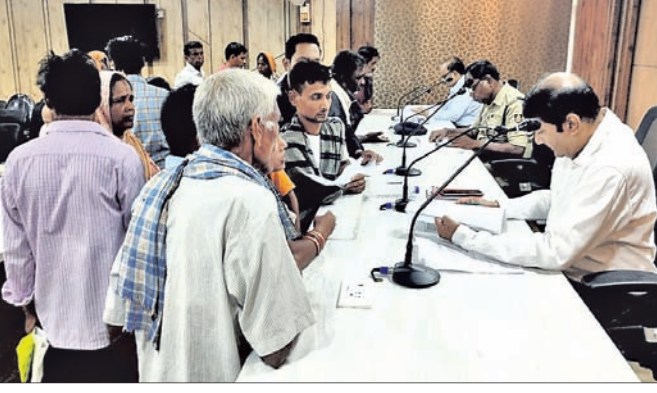
ଜନଶୁଣାଣିରେ ଅତିରିକ୍ତ ଜିଲାପାଳ ।