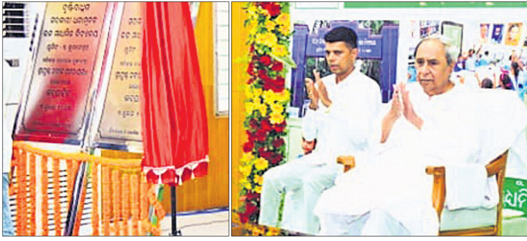
ପୁଖ୍ୟମନ୍ତ୍ରୀ ନବୀନ ପଟ୍ଟନାୟକ ଯୋଗଦାନ ରାଜ୍ୟ ପଶ୍ୟାଗାର ନିଗମ କର୍ପୋରେଟ ବିଲ୍ଡିଂ ଶିଳାନ୍ୟାସ କରିବା ଅବସରରେ।

ବେଳେ ବିପିନ ବିହାରୀ ଚୌଧୁରୀ ଶ୍ରୁତିବାଧିତ ଉଚ୍ଚ ମାଧ୍ୟମିକ ବିଦ୍ୟାଳୟରେ ବିଜ୍ଞାନ ବିଷୟ ସହିତ ଆଇ.ଟି. ଶିକ୍ଷାର ସୁଯୋଗ ଦୃଷ୍ଟି କରାଯାଇଛି। ଏହି ଅବସରରେ ଦୃଷ୍ଟିବାଧିତ ପିଲାଙ୍କ ନିମନ୍ତେ ଉଦ୍ଦିଷ୍ଟ ଅତିରିକ୍ତ ଏବଂ ଶ୍ରୁତିବାଧିତ ପିଲାଙ୍କ ନିମନ୍ତେ ଭର୍ଚୁଆଲ ଷ୍ଟୁଡିଂ ପୁଖ୍ୟମନ୍ତ୍ରୀ ଲୋକାର୍ପଣ କରିଛନ୍ତି। ଏଥିସହିତ ଦୁଇ ବିଦ୍ୟାଳୟର ସମସ୍ତ ପିଲାଙ୍କୁ ନୂଆ ସ୍କୁଲ ବ୍ୟାଗ, ଦୃଷ୍ଟିହୀନ ପିଲାଙ୍କ ପାଇଁ ବେଲିଫୋଟ, ବିଭିନ୍ନ ଖେଳ ସାମଗ୍ରୀ ପୁଖ୍ୟମନ୍ତ୍ରୀ ବନ୍ଧନ କରିଛନ୍ତି। ଉଭୟ ଛାତ୍ରାବାସର ଅନ୍ତେକାଶାଳ ବ୍ୟବହାର ନିମିତ୍ତ ନୂଆ ବିଛାଣା, ଖାଇବା ବାସନ ଆଦି ବିଭିନ୍ନ ନିତ୍ୟ ବ୍ୟବହାରୀ ଜିନିଷ ପ୍ରଦାନ କରାଯାଇଛି। ଏଥିସହିତ ଅଣ୍ଡା ପାନୀୟ ଜଳ ସୁବିଧା ପାଇଁ ଫ୍ରିଜ୍ ଓ ଶିକ୍ଷଣ କାର୍ଯ୍ୟକ୍ରମ ଓ ମନୋରଞ୍ଜନ ପାଇଁ ଉଭୟ ଛାତ୍ରାବାସକୁ ବିଭିନ୍ନ ପ୍ରଦାନ କରାଯାଇଛି। ଭାମ ଭୋଇ ଦୃଷ୍ଟିବାଧିତ ବିଦ୍ୟାଳୟରୁ ଚଳିତବର୍ଷ ୧୦ ଜଣ ଓ ବିପିନ ବିହାରୀ ଚୌଧୁରୀ ଶ୍ରୁତିବାଧିତ ବିଦ୍ୟାଳୟରୁ ୧୪ ଜଣ ଛାତ୍ରାଛାତ୍ରୀ ମାତ୍ରିକ ପରୀକ୍ଷାରେ