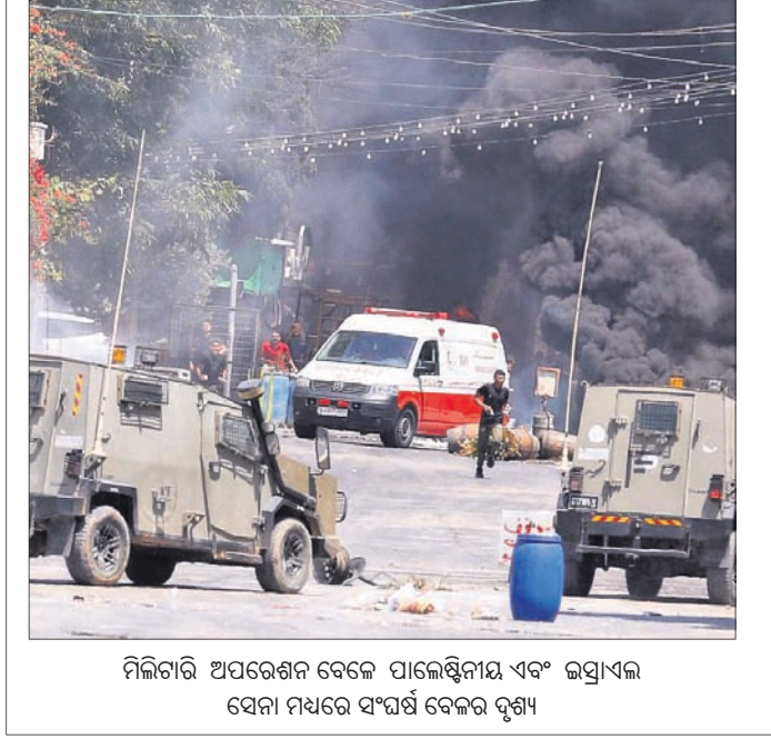
ମିଲିଟାରୀ ଅପରେଶନ ବେଳେ ପାଲେଷ୍ଟିନୀୟ ଏବଂ ଇସ୍ରାଏଲ ସେନା ମଧ୍ୟରେ ସଂଘର୍ଷ ବେଳର ଦୃଶ୍ୟ

ଫାଇ ଅଭିଯୋଗରେ ଗତବର୍ଷ ବୟେ ହାଇକୋର୍ଟରୁ ଅନିଲ ଆଣ୍ଡ୍ ସୁଧାର ଡିଏମ୍ ବିରୋଧରେ କାର୍ଯ୍ୟାଳୟରେ ଗ୍ରହଣ ନ କରିବା ଲାଗି ହାଇକୋର୍ଟ ଆଇକର ବିଭାଗକୁ କହିଥିଲେ।