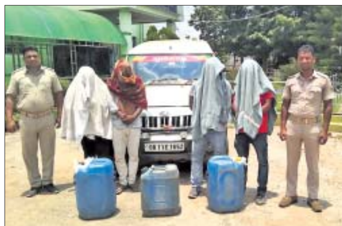
ଦେଶୀ ମଦ ସହ ବୋଲେରୋ ଜବତ, ୪ ଗିରଫ