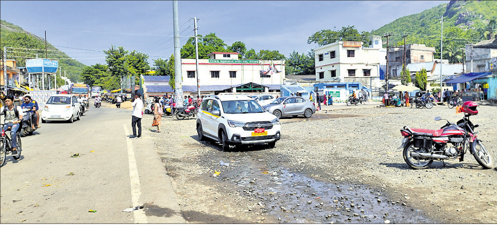
ନୟାଗଡ଼ ସହରରେ ଥିବା ଗ୍ରାମିକ ଛକ ।