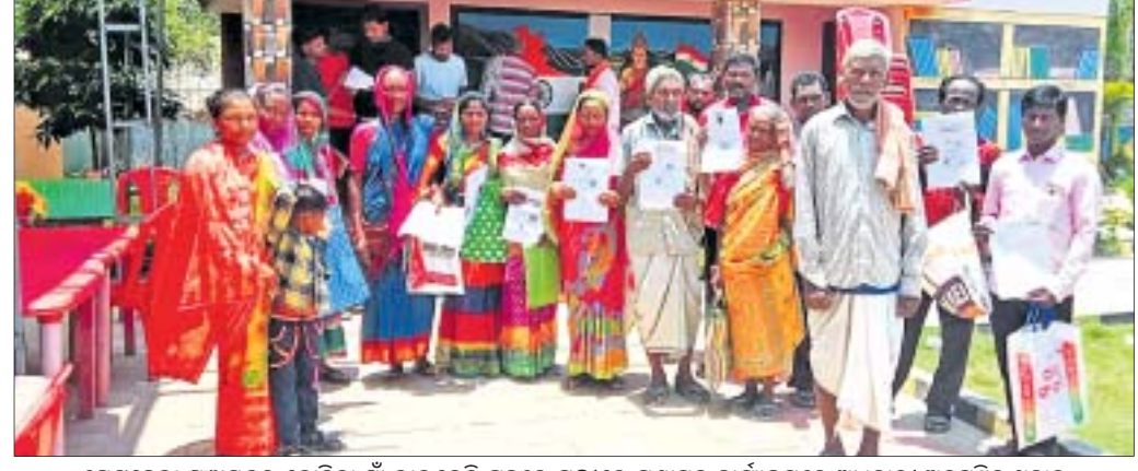
ପେଟଛେଲା ପଞ୍ଚାୟତର କୋଟିକା ଗାଁ ଲାଭକ୍ଷେତ୍ର ବୃଦ୍ଧିରେ ପଞ୍ଚାୟତ କାର୍ଯ୍ୟକ୍ରମରେ ଅଧିକାରୀ ଅନୁପସ୍ଥିତ ଥିବାକୁ ଆଦିବାସୀମାନେ ନିରାଶ ହୋଇ ଫେରି ଯାଉଛନ୍ତି ।

ଉଭୟ କେନ୍ଦ୍ର ଓ ରାଜ୍ୟ ସରକାରଙ୍କ ପକ୍ଷରୁ ଗ୍ରାମାଞ୍ଚଳରେ ଜନକଲ୍ୟାଣମୂଳକ ଯୋଜନାଗୁଡ଼ିକ ବୃଦ୍ଧମୁଖରେ ପହଞ୍ଚାଇବା ପାଇଁ ବିଭିନ୍ନ ଯୋଜନା କାର୍ଯ୍ୟକାରୀ କରୁଛନ୍ତି । ହେଲେ ପ୍ରଶାସନ ଅବହେଳା ଯୋଗୁଁ ପଞ୍ଚାୟତ ପ୍ରଶାସନ ଅଭିଯୋଗ ଶୁଣାଣି ସରକାରୀ ନାଲିପିତା ତଳେ ଗଠିତଯାଇଯାଇଛି । କେନ୍ଦ୍ରାପଡ଼ା ଜିଲ୍ଲା ମହାନାଳପଡ଼ା ବ୍ଲକ୍ରେ ୨୭ ପଞ୍ଚାୟତ ଥିଲା । ପରବର୍ତ୍ତୀ ସମୟରେ ଏହି ବ୍ଲକ୍ରେ ଜନସଂଖ୍ୟା ବୃଦ୍ଧି, କ୍ଷେତ୍ର ଆୟତନ ବୃଦ୍ଧିରୁ ରାଜ୍ୟ ସରକାର ବିଚାରକୁ ନେଇ ୨୦୧୭ରେ ଅଧିକ ୪ଟି ନୂଆ ପଞ୍ଚାୟତ କାର୍ଯ୍ୟକାରୀ କରିଥିଲେ । ବ୍ଲକ୍ରେ ପଞ୍ଚାୟତ ସଂଖ୍ୟା ୩୧ରେ ପହଞ୍ଚିଛି । ତେବେ ନୂତନ ଭାବେ ଗଠନ ହୋଇଥିବା ୪ ପଞ୍ଚାୟତ ମଧ୍ୟରେ ଗଡ଼ ରୋପିତ, ପେଟଛେଲା, କ୍ୟାମର ବଡ଼ ବାଣ୍ଟୁଆ ଓ ନାଣ୍ଡୁଆ ଆଦି ନୂତନ ପଞ୍ଚାୟତରେ ସ୍ଥାୟୀ ଅଧିକାରୀ ହେବା ପରେ କାର୍ଯ୍ୟକାରୀ ହୋଇନାହିଁ । ଏହି ନୂତନ ପଞ୍ଚାୟତ କାର୍ଯ୍ୟକାରୀ କରିବା ପାଇଁ ଗାଁ ଲାଭକ୍ଷେତ୍ର ବୃଦ୍ଧି, ବିଦ୍ୟାଳୟ ପରିସରରେ ପଞ୍ଚାୟତ ଭାବେ ଚାଲିଛି । ପଞ୍ଚାୟତ ସ୍ଥାୟୀ ହେବା ପରେ ପଞ୍ଚାୟତ କାର୍ଯ୍ୟକାରୀ ହେବ ବୋଲି ସେ କହିଛନ୍ତି ।