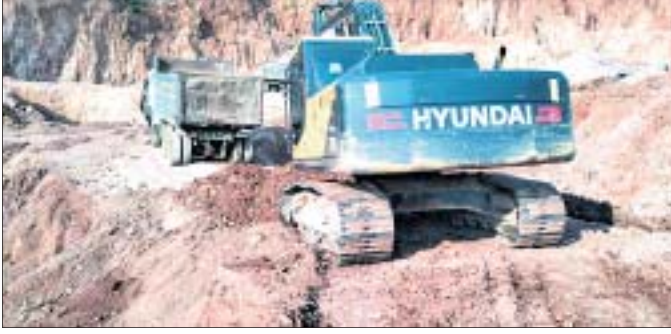
କବଚ ହୋଇଥିବା ପ୍ରୋଜେକ୍ଟର ମେଶିନ ।