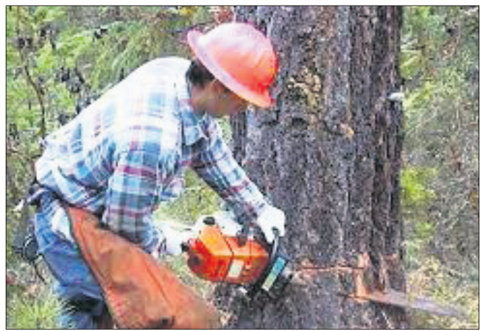
ଭଲରେ ବେଙ୍ଗୁପାରୁ ନ ଥିଲେ। ଏନେଇ ସେମାନଙ୍କ ମଧ୍ୟରେ କିଛି ଦିନ ଆଗରୁ ଖଗଡ଼ା ହୋଇଥିଲା। ଏହାପରେ ହାବର ରାରିଯାଇ ସାମିଲ ଗଛ ସବୁ ମେଶିନ