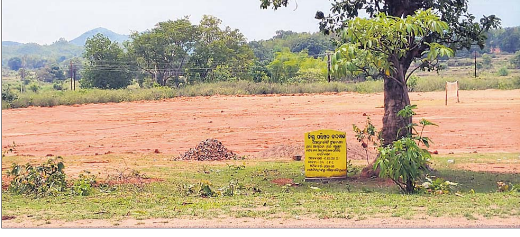
ବରପଦା ଗ୍ରାମର ଗୋଟର ଜମିରେ ଖେଳ ପଡ଼ିଆ।

ସରକାର ଲୋକଙ୍କ ହିତରେ ମାଳ ମାଳ ଯୋଜନା କରୁଛନ୍ତି। ହେଲେ ବିଭାଗୀୟ ଅଧିକାରୀଙ୍କ ବେପରୁଆ ମନୋଭାବ ଯୋଗୁଁ ଯୋଜନା ଠିକ୍ ଭାବରେ କାର୍ଯ୍ୟକାରୀ ହୋଇପାରୁନାହିଁ। ଏ ନେଇ ଲୋକଙ୍କ ମଧ୍ୟରେ ଦିନକୁ ଦିନ ଅସନ୍ତୋଷ ଚାତ୍ର ହେବାରେ ଲାଗୁଛି। ଏମିତି ଏକ ଘଟଣା କହମାଳ ଜିଲ୍ଲା ପୁଲ୍ଲବାଣୀ ବ୍ଲକ୍ ଗଞ୍ଜୁଗୁଡ଼ା ପଞ୍ଚାୟତର ଦେଖିବାକୁ ମିଳିଛି। ଗୋଟର ଜମିରେ ଖେଳ ପଡ଼ିଆ ନିର୍ମାଣ ହେଉଛି। କିଛି ସ୍ଥାନରେ କଂକ୍ରିଟ୍ ହେବା ଲାଗି ପ୍ରସ୍ତୁତି ଚାଲିଛି। ଏହାକୁ ନେଇ ଅସନ୍ତୋଷ ବଢ଼ିବାରେ ଲାଗିଛି। ଗଞ୍ଜୁଗୁଡ଼ା ପଞ୍ଚାୟତର ଆସପଡ଼ା ଗ୍ରାମର ୩୭୮ନମ୍ବର ପୁରେର ଏକ ଖେଳ ପଡ଼ିଆ କରାଯିବାକୁ କାର୍ଯ୍ୟାଦେଶ ଆସିଥିଲା। କିନ୍ତୁ ବିଭାଗୀୟ ଜେଜ, ପିଇଓ, ସରପଞ୍ଚଙ୍କ ମିଳିତ ଚକ୍ରବର୍ତ୍ତୀରେ ଆସପଡ଼ାଠାରେ ନ କରି ବରପଦା ଗ୍ରାମର ଗୋଟର ଜମିରେ ଖେଳ ପଡ଼ିଆ କରାଯାଇଛି। ଏହାକୁ