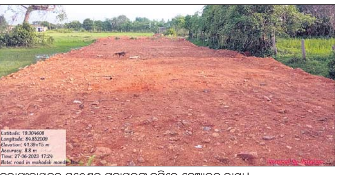
ତୁରା ପଞ୍ଚାୟତର ପୁଲ୍ଲେଶ୍ୱର ମହାପ୍ରଭୁଙ୍କ ଜମିରେ ବେଆଇନ ରାସ୍ତା।

ଗଞ୍ଜାମ ଜିଲ୍ଲା କନିଷ୍ଠ ଚହସିଲ ଅଧୀନ ବିଭିନ୍ନ ରାଜସ୍ୱ ସର୍କଲରେ ଦିନକୁ ଦିନ ଚାଷଜମିରେ ବେଆଇନ ପୂର୍ତି ବଢ଼ିବାରେ ଲାଗିଛି। କିମ୍ବଦନ୍ତୀ ପରିବର୍ତ୍ତନ ନ କରି ଖଣ୍ଡ ଖଣ୍ଡ କରି ଜମି ବିକ୍ରି କରୁଛନ୍ତି। ଏହାଦ୍ୱାରା ସରକାରୀ ଲକ୍ଷ୍ୟକୁ ଟାଣିବା ଲାଗୁ ହେଉଥିବା ବେଳେ ଚାଷଜମି ମଧ୍ୟ ଲୋପପାଇବାରେ ଲାଗିଛି। ମନ୍ଦିର ନାମରେ ଥିବା ଜମିକୁ ମଧ୍ୟ ମାଝିଆମାନେ ରାସ୍ତା ତିଆରି କରି ବେଆଇନ ପୂର୍ତି କରି ବିକ୍ରି କରିବା ଆରମ୍ଭ କରିଛନ୍ତି। ଏନେଇ ତୁରା ଗ୍ରାମବାସୀ ଜିଲ୍ଲା ପ୍ରଶାସନ ନିକଟରେ ସୋମବାର ଅଭିଯୋଗ କରିଛନ୍ତି। କନିଷ୍ଠ ଚହସିଲ ଅଧୀନ ତୁରା ରାଜସ୍ୱ ସର୍କଲ ଅନ୍ତର୍ଗତ ତୁରା ମୋତିଚାଳ ପୁଲ୍ଲେଶ୍ୱର ମହାପ୍ରଭୁଙ୍କ ମନ୍ଦିର ନାମରେ