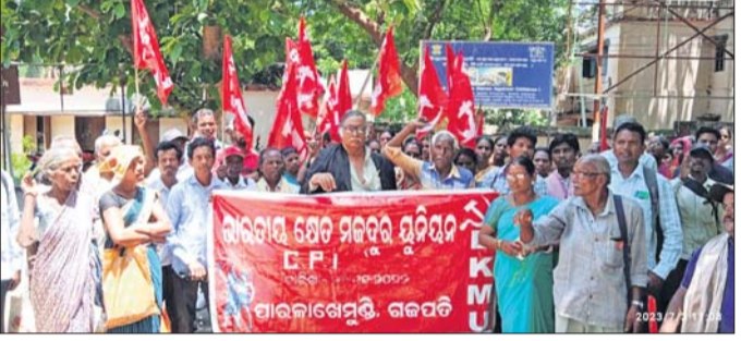
କ୍ଷେତ୍ର ମନ୍ତ୍ରଣାଳୟ ସଂଘ ପକ୍ଷରୁ ବିକ୍ଷୋଭ କରାଯାଇଛି।

ପାରଳାଖେମୁଣ୍ଡି ସ୍ଥିତ ଜିଲ୍ଲାପାଳଙ୍କ କାର୍ଯ୍ୟାଳୟ ଆଗରେ ସୋମବାର ଗରିବଙ୍କୁ ଘରଡିହ ପଟ୍ଟା ପ୍ରଦାନ ଦାବିରେ ଭାରତୀୟ କ୍ଷେତ୍ର ମନ୍ତ୍ରଣାଳୟ ସଂଘ ଗଜପତି ଜିଲ୍ଲା ଶାଖା ପକ୍ଷରୁ ବିକ୍ଷୋଭ କରାଯାଇଛି। ମୁଖ୍ୟମନ୍ତ୍ରୀଙ୍କ ଉଦ୍ଦେଶ୍ୟରେ ଏହି ଦାବିପତ୍ର ଜିଲ୍ଲା ପ୍ରଶାସନ ମାଧ୍ୟମରେ ପ୍ରଦାନ କରାଯାଇଛି। ତିନିଦିନ ବାତ୍ୟା ସମୟରେ ପାର୍ବତ୍ୟ ଅଞ୍ଚଳରେ ବସବାସ କରୁଥିବା ଅନେକ ପରିବାର ନିଜ ଘରଘାଟ ହରାଇ ବେଢ଼ର ହୋଇଛନ୍ତି। ସେମାନଙ୍କୁ ସମତଳ ଅଞ୍ଚଳରେ ବସବାସ କରିବାପାଇଁ ସହାୟତା ପାଇଁ ଅନୁରୋଧ କରାଯାଇଛି। ପୂର୍ବରୁ