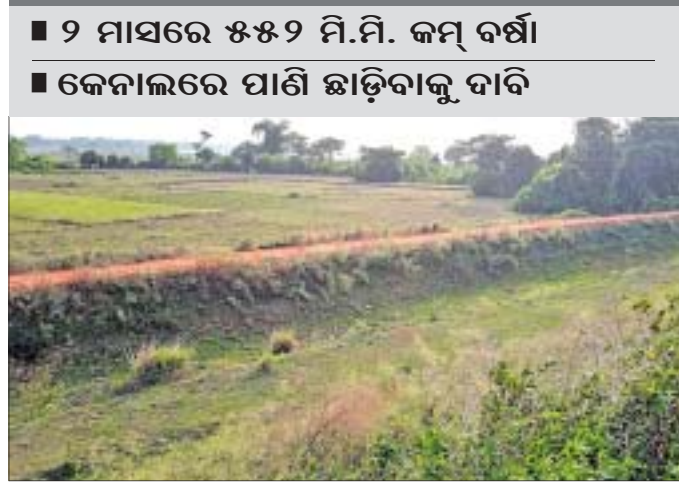
କେନ୍ଦ୍ରାପଡ଼ାର କାକରୁଦା ନିକଟରେ କେନାଲ ଶୁଖିଲା ପଡ଼ିଛି ।

ହୋଇଥାଏ । ମହାନଦୀ ନର୍ଥ ଡିଭିଜନ ଅନ୍ତର୍ଗତ ତେରାବିଶ ବ୍ଲକ୍ ୨୯୬୧ ହେକ୍ଟର, ମାଣିଘାଲର ୧୦୫୫ ହେକ୍ଟର ଓ ଗରଦପୁର ବ୍ଲକ୍ ୧୦୪୯ ହେକ୍ଟର ଜମି କେନାଲ ମାଧ୍ୟମରେ ଜଳସେଚନ ହୋଇଥାଏ । ସେହିପରି କେନ୍ଦ୍ରାପଡ଼ା ଡିଭିଜନ ଅନ୍ତର୍ଗତ କେନ୍ଦ୍ରାପଡ଼ା ୧୬,୩୫୭ ହେକ୍ଟର, ତେରାବିଶର ୭୮୪୦ ହେକ୍ଟର, ମାଣିଘାଲର ୩୪୦୯ ହେକ୍ଟର, ମହାନାଳପଡ଼ାର ୩୦୦୭ ହେକ୍ଟର ଓ ପଟ୍ଟାମୁଣ୍ଡାଲ ବ୍ଲକ୍ ଅଞ୍ଚଳ ୧୧,୦୪୯ ହେକ୍ଟର ଜମିକୁ କେନାଲ ମାଧ୍ୟମରେ ପାଣି ଯୋଗାଇ ଦିଆଯାଏ । ଅପରପକ୍ଷରେ ଆଳି, ରାଜନଗର ଓ ରାଜକନିକା ବ୍ଲକ୍ ଅଞ୍ଚଳ ସହ ଅନ୍ୟ ବ୍ଲକ୍ ଅଞ୍ଚଳର ଚାଷୀ ଉଠା ଜଳସେଚନ ଓ ବର୍ଷା ଉପରେ ନିର୍ଭର କରିଥାନ୍ତି । ଜିଲ୍ଲା ଜରୁରିକାଳୀନ ବିଭାଗ ତଥ୍ୟ ଅନୁଯାୟୀ ୨୦୨୧ ମେ ମାସରେ ହାରାହାରି ୪୩୭.୨୨ ମି.ମି., ଜୁନରେ ୨୪୯.୧୧ ମି.ମି. ପରିମାଣର ବର୍ଷା ହୋଇଥିଲା । ୨୦୨୨ରେ ଶୁଣ୍ଠ ପରିମାଣର ବର୍ଷା ହୋଇଥିଲା । ଏହି ଭୂମିରେ ତଳତଳ ମେ ମାସରେ ହାରାହାରି ମାତ୍ର ୪୫.୫୭ ମି.ମି. ଓ ଜୁନରେ ୮୨.୯୪୮ ମି.ମି. ବର୍ଷା ହୋଇଛି । ଯାହା ଚାଷ ପାଇଁ ଉପଯୁକ୍ତ ପରିମାଣର ବର୍ଷା ନୁହେଁ ।