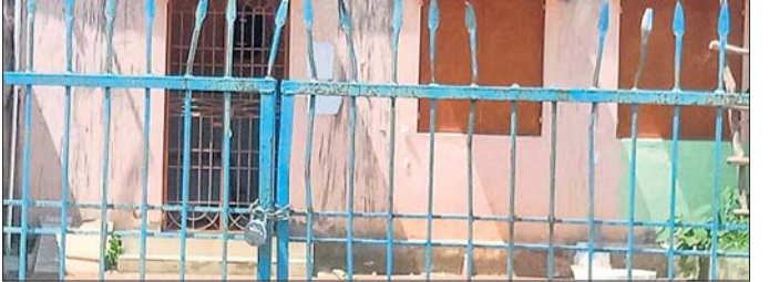
ସେରଙ୍ଗ ପଞ୍ଚାୟତ ଅଫିସରେ ତାଲା ଖୁଲୁଛି।

ପାରଳାଖେମୁଣ୍ଡି, ୩୬(ଗିରିଧାରୀ ପରିଚ୍ଛା) ପନୋକ ପାଣିକୁ ପଚାରିବାକୁ ମାସକୁ ପ୍ରାୟ ୨୦ଦିନ ଅଫିସ ବନ୍ଦ ରୁହେ। ସରପଞ୍ଚ କିମ୍ବା ଅଫିସରମାନେ ଆସି ନାହିଁ ବୋଲି କହିଥିବା ବେଳେ ୫ନମ୍ବର ଖାର୍ତ୍ତମେୟର ଅଧିକ ନାୟକ କହିଲେ, ସରକାରଙ୍କ ଯୋଜନା ସବୁ ପାଇବାରେ ଜନସାଧାରଣ ବଞ୍ଚିତ ହେଉଛନ୍ତି। ଏ ନେଇ ଅଭିଯୋଗ କଲେ ମଧ୍ୟ କୌଣସି ସୁଧମ ମିଳିପାରୁନାହିଁ। ଏହି ସରକାରଙ୍କ ଅନେକ ଜନହତକର ଯୋଜନାକୁ ଲୋକେ ବଞ୍ଚିତ ହେଉଛନ୍ତି। ଯଦି ଏହାର ପ୍ରତିକାର କରା ନ ଯାଏ ତେବେ ପଞ୍ଚାୟତବାସୀ ରାଜଗ୍ରାହ୍ୟ ଓହ୍ଲାଇବେ ବୋଲି ଚେତାବନା ଦେଇଛନ୍ତି। ଏ ନେଇ ପଞ୍ଚାୟତ କାର୍ଯ୍ୟନିର୍ବାହୀ ଅଧିକାରୀଙ୍କ ସହ ଯୋଗାଯୋଗ ହୋଇପାରିନାହିଁ।