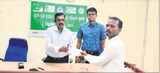
ଜିଲ୍ଲାପାଳ ସହାୟତା ରାଣି ପ୍ରଦାନ କରୁଛନ୍ତି।