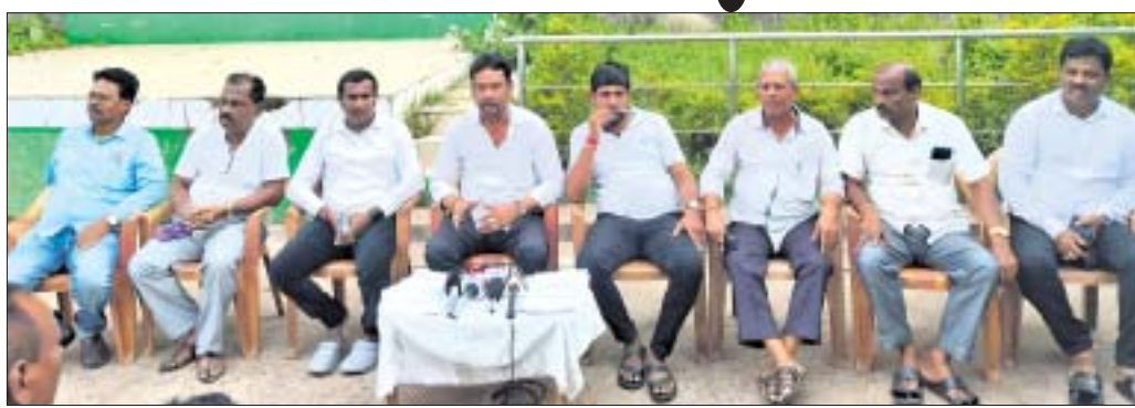
ଉଦ୍ଦେଶ୍ୟ ଲାଭରେ ଅଭ୍ୟାସର ବିଶ୍ୱାସୀକାରୀ