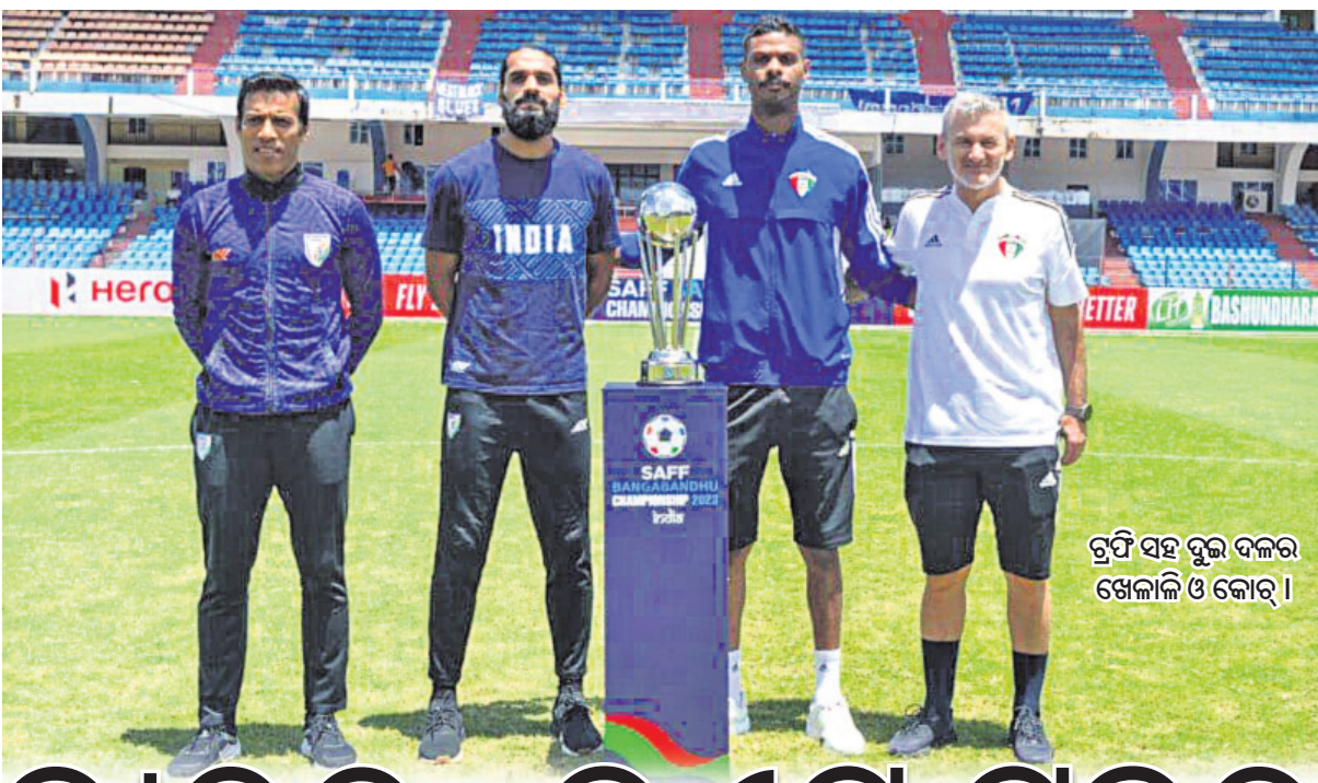
ଟ୍ରଫି ସହ ଦୁଇ ଦଳର ଖେଳାଳି ଓ କୋଚ୍ ।

ବେଙ୍ଗାଳୁରୁ ଶ୍ରୀ କାନ୍ତିରାଜା ଷ୍ଟାଡ଼ିୟମରେ ମଙ୍ଗଳବାର ରକିତ ସାଏ ଫୁଟବଲ ଚାମ୍ପିୟନଶିପର ଫାଇନାଲ ଭାରତ ଓ କୁଏଟ୍ ମଧ୍ୟରେ ଅନୁଷ୍ଠିତ ହେବ । ଦୁଇଟି ଯାକ ଦଳ ଫାଇନାଲ ଥିବାକୁ ପ୍ରସ୍ତୁତ ହେବା ପାଇଁ ପୂର୍ବଦିନିଆ ଯତ୍ନ ଗ୍ରହଣ କରିଛନ୍ତି । ଭାରତ ଚୁନାବଳୀରେ ସବୁଠାରୁ ସଫଳ ଦଳ ଭାବେ ୮ ଥର ଚାମ୍ପିୟନ ଓ ୪ ଥର ଚାମ୍ପିୟନ ଥିବା ଖେଳାଳିମାନଙ୍କୁ ଯୋଗାଇ ଦେଇଛି । ୨୦୨୧ରେ ଅନୁଷ୍ଠିତ ପୂର୍ବ ସଂସ୍କରଣରେ ମଧ୍ୟ ଭାରତ ଚାମ୍ପିୟନ ହୋଇଥିଲା । ଅର୍ଥାତ୍ ଡିଫେଣ୍ଡିଂ ଚାମ୍ପିୟନ ଭାବେ ଭାରତ ଏହି ଚୁନାବଳୀ ଖେଳୁଛି । ମାତ୍ର ଦଳ ପାଇଁ ଲକ୍ଷ୍ୟ ସହଜ ହେବନାହିଁ କାରଣ କୁଏଟ୍ ଏକ