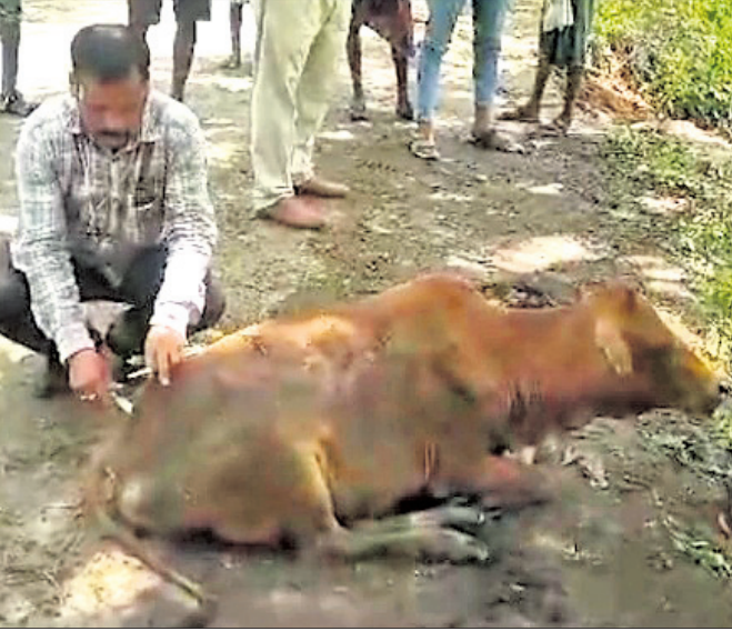
ଆହତ ଗୋରୁକୁ ଚିକିତ୍ସା କରାଯାଉଛି ।

ଦଶପଲ୍ଲୀ, ୩୧୭ (ପ୍ରକାଶ କୁମାର ପାଣି) ଦଶପଲ୍ଲୀ ଥାନା ଅନ୍ତର୍ଗତ ଓଡ଼ିଆଠାରେ ଗଛରେ ପିଟି ହୋଇ ରାସ୍ତା ତଳକୁ ଓଲଟିଲା ଗୋରୁ ବୋହେଇ ପିକଅପ ଭ୍ୟାନ ଦୁର୍ଘଟଣାରେ ଗାଡ଼ି ଡ୍ରାଇଭର ଓ ଗୋରୁ ଦେପାରୀ ଆହତ ହୋଇଥିଲେ । ଉଭୟ ଆହତଙ୍କୁ ଆସୁଲାଇ ଯୋଗେ ଦଶପଲ୍ଲୀ ଡାକ୍ତରଖାନାରେ ଭର୍ତ୍ତି କରାଯାଇଛି । ଅନ୍ୟପକ୍ଷେ ଗାଡ଼ିରେ ୮ଟି ଗୋରୁ ଥିବାବେଳେ ଦୁର୍ଘଟଣାରେ ଗୋଟିଏ ଗୋରୁ ମୃତ୍ୟୁ ଘଟିଛି । ଅନ୍ୟ ଗୋରୁଗୁଡ଼ିକ ଆହତ ହୋଇଥିବାରୁ ପ୍ରାଣୀ ଚିକିତ୍ସକ ଘଟଣାସ୍ଥଳରେ ପହଞ୍ଚି ଗୋରୁଗୁଡ଼ିକର ଚିକିତ୍ସା କରିଛନ୍ତି । ଗୋରୁ ଗୁଡ଼ିକ ଏକ ପିକଅପ ଭ୍ୟାନ ଯୋଗେ ବାଇଶିପଲ୍ଲୀ ଅଞ୍ଚଳକୁ ବାହାରକୁ ଯାଉଥିବାବେଳେ ଭାରସାମ୍ୟ ହରାଇ ରାସ୍ତାପାର୍ଶ୍ୱ ଗଛରେ ପିଟିହୋଇ ଓଲଟି ପଡ଼ିଥିଲା । ଖବରପାଇ ପୋଲିସ୍ ପହଞ୍ଚି ତଦନ୍ତ ଜାରି ରଖିଛି ।