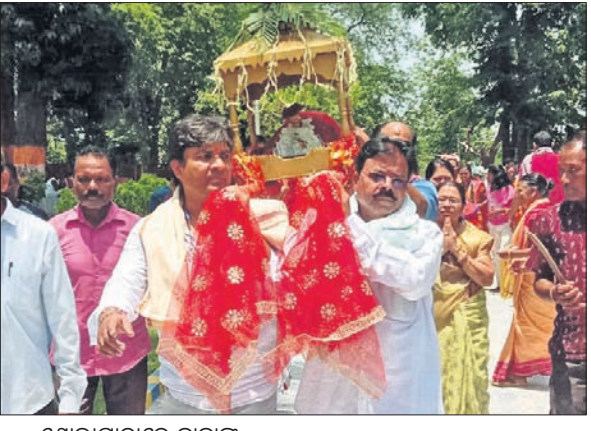
ଶୋଭାଯାତ୍ରାରେ ବାବାଙ୍କ ପ୍ରତିମାକୁ ସୁସଜ୍ଜିତ ଏକ ପାଲିଙ୍କିରେ ନିଆଯାଇଛି।