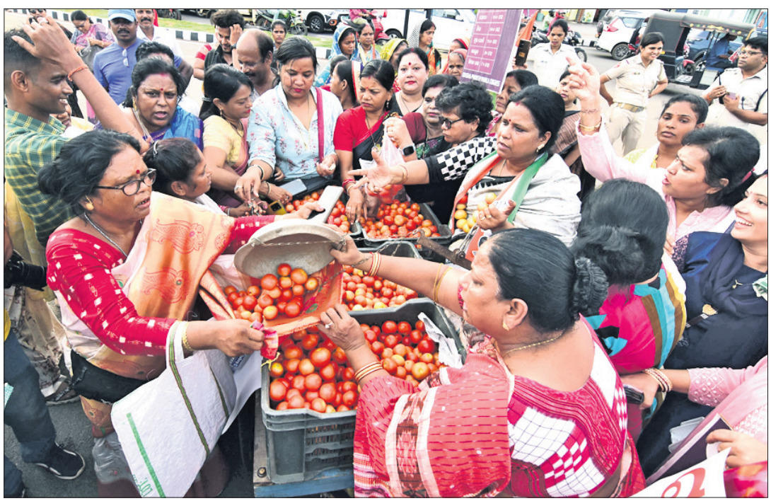
ରାଜ୍ୟରେ ପନିପରିବାର ଅହେତୁକ ଦରଦାନ ବୃଦ୍ଧ ପ୍ରତିବାଦରେ କେନ୍ଦ୍ର ଓ ରାଜ୍ୟ ସରକାରଙ୍କୁ ବିରୋଧ କରି ମହିଳା କଂଗ୍ରେସ ପକ୍ଷରୁ ସାମାଜିକ ଭୁବନେଶ୍ୱର ମାଷ୍ଟରକ୍ୟାଣ୍ଟିନରେ ୬୦ ଟଙ୍କାରେ ବନାଗୋ ବିକ୍ରୟ କରାଯାଇଛି।