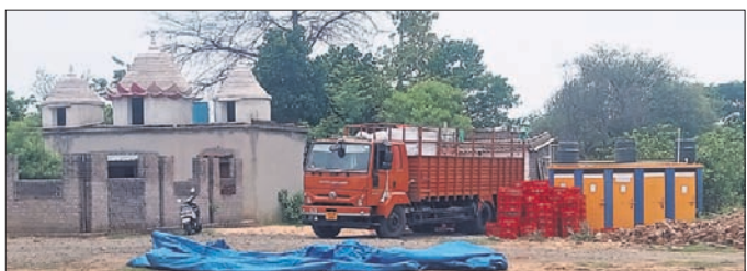
ଶୌଚାଳୟ ସମ୍ପୂର୍ଣ୍ଣରେ ଗାଡ଼ି ରଖାଯାଇଛି ।

ରାଉରକେଲା ଛେଷ୍ଟରେ ଥିବା ଉପାଖରେ ପାଠକୁ ଦୈନିକ ଶତାଧିକ ଶ୍ରମିକଙ୍କୁ ଆସିଥାନ୍ତି । ପାଠରେ ବିବାହ, ବ୍ରତପଥର ଭଳି ମାଳିକ କାର୍ଯ୍ୟ ମଧ୍ୟ ହୋଇଥାଏ ।