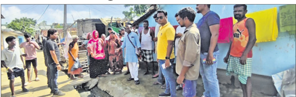
ପ୍ରଶାନ୍ତ ସେଠୀ ବସ୍ତିବାସିନ୍ଦାଙ୍କ ସହ ଆଲୋଚନା କରୁଛନ୍ତି ।