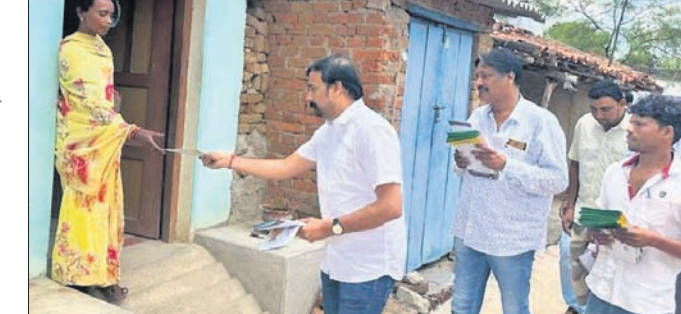
ସୋହେଲା ବ୍ଲକରେ ଭାଜପା କାର୍ଯ୍ୟକର୍ତ୍ତାଙ୍କ ଜନସମ୍ପର୍କ ଅଭିଯାନ ।