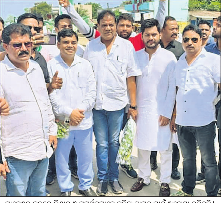
ମାନେଶ୍ୱର ଛକରେ ବିଶାଳ ଓ ସମର୍ଥକମାନେ ବବିଙ୍କୁ ସ୍ୱାଗତ ପାଇଁ ଅପେକ୍ଷା କରିଛନ୍ତି।

ସମ୍ବଲପୁରରେ ନବ ସମର୍ଥକଙ୍କ ମଧ୍ୟରେ ଉତ୍ସାହ ସମ୍ବଲପୁର, ୩୭(ଶୁଭାଶିଷ ପାଠା)