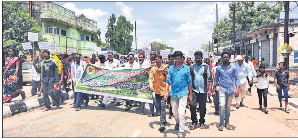
କେନ୍ଦ୍ରପତ୍ର ଶ୍ରମିକମାନେ ଉପଜିଲାପାଳଙ୍କ ଅଫିସକୁ ବିକ୍ଷୋଭ ଶୋଭାଯାତ୍ରାରେ ବାହାରିଛନ୍ତି ।