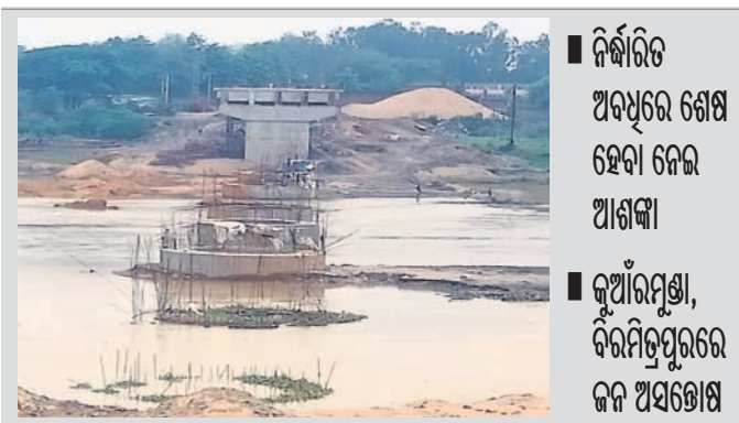
ନିର୍ଦ୍ଧାରିତ ଅବଧିରେ ଶେଷ ହେବା ନେଇ ଆଶଙ୍କା କୂଆଁରମୁଣ୍ଡା, ବିରମିତ୍ରପୁରରେ ଜନ ଅସନ୍ତୋଷ

ରାଉରକେଲା ନିକଟ କୋଏଲ ନଦୀ ଉପରେ ଯମୁନାନାକୀ-ଟିସେ ବ୍ରିଜ୍ ନିର୍ମାଣ କାର୍ଯ୍ୟ ମନ୍ଦର ରିଟିରେ ରାହିଛି । କାର୍ଯ୍ୟ ଅବଧି ପୂରଣକୁ ଆଉ ମାତ୍ର ୫ ମାସ ବାକି ରହିଥିବା ବେଳେ ବ୍ରିଜ୍ ୫୦ଭାଗ କାମ ସମ୍ପୂର୍ଣ୍ଣ ହୋଇନାହିଁ ।