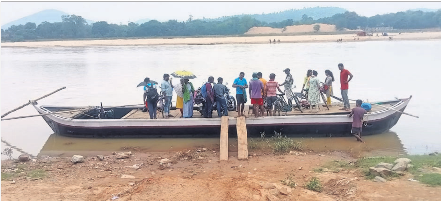
ବିପଦସଙ୍କୁଳ ଯାତ୍ରା: ରାଉରକେଲା ନିକଟ କୋଏଲ ନଦୀର ହରିପୁର ଘାଟରେ ବନ୍ୟାପୀଡ଼ି ଆସି ବାଉଁଶ ପୋଲ ଭାସିଯିବାରୁ ଲୋକମାନେ ଡଙ୍ଗାରେ ନଦୀ ପାର ହେଉଛନ୍ତି । (ଫଟୋ: ବିବେକ)

ରାଉରକେଲା, ୩।୭ (ବିପ୍ଳବ ରଞ୍ଜନ ଦାଶ): ରାଉରକେଲା-୧୫ ଟିସେ ଛାତ୍ରୀ ସିଡିଙ୍ଗ କଲୋନୀରେ ଆରମ୍ଭିତ ପକ୍ଷରୁ ନିର୍ମିତ ୨୦ଟି ସାର୍ବଜନୀନ ଶୌଚାଳୟରେ ପାଣି ବ୍ୟବସ୍ଥା ନାହିଁ । ଫଳରେ କଲୋନୀ ବାସିନ୍ଦା ଅସୁବିଧା ଭୋଗୁଛନ୍ତି ।