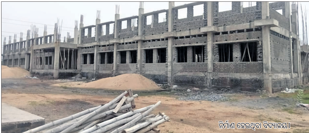
ନିର୍ମାଣ ହେଉଥିବା ବିଦ୍ୟାଳୟ।

ସୁନ୍ଦରଗଡ଼ ଜିଲ୍ଲା କୁନ୍ତା ବ୍ଲକ କୁଡ଼ାକଟାଠାରେ ନିର୍ମାଣ ହେଉଥିବା ଓଡ଼ିଶା ଆଦର୍ଶ ବିଦ୍ୟାଳୟର କାମ ମନ୍ଦର ଗତିରେ ଚାଲୁଛି। ୪ ବର୍ଷ ବିତିଯାଇଥିଲେ ମଧ୍ୟ ଆଜି ପର୍ଯ୍ୟନ୍ତ ନିର୍ମାଣ କାର୍ଯ୍ୟ ଶେଷ ହୋଇ ନ ଥିବାରୁ ଛାତ୍ରଛାତ୍ରୀ ଅଭିଯୋଗ କରିଥିଲେ। ମଧ୍ୟ କୌଣସି ସୁଫଳ ମିଳିପାରୁନାହିଁ। ଏହି ବିଦ୍ୟାଳୟ ନିର୍ମାଣ ପାଇଁ ୨୦୧୮-୧୯ ଆର୍ଥିକ ବର୍ଷରେ ଜିଲ୍ଲା ଖଣିଜ ପତାଏ ପ୍ରତିଷ୍ଠାନ ପକ୍ଷରୁ ୩ କୋଟି ୫୩ ଲକ୍ଷ ୫୨ହଜାର ଟଙ୍କା ମଞ୍ଜୁର କରାଯାଇଥିଲା। ଗ୍ରାମ୍ୟ ନିର୍ମାଣ ବିଭାଗର ପକ୍ଷରୁ ଠିକାଦାରଙ୍କ ଦ୍ୱାରା ନିର୍ମାଣ କାର୍ଯ୍ୟ ଆରମ୍ଭ ହୋଇଥିଲା। ହେଲେ ଆଜି ପର୍ଯ୍ୟନ୍ତ ନିର୍ମାଣ କାର୍ଯ୍ୟ ଶେଷ ହୋଇପାରିନାହିଁ। ଗତବର୍ଷଠାରୁ ପ୍ରାଥମିକ ଅବସ୍ଥାରେ ଅଧ୍ୟାୟାଭାବେ କୁନ୍ତା ଉଚ୍ଚମ୍ଭୂତ ବିଦ୍ୟାଳୟ ପରିସରରେ ୨ଟି ଶ୍ରେଣୀଗୃହରେ ପ୍ରଥମ ବର୍ଷ ପାଠପଢ଼ା ଆରମ୍ଭ ହୋଇଥିଲା। ଚଳିତ ବର୍ଷ ପୁଣି