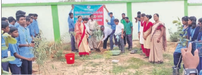
ବିଦ୍ୟାଳୟ ପରିସରରେ ବୃକ୍ଷରୋପଣ କରାଯାଇଛି।