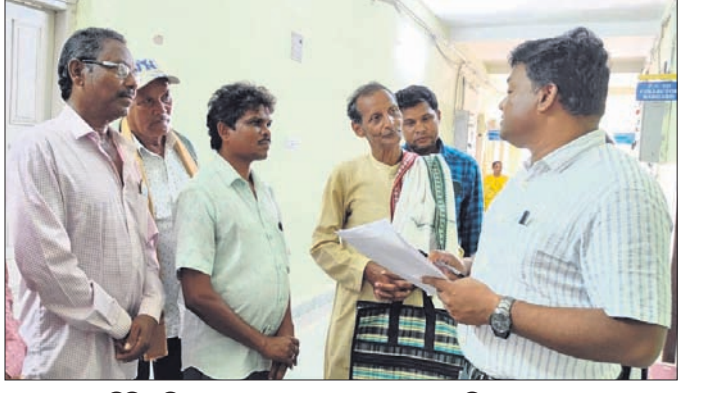
ଗ୍ରାମବାସୀ ଅତିରିକ୍ତ ଜିଲ୍ଲାପାଳଙ୍କୁ ସ୍ମାରକପତ୍ର ପ୍ରଦାନ କରୁଛନ୍ତି ।

ବରଗଡ଼ ଜିଲ୍ଲା ଚାରପାଲି ପଞ୍ଚାୟତର ଗାନ୍ଧୀନୀଙ୍କ ଲାୟରଜୁନା ଗ୍ରାମରେ ଏକ ନୂଆ ଧାନମଣ୍ଡି ଖୋଲିବାକୁ ଦାବି କରିଛନ୍ତି। ଏହି ଦାବି ନେଇ ମଙ୍ଗଳବାର ଗ୍ରାମର ଏକ ଗାନ୍ଧୀ ପ୍ରତିନିଧି ଦଳ ଜିଲ୍ଲାପାଳଙ୍କୁ ଫେରାଦ ହୋଇଥିଲେ। ଜିଲ୍ଲାପାଳ ମୋନିଟିଂ ବାନ୍ଦାକାର୍ଯ୍ୟ ଅନୁପଞ୍ଚିତରେ ଅତିରିକ୍ତ ଜିଲ୍ଲାପାଳ ନିର୍ଦ୍ଦେଶ ଦେଇଛନ୍ତି। ଉକ୍ତ ପରିବା ବଜାର ଅଞ୍ଚଳର ଗାନ୍ଧୀନୀଙ୍କ ଦ୍ୱାରା ପରିଚାଳିତ ହେଉଛି। ଫଳରେ ବଜାରକୁ ଯୋଗୁଁ କୌଣସିକ୍ରମେ ସ୍ଥାନାନ୍ତର କିମ୍ବା ନିର୍ମାଣ କରିବାକୁ ଦିଆଯିବନାହିଁ ବୋଲି ଦେଇଛନ୍ତି। ଆବଶ୍ୟକ ହେଲେ ନିଷ୍ପତ୍ତି ବିରୋଧରେ ଗାନ୍ଧୀନୀ ଆନ୍ଦୋଳନକୁ ପ୍ରସ୍ତୁତ କରିଥିଲେ।