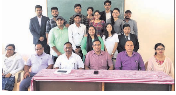
ସାର୍ବିଫିକେଟ ବଣ୍ଟନ କାର୍ଯ୍ୟକ୍ରମରେ ଅତିଥିଙ୍କ ଗହଣରେ ଛାତ୍ରଛାତ୍ରୀ ।