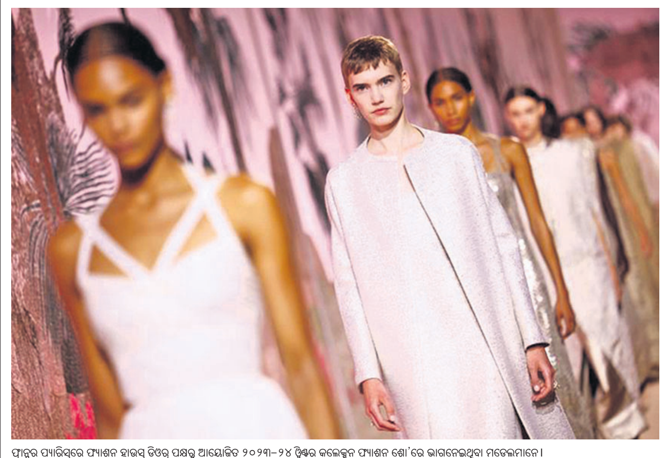
ଫ୍ରାନ୍ସର ପ୍ୟାରିସ୍‌ରେ ଫ୍ୟାଶନ ହାଇସ୍ପେଡ୍ ପକ୍ଷରୁ ଆୟୋଜିତ ୨୦୨୩-୨୪ ଫ୍ରିଣ୍ଡ୍‌ସ୍ କଲେକ୍ସନ୍ ଫ୍ୟାଶନ ଶୋ'ରେ ଭାରତକୁ ପଠାଇଥିବା ମଡେଲମାନେ।

ଆସିଲା ତାହା ବୁଝିବାକୁ ତେଷ୍ଟା ଚାଲିଥିବା ସିକ୍ରେଟ୍ ସର୍ଭିସ୍ ପୁଣ୍ୟପାତ୍ର ଆଖ୍ୟାନ୍ତର ଗୁମାସ୍ତାଙ୍କୁ ମୁତନା ଦେଇଛନ୍ତି। ହାଇଲ୍ ପାଉଡର ନେଇ କୌଣସି ବିପଦ ନ ଥିବା ଅନୁଶୀଳନ ବିଭାଗ କହିଛି। ତେବେ ପାଉଡର ମିଳିବା ସମୟରେ ହାଇଲ୍ ହାଇସ୍ପେଡ୍ ଉପସ୍ଥିତ ଜୋ ବାଲଡେନ୍ ଉପସ୍ଥିତ ନ ଥିଲେ। ହାଇଲ୍ ହାଇସ୍ପେଡ୍ କେଉଁ ସ୍ଥାନକୁ ଏବଂ କେତେ ପରିମାଣର ହାଇଲ୍ ପାଉଡର ମିଳିଛି, ସେ ସମ୍ପର୍କରେ ସୂଚନା ଦେବା ଲାଗି ସିକ୍ରେଟ୍ ସର୍ଭିସ୍ ପକ୍ଷରୁ ମନା କରାଯାଇଛି।