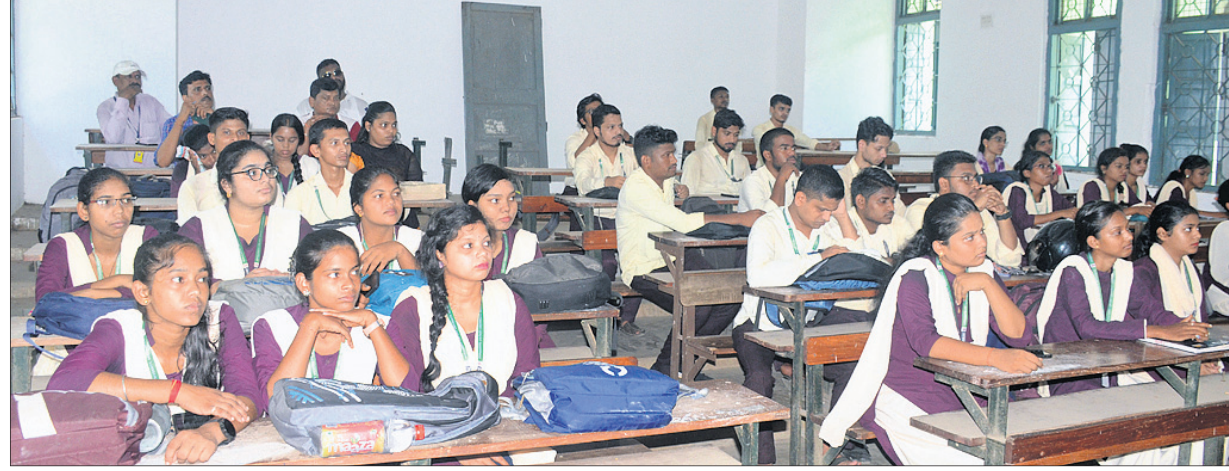
ପ୍ରତିଯୋଗିତାରେ ଭାଗ ନେଇଥିବା ଉପସ୍ଥିତ ଛାତ୍ରାଛାତ୍ରୀ ।