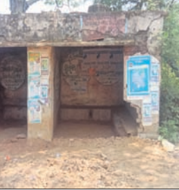
ଉଦ୍ଦେଶ୍ୟରେ ଛକରେ ବିପଦସଙ୍କୁଳ ଅବସ୍ଥାରେ ଥିବା ଯାତ୍ରା ପ୍ରତୀକ୍ଷାଳୟ ।

ବରଗଡ଼ ଜିଲ୍ଲା ଭେଟେନ ବ୍ଲକ ଗୋଡ଼ଭଗା-ସୋନପୁର ୫୪ ନମ୍ବର ରାଜ୍ୟ ରାଜପଥର ଉଦ୍ଦେଶ୍ୟରେ ଉଦ୍ଦେଶ୍ୟ ଥିବା ଯାତ୍ରା ପ୍ରତୀକ୍ଷାଳୟ ବିପଦସଙ୍କୁଳ ଅବସ୍ଥାରେ ରହିଛି। ଏହାର କାନ୍ଧରେ ବଡ଼ ବଡ଼ ଫାଟ ସୃଷ୍ଟି ହେବା ସହ ଛାତରୁ ଅତଡ଼ା ଖସୁଛି। ଯାତ୍ରା ପ୍ରତୀକ୍ଷାଳୟରେ ଉଦ୍ଦେଶ୍ୟ ଦେଖିବାକୁ ଗ୍ରାମବାସୀଙ୍କ ସମେତ ସମ୍ବଲପୁର ଜିଲ୍ଲାରୁ ମହାନଦୀ ଫେରିଯାଉ ପାରି ହୋଇ ଆସୁଥିବା ଯାତ୍ରୀମାନେ ଖରା, ବର୍ଷା ବାହରୁ ରକ୍ଷା ପାଇବା ପାଇଁ ଆଶ୍ରୟ ନେଇଥାନ୍ତି। ଏ ନେଇ ସ୍ଥାନୀୟ ଲୋକେ ପ୍ରଶାସନର ଦୃଷ୍ଟି ଆକର୍ଷଣ କରିଥିଲେ ମଧ୍ୟ କୌଣସି ପ୍ରକାର ମିଳିପାରିନାହିଁ । ଏଠାରେ ଏକ ନୂତନ ଯାତ୍ରା ପ୍ରତୀକ୍ଷାଳୟ ନିର୍ମାଣ କରିବାକୁ ଦାବି ହେଉଛି।