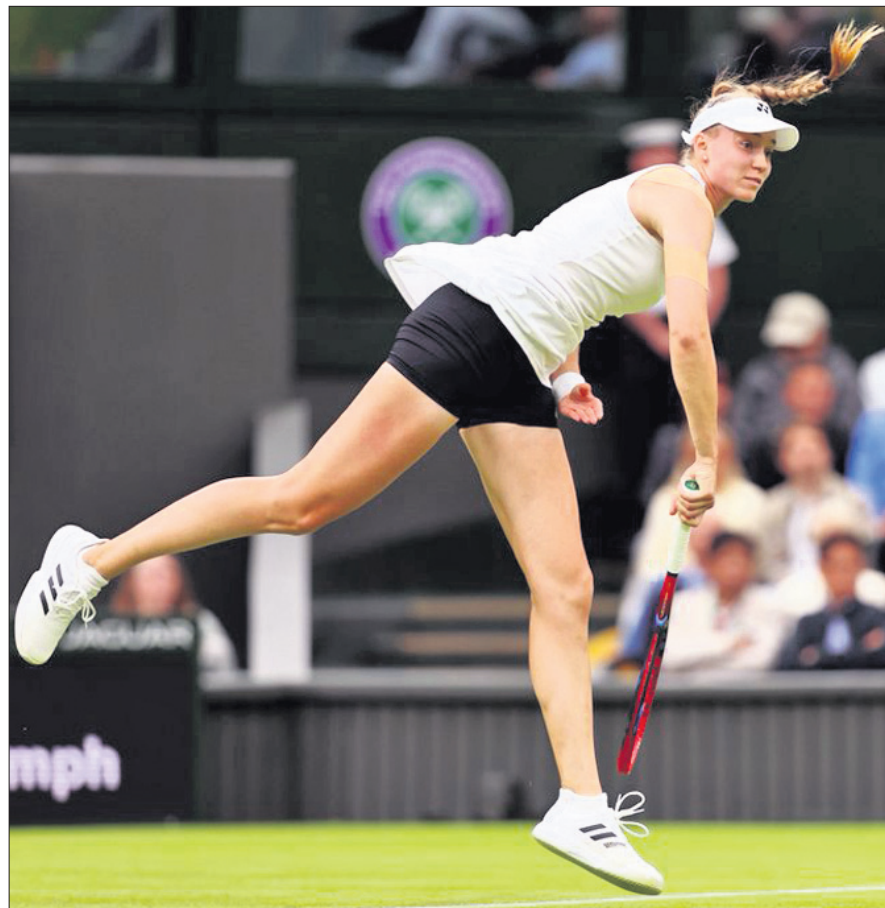
ରିଟର୍ଣ୍ଣ ଶର୍ ଖେଳିବା ଅବସରରେ ଏଲିନା ରିବାକିନା।

ଓସେଲଟନ୍, ୪୭ (ପି.ଟି.) ସର୍ବପୁରାତନ ଚେନିସ୍ ଗ୍ରାଣ୍ଡସ୍ଲାମ ଓସେଲଟନ୍ର ଦ୍ୱିତୀୟ ଦିନରେ ବର୍ଷା କାରଣରୁ ଏକାଧିକ ମ୍ୟାଚ୍ ବାଧାପ୍ରାପ୍ତ ହୋଇଛି। ତେବେ ପୁରୁଷ ଚମ୍ପିୟନ୍ ସିଡ୍ ଖେଳାଳି କାର୍ଲୋସ୍ ଅଲକାରାଜ ଗାର୍ଟିଆ, ଜାନିକ୍ ସିନର ଓ ମହିଳା ସିଙ୍ଗଲରେ ଡିଫେଣ୍ଡିଂ ଚାମ୍ପିୟନ ଏଲିନା ରିବାକିନା ଦ୍ୱିତୀୟ ରାଉଣ୍ଡରେ ପ୍ରବେଶ କରିଛନ୍ତି। ପୁରୁଷ ବର୍ଗରେ