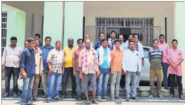
ଜିଲ୍ଲାପାଳଙ୍କୁ ଫେରାଦ ହୋଇଥିବା ଗାନ୍ଧୀ ପ୍ରତିନିଧିଦଳ । ଅତିରିକ୍ତ ଜିଲ୍ଲାପାଳ ସ୍ମାରକପତ୍ର ଗ୍ରହଣ କରୁଛନ୍ତି ।

ବରଗଡ଼ ସହର ଉପକଣ୍ଠ ବରାହଗୋଡ଼ା କେନାଲ ଛକରେ ରହିଥିବା ପରିବା ବଜାର ସ୍ଥାନାନ୍ତର ପାଇଁ ପ୍ରଶାସନିକ ପ୍ରକ୍ରିୟା ମସୁଧା ଆରମ୍ଭ ହୋଇଛି। ଏହି କ୍ରମରେ ଉକ୍ତ ବଜାରକୁ ଆସନ୍ତା ୬ ମାସରେ ନିର୍ମାଣ ପାଇଁ ପଞ୍ଚାୟତ ସମିତି ପକ୍ଷରୁ ନୋଟିସ ଜାରି କରାଯାଇଥିବା ଗାନ୍ଧୀନୀ ଅଭିଯୋଗ କରିଛନ୍ତି। ପ୍ରଶାସନର ଏକ ଆକ୍ଟିଭିଟି ନେଇ ପୁଣି ଗାନ୍ଧୀ ଅସନ୍ତୋଷ ଟେକି ଉଠିଛି। ପରିବା ବଜାର ନିର୍ମାଣକୁ ବିରୋଧ କରି ମଙ୍ଗଳବାର ଏକ ଗାନ୍ଧୀ ପ୍ରତିନିଧି ଦଳ ଜିଲ୍ଲାପାଳଙ୍କୁ ଫେରାଦ ହୋଇଥିଲେ। ଜିଲ୍ଲାପାଳ ମୋନିଟିଂ ବାନ୍ଦାକାର୍ଯ୍ୟ ଅନୁପଞ୍ଚିତରେ ଅତିରିକ୍ତ ଜିଲ୍ଲାପାଳ ନିର୍ଦ୍ଦେଶ ଦେଇଛନ୍ତି। ଉକ୍ତ ପରିବା ବଜାର ଅଞ୍ଚଳର ଗାନ୍ଧୀନୀଙ୍କ ଦ୍ୱାରା ପରିଚାଳିତ ହେଉଛି। ଫଳରେ ବଜାରକୁ ଯୋଗୁଁ କୌଣସିକ୍ରମେ ସ୍ଥାନାନ୍ତର କିମ୍ବା ନିର୍ମାଣ କରିବାକୁ ଦିଆଯିବନାହିଁ ବୋଲି ଦେଇଛନ୍ତି। ଆବଶ୍ୟକ ହେଲେ ନିଷ୍ପତ୍ତି ବିରୋଧରେ ଗାନ୍ଧୀନୀ ଆନ୍ଦୋଳନକୁ ପ୍ରସ୍ତୁତ କରିଥିଲେ।