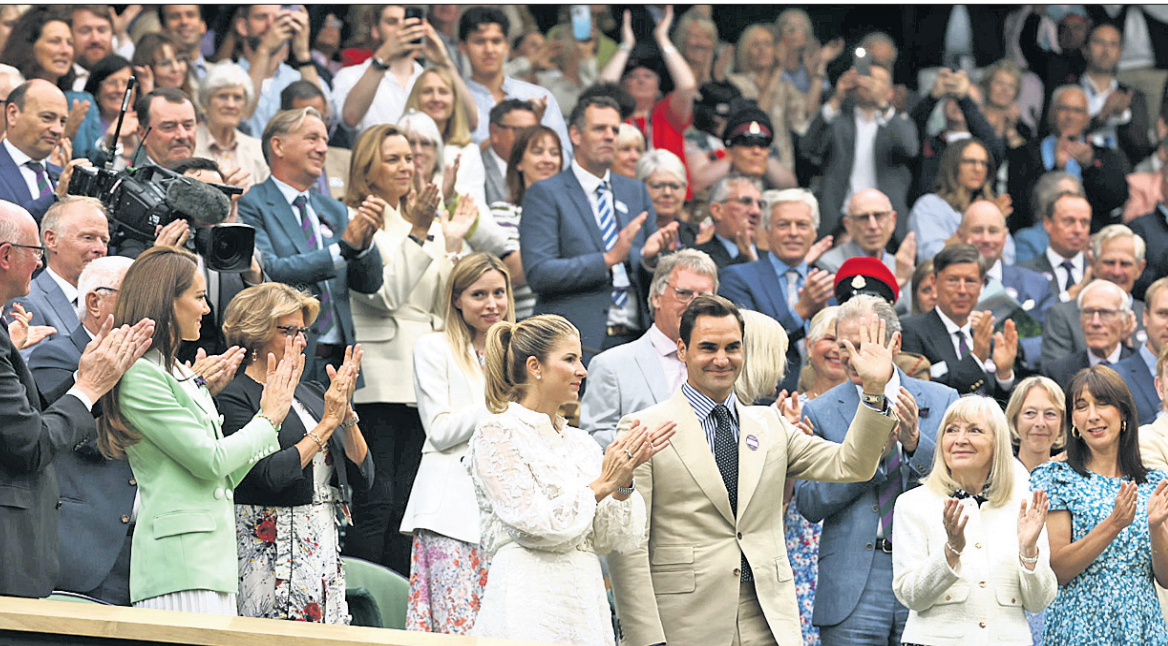
ଓସେଲଟନ୍ ଗ୍ରାଣ୍ଡସ୍ଲାମ ଦେଖିବାପାଇଁ ମଙ୍ଗଳବାର ଦର୍ଶକ ସ୍ୱାସ୍ଥ୍ୟରେ ସ୍ତ୍ରୀ ମିଳିବା ସହ ରୋଜର ଫେଡେରର।

ଅଧିକାର କରିଥିବା ଏଫ୍.ଏସ୍. ପ୍ରଣୟ ହେଉଛି ପୁରୁଷ ସିଙ୍ଗଲରେ ଶ୍ରେଷ୍ଠ ର୍ୟାକିଙ୍ଗପ୍ରାପ୍ତ ଖେଳାଳି। ଲକ୍ଷ୍ୟ ସେନ ଓ ଜିତାସି ଶ୍ରୀକାନ୍ତ ସାଧୁମେ ୧୯ତମ ଓ ୨୦ତମ ସ୍ଥାନରେ ଅଛନ୍ତି ମହିଳା ଡବଲ୍ରେ ତ୍ରିପା ଜୋଲି ଓ ଗାୟତ୍ରୀ ଗୋପାତାୟ ଗୋଟିଏ ସ୍ଥାନ ତଳକୁ ଖସି ୧୭ତମ ସ୍ଥାନରେ ଅଛନ୍ତି। ସଦ୍ୟ ପ୍ରକାଶିତ ର୍ୟାକିଙ୍ଗ ଡାଲିକାରେ ପୁରୁଷ ଡବଲ୍ ଯୋଡ଼ି ଏମ୍.ଆର୍. ଅଜୁନ ଓ ଧ୍ରୁବ କାପିଲ ୨୬ତମ ସ୍ଥାନରେ ରହିଥିବା ବେଳେ ରୋହଣି କାପୁର ଓ ଏନ୍. ସିଦ୍ଧି ଯୋଡ଼ି ହୋଇଛନ୍ତି। ୮ମ ସ୍ଥାନ