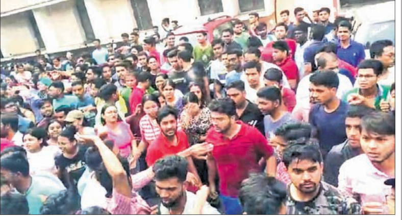
ଭିନ୍ନଭିନ୍ନ ପରିସରରେ ବସ୍ତୁ ଘେରିଥିବା ଛାତ୍ରାଛାତ୍ରୀ

ପ୍ରକାର ରୋଗ ସୃଷ୍ଟିକୁ ଦିନକୁ ୨ ଓଳି କିମ୍ବା କେବଳ ରାତିରେ ଦାଢ ଘସିଲେ ଏ ପ୍ରକାର ସମସ୍ୟାକୁ ଦୂର କରିହେବ ତା' ଗୁରୁତ୍ୱ। ଖାଇବା ପରେ ଖାଦ୍ୟର କିଛି ଗୁଳୁଳୁ ଦାଢ ଘସିଲେ ଜମା ହେବାରୁ ଦାଢରେ ଏକ ଆସ୍ତର ପଡ଼ିଯାଏ। ଏଥିରୁ ବ୍ୟାକ୍ଟେରିଆ ସୃଷ୍ଟି ହୋଇଥାନ୍ତି। ସେଥିପାଇଁ ରାତିରେ ଶୋଇବା ପୂର୍ବରୁ ନିୟମିତ ଦାଢ ଘସି ପାଟି ସଫା କରିବାର ଆବଶ୍ୟକ ଅଛି। ଫଳରେ ହୃଦ୍‌କମ୍ପିତ ରୋଗ ସମେତ ଅନ୍ୟ ସ୍ୱାସ୍ଥ୍ୟଗତ ସମସ୍ୟାକୁ ଏଡ଼ାଇ ଦିଆଯାଇପାରିବ।