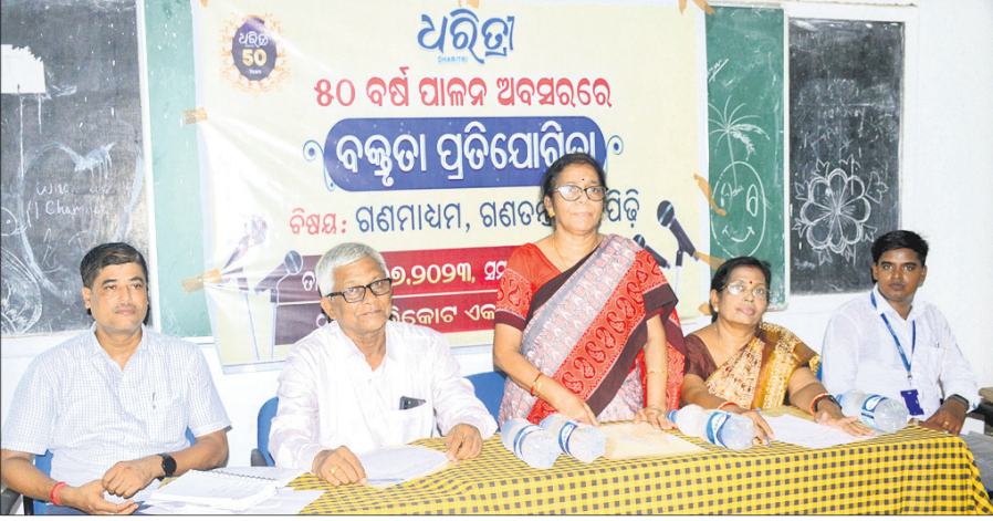
ବ୍ରହ୍ମପୁରସ୍ଥିତ ଖଲ୍ଲିକୋଟ ଏକକ ବିଶ୍ୱବିଦ୍ୟାଳୟରେ ଆୟୋଜିତ ବକ୍ତୃତା ପ୍ରତିଯୋଗିତାରେ ଉପସ୍ଥିତ ଅତିଥି ।