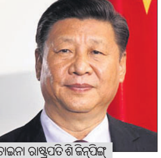
ଚାଇନା ରାଷ୍ଟ୍ରପତି ଶି ଜିନ୍‌ପିଙ୍ଗ

ଧ୍ୟ୍ୟ କରିବା ସହ ସୁବିଚ୍ଛିନ୍ନ କଟକରପକ୍ଷା କରାଇବା ଓ ସେମାନଙ୍କ ମଧ୍ୟରେ ଆତଙ୍କବାଦୀ ବିଚାରଧାରାର ପ୍ରଚାରକୁ ରୋକିବା ଦିଗରେ ପଦକ୍ଷେପ ନେବେ।