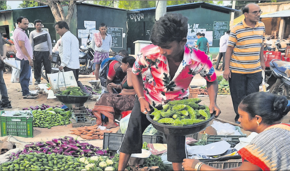
ପଦ୍ମପୁର ପରିବା ବଜାର ।

ପଦ୍ମପୁର ସହରରେ ପରିପରିବା ବଜାର ଏବେ ନିଆଁ ଲାଗିଛି। ପରିବା ଦର ବୃଦ୍ଧି ଯୋଗୁଁ ସାଧାରଣ ଲୋକେ ବଜାର ଯିବାକୁ ଇଚ୍ଛାପ୍ରକାଶ କରୁନାହାନ୍ତି। ହଜାରରେ ଟଙ୍କାରେ ମଧ୍ୟ ବ୍ୟାଗରେ ପରିବା ଜରୁରୀ ହିଁ ସାଧାରଣ ପରିବା କେଳି ପ୍ରତି ୮୦ ଛୁଇଁଲାଣି । ଗତ ପର୍ଯ୍ୟନ୍ତ ଦିନ ପୂର୍ବରୁ ଯେଉଁ ପରିବା ୨୫ ଟଙ୍କା ଥିଲା, ତାହା ଏବେ ୮୦ ଟଙ୍କା। ଭେଣ୍ଡି ୮୦ ଟଙ୍କା, ବାଉଁଶ ୬୦, ପୋଳେ ୮୦, କଲାଇ, କଞ୍ଚି ୧୦୦ ରହିଥିବା ବେଳେ କଞ୍ଚା ଲଙ୍କା ୨୦୦ ଟଙ୍କା ରହିଛି । ସେହିପରି ୧୨୦ ଟଙ୍କାରେ ମନାଗୋ ବିକ୍ରି ହେଉଛି। ବ୍ୟବସାୟୀ ମାନେ ମନଇଚ୍ଛା ଏହି ଦରବୃଦ୍ଧି ବୃଦ୍ଧି କରୁଥିବା ଅଭିଯୋଗ ହେଉଛି। ସପ୍ତହରେ ବୁଲୁଥିବା ହାତ ହେଉଥିବା ବେଳେ ବଜାରକୁ ଗାନ୍ଧୀନୀ ପରିବା ବିକ୍ରି କରିବାକୁ ଆସିଥାନ୍ତି। ହେଲେ ବ୍ୟବସାୟୀ ଗାନ୍ଧୀନୀଙ୍କଠାରୁ କମ୍ ମୂଲ୍ୟରେ ପରିବା କିଣି ଚଳାବେଳେ ବିକ୍ରି