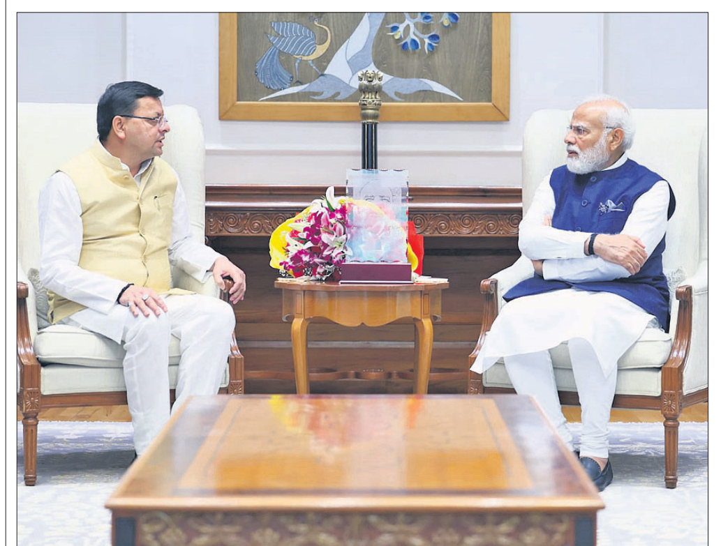
ଉତ୍ତରାଖଣ୍ଡ ମୁଖ୍ୟମନ୍ତ୍ରୀ ପୁଷ୍କର ସିଂ ଧୀନି ନୂଆଦିଲ୍ଲୀରେ ପ୍ରଧାନମନ୍ତ୍ରୀ ନରେନ୍ଦ୍ର ମୋଦିଙ୍କୁ ମଙ୍ଗଳବାର ସୌଜନ୍ୟମୂଳକ ସାକ୍ଷାତ କରିଛନ୍ତି। ରାଜ୍ୟର ବିକାଶ ଲାଗି ମୋଦିଙ୍କ ମାର୍ଗଦର୍ଶନ ପାଇଁ ସେ କୃତଜ୍ଞତା ଜଣାଇ କହିଛନ୍ତି, ପ୍ରଧାନମନ୍ତ୍ରୀଙ୍କ ତତ୍ତ୍ୱାବଧାନରେ ଉତ୍ତରାଖଣ୍ଡ ଇକ୍ ଅଫ୍ ଟୁଡା ବିକାଶ, ପୁଞ୍ଜିନିବେଶ ପ୍ରୋତ୍ସାହନ ଏବଂ ସ୍ୱାତନ୍ତ୍ର୍ୟ କ୍ଷେତ୍ରରେ ନିରନ୍ତର ଭାବେ ବିକାଶ କରୁଛି। ଜାତୀୟ ତଥା ଅନ୍ତର୍ଜାତୀୟ ନିବେଶକମାନଙ୍କୁ ରାଜ୍ୟକୁ ଆକର୍ଷିତ କରିବା ଉଦ୍ଦେଶ୍ୟରେ ୨୦୨୩ ଡିସେମ୍ବର ବିଜ୍ଞାପନ ସମ୍ବନ୍ଧରେ ତେରାହୁନ୍ଦରେ 'ବୈଶ୍ୱିକ ନିବେଶକ ସମ୍ମିଳନୀରେ ୨୦୨୩' ଆୟୋଜନ କରାଯିବ। ଏଥିରେ ମୁଖ୍ୟ ଅତିଥି ଭାବେ ଯୋଗଦେବା ପାଇଁ ପ୍ରଧାନମନ୍ତ୍ରୀଙ୍କୁ ଧୀନି ନିମନ୍ତ୍ରଣ କରିଛନ୍ତି।