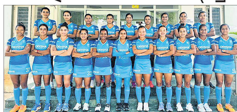
ୟୁରୋପ ଗସ୍ତ ପାଇଁ ମନୋନୀତ ଭାରତୀୟ ମହିଳା ହକି ଦଳ।

ସେ ୬-୨, ୬-୨ ଓ ୬-୨ରେ ସିଡ୍ ଖେଳିବା ସେଟ୍ରେ ପରାସ୍ତ କରିଥିଲେ। ଅନ୍ୟ ସିଡ୍ରେ ଖେଳାଳିଙ୍କ ମଧ୍ୟରେ ଷ୍ଟ୍ରୋନୋସ୍ ସିଡ୍ ଖେଳିବା ଓ ହୋଲ୍ଡର ଗୁନଙ୍କ ପରି ସିଡ୍ରେ ଖେଳାଳିଙ୍କ ବର୍ଷା କାରଣରୁ ବନ୍ଦ ରହିଛି। ମହିଳା ସିଙ୍ଗଲରେ ମାତ୍ର ଗୋଟିଏ ମ୍ୟାଚ୍ ସମ୍ପୂର୍ଣ୍ଣ ହୋଇଥିଲା। ଡିଫେଣ୍ଡିଂ ଚାମ୍ପିୟନ୍ କାକାଖିଆନର ଏଲିନା ରିବାକିନା ଏହି ମ୍ୟାଚ୍ରେ ଆମେରିକାର ସେଲିବି ରୋଜର୍ସଙ୍କୁ ୪-୬, ୬-୧ ଓ ୬-୨ ସେଟ୍ରେ ପରାସ୍ତ କରିଥିଲେ। ସେଲିବି ପ୍ରଥମ ସେଟ୍ରେ ବିଷ୍ଣୁ ମାନ୍ୟତାର ୩ ନମ୍ବର ଖେଳାଳି ରିବାକିନାଙ୍କୁ ପରାସ୍ତ କରିଥିଲେ। ତେବେ ଚମ୍ପିୟନ୍ ପ୍ରତ୍ୟାବର୍ତ୍ତନ ସହିତ ରିବାକିନା ପରବର୍ତ୍ତୀ ବୁଲ୍ ସେଟ୍ରେ ଜିତି ନେଇଥିଲେ। ସେଟ୍ରେ କୋର୍ଟରେ ଖେଳା ଯାଇଥିବା ଏହି ମ୍ୟାଚ୍ ଦେଖିବାକୁ ଚେନିସ୍ କିମ୍ବଦନ୍ତୀ ରୋଜର ଫେଡେରର ଓ ଫ୍ଲେଲ୍ ରାଜକୁମାରୀ ଉପସ୍ଥିତ ରହିଥିଲେ। ଫେଡେରରଙ୍କୁ ନିଜର ଆଦର୍ଶ ମାନ୍ୟତା ଦେବା ରିବାକିନା ମ୍ୟାଚ୍ ପରେ ତାଙ୍କୁ ଧନ୍ୟବାଦ ଜଣାଇଥିଲେ। ମୋର ଆଦର୍ଶ ବର୍ଗ ଷ୍ଟାଣ୍ଡରେ ବସି ମୋ ମ୍ୟାଚ୍ ଦେଖିବା ମୋ ପାଇଁ ଗର୍ବର ବିଷୟ ବୋଲି କହିଥିଲେ ରିବାକିନା।