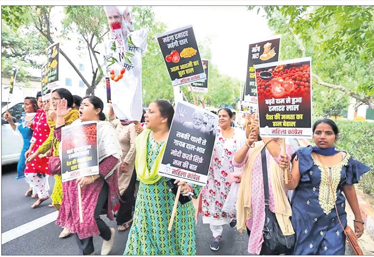
ଦରଦାମ ବୃଦ୍ଧି ବିରୋଧରେ ମହିଳା କଂଗ୍ରେସ ପକ୍ଷରୁ ମଙ୍ଗଳବାର ଦୁଆଦିଲ୍ଲୀରେ କେନ୍ଦ୍ର ସରକାରଙ୍କ ବିରୋଧରେ ବିକ୍ରୟ ପ୍ରଦର୍ଶନ।

କଳାକାରମାନଙ୍କୁ ଅଧିକାର ବିକ୍ରୟ ପ୍ରଦର୍ଶନ କରାଯାଇଛି। କଳାକାରମାନଙ୍କୁ ଅଧିକାର ବିକ୍ରୟ ପ୍ରଦର୍ଶନ କରାଯାଇଛି।