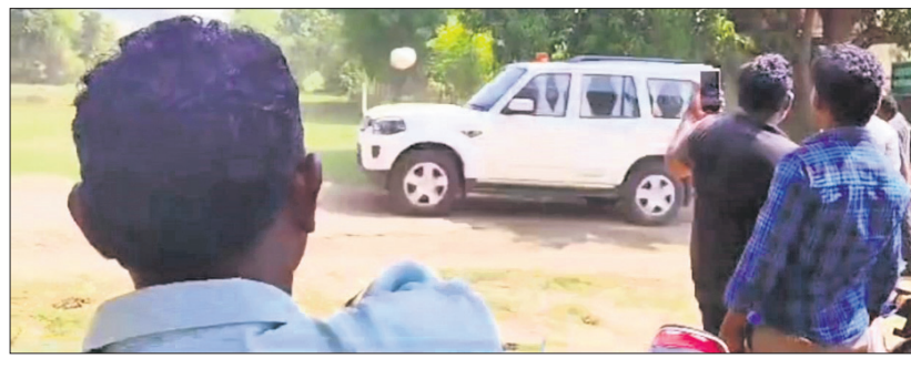
ଏଏପି ପକ୍ଷରୁ ବାମପାର୍ଶ୍ୱରୁ ଛକ ନିକଟରେ ୫-ଟି ସୂଚକ କାର୍ଯ୍ୟକ୍ରମକୁ ଅଣ୍ଟାମାଡ଼ କରାଯାଇଛି।

ସୋନପୁର, ୪୭ (ମୁଖ୍ୟମନ୍ତ୍ରୀ ଶତପଥୀ) ମୁଖ୍ୟମନ୍ତ୍ରୀଙ୍କ ବ୍ୟକ୍ତିଗତ ସୂଚକ ତଥା ୫-ଟି ସୂଚକ ଲି.କେ. ପାଞ୍ଚାମାନଙ୍କ ସୁବର୍ଣ୍ଣପୁର ଜିଲ୍ଲା ଗସ୍ତରେ ଆସିଥିବା ବେଳେ ତାଙ୍କ କାର୍ଯ୍ୟକ୍ରମ ଲକ୍ଷ୍ୟ କରି ଅଣ୍ଟାମାଡ଼ ହୋଇଛି।