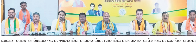
ଭାଜପା ରାଜ୍ୟ କାର୍ଯ୍ୟାଳୟରେ ଆୟୋଜିତ ସୁବିଧାନୀୟ ସାମାଜିକ ଗଣମାଧ୍ୟମ କର୍ମଶାଳାରେ ଉପସ୍ଥିତ ନେତୃତ୍ୱ।