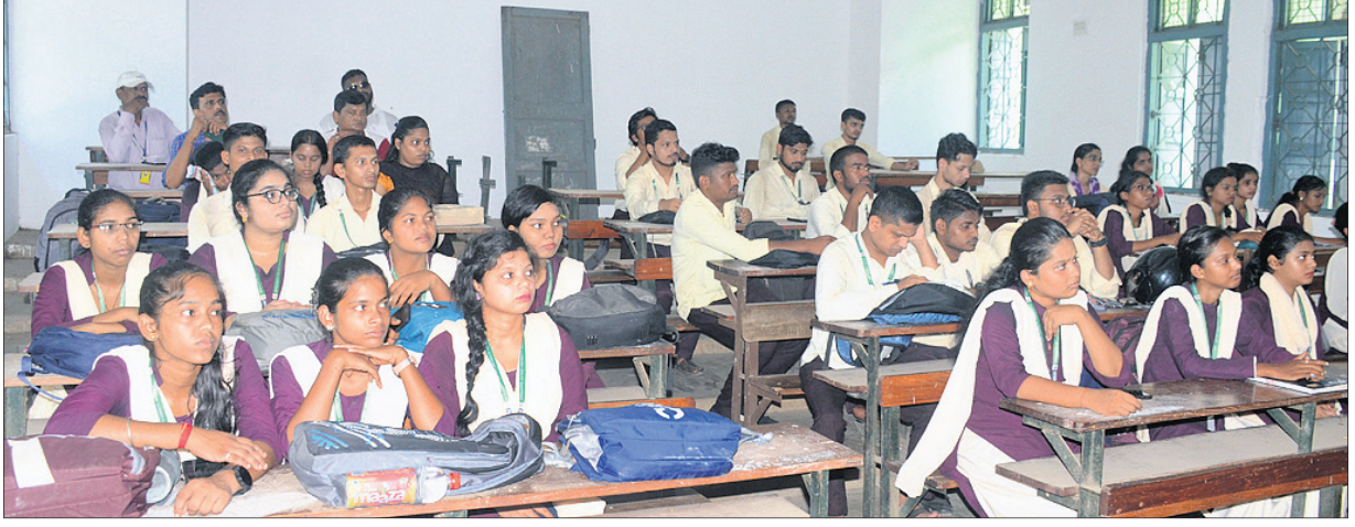
ବ୍ରହ୍ମପୁରରେ ଖଲିକୋଟ ଏକକ ବିଶ୍ୱବିଦ୍ୟାଳୟରେ ଆୟୋଜିତ ବକ୍ତୃତା ପ୍ରତିଯୋଗିତାରେ ଉପସ୍ଥିତ ଅତିଥି।