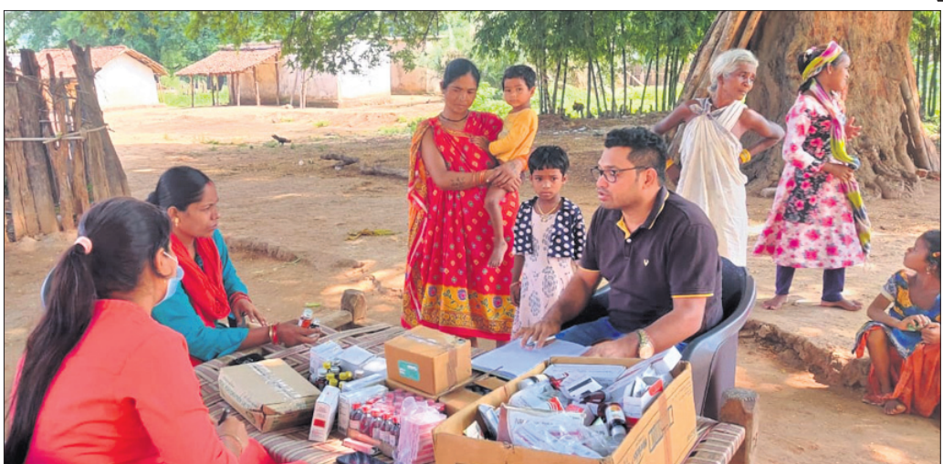
ଚେପଟିଆସା ଗାଁରେ ମେଡିକାଲ ଟିମ୍ ପିଲାଙ୍କ ସ୍ୱାସ୍ଥ୍ୟ ପରୀକ୍ଷା କରୁଛନ୍ତି।

ନବରଙ୍ଗପୁର ଜିଲ୍ଲା ଝରିଗାଁ ବ୍ଲକ ବଡ଼ଚେମରା ପଞ୍ଚାୟତ ଚେପଟିଆସା ଗ୍ରାମରେ ଗତ ୧୫ଦିନ ମଧ୍ୟରେ ୨୦ରୁ ଉର୍ଦ୍ଧ୍ୱ ଶିଶୁ ଚର୍ଚ୍ଚାରୋଗରେ ଆକ୍ରାନ୍ତ ହେବା ଖବର ପ୍ରକାଶ ପରେ ମଙ୍ଗଳବାର ଝରିଗାଁ ସ୍ୱାସ୍ଥ୍ୟ ବିଭାଗର ଏମ୍ବିଏସ୍ ଟିମ୍ ସେଠାରେ ପହଞ୍ଚିଲେ। ଡାକ୍ତରୀ ଟିମ୍ ପହଞ୍ଚିବା ପରେ ସେଠାରେ ସ୍ୱାସ୍ଥ୍ୟସେବା ଯୋଗାଇ ଦିଆଯାଇଛି। ଚେପଟିଆସା