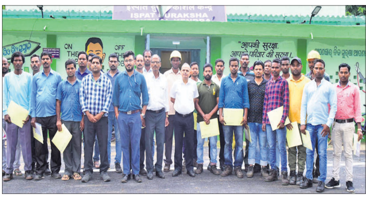
ତାଲିମ ପ୍ରଦାନ ପରେ ଠିକା ଶ୍ରମିକ, ଅଧିକାରୀ।

ଆରବ୍‌ସ୍‌ପି ଇସ୍‌ପାତ ପୁରୁଷା କୌଶଳ କେନ୍ଦ୍ର ଦ୍ୱାରା ଆୟୋଜିତ ହେଉଥିବା ୮୨ ଠିକା ଶ୍ରମିକଙ୍କୁ ଓଡ଼ିଶା ସରକାରଙ୍କୁ ଆରବ୍‌ସ୍‌ପି ପ୍ରକଳ୍ପ ଓ ଗ୍ୟାସ୍‌ ପୁରୁଷା ସମ୍ବନ୍ଧରେ ତାଲିମ ପ୍ରଦାନ କରାଯାଇଛି। ଏହି ଆୟୋଜନରେ ଓଡ଼ିଶା ସରକାରଙ୍କୁ ଆରବ୍‌ସ୍‌ପି ପ୍ରକଳ୍ପ ଓ ଗ୍ୟାସ୍‌ ପୁରୁଷା ସମ୍ବନ୍ଧରେ ତାଲିମ ପ୍ରଦାନ କରାଯାଇଛି। ଏଥିରେ ଓଡ଼ିଶା ସରକାରଙ୍କୁ ଆରବ୍‌ସ୍‌ପି ପ୍ରକଳ୍ପ ଓ ଗ୍ୟାସ୍‌ ପୁରୁଷା ସମ୍ବନ୍ଧରେ ତାଲିମ ପ୍ରଦାନ କରାଯାଇଛି। ଏଥିରେ ଓଡ଼ିଶା ସରକାରଙ୍କୁ ଆରବ୍‌ସ୍‌ପି ପ୍ରକଳ୍ପ ଓ ଗ୍ୟାସ୍‌ ପୁରୁଷା ସମ୍ବନ୍ଧରେ ତାଲିମ ପ୍ରଦାନ କରାଯାଇଛି।