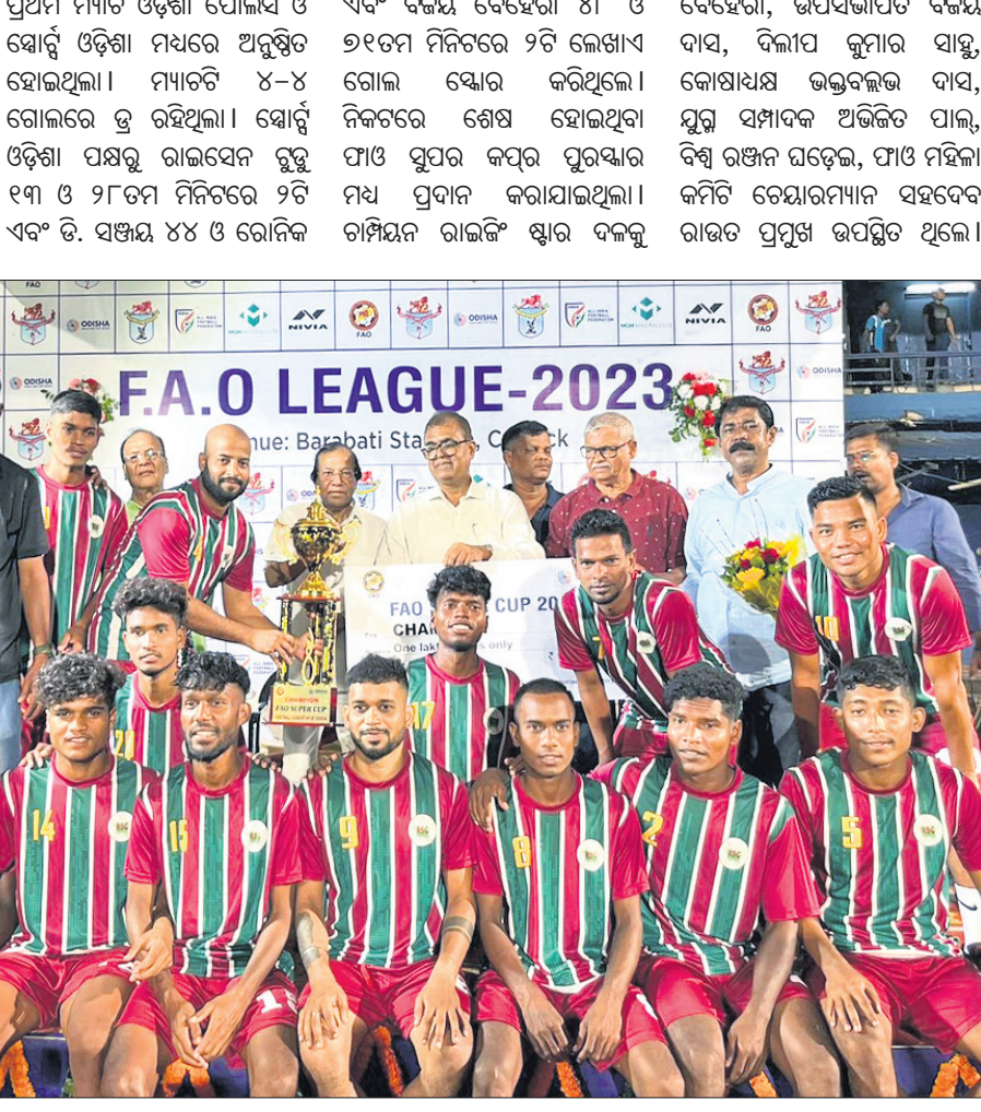
ଫାଓ ସୁପର କପ୍ ଟ୍ରଫି ସହ ଅତିଥିକ ରହଣରେ ରାଜିତି ଷ୍ଟାର ଦଳ।