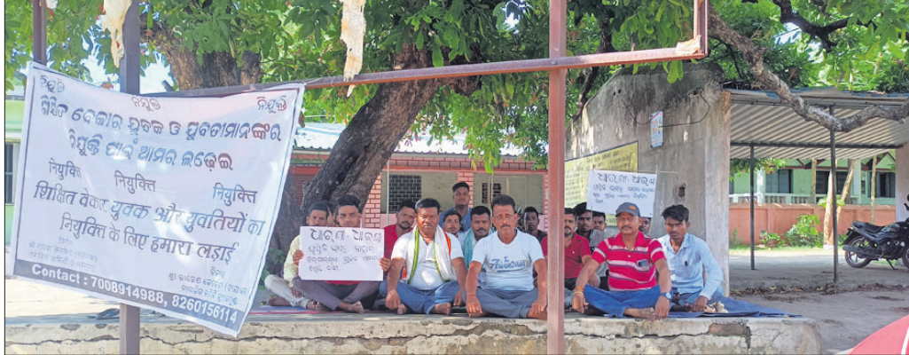
ଛଟେଇ ପ୍ରତିବାଦରେ ଶ୍ରମିକମାନେ ବୁକ୍ କାର୍ଯ୍ୟାଳୟ ସମ୍ମୁଖରେ ଅନଶନରେ ବସିଛନ୍ତି।