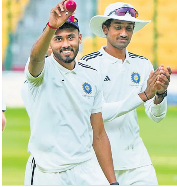
୫ ଉଇକେଟ ହାସଲ ପରେ ବକ୍ ପ୍ରବର୍ତ୍ତନ କରୁଛନ୍ତି ବିପ୍ଲବ କଲେରାୟା।