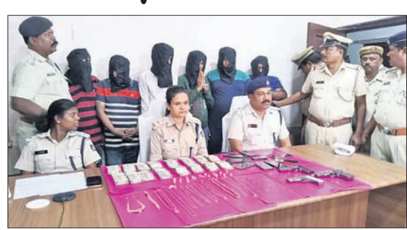
ଖବରଦାତା ସମ୍ପର୍କରେ ଏହି ସାମଗ୍ରିକ ନାଥ ତଦାୟତ ସମ୍ପର୍କରେ ସୂଚନା ଦେଇଛନ୍ତି।