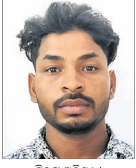
ଗିରପ ଅଭିଯୁକ୍ତ । କୋକସରା, ୫୭ (ବୁଦ୍ଧଜି କୁମାର ପାଟ୍ଟନାୟକ)