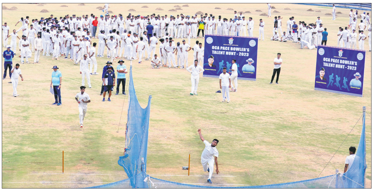
କଟକର ବାରବାଟୀ ଷ୍ଟାଡିୟମରେ ରୁଧିରୀ ଅନୁଷ୍ଠିତ ପେସ୍ ବୋଲର ପ୍ରତିଭା ଅନ୍ୱେଷଣ ଶିବିର।