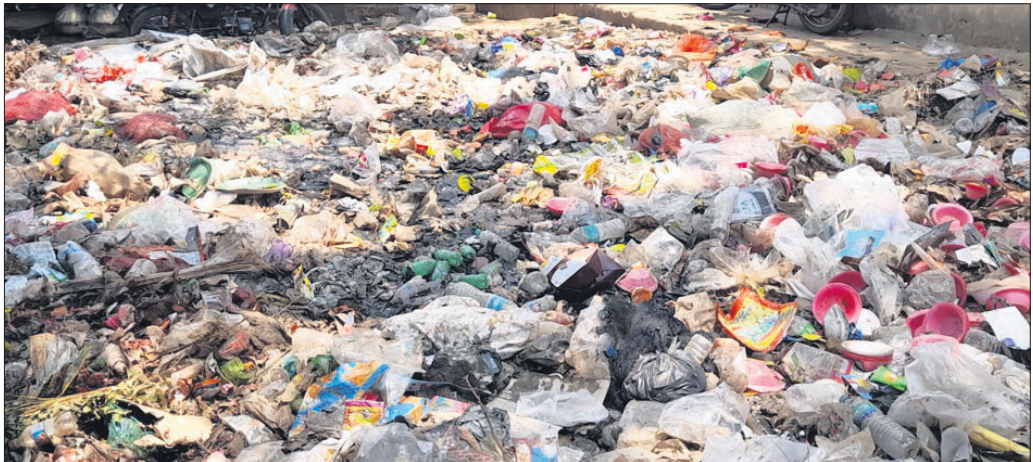
ହାଟରେ ପଡ଼ିଥିବା ଅଳିଆ ଆବର୍ଜନା।