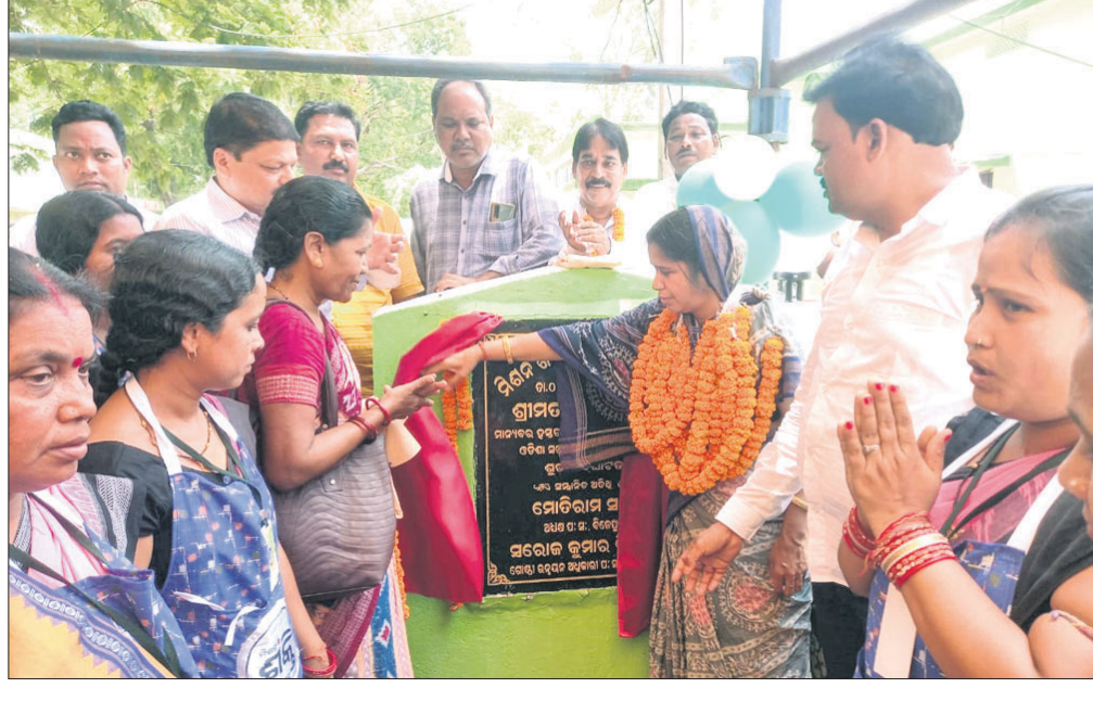
ବିଜେପୁରରେ ମିଶନ ଶକ୍ତି କାଠେ ଉଦ୍ଘାଟନ କରାଯାଇଛି।