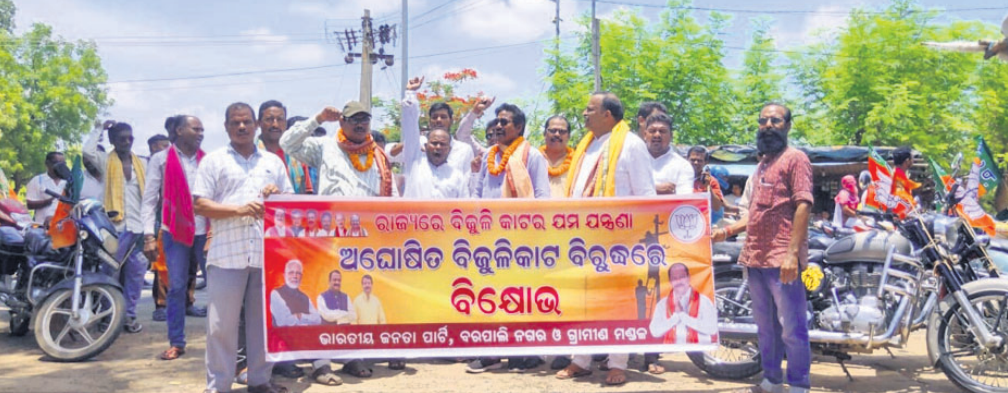
ଶୋଭାଯାତ୍ରାରେ ଭାଜପା କର୍ମକର୍ତ୍ତା।

ଏହାର ପ୍ରତିବାଦରେ ବୁଧବାର ବରପାଲି ବ୍ଲକ୍ ଭାଜପା ପକ୍ଷରୁ ଏକ ବାଇକ୍ ଗାଲି କରାଯାଇ ଗୁମାସ୍ତା ଚାକାର ପାଖର କାଟ୍ ଜନନୀବନକୁ ଅସ୍ତରାସ୍ତର କରିଥିଲା। ଅନ୍ୟପକ୍ଷରେ ଲୋଭାଲୋକଚେତ୍ ଯୋଗୁ ଉଠାଜଳସେଚନ ଉପରେ ନିର୍ଭର କରିବାକୁ ଚାଷୀମାନେ ବାଧାପ୍ରାପ୍ତ ହୋଇଛି।