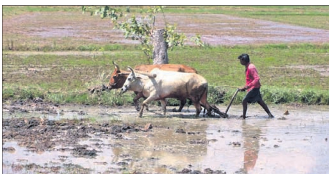
ଗୋବିନ୍ଦପାଲି ଗ୍ରାମର ଜଣେ ଚାଷୀ ଜମି ହଳ କରୁଛନ୍ତି।

ବରଗଡ଼ ଜିଲ୍ଲାରେ ଆରମ୍ଭରୁ ଖରିଫ ଚାଷକାର୍ଯ୍ୟ ବାଧାପ୍ରାପ୍ତ ହୋଇଛି। ଗୋଟିଏ ପଡ଼େ ବିକ୍ଷୟରେ କେନାଳ ପାଣି ଛଡ଼ାଯିବା ଏବଂ ଅନ୍ୟପଡ଼େ ସ୍ୱଚ୍ଛ ବୃକ୍ଷପାତ ଯୋଗୁ ଚାଷୀମାନେ ଚାଷକାର୍ଯ୍ୟକୁ ଆଗେଇ ପାରୁନାହାନ୍ତି। ଅନେକ ଚାଷୀ ଜମିରେ ହଳ ଯୁକ୍ତା କରି ପାରି ନାହାନ୍ତି। ଯେଉଁ ଚାଷୀମାନେ ଜମିକୁ ହଳ କରିଛନ୍ତି ତାହା ମଧ୍ୟ ବର୍ଷାଭାବରୁ ଶୁଖି ଗଲାଣି। ସେହିପରି ଯେଉଁ ଚାଷୀ ତଳିପକା ସହିତ ବିହନ ବୁଣାବୁଣି କରିଥିଲେ ତାହା ମଧ୍ୟ ନଷ୍ଟ ହେବାର ଆଶଙ୍କା ଦେଖାଯାଇଛି। ଖରିଫ ଚାଷକାର୍ଯ୍ୟ ଆରମ୍ଭରୁ ସ୍ୱଚ୍ଛ ବୃକ୍ଷପାତ ଚାଷୀଙ୍କ ପାଇଁ ଏଭଳି ଚିନ୍ତା ବଢ଼ାଇ ଦେଇଛି। ଜିଲ୍ଲାରେ ସର୍ବାଧିକ ଧାନଚାଷ ଲିଆରେ କେନାଳ ଜଳସେଚିତ ଅଞ୍ଚଳରେ ଧାନଚାଷ କରାଯାଉ ଥିବାବେଳେ ସେତେବେଳେ ଅଣଜଳସେଚିତ ଅଞ୍ଚଳର ଚାଷୀଙ୍କ ଧାନଚାଷ ଉଠା ଜଳସେଚନ ଉପରେ ନିର୍ଭର କରିଥାଏ। କିନ୍ତୁ ଖରିଫରେ ଅଣଜଳସେଚିତ ଅଞ୍ଚଳର ଚାଷୀମାନେ