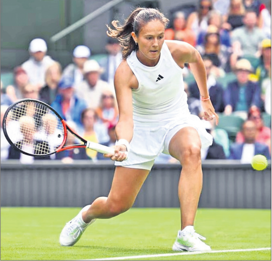
ରିଟର୍ନ ଶର୍ଟ ଖେଳିବା ଅବସରରେ ଡାରିଆ କାସାଚିକିନା।