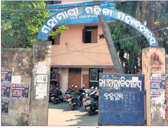
ମହାମାୟା ମହିଳା ମହାବିଦ୍ୟାଳୟ।

ବ୍ରହ୍ମପୁର, ୫୨ (ବ୍ରହ୍ମପୁର ମହାଲିକ) ବ୍ରହ୍ମପୁର ଧର୍ମନଗରଠାରେ ୧୯୮୧ରେ ଆରମ୍ଭ ହୋଇଥିଲା ମହାମାୟା ମହିଳା ମହାବିଦ୍ୟାଳୟ। ୪୨ବର୍ଷ ପୁରାତନ ଏହି ମହାବିଦ୍ୟାଳୟରେ ୧୯୯୧ରେ ଯୁକ୍ତ ୩ ପାଠପଢ଼ା ଆରମ୍ଭ ହୋଇଥିଲା। ବହୁସଂଖ୍ୟକ ଛାତ୍ରୀ ଏଠାରେ ପାଠ ପଢ଼ି ବିଭିନ୍ନ କ୍ଷେତ୍ରରେ ନିଯୁକ୍ତି ପାଇଛନ୍ତି। ଅନେକଙ୍କୁ ସେମାନଙ୍କ ପରିଚୟ ପ୍ରଦାନ କରିଛି ଏହି ମହାବିଦ୍ୟାଳୟ। ବର୍ତ୍ତମାନ ଏଠାରେ ଯୁକ୍ତ ୨ ଓ ଯୁକ୍ତ ୩ କଳା, ବିଜ୍ଞାନ, ବାଣିଜ୍ୟରେ ପ୍ରାୟ ୩୦୦୦ଛାତ୍ରୀ ଅଧ୍ୟୟନରତ। ଗତ ୨୮ତାରିଖରେ ପ୍ରକାଶ ପାଇଥିବା ବ୍ରହ୍ମପୁର ବିଶ୍ୱ ବିଦ୍ୟାଳୟର ଯୁକ୍ତ ୩ ଶସ୍ତ୍ର ସେମିଷ୍ଟର ତଥା ଶେଷ ପରୀକ୍ଷାରେ ମହାମାୟା ମହିଳା ମହାବିଦ୍ୟାଳୟର ପାଠପଢ଼ା ୯୫ ପ୍ରତିଶତ ରହିଛି। ସେହିପରି ୧୦ଜଣ ଛାତ୍ରୀ ବିଭିନ୍ନ ବିଭାଗରେ ବିଶ୍ୱବିଦ୍ୟାଳୟସ୍ତରରେ ରାଜ୍ୟ ହାସଲ କରିଛନ୍ତି। ପାଠପଢ଼ା ବ୍ୟତୀତ ଏନ୍‌ସିସି, ଏନଏସ୍‌ଏସ୍, କ୍ରୀଡ଼ା ଆଦି କ୍ଷେତ୍ରରେ ଏହି ମହାବିଦ୍ୟାଳୟର ଛାତ୍ରୀମାନେ ଅଂଶ ଗ୍ରହଣ କରି ସଫଳତା ହାସଲ କରିଥିବା ନଜିର ରହିଛି। ହେଲେ ଛାତ୍ରୀଙ୍କ ପାଇଁ ଶ୍ରେଣୀଗୃହ ଅଭାବ ରହିଛି।