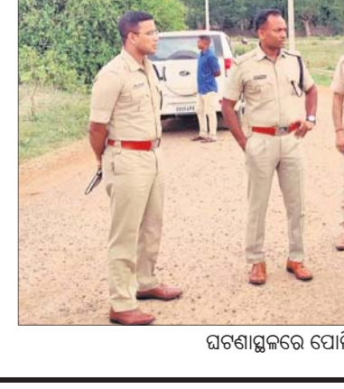
ଘଟଣାସ୍ଥଳରେ ପୋଲିସ୍‌ର ତଦନ୍ତ।