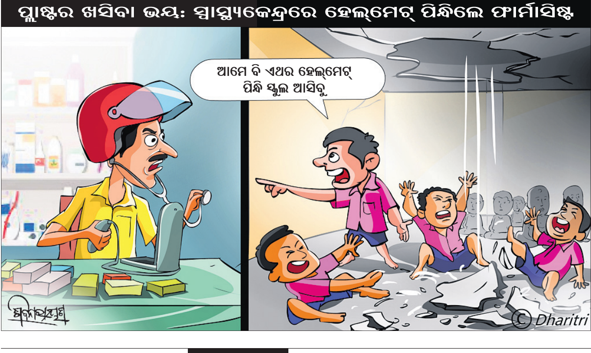
ପ୍ଲାଷ୍ଟର ଖସିବା ଭୟ: ସ୍ୱାସ୍ଥ୍ୟକେନ୍ଦ୍ରରେ ହେଲମେଟ୍ ପିନ୍ଧିଲେ ଫାର୍ମାସିଷ୍ଟ