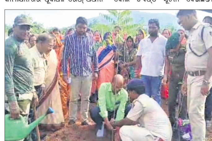
ଅତିଥିମାନେ ଚାରା ରୋପଣ କରୁଛନ୍ତି।