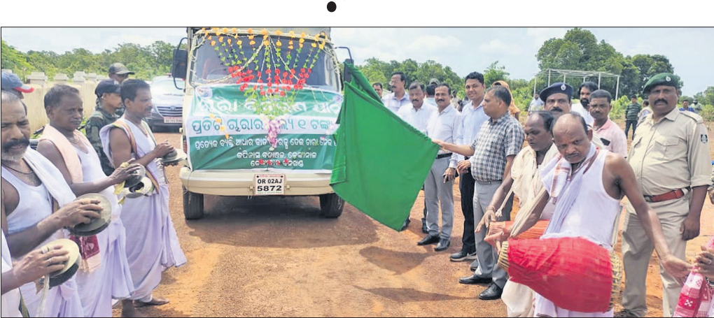
ଚାରା ବିତରଣ ପାଇଁ ଭ୍ରାମ୍ୟମାଣ ଗାଡ଼ିର ଶୁଭାରମ୍ଭ କରାଯାଇଛି।