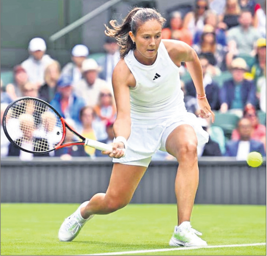
ରିଟର୍ଣ୍ଣ ଶର୍ତ୍ତ ଖେଳିବା ଅବସରରେ ତାରିଆ କାସାଟକିନା।

ଫ୍ରେମଲଡନ, ୫୧୭ ବର୍ଷା ଯୋଗୁ କ୍ରମାଗତ ତୃତୀୟ ଦିବସରେ ଫ୍ରେମଲଡନ ଗ୍ରାଣ୍ଡସ୍ଲାମ ଟେନିସ ଟୁର୍ନାମେଣ୍ଟର ଅନେକ ମ୍ୟାଚ ବାଧାପ୍ରାପ୍ତ ହୋଇଛି। କେବଳ ଇନ୍ଡୋନେସିଆରେ ଖେଳଗୁଡ଼ିକ ସମ୍ପନ୍ନ ହୋଇପାରିଛି। ଅଲ୍ ଇଣ୍ଡୋନେସିଆନ୍ ଫ୍ରେମଲଡନ ଟେନିସ ଟୁର୍ନାମେଣ୍ଟର ଫାଇନାଲରେ କୋର୍ଟ ଓ ଟେଣିସ ଟୁର୍ନାମେଣ୍ଟରେ ଥିବା ଗ୍ରାସ୍‌କୋର୍ଟରେ ମ୍ୟାଚ ଖେଳାଯାଇଛି। ରୁସ୍‌ବାର ମହିଳା ସିଙ୍ଗଲ୍‌ସ୍‌ର ତୃତୀୟ