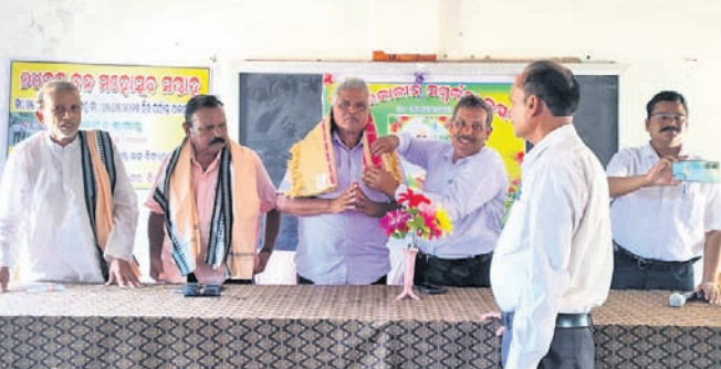
ଶିକ୍ଷକଙ୍କୁ ଅବସର ସମ୍ବର୍ଦ୍ଧନା ଦିଆଯାଇଛି ।

ଅନୁଗୋଳ, ୫୧୭ (ଉପେନ୍ଦ୍ର ରାଉତ) ସମସ୍ତେ ଚାରା ରୋପଣ କରନ୍ତୁ କରାଯାଇଛି । ଏହି ଅବସରରେ ସମସ୍ତେ ଚାରା ରୋପଣ କରନ୍ତୁ କରାଯାଇଛି । ଏହି ଅବସରରେ ସମସ୍ତେ ଚାରା ରୋପଣ କରନ୍ତୁ କରାଯାଇଛି ।