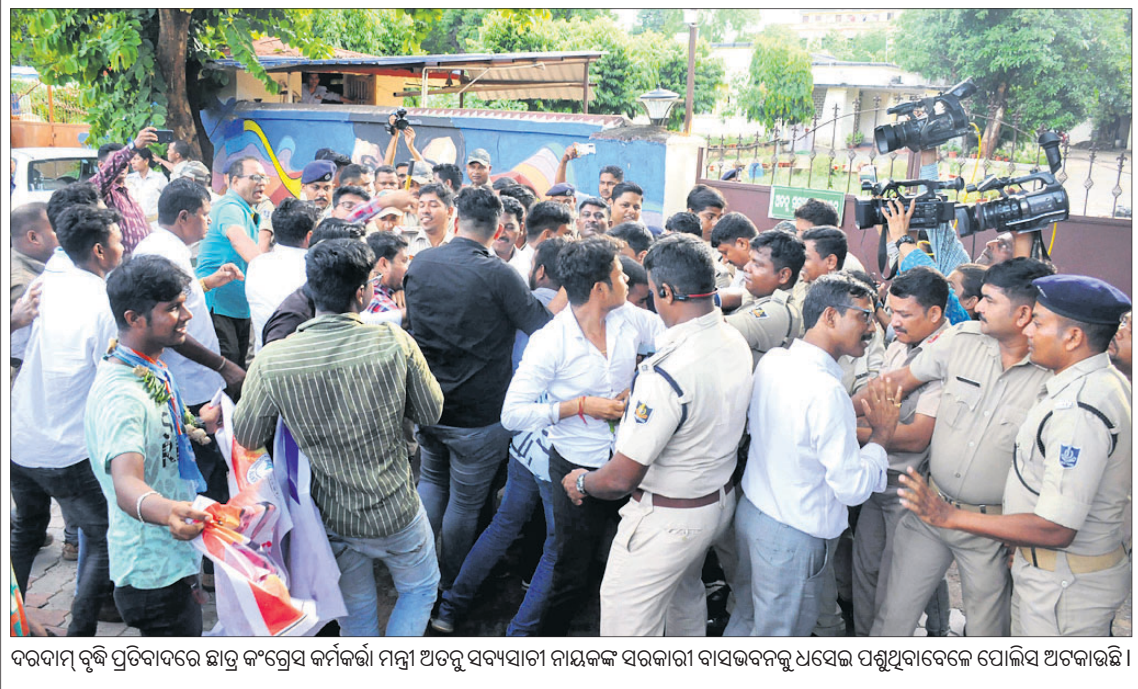
ଦରଦାମ୍ ବୃଦ୍ଧି ପ୍ରତିବାଦରେ ଛାତ୍ର କଂଗ୍ରେସ କର୍ମୀଙ୍କ ମନୁ ଅତରୁ ସମସ୍ୟାଗା ନାୟକଙ୍କ ସହକାରୀ ବାସଭବନକୁ ଯାଇ ପଶୁଥିବାବେଳେ ପୋଲିସ୍ ଅଟକାଇଛି ।