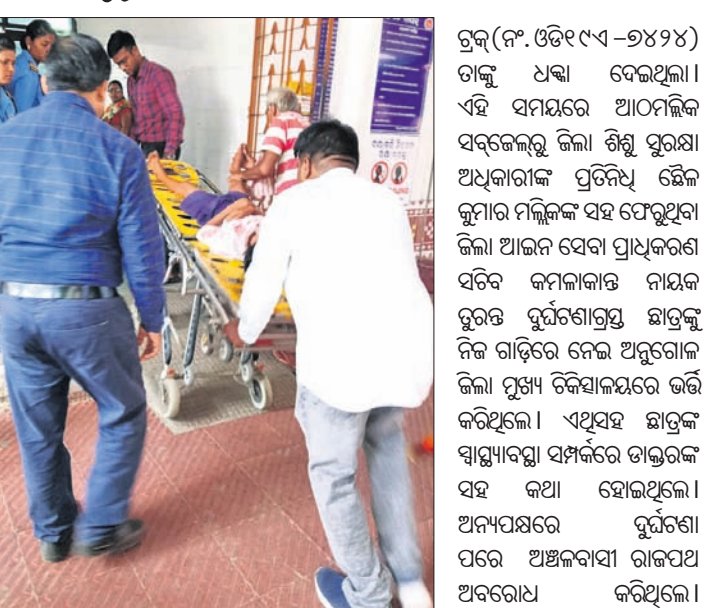
ଗୁରୁତର ଛାତ୍ରଙ୍କୁ ଷ୍ଟେରରେ ବୋହି ନେଇଛନ୍ତି ସଚିବ ।

ଅନୁଗୋଳ, ୫୧୭ (ଅମିତ କୁମାର ସାମଲ) ଦୁର୍ଘଟଣାଗ୍ରସ୍ତ ଛାତ୍ରଙ୍କୁ ମେଡିକାଲ ନେଲେ ସଚିବ କରାଯାଇଛି । ଏହି ଅବସରରେ ଦୁର୍ଘଟଣାଗ୍ରସ୍ତ ଛାତ୍ରଙ୍କୁ ମେଡିକାଲ ନେଲେ ସଚିବ କରାଯାଇଛି । ଏହି ଅବସରରେ ଦୁର୍ଘଟଣାଗ୍ରସ୍ତ ଛାତ୍ରଙ୍କୁ ମେଡିକାଲ ନେଲେ ସଚିବ କରାଯାଇଛି ।