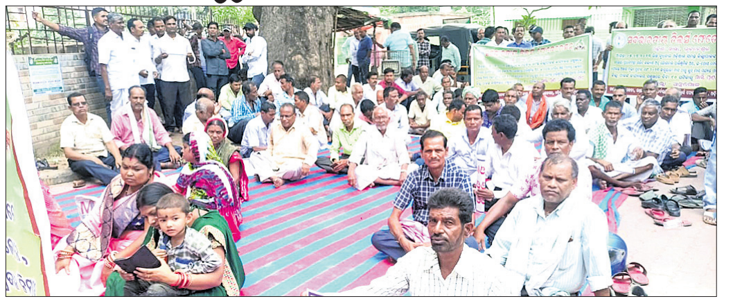
ଅନୁଗୋଳ ଜିଲ୍ଲାପାଳଙ୍କ କାର୍ଯ୍ୟାଳୟ ସମ୍ମୁଖରେ ଡିଲରମାନେ ଗଣଧାରଣା ଦେଇଛନ୍ତି ।

ଅନୁଗୋଳ, ୫୧୭ (ଅମିତ କୁମାର ସାମଲ) ସର୍ବଭାରତୀୟ ଡିଲର ଫେଡ଼େରେଶନ ପକ୍ଷରୁ ଅନୁଗୋଳ ଜିଲ୍ଲାପାଳଙ୍କ କାର୍ଯ୍ୟାଳୟ ସମ୍ମୁଖରେ ରୁଧିରୀ ଶାନ୍ତିପୂର୍ଣ୍ଣ ଭାବେ ଗଣଧାରଣା ଦିଆଯାଇଛି । ଏଥିସହ ପୁଞ୍ଜ୍ୟମନ୍ତ୍ରାଳୟ ଉଦ୍ଦେଶ୍ୟରେ ଏକ ୫ ଦିନୀୟ ଦାବିପତ୍ର ଜିଲ୍ଲାପାଳଙ୍କୁ ପ୍ରଦାନ କରାଯାଇଛି । ଦିନା ପାରିଶ୍ରମିକରେ ସାମଗ୍ରୀ ବନ୍ଧନ ଆଇନ ସମ୍ବନ୍ଧରେ ଚିନ୍ତାପତ୍ର ପ୍ରଦାନ କରାଯାଇଛି । ଆଗାମୀ ଦିନରେ ସାମଗ୍ରୀ ବନ୍ଧନ ବାବଦକୁ ସମସ୍ତ ପାରିଶ୍ରମିକ କରାଯିବ । ଏପରି କି ସରକାରଙ୍କ ସମ୍ମାନ ପାଇଁ ଆଉ ହାତରୁ ଅର୍ଥ ଖର୍ଚ୍ଚ କରିହେବ ନାହିଁ ବୋଲି ଫେଡ଼େରେଶନ ପକ୍ଷରୁ କୁହାଯାଇଛି ।