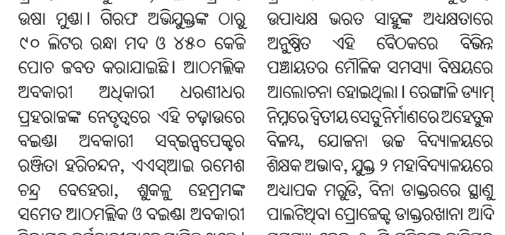
ବୈଠକରେ ଉପସ୍ଥିତ ବୁଦ୍ଧିଜୀବୀମାନେ ।