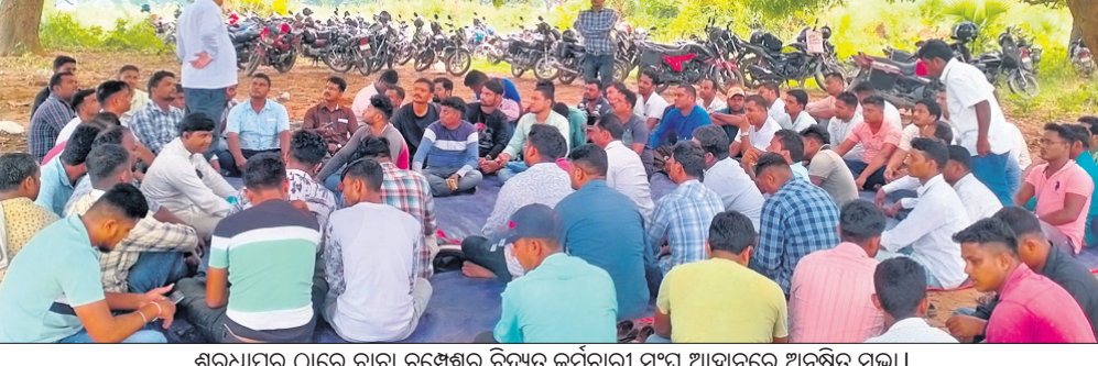
ଶରଧାପୁର ଠାରେ ବାବା ଚମ୍ପେଶ୍ୱର ବିଦ୍ୟୁତ୍ କର୍ମଚାରୀ ସଂଘ ଆହ୍ୱାନରେ ଅନୁଷ୍ଠିତ ସଭା ।

ଅନୁଗୋଳ, ୫୧୭ (ସଚିବାନନ୍ଦ ପ୍ରଧାନ) ୫-ଟି ସଚିବଙ୍କୁ ଦିଆଯିବ ଦାବିପତ୍ର କରାଯାଇଛି । ଏହି ଅବସରରେ ୫-ଟି ସଚିବଙ୍କୁ ଦିଆଯିବ ଦାବିପତ୍ର କରାଯାଇଛି । ଏହି ଅବସରରେ ୫-ଟି ସଚିବଙ୍କୁ ଦିଆଯିବ ଦାବିପତ୍ର କରାଯାଇଛି ।