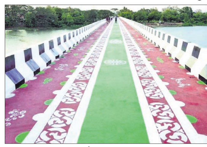
ନବନିର୍ମିତ ଧରତ୍ରୀର କଂକ୍ରିଟ୍ ସେତୁ।

ଖୁସି, ୫୭ (ସୁଧାଂଶୁ ପଣ୍ଡା) କଟକ ଜିଲ୍ଲା ଆଠଗଡ଼ର ପ୍ରସିଦ୍ଧ ଧରତ୍ରୀର ୫୦ ବର୍ଷ ପାଳନ ଅବସରରେ ଶ୍ରେଣୀ ଦର୍ଶନ ପାଇଁ ନିର୍ମାଣ ହୋଇଥିବା କଂକ୍ରିଟ୍ ସେତୁ ରୁଧିର ଆୟୋଜିତ ଉଦ୍ଘାଟନ କାର୍ଯ୍ୟକ୍ରମରେ ଉଦ୍ଘାଟନ ହୋଇଛି। ଧରତ୍ରୀର ୫୦ ବର୍ଷ ପାଳନ ଅବସରରେ ଶ୍ରେଣୀ ଦର୍ଶନ ପାଇଁ ନିର୍ମାଣ ହୋଇଥିବା କଂକ୍ରିଟ୍ ସେତୁ ରୁଧିର ଆୟୋଜିତ ଉଦ୍ଘାଟନ କାର୍ଯ୍ୟକ୍ରମରେ ଉଦ୍ଘାଟନ ହୋଇଛି। ଧରତ୍ରୀର ୫୦ ବର୍ଷ ପାଳନ ଅବସରରେ ଶ୍ରେଣୀ ଦର୍ଶନ ପାଇଁ ନିର୍ମାଣ ହୋଇଥିବା କଂକ୍ରିଟ୍ ସେତୁ ରୁଧିର ଆୟୋଜିତ ଉଦ୍ଘାଟନ କାର୍ଯ୍ୟକ୍ରମରେ ଉଦ୍ଘାଟନ ହୋଇଛି। ଧରତ୍ରୀର ୫୦ ବର୍ଷ ପାଳନ ଅବସରରେ ଶ୍ରେଣୀ ଦର୍ଶନ ପାଇଁ ନିର୍ମାଣ ହୋଇଥିବା କଂକ୍ରିଟ୍ ସେତୁ ରୁଧିର ଆୟୋଜିତ ଉଦ୍ଘାଟନ କାର୍ଯ୍ୟକ୍ରମରେ ଉଦ୍ଘାଟନ ହୋଇଛି। ଧରତ୍ରୀର ୫୦ ବର୍ଷ ପାଳନ ଅବସରରେ ଶ୍ରେଣୀ ଦର୍ଶନ ପାଇଁ ନିର୍ମାଣ ହୋଇଥିବା କଂକ୍ରିଟ୍ ସେତୁ ରୁଧିର ଆୟୋଜିତ ଉଦ୍ଘାଟନ କାର୍ଯ୍ୟକ୍ରମରେ ଉଦ୍ଘାଟନ ହୋଇଛି।