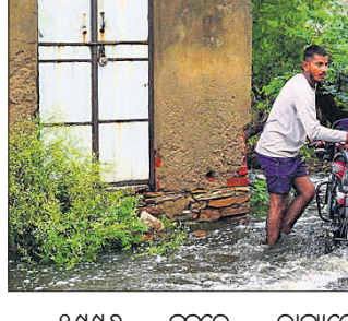
୧୯୯୭ ଜୁନରେ ରାଜ୍ୟରେ ସର୍ବାଧିକ ୧୨୨.୮ ଏମ୍.ଏମ୍. ବର୍ଷା ହୋଇଥିବାବେଳେ ପୂର୍ବ ରାଜସ୍ଥାନରେ ହାରାହାରି ୧୧୮% ଅଧିକ ବର୍ଷା

ଗତ ଜୁନରେ ରାଜସ୍ଥାନରେ ରେକର୍ଡ ପରିମାଣର ବର୍ଷା ହୋଇଛି। ରାଜ୍ୟରେ ବର୍ଷା ୧୨୩ ବର୍ଷର ରେକର୍ଡ ଭାଙ୍ଗିଥିବା ମଙ୍ଗଳବାର ରାଜ୍ୟ ପାଣିପାଗ ବିଭାଗ ପକ୍ଷରୁ ଜଣାଯାଇଛି। ଗତମାସରେ ୧୫.୯ ଏମ୍.ଏମ୍. ବର୍ଷା ରେକର୍ଡ କରାଯାଇଥିବାବେଳେ ହାରାହାରି ୧୮୫% ଅଧିକ ବର୍ଷା ହୋଇଛି। ରାଜ୍ୟରେ ଶେଷଥର ପାଇଁ ୧୯୦୧ରେ ସର୍ବାଧିକ ବର୍ଷା ରେକର୍ଡ କରାଯାଇଥିବା କନ୍ଧପୁର ପାଣିପାଗ ବିଭାଗ ଅଧିକାରୀ ରାଧେଶ୍ୟାମୀ ଶର୍ମା କହିଛନ୍ତି।