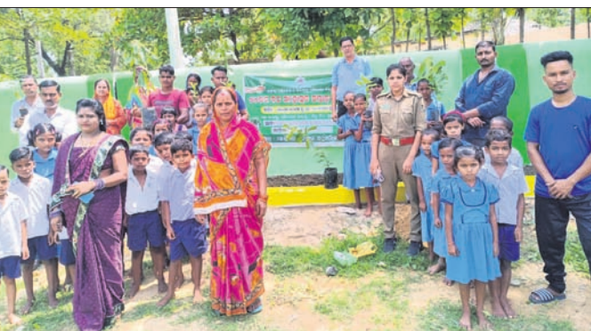
ଚାରାରୋପଣ ଅବସରରେ ଅତିଥିଙ୍କ ସହ ଛାତ୍ରଛାତ୍ରୀମାନେ ।

ଚାରାରୋପଣ ଅବସରରେ ଅତିଥିଙ୍କ ସହ ଛାତ୍ରଛାତ୍ରୀମାନେ । ଏହି ଅବସରରେ ଚାରାରୋପଣ କରାଯାଇଛି । ଏହି ଅବସରରେ ଚାରାରୋପଣ କରାଯାଇଛି ।