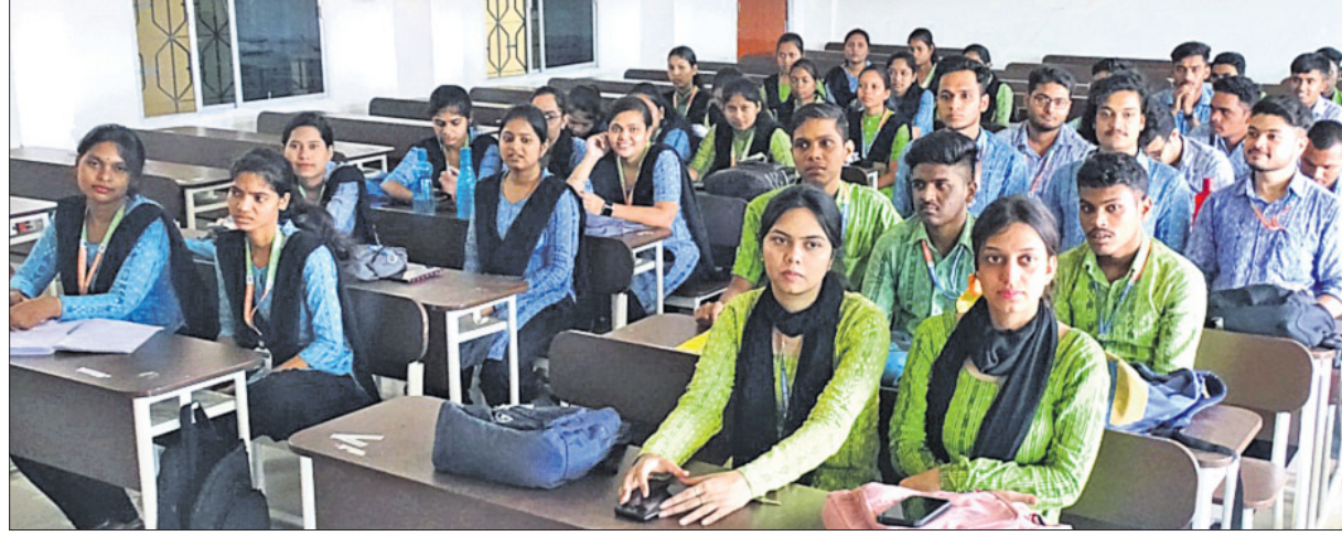
ବଲାଙ୍ଗୀର ରାଜେନ୍ଦ୍ର ବିଶ୍ୱବିଦ୍ୟାଳୟରେ ରୁଧିର ଆୟୋଜିତ ଗଣମାଧ୍ୟମ, ଗଣତନ୍ତ୍ର ଓ ଯୁବପିଢ଼ି ଶୀର୍ଷକ ବକ୍ତୃତା ପ୍ରତିଯୋଗିତାରେ ମଞ୍ଚାସୀନ ଅତିଥି ଓ ଉପସ୍ଥିତ ଛାତ୍ରାଛାତ୍ରୀ