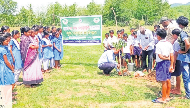
କୁରୁଲିସିଦ୍ଧା ସରକାରୀ ପ୍ରାଥମିକ ବିଦ୍ୟାଳୟରେ ଚାରା ରୋପଣ କରାଯାଇଛି ।

ବିଦ୍ୟାଳୟ ପରିସରରେ ଚାରାରୋପଣ କରାଯାଇଛି । ଏହି ଅବସରରେ ପ୍ରାଥମିକ ବିଦ୍ୟାଳୟର ପ୍ରଧାନ, ପ୍ରାଥମିକ ବିଦ୍ୟାଳୟର ସାମାଜିକ କର୍ମୀ, ଶିକ୍ଷକ ଓ ଶିକ୍ଷିତାମାନଙ୍କୁ ପ୍ରଶଂସା ପତ୍ର ପ୍ରଦାନ କରାଯାଇଛି । ଏହି ଅବସରରେ ପ୍ରାଥମିକ ବିଦ୍ୟାଳୟର ପ୍ରଧାନ, ପ୍ରାଥମିକ ବିଦ୍ୟାଳୟର ସାମାଜିକ କର୍ମୀ, ଶିକ୍ଷକ ଓ ଶିକ୍ଷିତାମାନଙ୍କୁ ପ୍ରଶଂସା ପତ୍ର ପ୍ରଦାନ କରାଯାଇଛି ।