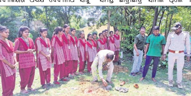
ମାଧ୍ୟପୁର ସତ୍ୟବାଦୀ ମେହେର ଉକ୍ତ ମାଧ୍ୟମିକ ବିଦ୍ୟାଳୟ ପରିସରରେ ବନ ସମାହାର ।