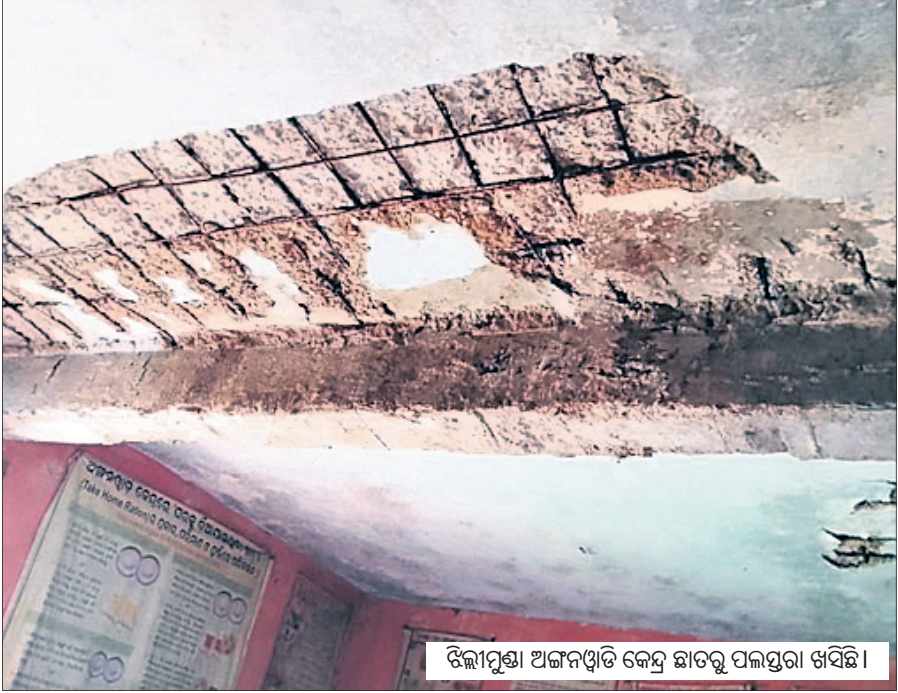
ଝିଲ୍ଲୀମୁଣ୍ଡା ଅଜନଞ୍ଜିତ କେନ୍ଦ୍ର ଛାତରୁ ପଲସ୍ତରା ଖସିଛି ।

୨୩ ଛାତ୍ରାଛାତ୍ର ଅଜନଞ୍ଜିତ କେନ୍ଦ୍ରକୁ ଆସିଥିଲେ । ସେମାନେ ବିପଦସଙ୍କୁଳ ଅବସ୍ଥାରେ ଥିବା କୋଠିରେ ବସିଥିବା ବେଳେ ସାଢ଼େ ୧୦ଟା ବେଳେ ହଠାତ ଛାତରୁ ପଲସ୍ତରା ଖଞ୍ଜମାନ ଖସିବା ଆରମ୍ଭ ହୋଇଥିଲା । ପ୍ରଥମେ ପଲସ୍ତରାର