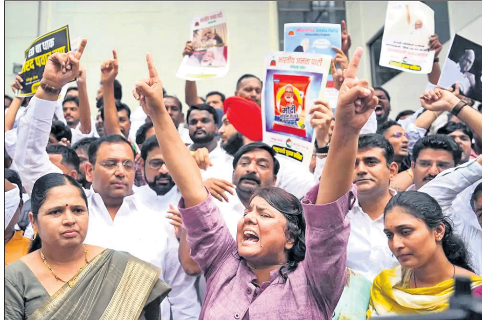
ମୁସାଇର ଓ.ଇ.ଭି. ଚଉନ ସେକ୍ଟରରେ ଶରଦ ପାଞ୍ଜାବ ଗୋଷ୍ଠୀର ବୈଠକ ବେଳେ ସମର୍ଥକମାନେ ପ୍ଲାକାର୍ଡ ଧରି ସ୍ଲୋଗାନ ଦେଉଛନ୍ତି।