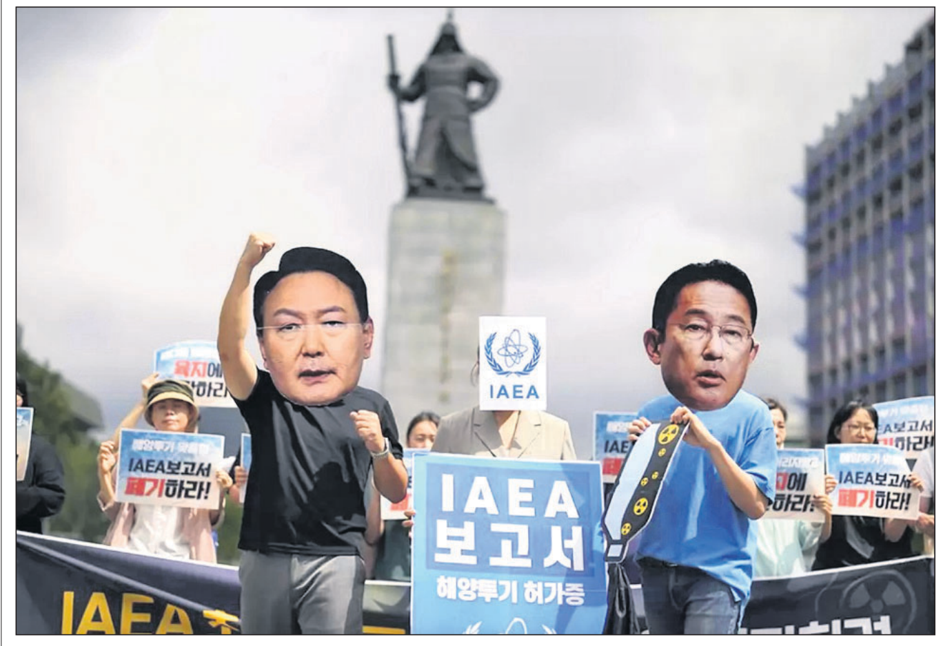
ପୁରୁଖିମା ଆଣବିକ ଶକ୍ତି କେନ୍ଦ୍ରରୁ ବାହାରିଥିବା ବିଶୋଧିତ ରେଡିଓଆକ୍ଟିଭ କକକୁ କାପାନ ସରକାର ସମୁଦ୍ରେ ଛାଡ଼ିବାକୁ ନିଷ୍ପତ୍ତି ନେଇଛନ୍ତି। ଏହାର ପ୍ରତିବାଦରେ କାପାନ ପ୍ରଧାନମନ୍ତ୍ରୀ ମୁଦ୍ରିତ କିଶିଦା ଏବଂ ଦକ୍ଷିଣ କୋରିଆ ରାଷ୍ଟ୍ରପତି ଯୁନ୍ ସୁକ୍ ଯେଓଲ୍‌ଙ୍କ ଭଳି ସୋସାଲ ପିଞ୍ଚିଥିବା ସିଓଇର ସିକିସି ଯୋସାଲିତ ସଦସ୍ୟମାନେ ବିକ୍ଷୋଭ ପ୍ରଦର୍ଶନ କରୁଛନ୍ତି।