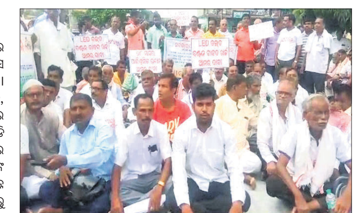
ବିକ୍ଷୋଭ ପ୍ରଦର୍ଶନ କରୁଥିବା ରିଟେଲର ସଂଘର ସଦସ୍ୟମାନେ।