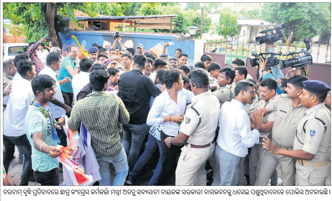
ଦରଦାମ୍ ବୃଦ୍ଧି ପ୍ରତିବାଦରେ ଛାତ୍ର କଂଗ୍ରେସ କର୍ମକର୍ତ୍ତା ମନ୍ତ୍ରୀ ଅତରୁ ସଦ୍ୟସାଗୀ ନାୟକଙ୍କ ସହକାରୀ ବାସଭବନକୁ ଧସେଇ ପଶୁଥିବାବେଳେ ପୋଲିସ୍ ଅଟକାଇଛି ।