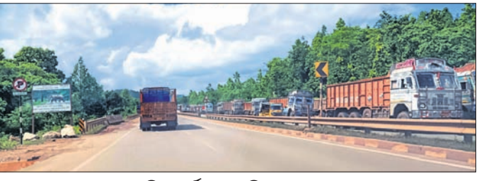
ରାଜପଥ କଡ଼ରେ ଗୁରୁତ୍ୱପୂର୍ଣ୍ଣ ପାର୍ଟି ହୋଇଛି।

କେନ୍ଦୁଝର ଜିଲା ମୁଖ୍ୟାଳୟ ବେଳ ଯାଇଥିବା ଏନ୍‌ଏଚ୍ ୨୦ ଓ ୪୯ରେ ବାରମ୍ବାର ଦୁର୍ଘଟଣା ଘଟୁଥିଲେ ହେଁ ପ୍ରତିକାର ବ୍ୟବସ୍ଥା କରାଯାଉନାହିଁ। ସରକାର ଦୁର୍ଘଟଣା ରୋକିବା ପାଇଁ ବହୁ ପଦକ୍ଷେପ ନେଉଥିଲେ ହେଁ ଏଠାରେ ସେସବୁ ପଦକ୍ଷେପ କାରକପତ୍ର, ସଭା ସମିତିରେ ସିମ୍ପିତ ରହୁଛି। ବିଶେଷ କରି ରାସ୍ତାର ବିଭିନ୍ନ ସ୍ଥାନରେ ବେଆଇନ ଟ୍ରକ୍ ପାର୍ଟି ହେଉଥିଲେ ମଧ୍ୟ ହଟାଯାଉନାହିଁ। ଫଳରେ ଅନେକ ସମୟରେ ଦୁର୍ଘଟଣା ଘଟିବା ସହ ଗ୍ରାମିକ ସମସ୍ୟା ସୃଷ୍ଟି ହେଉଛି। ସୂଚନା ଅନୁଯାୟୀ, ସଦର ଥାନା ଅନ୍ତର୍ଗତ ଅଞ୍ଜରୁ ଡଙ୍ଗାପାଣି ରାସ୍ତା ଏବଂ ଶୁଆଳାଟି ଫାଣି ସମ୍ମୁଖ ରାସ୍ତାର ଏନ୍‌ଏଚ୍ ୪୯ରେ ବେଆଇନ ଭାବରେ ଟ୍ରକ୍ ପାର୍ଟି କରାଯାଇଛି। ଏହି ସବୁ ଟ୍ରକ୍ ବିଭିନ୍ନ ଖଣିରୁ ଲୁହାପଥର ଆଣିବା ପାଇଁ ଅପେକ୍ଷା କରିଆଣ୍ଟି। ଖଣି ସଂସ୍ଥା ପକ୍ଷରୁ ସ୍ୱତନ୍ତ୍ର ପାର୍ଟି ବ୍ୟବସ୍ଥା କରାଯାଇ ନ ଥିବାରୁ ଏଭଳି ସମସ୍ୟା ଉପୁଜୁଛି।