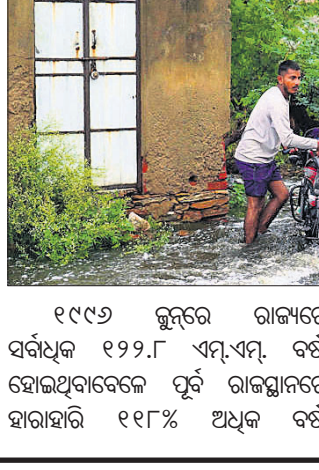
୧୯୯୭ ଜୁନରେ ରାଜ୍ୟରେ ସର୍ବାଧିକ ୧୨୨.୮ ଏମ୍.ଏମ୍. ବର୍ଷା ହୋଇଥିବାବେଳେ ପୂର୍ବ ରାଜସ୍ଥାନରେ ହାରାହାରି ୧୧୮% ଅଧିକ ବର୍ଷା ହୋଇଥିଲା। ସେହି ମାସରେ ପଶ୍ଚିମ ରାଜସ୍ଥାନରେ ୨୮% ଅଧିକ ବର୍ଷା ହୋଇଥିଲା। ଚଳିତବର୍ଷର ପ୍ରଥମ ବାତ୍ୟା ବିପର୍ଯ୍ୟୟ ସକାଶେ କୁନି୧୬ରୁ ୨୦ ହୋଇଥିଲା।

ଗତ ଜୁନରେ ରାଜସ୍ଥାନରେ ରେକର୍ଡ ପରିମାଣର ବର୍ଷା ହୋଇଛି। ରାଜ୍ୟର ବର୍ଷା ୧୨୩ ବର୍ଷର ରେକର୍ଡ ଭାଙ୍ଗିଥିବା ମଙ୍ଗଳବାର ରାଜ୍ୟ ପାଣିପାଗ ବିଭାଗ ପକ୍ଷରୁ ଜଣାଯାଇଛି। ଗତମାସରେ ୧୫.୯ ଏମ୍.ଏମ୍. ବର୍ଷା ରେକର୍ଡ କରାଯାଇଥିବାବେଳେ ହାରାହାରି ୧୮୫% ଅଧିକ ବର୍ଷା ହୋଇଛି। ରାଜ୍ୟରେ ଶେଷଥର ପାଇଁ ୧୯୦୧ରେ ସର୍ବାଧିକ ବର୍ଷା ରେକର୍ଡ କରାଯାଇଥିବା ଜୟପୁର ପାଣିପାଗ ବିଭାଗ ଅଧିକାରୀ ରାଧେଶ୍ୟାମୀ ଶର୍ମା କହିଛନ୍ତି।