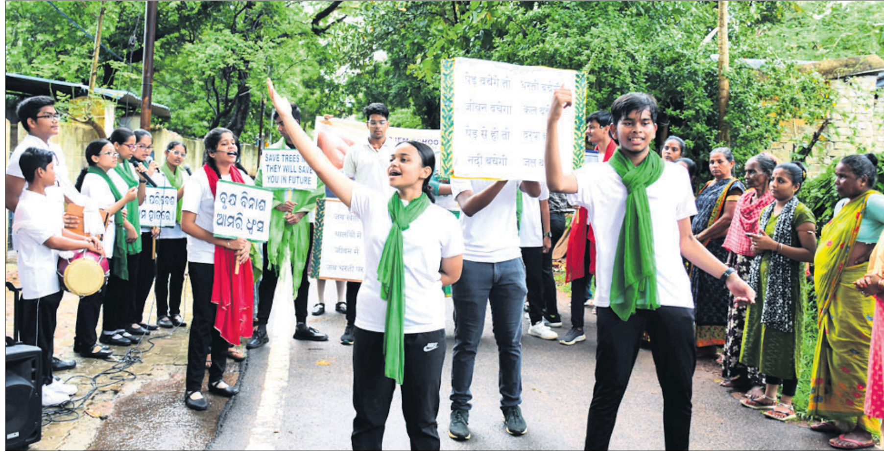
ପରିବେଶ ସୁରକ୍ଷା ନେଇ ଭୁବନେଶ୍ୱର କଳ୍ପନା ଅଞ୍ଚଳରେ ରୁଧିବାର ଛାତ୍ରାଛାତ୍ରୀମାନେ ପଥପ୍ରାନ୍ତ ନାଟକ ମାଧ୍ୟମରେ ସଚେତନତା ସୃଷ୍ଟି କରୁଛନ୍ତି।