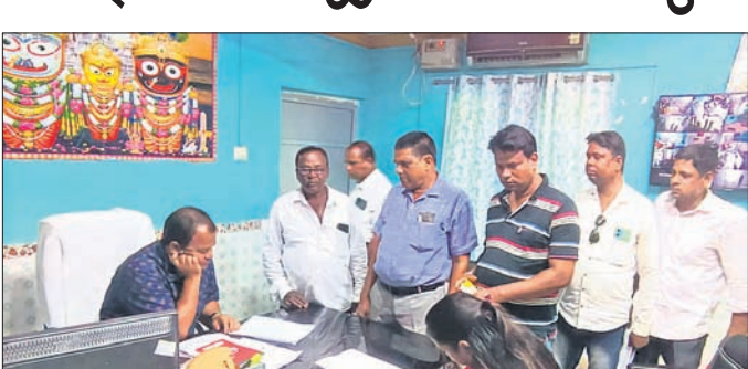
ବିଡ଼ିଓଙ୍କୁ ଦାବିପତ୍ର ପ୍ରଦାନ କରାଯାଇଛି।

ସରକାର ଗରିବ ଲୋକଙ୍କୁ ଆବାସ ଗୃହ ଯୋଗାଇ ଦେଉଛନ୍ତି। ହେଲେ ପ୍ରକୃତ ହିତାଧିକାରୀ ଏହାର ସୁବିଧା ସୁଯୋଗ ପାଇବାରେ ହେଉପରେ ହେଉଥିବା ଅଭିଯୋଗ ହୋଇଛି। ଧାମନଗର ବ୍ଲକ ପକ୍ଷରୁ ବିଭିନ୍ନ ଦିନ ତଳେ ପ୍ରଧାନମନ୍ତ୍ରୀ ଆବାସ ଯୋଜନାରେ ଗୃହ ବ୍ୟବଧି ପାଇଁ ଯୋଗ୍ୟ ହିତାଧିକାରୀଙ୍କ ତାଲିକା ପ୍ରକାଶ ପାଇଥିଲା। ମାତ୍ର ଏଥିରେ ବ୍ୟାପକ ତ୍ରୁଟି ଥିବା ଦେଖିବାକୁ ମିଳିଛି। ଅଧିକାଂଶ ପଞ୍ଚାୟତରେ ଯୋଗ୍ୟ ହିତାଧିକାରୀ ତାଲିକାରୁ ବାଦ୍ ପଡ଼ିଛନ୍ତି। ଅଯୋଗ୍ୟ ହିତାଧିକାରୀଙ୍କୁ ଯୋଗ୍ୟ କରି ଘର ଦିଆଯିବାରୁ ମଧ୍ୟରୁ ହୋଇଛି। ବହୁ ପଞ୍ଚାୟତରେ ଦୁଇ ମହଲା ବିଶିଷ୍ଟ କୋଠାଘର ଥିବା ଲୋକଙ୍କୁ ଯୋଗ୍ୟ ହିତାଧିକାରୀ ଭାବେ ଦର୍ଶାଯାଇ ତାଲିକାରେ ସ୍ଥାନ ମିଳିଛି। ଚାରି ଚକିଆ ଗାଈ, ଲାଶ ଲାଶ ଚକାର କାରବାର ଥିବା ଲୋକଙ୍କୁ ମଧ୍ୟ ଯୋଗ୍ୟ ହିତାଧିକାରୀ କରାଯାଇଛି। ସୋହରା ପଞ୍ଚାୟତରେ