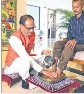
ସପ୍ତଶ ବୋଲି ଶିବରାଜ କ୍ୟାମ୍ପରେ ଲୋଡ଼ିଛନ୍ତି।