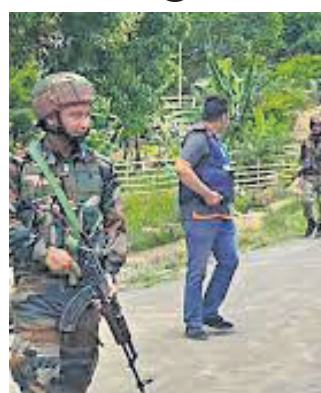
ନାମକ ଏହି ସଂଗଠନ ମୃତ ମହିଳାଙ୍କୁ ଚିହ୍ନଟ କରିଛି।

ହିଂସାକାଣ୍ଡ ଯୋଗୁଁ ଦୀର୍ଘ ଦୁଇ ମାସ ହେଲା ବନ୍ଦ ଥିବା ମଣିପୁର ସ୍କୁଲ ଖୋଲିବାର ଦିନ ପରେ ଗୁରୁବାର ସକାଳେ ଜମ୍ମୁନାଦ୍ ଲକ୍ଷ୍ମୀ ଜିଲ୍ଲାର ଏକ ସ୍କୁଲ ବାହାରେ ଜଣେ ମହିଳାଙ୍କୁ ବୁଲିକରି ହତ୍ୟା କରାଯାଇଛି।