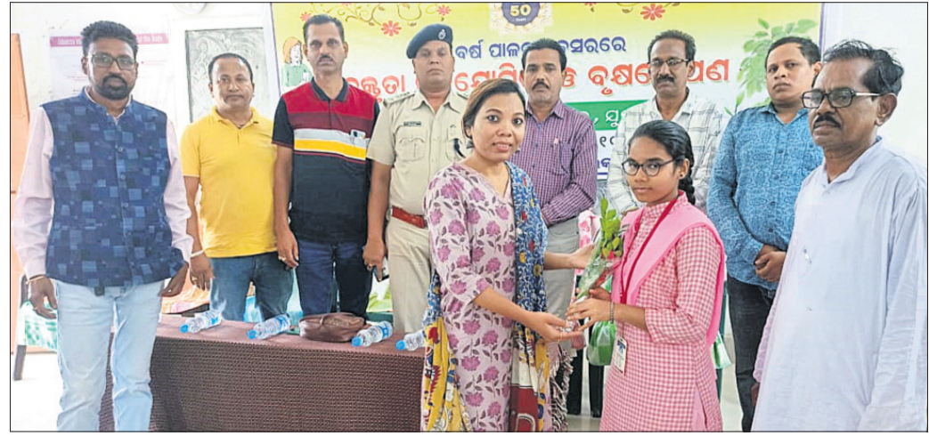
ମାଲକାନଗିରି ମହିଳା ମହାବିଦ୍ୟାଳୟରେ ଗୁରୁବାର ଆୟୋଜିତ 'ଗଣମାଧ୍ୟମ, ଗଣତନ୍ତ୍ର ଓ ଯୁବପିଢ଼ି' ଶୀର୍ଷକ ବକ୍ତୃତା ପ୍ରତିଯୋଗିତାରେ ଅତିଥିମାନେ ଜଣେ ଛାତ୍ରୀଙ୍କୁ ସମର୍ଥନ କରୁଛନ୍ତି ଏବଂ କାର୍ଯ୍ୟକ୍ରମରେ ଉପସ୍ଥିତ ଛାତ୍ରୀ ଓ ଅଧ୍ୟାପିକା ।