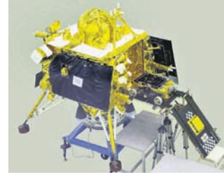
୧୪ରେ ଚନ୍ଦ୍ରଯାନ-୩ ଉଡ଼କ୍ଷେପଣ

ଫୋନ୍ରେ ସନ୍ଦିଗ୍ଧ୍ୟା ଗୁପ୍ତଚରଗିରି କରିପାରିବ ପୋଲିସ ବାହିନୀ