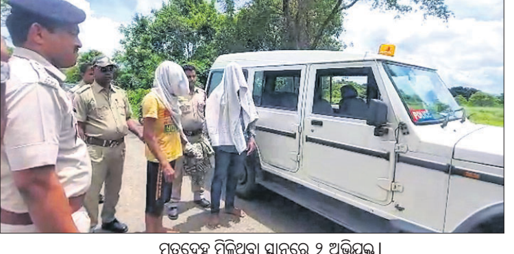
ମୃତଦେହ ମିଳିଥିବା ଘାଟଣାରେ ୯ ଅଭିଯୁକ୍ତ।

ଭଡ଼ା ଟଙ୍କାକୁ ନେଇ ପୁନର୍ବାର ମୁକ୍ତିତର୍କ ହୋଇଥିଲା। ଭଡ଼ା ଟଙ୍କା ନ ମିଳିଲେ ଆଗକୁ ଯିବେ ନାହିଁ ବୋଲି ଭଗବାନ କହିଥିଲେ। ଫଳରେ ଉଭୟ ଅଭିଯୁକ୍ତ ରାଗିଯାଇ ସିଆପଡ଼ା-ବାଗୋ ରାସ୍ତାରେ ବ୍ୟାଗରେ ଥିବା ଝିଅର ଲୋରିକୁ ପ୍ୟାଣ୍ଟ ଡ୍ରାଇଭରଙ୍କ ବେକରେ ଗୁଡ଼ାଇ ହତ୍ୟା କରିଥିବା ପୋଲିସ୍ ଆଗରେ ସ୍ୱୀକାର କରିଛନ୍ତି।