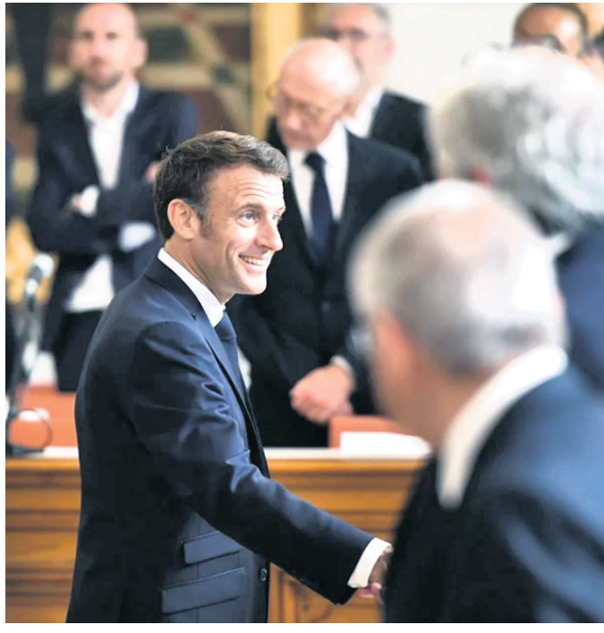
ଫ୍ରାନ୍ସ ନ୍ୟାଶନାଲ ଆସେମ୍ବଲିରେ ରାଷ୍ଟ୍ରପତି ଜମାଦେଲ ମାକ୍‌ସ୍

ମାକ୍‌ସ୍ ସରକାରଙ୍କ ଦ୍ୱାରା ଆଇନ ନାଗରିକଙ୍କ ମୌଳିକ ଅଧିକାରଗୁଡ଼ିକରେ ହସ୍ତକ୍ଷେପ କରୁଥିବାରୁ ଗଣମତ ସ୍ଥିତି ଉତ୍ପତ୍ତି ହେବ।