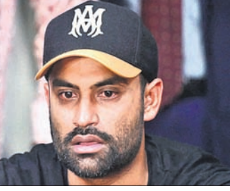
୧୧୮ ରନ୍ କରିଥିଲେ। ମିଡ଼ିଲ୍ ମାର୍ଶିଆ ୧୧୮ ରନ୍ କରିଥିଲେ।

୧୧୮ ରନ୍ କରିଥିଲେ। ମିଡ଼ିଲ୍ ମାର୍ଶିଆ ୧୧୮ ରନ୍ କରିଥିଲେ। ମିଡ଼ିଲ୍ ମାର୍ଶିଆ ୧୧୮ ରନ୍ କରିଥିଲେ। ମିଡ଼ିଲ୍ ମାର୍ଶିଆ ୧୧୮ ରନ୍ କରିଥିଲେ।