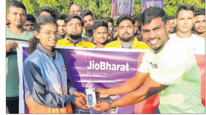
ଜିଓ ଭାରତ ଟିଭି ଫୋନ୍ ଲୋନ୍ଚ