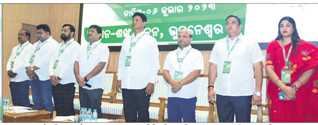
ଶର୍ମା ଭବନରେ ଅନୁଷ୍ଠିତ ବିଜୁ ମୁବ ଜନତା ଦଳର ରାଜ୍ୟ କାର୍ଯ୍ୟକାରୀରେ ଉର୍ଦ୍ଧ୍ୱାଳରେ ଉଦ୍‌ବୋଧନ ଦେଉଛନ୍ତି ବିଜେଡି ସଭାପତି ନବୀନ ପଟ୍ଟନାୟକ।