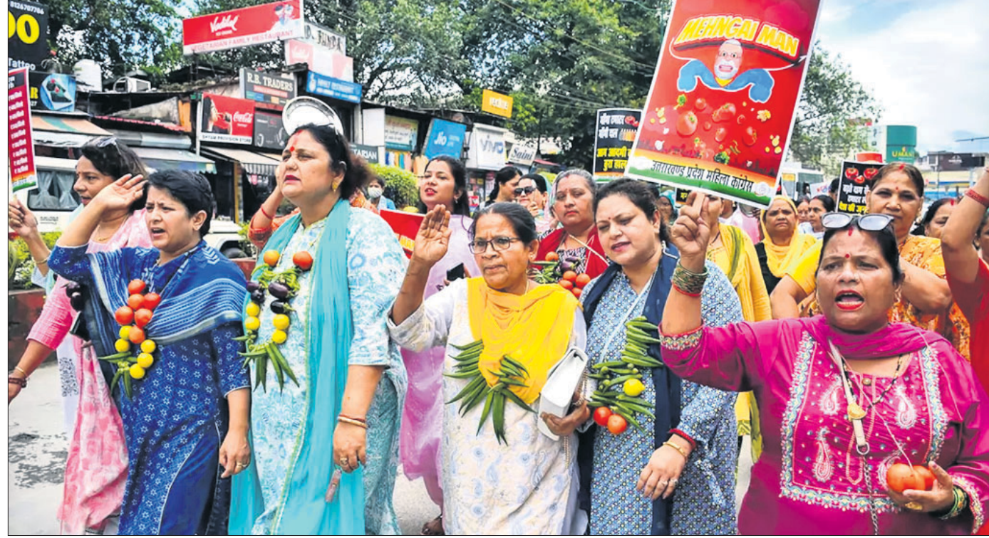
ପରିବହନରୁ ଆରମ୍ଭ କରି ଅତ୍ୟାଧିକ ଦାମଗ୍ରାହୀତ୍ୱର ଦରବୃଦ୍ଧି ପ୍ରତିବାଦରେ ଭଉରାଖଣ୍ଡର ପ୍ରଦେଶ ମହିଳା କଂଗ୍ରେସର ସଦସ୍ୟମାନେ ଗୁରୁବାର ତେରାଭୁନଠାରେ କେନ୍ଦ୍ର ସରକାର ବିରୋଧୀ ସୋଗ୍ରାନ ଦେଉଛନ୍ତି।