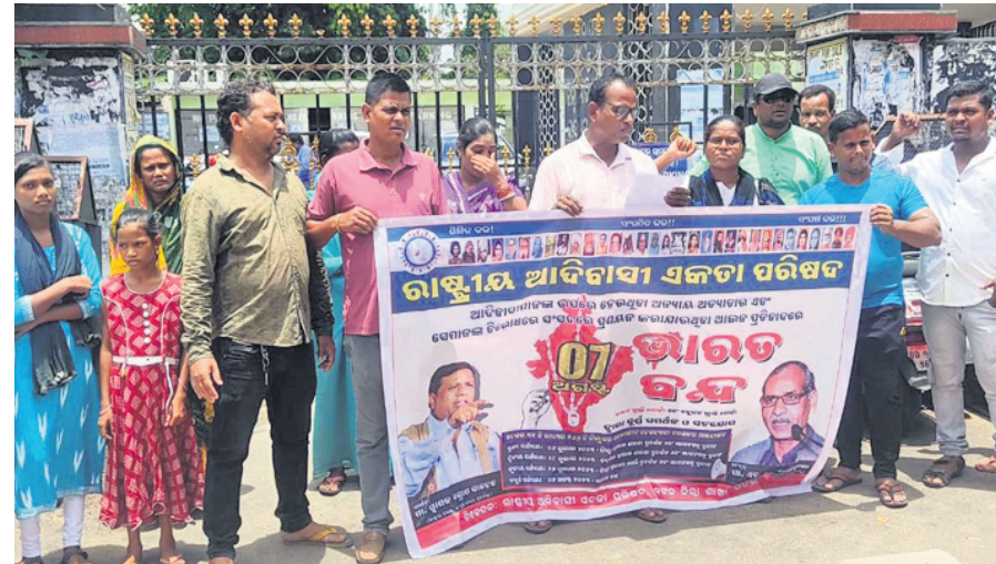
ଆଦିବାସୀମାନଙ୍କ ଉପରେ ହେଉଥିବା ଅନ୍ୟାୟ, ଅପାରାଧ ବିରୋଧରେ ରାଷ୍ଟ୍ରୀୟ ଆଦିବାସୀ ଏକତା ପରିଷଦ ପକ୍ଷରୁ ଗୁରୁବାର କଟକ ଜିଲ୍ଲାପାଳଙ୍କ କାର୍ଯ୍ୟାଳୟ ସମ୍ମୁଖରେ ବିକ୍ଷୋଭ।

୩୯.୩୩%, ବିଜ୍ଞାନରେ ୫୨.୫୦% କଟଅପ୍ ମାର୍କ ରହିଛି। ସିଟି କଲେଜରେ ୩୯.୬୦% ଓ କଳାରେ ୫୨% କଟଅପ୍ ମାର୍କ ରହିଛି। ଭିକାରୀଗାଣୀ କଲେଜର ୭୧.୧୭% ଓ ବାଣିଜ୍ୟ ପାଇଁ ୩୪% କଟଅପ୍ ମାର୍କ ରହିଛି। ରଘୁନାଥଜୀଉ ମହାବିଦ୍ୟାଳୟର କଳାରେ ୫୬.୧୭%, ବିଜ୍ଞାନରେ ୬୧.୮୩% ଓ ବାଣିଜ୍ୟରେ ୩୪.୮୩% କଟଅପ୍ ମାର୍କ ରହିଛି। ସେହିପରି ବୁଲ୍‌ସାପୁରରେ ଥିବା ସରସ୍ୱତୀ ଶିଶୁ ବିଦ୍ୟାଳୟର ମହାବିଦ୍ୟାଳୟର ବିଜ୍ଞାନ ପାଇଁ ୫୬.୬୦% ଓ ସ୍ୱର୍ଣ୍ଣାଟ୍ କଟଅପ୍ ମାର୍କ ରହିଛି। ମହାନଦୀ ବିହାର ମହିଳା ମହାବିଦ୍ୟାଳୟ କଳାରେ