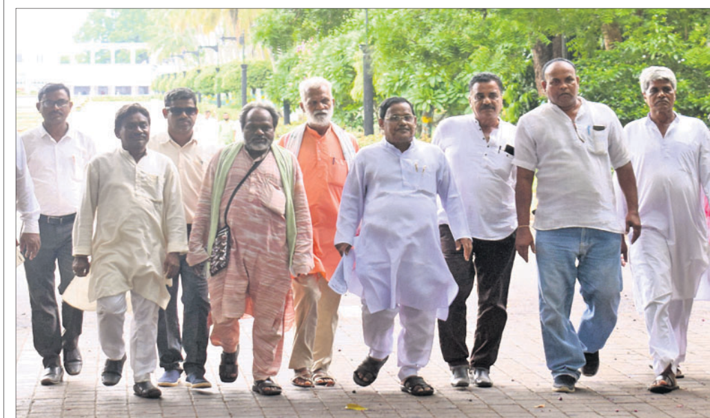
ରାଜ୍ୟରେ ବଜାର ଦର ନିୟନ୍ତ୍ରଣ କରିବାରେ ସରକାର ବିଫଳ ହୋଇଥିବା ପ୍ରତିବାଦରେ ରାଜ୍ୟପାଳଙ୍କୁ ସ୍ମାରକପତ୍ର ଦେବାକୁ ଆସୁଥିବା ପ୍ରଦେଶ କିଷ୍ଟାନ କଂଗ୍ରେସର ପ୍ରତିନିଧି ଦଳ।

ଭୁବନେଶ୍ୱର ନୟାପଲ୍ଲୀ ଅଞ୍ଚଳର ବିଦ୍ୟାଳୟରେ କ୍ରିଷ୍ଣାନନ୍ଦଙ୍କୁ 'ଗେଟ୍‌ଗୋ' ଆସ୍ରେ ୨୬ କୋଟି ଟଙ୍କା ପ୍ରମୋଗନାକୁ ଭିତ୍ତି ଦେଖିବା ପରେ ସେଥିରେ ଏକ ହାତୀସାଥୀ ପୁଅ ଆସିଥିଲା। ଏହାପରେ ଜଣେ ମହିଳା ନିଜକୁ 'ଗେଟ୍‌ଗୋ'ର ମ୍ୟାନେଜର ବୋଲି ପରିଚୟ ଦେଇ ତାଙ୍କୁ ପ୍ରତି ଦିନ ୧୫ କୋଟି ଟଙ୍କା ପ୍ରତି ଦିନ ଦେବାକୁ କହି ପ୍ରବର୍ତ୍ତାଇଥିଲେ। ଏଥିରେ