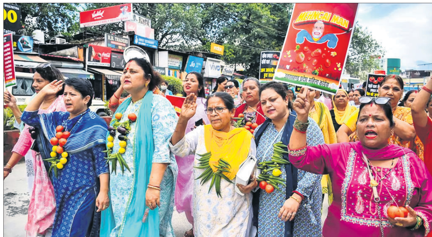
ପରିବହନରୁ ଆରମ୍ଭ କରି ଅତ୍ୟାଚାରଣକ ସାମଗ୍ରୀଗୁଡ଼ିକର ବରଦୁଷ୍ଟି ପ୍ରତିବାଦରେ ଭଉରାଖଣ୍ଡର ପ୍ରଦେଶ ମହିଳା କଂଗ୍ରେସର ସଦସ୍ୟମାନେ ଗୁରୁବାର ତେରାଭୁନଠାରେ କେନ୍ଦ୍ର ସରକାର ବିରୋଧୀ ସୋଗ୍ରାନ ଦେଇଛନ୍ତି।