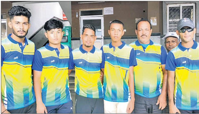
ଓଡ଼ିଶା ପେଣ୍ଡାଅଲନ ଦଳ