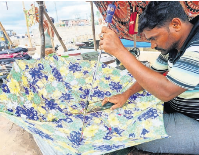
କଟକ ରାଜାହାଟ୍ ଛକଠାରେ ଜଣେ ବ୍ୟବସାୟୀ ଛତା ମରାମତି କରୁଛନ୍ତି।