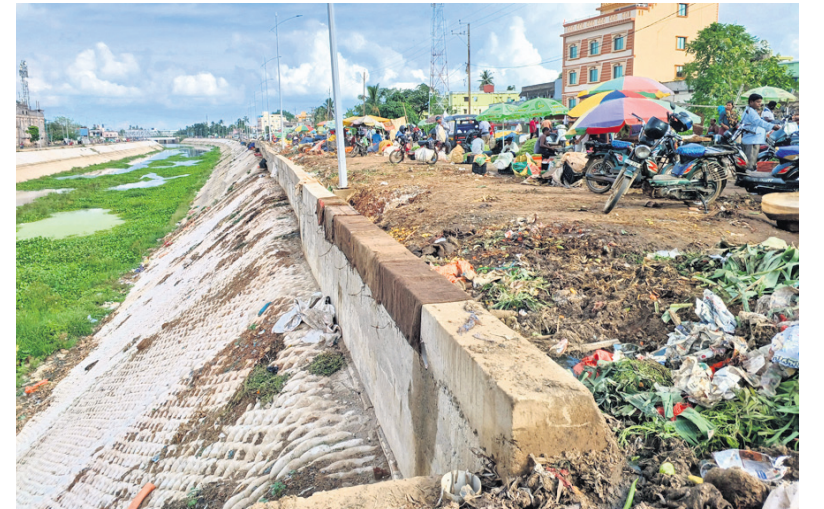
ତାଳବନ୍ଧା କୋଳାର ସୌନ୍ଦର୍ଯ୍ୟକରଣ କରାଯାଉଥିବାବେଳେ ଛତ୍ରପାଳାର ପରିବା ମାକେଟର ଆବର୍ଜନାକୁ କୋଳା ମଧ୍ୟକୁ ଫିଙ୍ଗାଯାଉଛି।