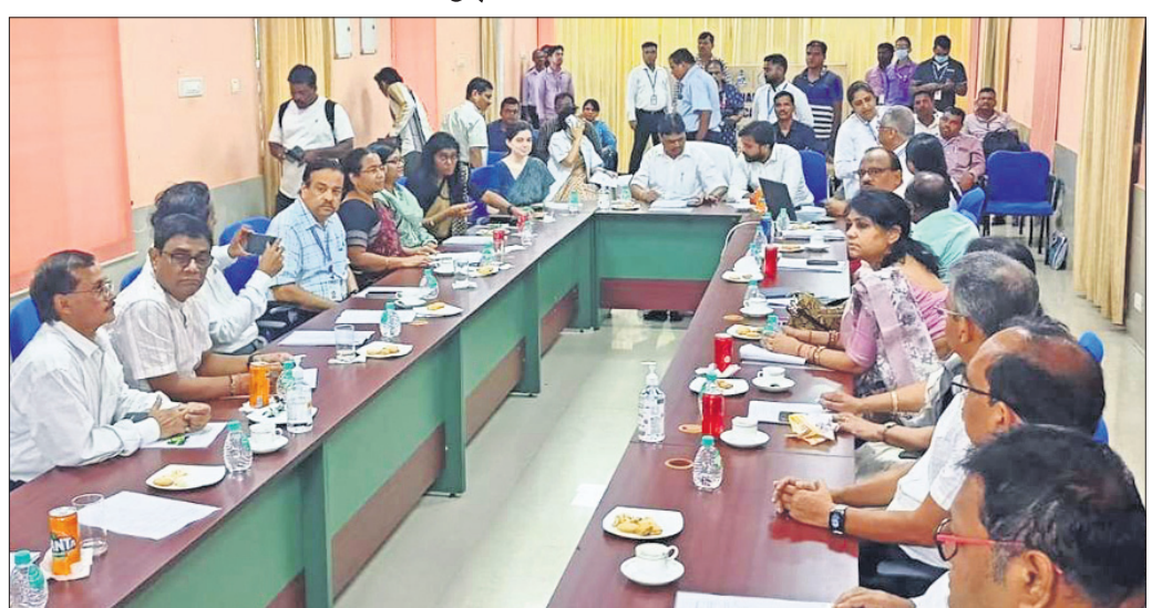
ଆଗାମ୍ୟ ହରିହର କର୍କଟ ରୋଗ ପ୍ରତିଷ୍ଠାନର ସାଧାରଣ ପରିଷଦ ବୈଠକରେ ସାମ୍ବଲପୁର ନିରଞ୍ଜନ ପୂଜାରୀଙ୍କ ସହ ଅନ୍ୟମାନେ।