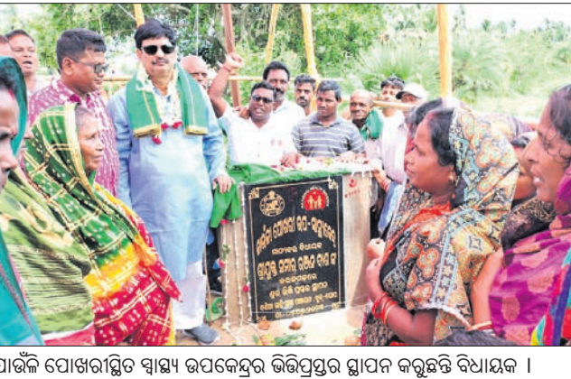
ଯାଜ୍ଞିକ ପୋଖରୀସ୍ଥିତ ସ୍ୱାସ୍ଥ୍ୟ ଉପକେନ୍ଦ୍ରର ଭିତ୍ତିପ୍ରସ୍ତର ସ୍ଥାପନ କରୁଛନ୍ତି ବିଧାୟକ ।