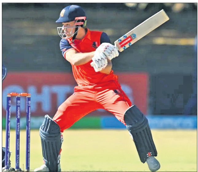
ଶତକାନ୍ଦ ଇନିଂସ୍ ଅବସରରେ ବାସ୍‌ଡେ ଲିଡ୍‌ସ୍

ବୁଲ୍‌ସ୍‌ମେ, ୬୭ ଝଟଲାଣ୍ଡ ପରାସ୍ତ କରିବା ସହ ଦିନିକିଆ ବିଶ୍ୱକପରେ ନିଜର ସ୍ଥାନ ସୁରକ୍ଷିତ କରି ନେଦରଲାଣ୍ଡ। ବାସ୍‌ଡେ ଲିଡ୍‌ସ୍ ଅଲରାଉଣ୍ଡ ପ୍ରଦର୍ଶନ (୧୨୩ ରନ୍ ଓ ୪ ଉଇକେଟ) ବଳରେ ଦଳ ୪ ଉଇକେଟରେ ଝଟଲାଣ୍ଡକୁ ପରାସ୍ତ କରିଥିଲା। ପ୍ରଥମେ ବ୍ୟାଟିଂ କରି ଝଟଲାଣ୍ଡ