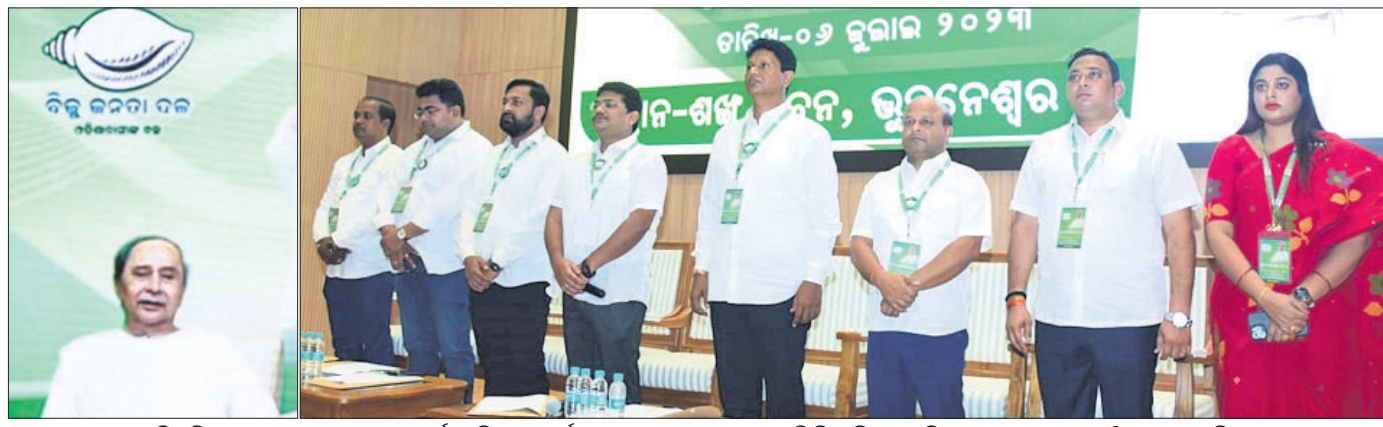
ଶଙ୍ଖ ଭବନରେ ଅନୁଷ୍ଠିତ ବିଜୁ ମୁବ ଜନତା ଦଳର ରାଜ୍ୟ କାର୍ଯ୍ୟକାରୀତାରେ ଉର୍ଦ୍ଧ୍ୱାଳରେ ଉଦ୍‌ବୋଧନ ଦେଉଛନ୍ତି ବିଜେଡି ସଭାପତି ନବୀନ ପଟ୍ଟନାୟକ।

ମନମୋହନ କହିଛନ୍ତି, ସାଙ୍ଗଠନିକ ଅବସ୍ଥା ଉପରେ ଗୁରୁତ୍ୱ ଦିଆଯାଇଛି। ୨୦୨୪ ନିର୍ବାଚନ ଲାଗି ଯାହାସବୁ କରାଯାଉଛି ତା' ଉପରେ ନିଷ୍ପତ୍ତି ହୋଇଛି।