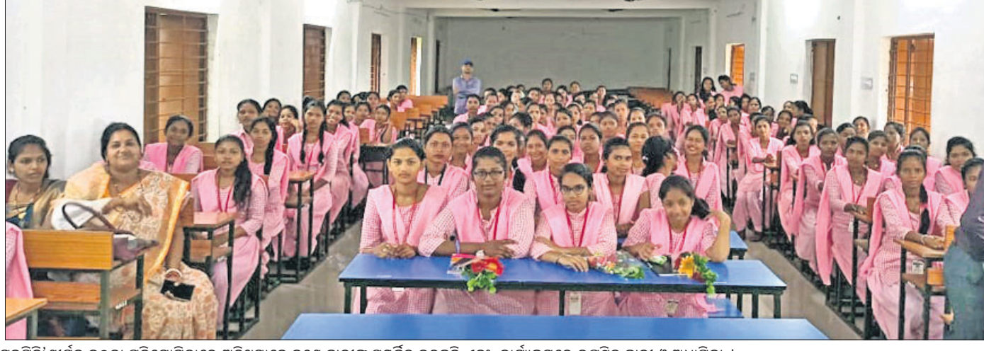
ମାଲକାନଗିରି ମହିଳା ମହାବିଦ୍ୟାଳୟରେ ଗୁରୁବାର ଆୟୋଜିତ 'ଗଣମାଧ୍ୟମ, ଗଣତନ୍ତ୍ର ଓ ଯୁବପିଢ଼ି' ଶୀର୍ଷକ ବକ୍ତୃତା ପ୍ରତିଯୋଗିତାରେ ଅତିଥିମାନେ ଜଣେ ଛାତ୍ରୀଙ୍କୁ ସମର୍ଥନ କରୁଛନ୍ତି ଏବଂ କାର୍ଯ୍ୟକ୍ରମରେ ଉପସ୍ଥିତ ଛାତ୍ରୀ ଓ ଅଧ୍ୟାପିକା ।