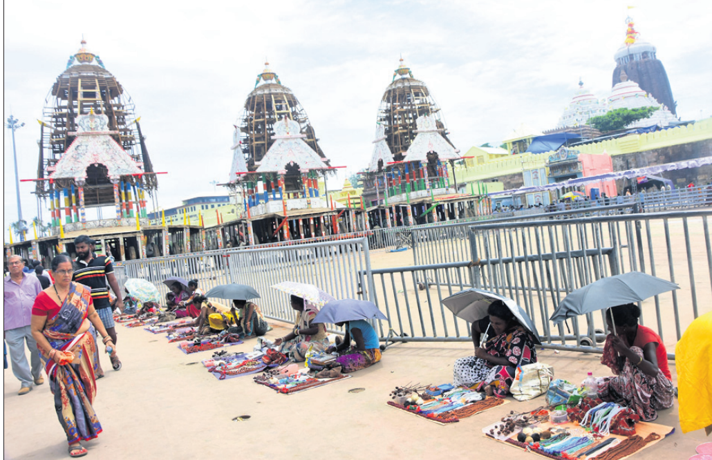
ପୁରୀ ସିଂହଦ୍ୱାର ନିକଟରେ ବ୍ୟାରିକେଡ଼ ପଡ଼ିଥିବା ରାସ୍ତା ସଂକୀର୍ଣ୍ଣ ହେଉଥିବା ବେଳେ ରାସ୍ତାରେ ଉଠାଦୋକାନୀ ଯୋଗୁଁ ଗ୍ରାମିକ ଜାମ ହେଉଛି ।