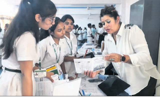
ଶିକ୍ଷା ବୃତ୍ତି ମେଳାରେ ଛାତ୍ରଛାତ୍ରୀ ଓ ଅନ୍ୟମାନେ।