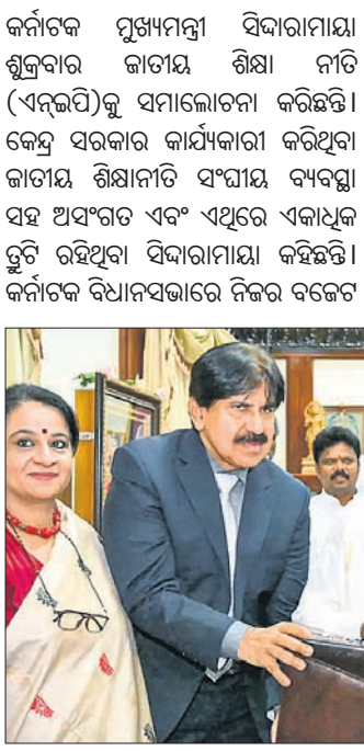
ବଜେଟ୍ ଉପସ୍ଥାପନ ପାଇଁ ମୁଖ୍ୟମନ୍ତ୍ରୀ ସିଦ୍ଧାରାମାୟା ବିଧାନସଭାରେ ପହଞ୍ଚିଛନ୍ତି।

ଭାଷଣରେ ସିଦ୍ଧାରାମାୟା କହିଥିଲେ, ଚାକ୍ ଧରକାର ରାଜ୍ୟର ସାମାଜିକ, ସାଂସ୍କୃତିକ ଓ ଆର୍ଥିକ ପରିବେଶକୁ ବିଚାରକୁ ନେଇ ନୂଆ ଶିକ୍ଷାନୀତି ଆଣିବେ। ଏହି ନୂଆ ନୀତି ରାଜ୍ୟରେ ଉଚ୍ଚଶିକ୍ଷା ମାନକୁ ବିଶ୍ୱସ୍ତରାୟ କରିବା ସହ ବିଶ୍ୱିକ ଶ୍ରମରେ ଯୁବବର୍ଗଙ୍କୁ ପ୍ରତିହତ କରିବା ପାଇଁ ସାମର୍ଥ୍ୟ ତୁଟି ରହିଥିବା ସିଦ୍ଧାରାମାୟା କହିଛନ୍ତି।