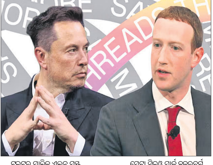
ଟୁଇଟର ମାଲିକ ଏଲନ୍ ମସ୍କ ମେଟା ସିଇଓ ମାର୍କ ଝୁକରବର୍ଗ

ମାଲକୋଭୁଗି* ସାଇଟ୍ ଟୁଇଟର ପ୍ରତିହତୀ ଫ୍ରେଡ଼ ଲକ୍ଷ୍ମି ହେବାର କେଲ ଘଣ୍ଟା ମଧ୍ୟରେ ଟୁଇଟର ଓକିଲ ଆଲେକ୍ସ ସିରୋ ମେଟା ସିଇଓ ମାର୍କ ଝୁକରବର୍ଗଙ୍କ ନିକଟକୁ ଚିଠି ଲେଖିଛନ୍ତି। ଏଲନ୍ ମସ୍କଙ୍କ ଟୁଇଟରରେ ଟ୍ରେଡ଼ ସିକ୍ରେଟ୍ସ ବ୍ୟବହାର କରି ଫ୍ରେଡ଼ ତଥାପି କରାଯାଇଥିବା ବିଷୟ ଉଲ୍ଲେଖ କରାଯାଇଛି।