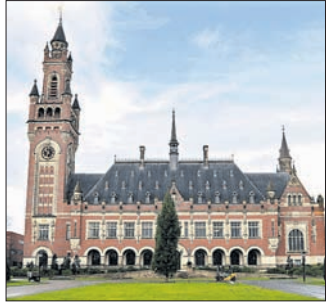
ନୂଆଦିଲ୍ଲୀର ଆପଡି ଅଗ୍ରାହ୍ୟ