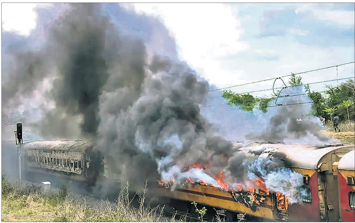
ହାଇଦ୍ରାବାଦଠାରୁ ୫୦ କିଲୋମିଟର ଦୂର ବୋମାଇପାଲା ନିକଟରେ ଶୁକ୍ରବାର ଫଳକନ୍ଦୁମା ଏକ୍ସପ୍ରେସ୍‌ର ୫ଟି ବଗିଚାରେ ଲାଗିଥିବା ନିଆଁ।

ହେବେ ସିବିଆଇ ମଧ୍ୟ ସମାନ ଦୃଷ୍ଟିଭଙ୍ଗୀରେ ଅବହେଳାକୁ ଦାୟୀ କରି ୩ କର୍ମଚାରୀଙ୍କୁ ଗିରଫ କରିଛି। ଚନ୍ଦ୍ର ଭାଇ ରହିଥିବାବେଳେ ଗିରଫ ସଂଖ୍ୟା ବଢିପାରେ ବୋଲି ଅନୁମାନ କରାଯାଇଛି। ଜୁନ୍ ୨ରେ ଘଟିଥିବା ଏହି ଟ୍ରେନ୍ ଦୁର୍ଘଟଣାରେ ଘଟଣାସ୍ଥଳରେ ୨୮୮ ଓ ଚିକିତ୍ସାଧାନ ଅବସ୍ଥାରେ ୫ଜଣଙ୍କୁ ମିଶାଇ ମୋଟ ୨୯୩ ଜଣଙ୍କ ମୃତ୍ୟୁ ହୋଇଛି। ଏଥିସହ ୧୫ଜଣରୁ ଉର୍ଦ୍ଧ୍ୱ ଆହତ ହୋଇଥିବାବେଳେ ଏବେ ବି ଅନେକ ଚିକିତ୍ସାଧାନ ଅଛନ୍ତି। ଦୁର୍ଘଟଣାର ୨୪ ଘଣ୍ଟା ପରେ ସିବିଆଇ ଚନ୍ଦ୍ର ଭାଇ ନେଇଥିଲା। ପ୍ରଥମେ ବାହାନଗା ଷ୍ଟେଶନର ରିଲେ ଟୁମ୍, ପ୍ୟାନେଲ ବକ୍ସ ଓ ଡାଟା ଲକର ଟୁମ୍‌କୁ ସିଲ୍ କରିଥିଲା। ଏଥିସହ ହାର୍ଡ ଡିସ୍କ ସମେତ ବହୁ ଯନ୍ତ୍ରାଂଶ ଓ କାଗଜପତ୍ର ନିଜ ହେପାକତକୁ ନେଇ ଚନ୍ଦ୍ରକୁ ଆଗକୁ ବଢ଼ାଇଥିଲା। ପରବର୍ତ୍ତୀ ସମୟରେ ଷ୍ଟେଶନ୍ ମ୍ୟାନେଜରଙ୍କ ସମେତ ୧୨ଜଣ ରେଳ