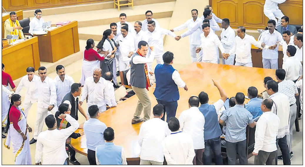
ତ୍ରିପୁରା ବିଧାନସଭାରେ ବିରୋଧୀ ସଦସ୍ୟମାନଙ୍କ ହଜରୋଲ।