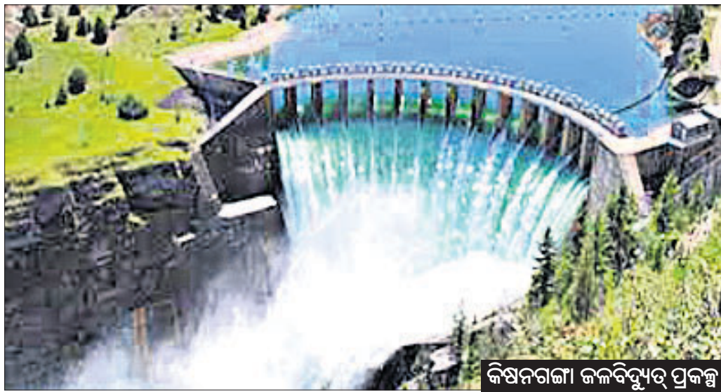
କିଷନଗଞ୍ଜା ଜଳବିଦ୍ୟୁତ୍ ପ୍ରକଳ୍ପ

ସିନ୍ଧୁନଦୀ ଜଳ ବିବାଦ ମାମଲାରେ ନେତୃତ୍ୱାଧିକାରୀ ହେଉଥିବା ପର୍ଯ୍ୟନ୍ତ କୋର୍ଟ ଅଫ ଆର୍ବିଟ୍ରେଶନ୍ (ପିସିଏ)ରେ ରୁଚୁବାର ଭାରତ ବିରୋଧରେ ପାକିସ୍ତାନ ବଡ଼ ବିଜୟ ଲାଭ କରିଛି।