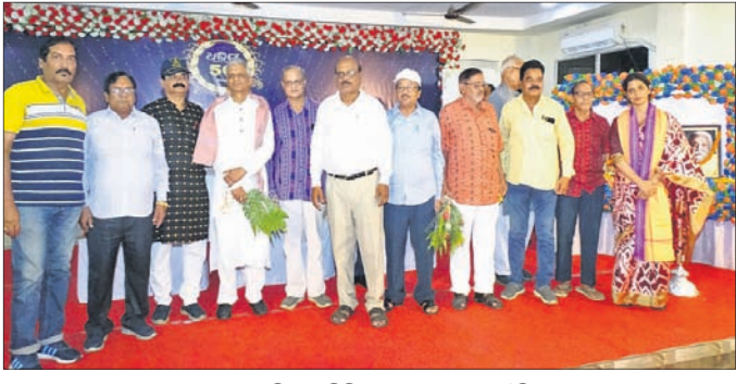
ବଲାଙ୍ଗୀର ନାଗରିକ କମିଟି, ଅବସରପ୍ରାପ୍ତ ସୈନିକ ସଂଘ