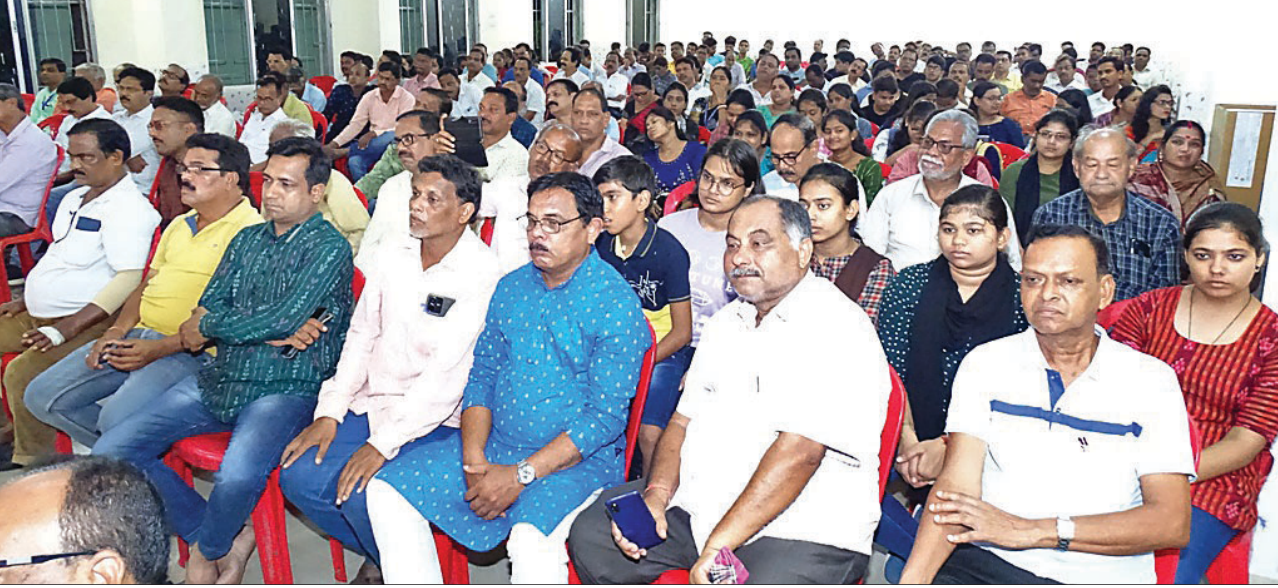
କାର୍ଯ୍ୟକ୍ରମରେ ଯୋଗଦେଇଥିବା ଅତିଥି ଓ ବୁଦ୍ଧିଜୀବୀମାନେ ।