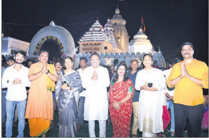
ଶ୍ରୀଜଗନ୍ନାଥ ମନ୍ଦିର ପ୍ରତିଷ୍ଠା ଉତ୍ସବରେ ଅତିଥିମାନେ ।