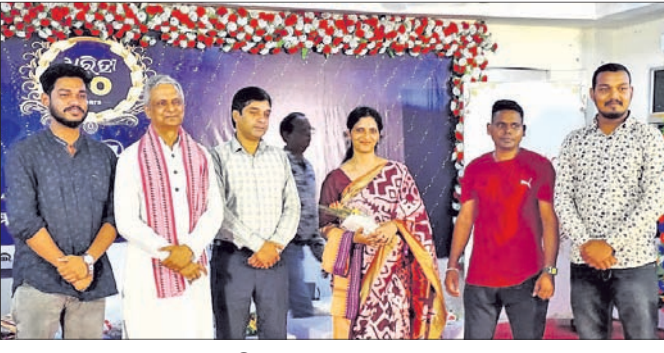
ବିଜୁ ଭୂମିକା ଫାଉଣ୍ଡେସନ