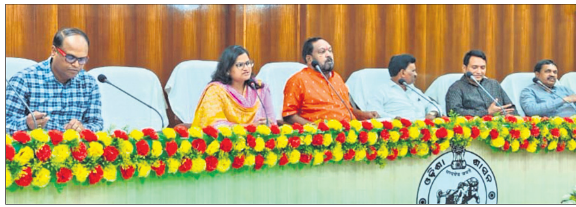
ଦିଶା ବୈଠକରେ ଉପସ୍ଥିତ ଅତିଥିଗଣ ।