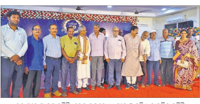
ବଲାଙ୍ଗୀର ଆକ୍ସନ କମିଟି, ରେଳ ଉପଭୋକ୍ତା ସଂଘ ଓ ବରିଷ୍ଠ ନାଗରିକ କମିଟି