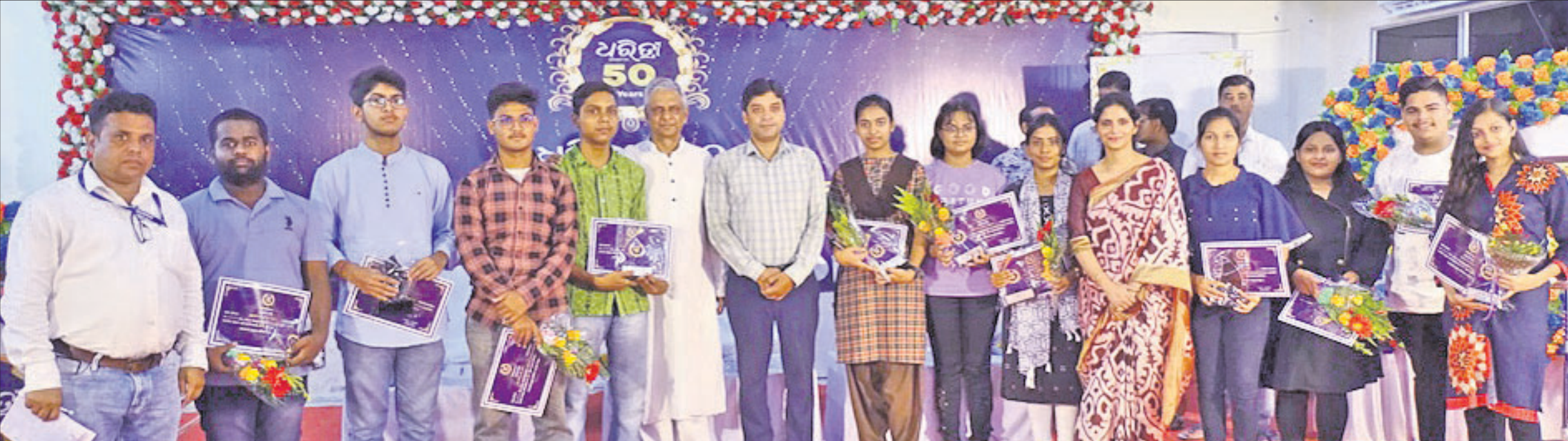
ଅତିଥିଙ୍କ ଗହଣରେ ବକ୍ତୃତା ପ୍ରତିଯୋଗିତାରେ ପୁରସ୍କୃତ ହୋଇଥିବା ବିଭିନ୍ନ ଶିକ୍ଷାନୁଷ୍ଠାନର କୃତୀ ପ୍ରତିଯୋଗୀ ।