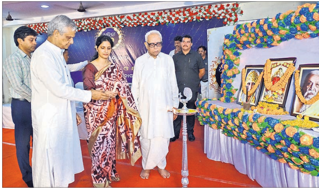
ବଲାଙ୍ଗୀର ପୃଥ୍ୱୀରାଜ ହାଇସ୍କୁଲ ଶତବାର୍ଷିକୀ କକ୍ଷରେ ଧରିତ୍ରୀର ୫୦ ବର୍ଷ ପଦାର୍ପଣ ଅବସରରେ ଅତିଥିମାନେ ପ୍ରଦାପ ପ୍ରଦାନ କରୁଛନ୍ତି ।