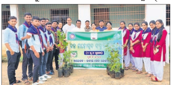
ଚାରା ରୋପଣ ଅବସରରେ ଛାତ୍ରଛାତ୍ରୀ ।

ଦେବଗଡ଼, ୮୭(ଶଶୀକା ଶେଖର ଝାଙ୍କର): ୨୪ ଚମ୍ପ ବନ ମହୋତ୍ସବ ସମ୍ପ୍ରାୟ ଅବସରରେ ଦେବଗଡ଼ ମହାବିଦ୍ୟାଳୟରେ ଜାତୀୟ ସେବା ଯୋଜନା (ଏନଏସଏସ୍) ଆନୁକୂଲ୍ୟରେ ବୃକ୍ଷରୋପଣ କାର୍ଯ୍ୟକ୍ରମ ଅନୁଷ୍ଠିତ ହୋଇଯାଇଛି।