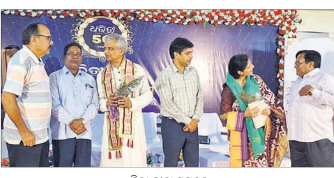
ଜିଲା ଗ୍ରାମୀ ସଙ୍ଗଠନ