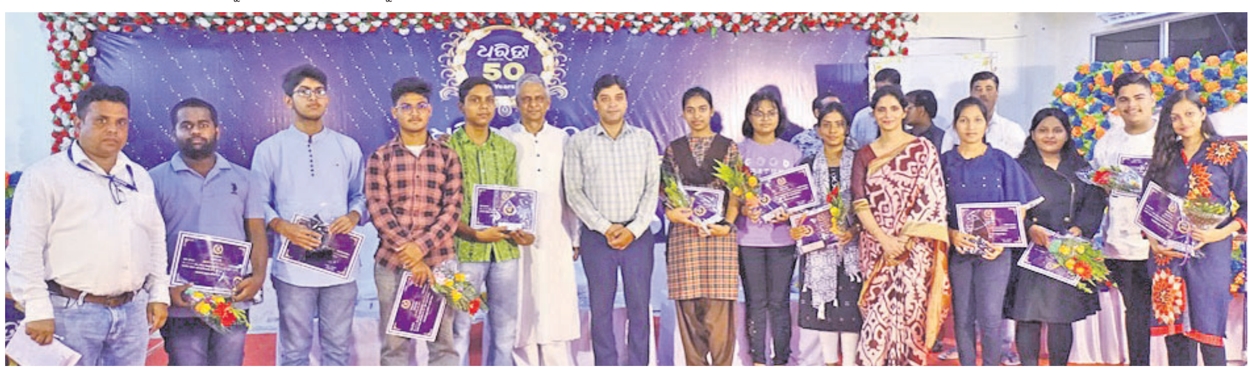
ଅତିଥିକ ଗହଣରେ ବକ୍ତୃତା ପ୍ରତିଯୋଗିତାରେ ପୁରସ୍କୃତ ହୋଇଥିବା ବିଭିନ୍ନ ଶିକ୍ଷାନୁଷ୍ଠାନର କୃତୀ ପ୍ରତିଯୋଗୀ ।