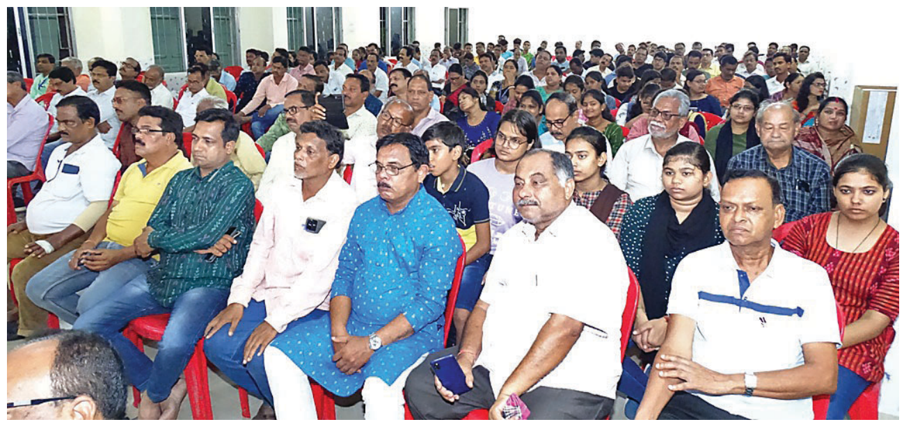
କାର୍ଯ୍ୟକ୍ରମରେ ଯୋଗଦେଇଥିବା ଅତିଥି ଓ ବୁଦ୍ଧିଜୀବୀମାନେ ।