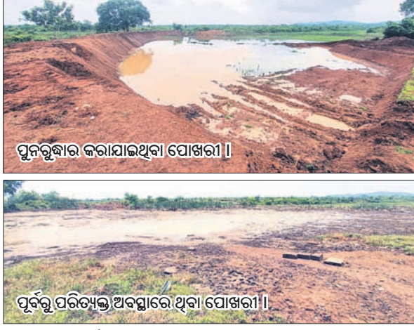
ପୁନରୁଦ୍ଧାର କରାଯାଇଥିବା ପୋଖରୀ। ଏବଂ ପୂର୍ବ ପରିଷ୍କୃତ ଅବସ୍ଥାରେ ଥିବା ପୋଖରୀ।

ପକ୍ଷରେ ଏହି ପୋଖରୀର ପୁନରୁଦ୍ଧାର କରାଯାଇଛି। ଗ୍ରାମବାସୀ ଏହି ପୋଖରୀ ଉପରେ ନିର୍ଭରଶୀଳ ରହିଥିବା ବେଳେ ଏହା ପୋତିହୋଇ ଯାଇଥିଲା। ଏହାର ପୁନରୁଦ୍ଧାର ଏକ ଛୋଟିଆ ପ୍ରୟାସ ଥିଲା। ଏହାଦ୍ୱାରା ଗ୍ରାମବାସୀ ଉପକୃତ ହେବେ। ତେବେ ଗ୍ରାମାଞ୍ଚଳକୁଳିକରେ ବହୁ ପୋଖରୀ ପରିଷ୍କୃତ ଅବସ୍ଥାରେ ରହି ପୋତିହୋଇ ସତା ହରାଉଛି। ଏହାର ପୁନରୁଦ୍ଧାର ସହ ପୁଣି ଥରେ ଲୋକଙ୍କ ଉପଯୋଗୀ କରିବା ଉଦ୍ଦେଶ୍ୟରେ ଇଏଫ୍‌ଆଇ ସହ ଧରିତ୍ରୀର ଏକ ମିଳିତ ପ୍ରୟାସ। ଆଗକୁ ଏଭଳି ଅଭିଯାନ ଲାଗି ରହିବ। ଅନୁପକ୍ଷରେ ଜିଲ୍ଲା ପରିଷଦ ପୁଞ୍ଜୀ ଉନ୍ନୟନ ଓ ନିର୍ବାହୀ ଅଧିକାରୀ ଦିଗନ୍ତ ରାଉତରାୟ କହିଛନ୍ତି, ଏହା ଏକ ସ୍ୱାଗତଯୋଗ୍ୟ ପଦକ୍ଷେପ। ଏହି ଜଳାଶୟର ସୌଧର୍ଯ୍ୟକରଣ ପ୍ରତି ସୁରୁତ୍ୱ ଦିଆଯିବ।