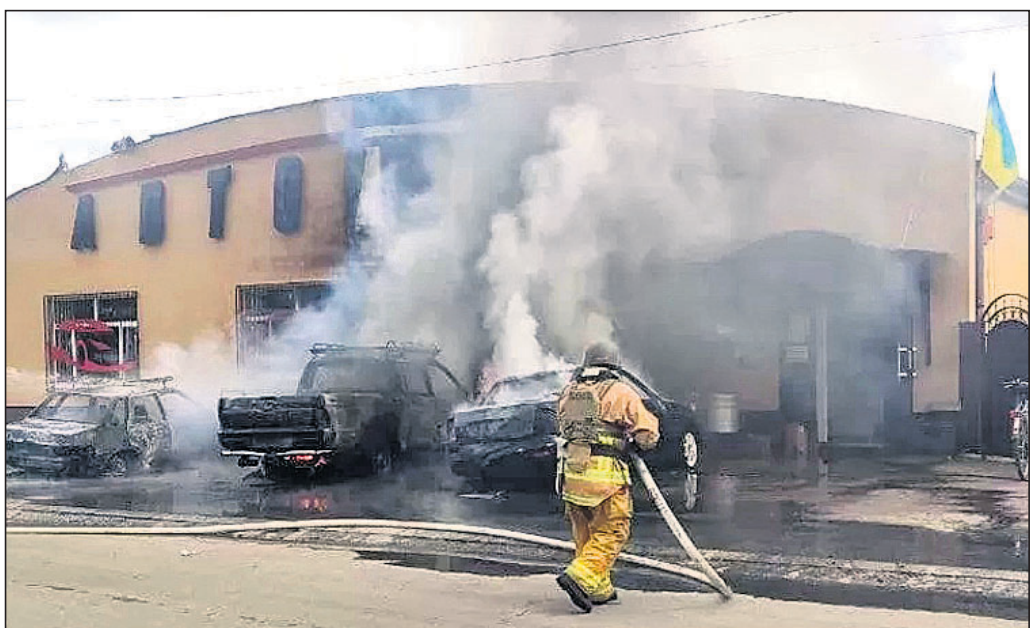
ରୁଷିଆ ମିଶାଇଲ୍ ମାଡ଼ରେ ଯୁକ୍ତେନ୍ ଲାମନ୍ତାରେ ଏକାଧିକ କାର୍ ଜଳିଯାଇଛି।

ଯୁକ୍ତେନ୍ ଉପରେ ରୁଷିଆ ଆକ୍ରମଣକୁ ଶନିବାର ୫୦୦ ଦିନ ପୂରିଯାଇଛି। ଦୀର୍ଘ ଦିନ ଧରି ରୁଷିଆ ସେନାର କଡ଼ା ପୁଲିସ୍ କରୁଥିବା ଯୁକ୍ତେନ୍ ଯେନା ସେନାକୁ କୃଷି ସାଗର ଦ୍ୱୀପକୁ ଏକ ଭିତ୍ତି କରି ରାଷ୍ଟ୍ରପତି ଭୋଲୋଡିମିର ଜେଲେନ୍ସ୍କି ସ୍ତୁତ ପ୍ରଶଂସା କରିଛନ୍ତି। ଯବାନଙ୍କ ଉଦ୍ଦେଶ୍ୟରେ ସେ କହିଛନ୍ତି, ସ୍ତେକ ଆଇଲାଣ୍ଡ ବିଜୟର ଘ୍ନାନ ଯାହାକୁ କେବେହେଲେ ବିଜୟ ପ୍ରାପ୍ତ କରାଯାଇ ପାରିବ ନାହିଁ। ଏଠାରେ ଥିବା ଯବାନଙ୍କୁ