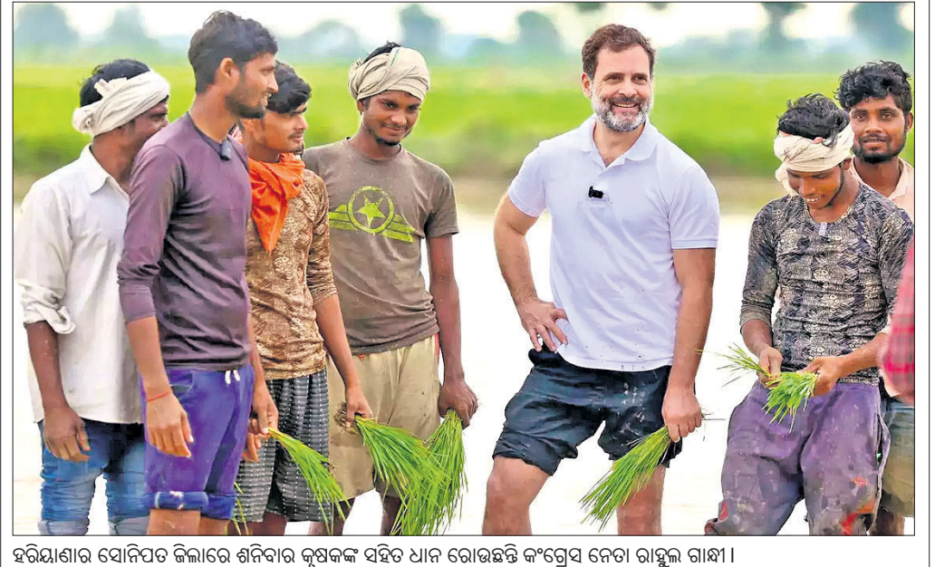
ହରିୟାଣାର ସୋନିପତ ଜିଲ୍ଲାରେ ଶନିବାର କୃଷକଙ୍କ ସହିତ ଧାନ ରୋଗରୁ ନିର୍ମୂଳକ କଂଗ୍ରେସ ନେତା ରାହୁଲ ଗାନ୍ଧୀ।

ନେଦରଲାଣ୍ଡସର ୪ ଦଳୀୟ ମେଣ୍ଟ ସରକାର ଭାଙ୍ଗିବା ପରେ ଶନିବାର ପ୍ରଧାନମନ୍ତ୍ରୀ ମାର୍କ ରୁଟେ ରାଜୀନାମା ଭେଟି ଇସ୍ତଫାପତ୍ର ଦେଇଛନ୍ତି। ପରିବାର ସହ ରୁଷିଆ ଅଧୀନରେ ଥିବା କାଚୋରଡିଆ ଖୁସ୍କୁଲର ପାଖରୁ ଯୁଦ୍ଧର ଉଦ୍ଦେଶ୍ୟମୂଳକ ଭାବେ ନଷ୍ଟ କରିବାକୁ ଚାହୁଁଥିବା ରୁଷିଆ ଓ ଯୁକ୍ତେନ୍ ପରସ୍ପରକୁ ଦୋଷୀ କରିବାରେ ଲାଗିଛନ୍ତି। ଅନ୍ୟପକ୍ଷେ ଶନିବାର ରୁଷିଆ ବହିର୍ଦ୍ୱାର ମନ୍ତ୍ରୀ ସର୍ଗେଇ ଶୋଇଗୁ ପାୟାରିଂ ରେଖା ପରିଦର୍ଶନ କରିଛନ୍ତି। ନାଟୋ ସମିତ୍ ଆଲୋଚନାବେଳେ ଆମେରିକା ଯୁକ୍ତେନ୍ ମୁଖ ମୁକାବିଲା ପାଇଁ କ୍ଲଷ୍ଟର ମ୍ୟୁନିଶନ୍ସ ହତ୍ୟାର ଯୋଗାଣକୁ ନେଇ ଘୋଷଣା କରିଛି। ଏ ନେଇ ଯୁକ୍ତେନ୍ ବହିର୍ଦ୍ୱାର ମନ୍ତ୍ରୀ ଓଲେନ୍ସ୍କି ରେକର୍ଡିକୋଇ ଆମେରିକାକୁ ପ୍ରଶଂସା କରିବା ସହ ଏହି ମୁକାବିଲାକୁ ପ୍ରାମାଣିକରେ ବ୍ୟବହାର କରାଯିବ ନାହିଁ ବୋଲି କହିଛନ୍ତି। ଅନ୍ୟପକ୍ଷେ କ୍ଲଷ୍ଟର ମ୍ୟୁନିଶନ୍ସ ପ୍ରଭାବ ମଧ୍ୟ ଉପରେ ପଡ଼ିବ ନାହିଁ ବୋଲି ରୁଷିଆ ପକ୍ଷରୁ କୁହାଯାଇଛି।