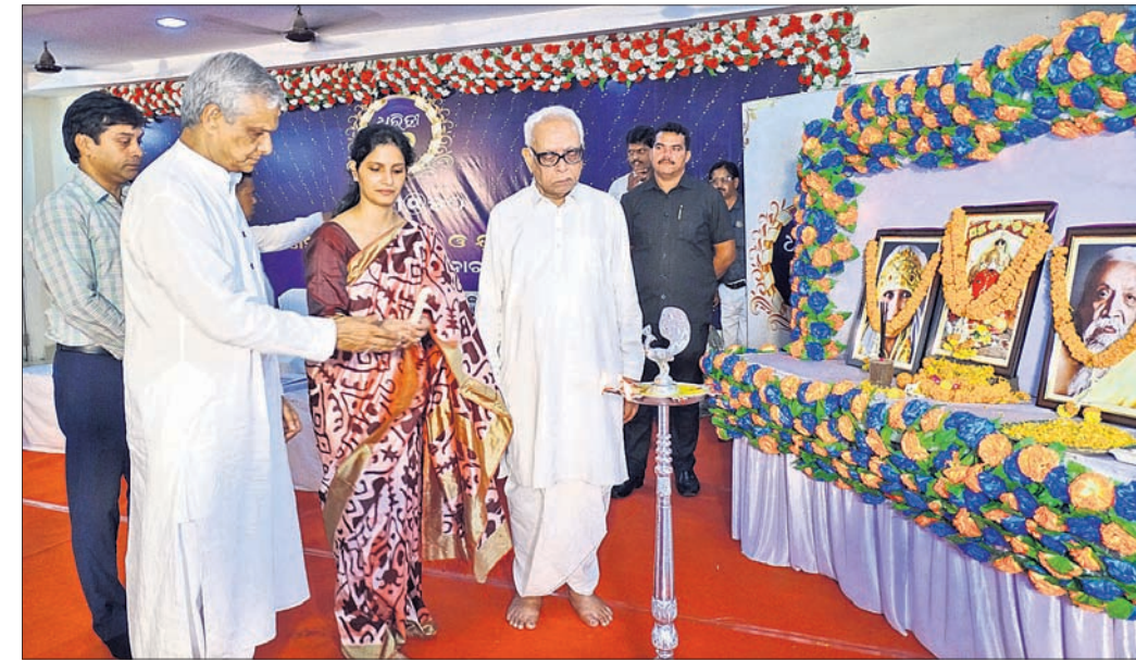
ବଲାଙ୍ଗୀର ପୃଥ୍ୱୀରାଜ ହାଇସ୍କୁଲ ଶତବାର୍ଷିକୀ କକ୍ଷରେ ଧରିତ୍ରୀର ୫୦ ବର୍ଷ ପଦାର୍ପଣ ଅବସରରେ ଅତିଥିମାନେ ପ୍ରଦାପ ପ୍ରଦାନ କରୁଛନ୍ତି ।