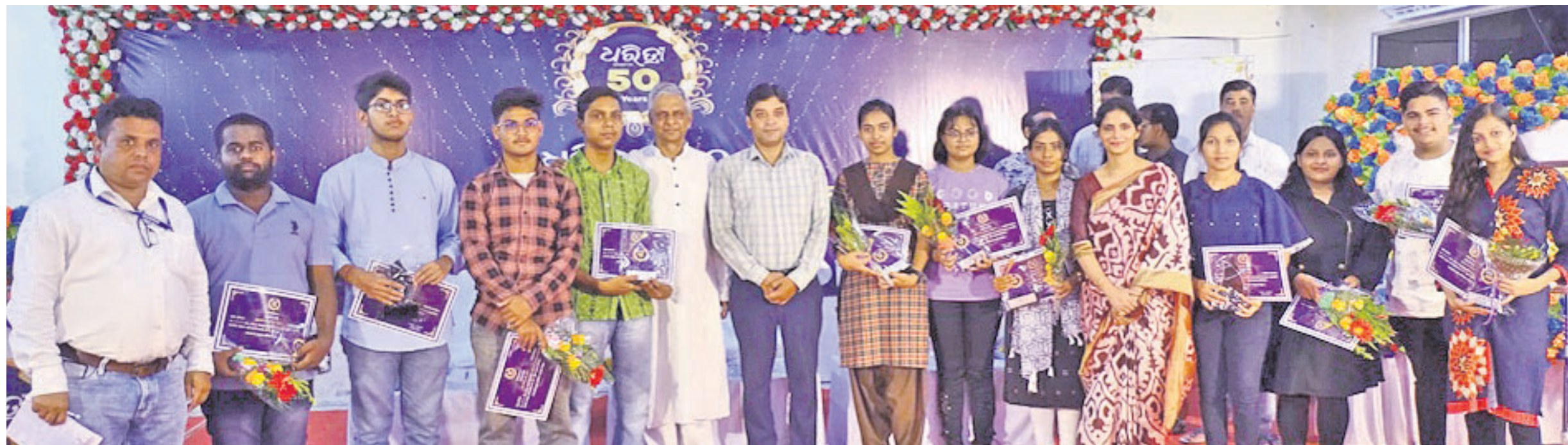
ଅତିଥିକ ଗହଣରେ ବକ୍ତୃତା ପ୍ରତିଯୋଗିତାରେ ପୁରସ୍କୃତ ହୋଇଥିବା ବିଭିନ୍ନ ଶିକ୍ଷାନୁଷ୍ଠାନର କୃତୀ ପ୍ରତିଯୋଗୀ ।