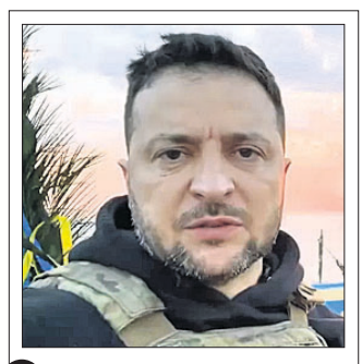
ବେଶ ରକ୍ଷା ଉଦ୍ଦେଶ୍ୟରେ ଦୀର୍ଘ ୫୦୦ ଦିନ ଧରି ଲଢ଼େଇ କାରି ରଖିଥିବା ପ୍ରତ୍ୟେକ ସୈନ୍ୟଙ୍କୁ ଧନ୍ୟବାଦ। ମୁଖରେ ଯୁକ୍ତେନ୍ ଉପରେ ବିଜୟ ସୁନିଶ୍ଚିତ। -ଭୋଲୋଡିମିର ଜେଲେନ୍ସ୍କି, ଯୁକ୍ତେନ୍ ରାଷ୍ଟ୍ରପତି

ନୂଆଦିଲ୍ଲୀ, ୮୭(ପି.ଟି.): ବେଳ ଭାରତ ସମେତ ସମସ୍ତ ଗ୍ରେନ୍ଡର ଏସି ରେୟାର କାର୍ ଏବଂ ଏକଜିକ୍ୟୁଟିଭ୍ କ୍ଲାସ୍ ଉଡ଼ା ୨୫% ପର୍ଯ୍ୟନ୍ତ ହ୍ରାସ ପାଇବ। ଅନୁକୃତି ଏବଂ ଉତ୍ସାହମ୍ଭର ଯାତ୍ରା ମଧ୍ୟ ଉପକୃତ ହେବେ ବୋଲି ରେଲୱେ ବୋର୍ଡ଼ ପକ୍ଷରୁ କାରି ନିର୍ଦ୍ଦେଶନାମାରେ କୁହାଯାଇଛି। ଉପରୋକ୍ତ କୋର୍ଟକ୍ରିକର ଯାତ୍ରା ସଂଖ୍ୟା ଏବଂ ପରିବହନର ପ୍ରତିଯୋଗିତାମୂଳକ ମୋଡ଼ ଉପରେ ଭଡ଼ା ନିର୍ଦ୍ଧାରଣ କରିବା ଏବଂ କୋର୍ଟକ୍ରିକର ସବୁ ସିଏପିଏସ୍ ବୃଦ୍ଧି ହେବ, ଏହାକୁ ଦୃଷ୍ଟିରେ ରଖି ଭଡ଼ାରେ ରିହାତି ଦେବା ଲାଗି ରେଲୱେ କୋର୍ଟର ପ୍ରିନ୍ସିପାଲ୍ ମୁଖ୍ୟ କମର୍ସିଆଲ୍ ମ୍ୟାନେଜରଙ୍କୁ କ୍ଷମତା ଦେବା ନିମନ୍ତେ ରେଲ ମନ୍ତ୍ରାଳୟ ନିଶ୍ଚିତ ନେଇଛି।