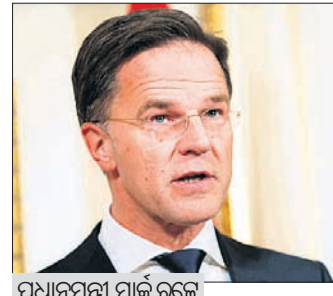
ପ୍ରଧାନମନ୍ତ୍ରୀ ମାର୍କ ରୁଟେ