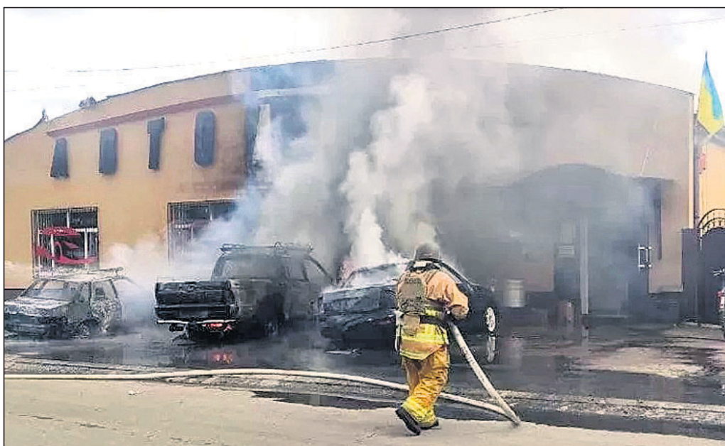
ରୁଷିଆ ମିଶାଇଲ ମାଡ଼ରେ ୟୁକ୍ରେନ୍ ୟୁଦ୍ଧରେ ଏକାଧିକ କାର୍ ଜଳିଯାଇଛି।

ଦେଶ ରକ୍ଷା ଉଦ୍ଦେଶ୍ୟରେ ଦୀର୍ଘ ୫୦୦ ଦିନ ଧରି ଲଢ଼େଇ କାରି ରଖିଥିବା ପ୍ରତ୍ୟେକ ସୈନ୍ୟଙ୍କୁ ଧନ୍ୟବାଦ। ୟୁକ୍ରେନ୍ ୟୁଦ୍ଧରେ ବିଜୟ ସୁନିଶ୍ଚିତ। —ଭୋଲୋଡିମିର ଜେଲେନ୍ସ୍କି, ୟୁକ୍ରେନ୍ ରାଷ୍ଟ୍ରପତି