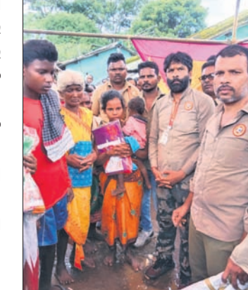
ମାଲିକଙ୍କ ସହ କଥାବାର୍ତ୍ତା ହୋଇ

ନବରଙ୍ଗପୁର ଡେପୁଟି ମ୍ୟୁନିସିପାଲ ଡ୍ରାଇଭର ମହାସଂଘ କର୍ମକର୍ତ୍ତା ଅର୍ଥ ସଂଗ୍ରହ କରି ୨୮ ତାରିଖରେ ସଡ଼କ ଦୁର୍ଘଟଣାରେ ମୃତ୍ୟୁବରଣ କରିଥିବା କର୍ମକର୍ତ୍ତାଙ୍କୁ ପରିବାରକୁ ସହାୟତା ଦେଇଛନ୍ତି।