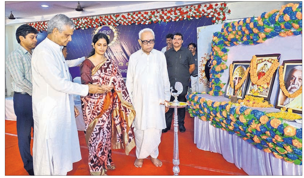
ବଲାଙ୍ଗୀର ପୃଥ୍ୱୀରାଜ ହାଇସ୍କୁଲ ଶତବାର୍ଷିକୀ କକ୍ଷରେ ଧରିତ୍ରୀର ୫୦ ବର୍ଷ ପଦାର୍ପଣ ଅବସରରେ ଅତିଥିମାନେ ପ୍ରଦୀପ ପ୍ରଜ୍ୱଳନ କରୁଛନ୍ତି ।