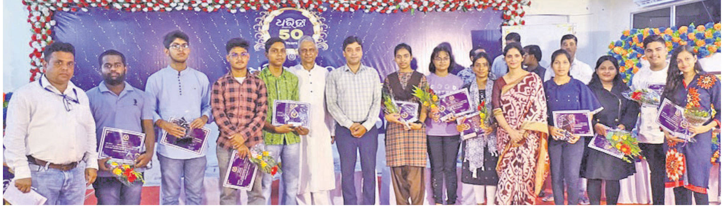
ଅତିଥିକ ଗହଣରେ ବକ୍ତୃତା ପ୍ରତିଯୋଗିତାରେ ପୁରସ୍କୃତ ହୋଇଥିବା ବିଭିନ୍ନ ଶିକ୍ଷାନୁଷ୍ଠାନର କୃତୀ ପ୍ରତିଯୋଗୀ ।