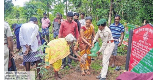
ଅତିଥି ଓ ଗ୍ରାମବାସୀ ଚାରାଚୋପଣ କରୁଛନ୍ତି।

ଡାକୁଗାଁ, ୮୭ (ପ୍ରଞ୍ଚାଳନା ପରିଚାଳନା) - ନବରଙ୍ଗପୁର ଜିଲ୍ଲା ଡାକୁଗାଁ ବ୍ଲକ୍ ଚରାଚୋପଣ ପଞ୍ଚାୟତ ଅଧୀନ ହକଦା ଶ୍ରମିକମାନଙ୍କୁ ଚାରାଚୋପଣ କରାଯାଇଛି।