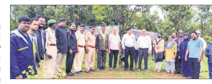
ଚାରାଚୋପଣ ଅବସରରେ ଡାକୁଗାଁ ଆଇନ ସହାୟକ ଅଧ୍ୟକ୍ଷମାନେ।