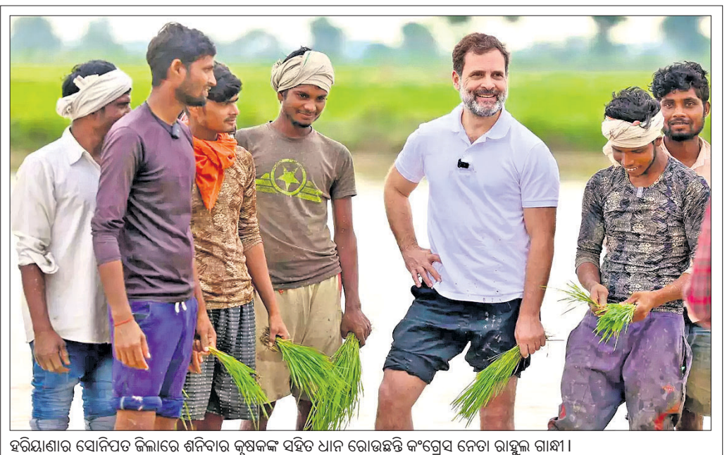
ହରିୟାଣାର ସୋନିପତ ଜିଲ୍ଲାରେ ଶନିବାର କୃଷକଙ୍କ ସହିତ ଧାନ ରୋଗରୁ ରକ୍ଷା ପାଇଁ କଂଗ୍ରେସ ନେତା ରାହୁଲ ଗାନ୍ଧୀ।