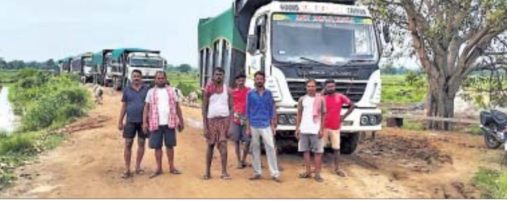
ବାଲିବୋଝେଇ ହାଲଡ଼ାକୁ ଗ୍ରାମବାସୀ ଅଟକାଇଛନ୍ତି ।

ବ୍ୟକ୍ତିଙ୍କ ଡାକିବା ଗ୍ରାମ ପଞ୍ଚାୟତ କାର୍ଯ୍ୟାଳୟ ଓ ରାଜ୍ୟ ନିରୀକ୍ଷକଙ୍କ କାର୍ଯ୍ୟାଳୟରେ ସର୍ବସାଧାରଣଙ୍କ ଅବଗତି ନିମନ୍ତେ ପ୍ରଦର୍ଶିତ କରାଯାଇଛି । ଡଚ୍ଚରେ ସହଯୋଗ କରିବା ପାଇଁ ଡଚ୍ଚ ସମୟରେ ଉଭୟ ସ୍ୱାମୀ ଓ ସ୍ତ୍ରୀ ଆବଶ୍ୟକ ପ୍ରମାଣପତ୍ର ଯଥା ଆଧାରକାର୍ତ୍ତ, ଭୋଟ ପରିଚୟ ପତ୍ର ଅର୍ଥଳ୍ପ ଓ ନକଲି ସାଥରେ ଆଣିବା ଜରୁରୀ । ଯୋଗ୍ୟ ବ୍ୟକ୍ତିଙ୍କୁ ଭୁଆଁବନ୍ଧନ ସମୟରେ ସରକାରଙ୍କ ରାଜ୍ୟ ବିଭାଗ ପତ୍ର ସଂଖ୍ୟା ୩୦୦୧୧୪୪/୨୧ ଅନୁ ୨୦୧୮ ଆଧାରରେ ଉଭୟ ସ୍ୱାମୀ ଓ ସ୍ତ୍ରୀଙ୍କ ନାମରେ ଆବଶ୍ୟକ ଭୁମିକୁ ରେକର୍ଡ କରାଯିବ । ଆବଶ୍ୟକ ପ୍ରମାଣପତ୍ର ନ ଥିଲେ, କୌଣସି ଦାବି ବା ଅଭିଯୋଗ କରିବାକୁ ଦିଆଯିବ ନାହିଁ । ସର୍ବିଶେଷ ତଥ୍ୟ ପୂରଣ ନିମନ୍ତେ ଉର୍ଦ୍ଧ୍ୱ ଆବେଦନ ପତ୍ର ପଞ୍ଚାୟତ ଓ ରାଜ୍ୟ ନିରୀକ୍ଷକଙ୍କ କାର୍ଯ୍ୟାଳୟରେ ଉପଲବ୍ଧ ଥିବା ନେଇ ରାଜନଗର ତହସିଲଦାରଙ୍କ ପକ୍ଷରୁ ଡାକବାଳି ଯନ୍ତ୍ର ଯୋଗେ ସୂଚନା ଦିଆଯାଇଛି ।