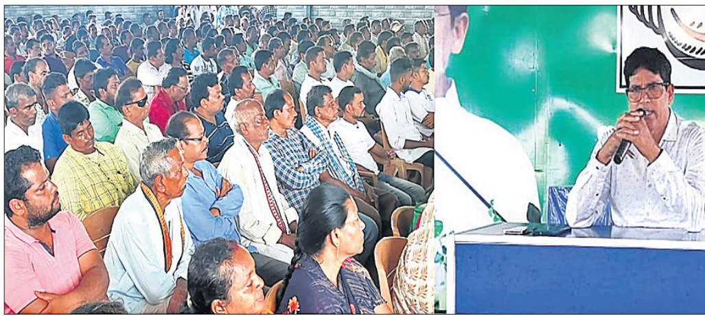
ସାଙ୍ଗଠନିକ ସଭାରେ ବିଧାୟକ ଅରୁଣ ସାହୁ ଉଦ୍‌ଘୋଷଣା କରୁଛନ୍ତି ।