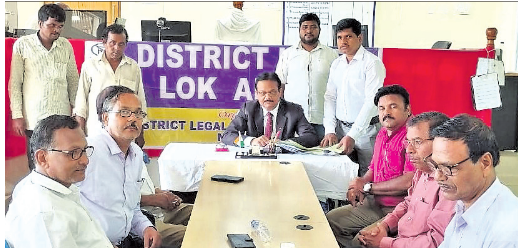
ଜିଲ୍ଲାପ୍ରଧାନ ଲୋକ ଅଦାଲତରେ ବିଚାରପତି ଓ ଅନ୍ୟମାନେ ।