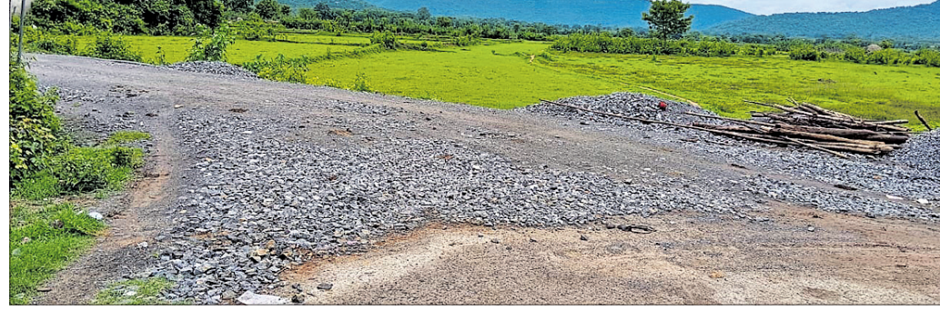
ପିଚୁ ନ ହୋଇ ପଡିଥିବା ରାସ୍ତା ।

ଖଣ୍ଡପଡ଼ା, ୮୭ (ଅଜୟ କୁମାର ମହାରଣା) ଖଣ୍ଡପଡ଼ା ବ୍ଲକ୍ ଅଧୀନ ଖଳିସାହି-ଆଡକଟା ମୁଖ୍ୟରାସ୍ତାଠାରୁ କୁମାରପଡ଼ା ଗ୍ରାମ ଦେଇ ନିକଟସ୍ଥ ଖଡ଼ଗପ୍ରସାଦ ଗ୍ରାମକୁ ସଂଯୋଗ କରୁଥିବା ପ୍ରଧାନମନ୍ତ୍ରୀ ଗ୍ରାମ ସଡ଼କର ଉନ୍ନତିକରଣ କାର୍ଯ୍ୟ ଅବଧି ଶେଷ ହେବାର ପ୍ରାୟ ୧୦ମାସ ବିତିଲା, ମାତ୍ର ରାସ୍ତା ନିର୍ମାଣ କାର୍ଯ୍ୟ ଅଧପରିତା ଭାବେ ପଡିଛି । ଏବେ ଗ୍ରାମର ଲୋକମାନଙ୍କ ମଧ୍ୟରେ ଅସନ୍ତୋଷ ପ୍ରକାଶ ପାଇଛି । ଖଣ୍ଡପଡ଼ା ଗ୍ରାମ୍ୟ ଉନ୍ନୟନ ବିଭାଗ ଅଧୀନରେ ଥିବା ଏହି ରାସ୍ତାର ଉନ୍ନତିକରଣ ନିମନ୍ତେ କେନ୍ଦ୍ର ସରକାରଙ୍କ ପ୍ରଧାନମନ୍ତ୍ରୀ ଗ୍ରାମ ସଡ଼କ ଯୋଜନାରେ ୨