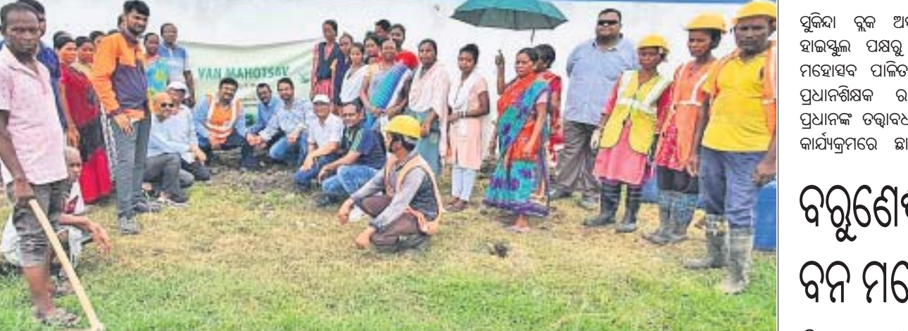
ବନ ମହୋତ୍ସବରେ ଯୋଗଦେଇଥିବା କର୍ମଚାରୀ ଓ ଅଧିକାରୀ ଟାଟା ରୋପଣ କରୁଛନ୍ତି।