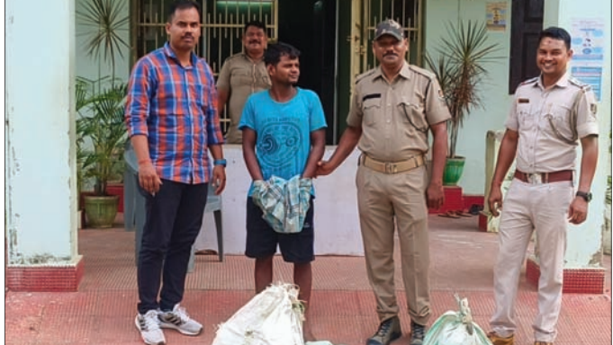
ଚୋରି ଘଟଣାରେ ଗିରଫ ଅଭିଯୁକ୍ତ, ଜବତ ହୋଇଥିବା ସାମଗ୍ରୀ ।