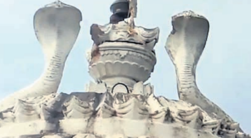
ଭାଙ୍ଗିଯାଇଥିବା ମନ୍ଦିରର ଉପର ଦୃଶ୍ୟ ।

ବନ୍ଧୁପଲ୍ଲୀ, ୮୭ (ପ୍ରକାଶ କୁମାର ପାଣି) ବନ୍ଧୁପଲ୍ଲୀ କୁଳ ଅନ୍ତର୍ଗତ ଯୋକାହାଣ୍ଡି ଗ୍ରାମରେ ଥିବା ପ୍ରଭୁ କପିଳେଶ୍ୱର ମହାଦେବ ମନ୍ଦିର ଉପରେ ବଜ୍ରପାତ ହୋଇ କିଛି ଅଂଶ ଭାଙ୍ଗିଯାଇଛି ।