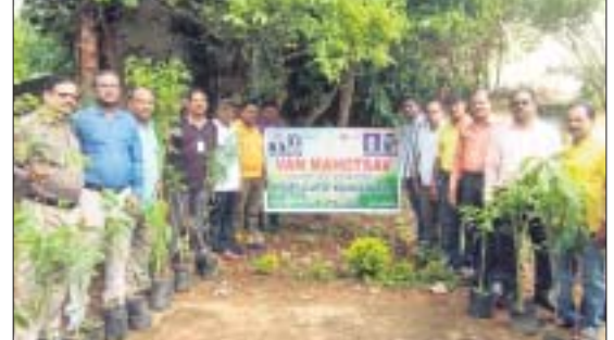
ବନ ମହୋତ୍ସବରେ ସାମିଲ ରୋଗୀର କୁଳର ସଦସ୍ୟ ଓ ଅନ୍ୟମାନେ ।

ରୋଗୀର କୁଳ ପକ୍ଷରୁ ବନମହୋତ୍ସବ ପ୍ରସ୍ତୁତ ହୋଇଯାଇଛି । ଏହି ଅବସରରେ ବ୍ୟାଧିଗ୍ରସ୍ତ ରୋଗୀର ଚିକିତ୍ସା ପ୍ରକାଶିତ ହୋଇଛି ।