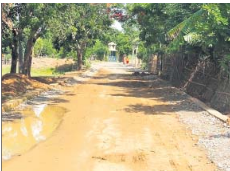
ରାସ୍ତା କାର୍ଯ୍ୟ ଅଧାପଡ଼ିଆ ହୋଇ ରହିଛି ।

କରିଥିବା ଦେଖିବାକୁ ମିଳିଛି । ପୂର୍ବରୁ ୩.୬୫ ମିଟର ପ୍ରସ୍ଥ ଥିବା ଏହି ରାସ୍ତା ନିର୍ମାଣ କାଳରେ ୫.୫ ମିଟର ରାସ୍ତାରେ ପରିଣତ ହେବ ।