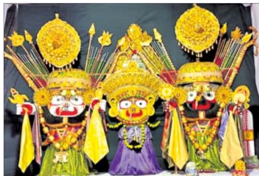
ଭାଲୁଖାଇ ଜଗନ୍ନାଥ ମନ୍ଦିରରେ ଠାକୁରଙ୍କ ଏକ ବେଶ ।

ପାଣିକୋଇଲି ମହାବୀର କଲୋନୀରୁ ଶୁକ୍ରବାର ରାତିରେ ଏକକାଳୀନ ୩ଘରୁ ଚୋରି ହୋଇଛି । ପାଣିକୋଇଲି ଥାନାର ଅନଚାହୁର ତଥା ଜିଲ୍ଲା ପୋଲିସ୍ ପୁଖ୍ୟାଳୟ ପକ୍ଷରୁ ଏହି କଲୋନୀରୁ ଚୋରି ଘଟଣା ପୋଲିସ୍ ପାଇଁ ତଥ୍ୟାଲୋଚନା ହୋଇଛି ।