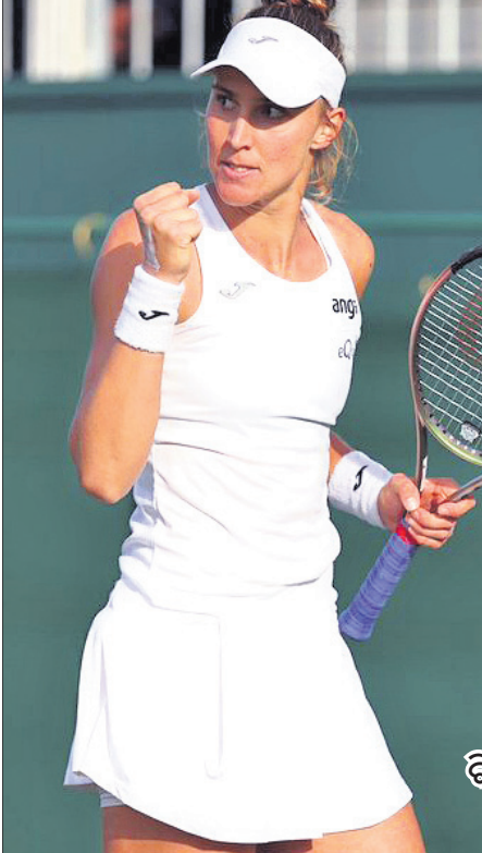
ବିକ୍ଟ୍ରି ହସାଦ ମାଇଆ

ଥିଆ ଡାନିଲ ମେଡଭେଡେଭ୍ ୪-୨, ୨-୩, ୨-୪ ଓ ୨-୪ ସେଟ୍‌ରେ ହଙ୍ଗେରୀର ମାର୍ଟିନ୍ ପୁଟୁକାଙ୍କୁ ପରାସ୍ତ କରିଛନ୍ତି। ପ୍ରଥମ ରାଉଣ୍ଡ ମ୍ୟାଟ୍ ହାରିଥିଲେ ମଧ୍ୟ ପରବର୍ତ୍ତୀ ୩ ରାଉଣ୍ଡ ମ୍ୟାଟ୍ ଜିତିଥିଲେ ମେଡଭେଡେଭ୍। ମହିଳା ସିଙ୍ଗଲ୍ସରେ ବିଶ୍ୱ ମାନ୍ୟତାର ୯ନମ୍ବର ସିଡ୍ ବେକ୍ ରିପଲ୍‌ସ୍କିର ପେଟ୍ରା କ୍ଲୋଗୋଭା ୨-୩ ଓ ୨-୫ ସେଟ୍‌ରେ ସର୍ବିୟାର ନାଗାଲିଆ କୋଷ୍ଟିକାଙ୍କୁ ପରାସ୍ତ କରିଛନ୍ତି। ଅନ୍ୟ ଏକ ମ୍ୟାଚ୍‌ରେ ରୁଷିଆର ଏକାଡେମିଆ ଆଲେକ୍ସାଣ୍ଡ୍ରୋଭା ୨-୦, ୨-୪ ସେଟ୍‌ରେ ହଙ୍ଗେରୀର ଡାନିଏଲ ଗାଲିଙ୍କୁ ପରାସ୍ତ କରିଛନ୍ତି। ୧୩ ନମ୍ବର ସିଡ୍ ଡାନିଲ୍ ସିଡ୍‌ସ୍ ହସାଦ ମାଇଆ ୨-୨, ୨-୨ ସେଟ୍‌ରେ ରୋମାନିଆର ସୋରାନା କ୍ରୁଷ୍ଟିଙ୍କୁ ପରାସ୍ତ କରି ଚତୁର୍ଥ ରାଉଣ୍ଡରେ ପ୍ରବେଶ କରିଛନ୍ତି।