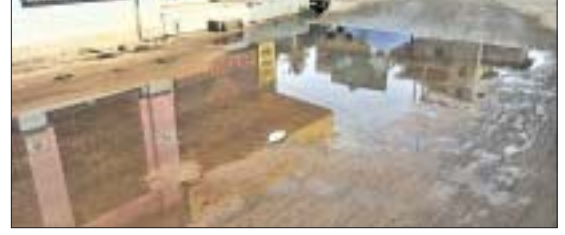
ଯାଜପୁର ପୌରପାଳିକାର ଏକ ରାସ୍ତାରେ ବର୍ଷାପାଣି ଜମିରହିଛି ।

ଯାଜପୁର ପୌରପାଳିକାର ବିଭିନ୍ନ ରାସ୍ତାରେ ବର୍ଷା ପାଣି ଜମି ରହୁଥିବା ଦେଖିବାକୁ ମିଳୁଛି । ଯାଜପୁର ସହର ସାରା ଖୋଲାମୋଲା ଡ୍ରେନ୍ ପରିଷ୍କାର ହୋଇ ପାଣି ଡ୍ରେନ୍‌କୁ ନ ଗଢ଼ି ରାସ୍ତାରେ ଜମି ରହୁଛି ।