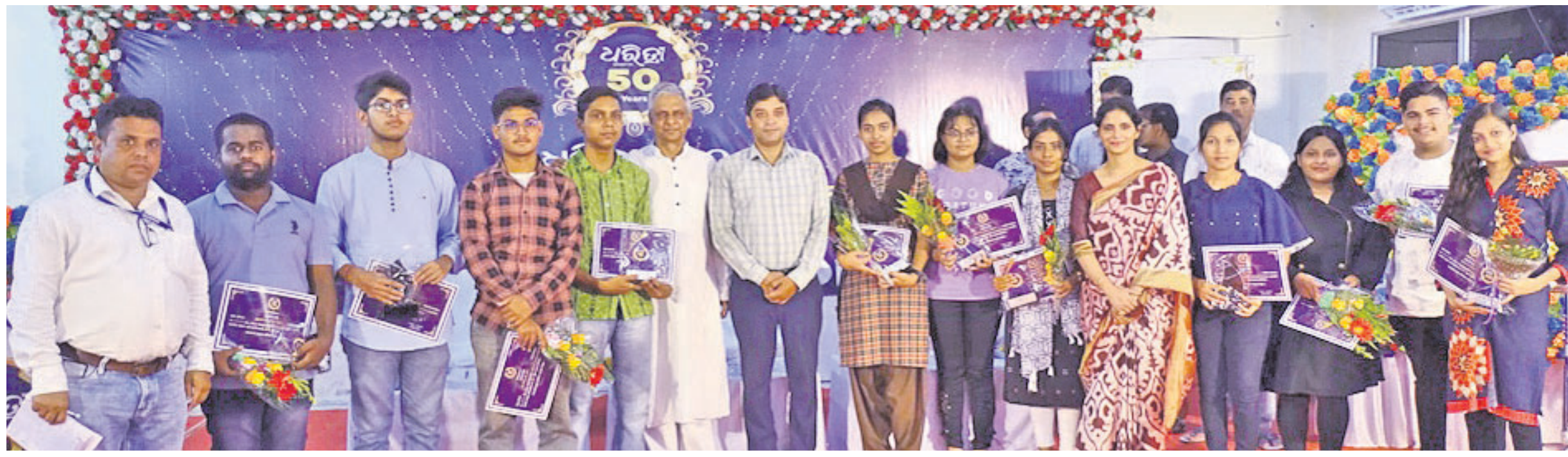
ଅତିଥିକ ଗହଣରେ ବକ୍ତୃତା ପ୍ରତିଯୋଗିତାରେ ପୁରସ୍କୃତ ହୋଇଥିବା ବିଭିନ୍ନ ଶିକ୍ଷାନୁଷ୍ଠାନର କୃତୀ ପ୍ରତିଯୋଗୀ।