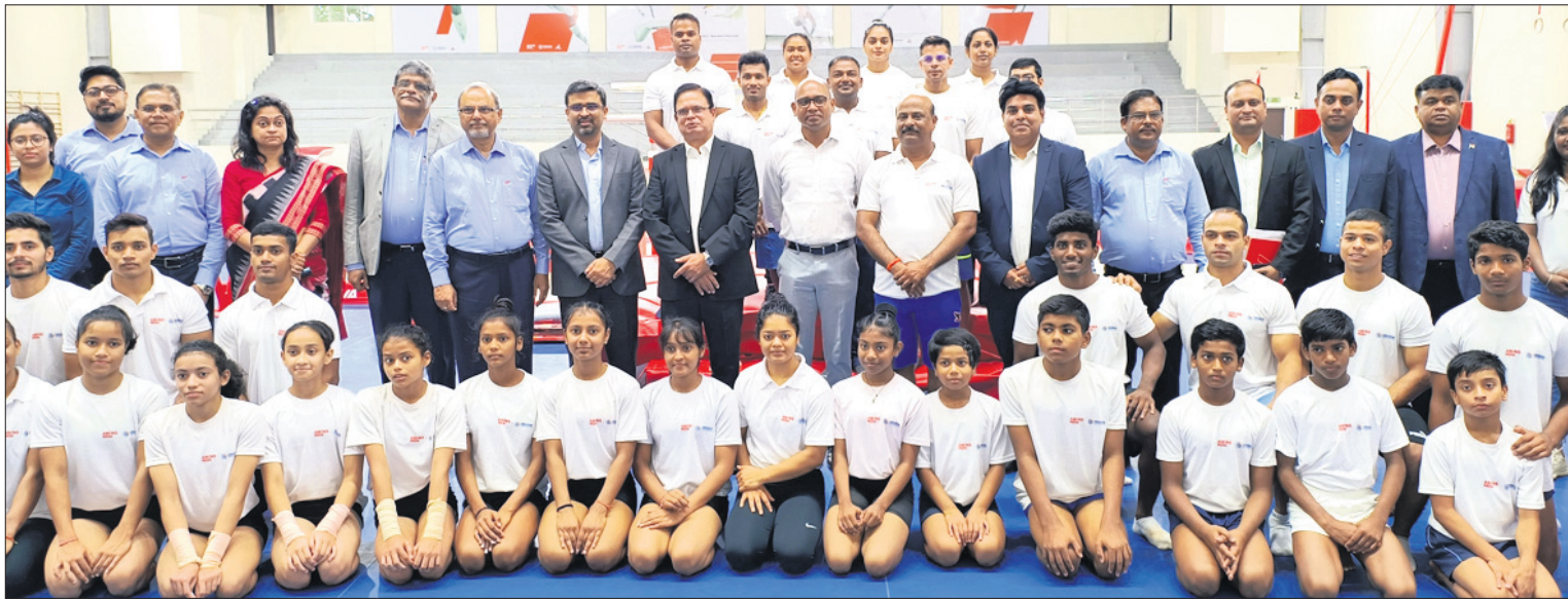
ଆର୍ଯ୍ୟକ ନିପନ୍ ଷ୍ଟିଲ ଲକ୍ଷ୍ମୀ (ଏଏସ୍‌ଏଫ୍) ଦିଲ୍ଲୀ ଉପରେ ଚାଟା ଷ୍ଟିଲ ଉପରେ ନିକଟରେ ଓଡ଼ିଶା ଏଏସ୍‌ଏଫ୍ ଲକ୍ଷ୍ମୀ କମ୍ପାନୀରୁ ଅନୁକାଳନ ପରିବର୍ତ୍ତନରେ ଆସିଷ୍ଟେନ୍ସ ପ୍ରଦାନ କରିଥିବାବେଳେ ପ୍ରତିଷ୍ଠା ଏବଂ ଭାରତକୁ ପୁରୁଷାର ଆଣିବାକୁ ଯେ ସହଯୋଗୀକ ଏହି ଅବସରରେ ଓଡ଼ିଶା ସରକାରଙ୍କ ଦ୍ୱାରା ବିଭାଗର ପ୍ରତିଷ୍ଠା ପ୍ରଦାନ ପ୍ରଦାନ ପ୍ରଦାନ, ଏଏସ୍‌ଏଫ୍ ଲକ୍ଷ୍ମୀର ମାନବ ସମ୍ପଦ ଓ ପ୍ରଶାସନ ବିଭାଗର ଉପାଧିକାରୀ ତେଜସ୍ୱୀ, ଏଏସ୍‌ଏଫ୍ ଲକ୍ଷ୍ମୀ ପ୍ରୋକେରର ଭିତ୍ତି ରାଜ୍ୟ ଭବନରେ, ଏଏସ୍‌ଏଫ୍ ଲକ୍ଷ୍ମୀ ଓଡ଼ିଶା ବ୍ରାନ୍ଚ ପ଼ିଲ୍ଲୀ ପ୍ରୋକେରର ସହ ଅଶୃଣୁ ରଥ ପ୍ରମୁଖ ଉପସ୍ଥିତ ଥିଲେ। ଏହି ପରିସ୍ଥିତିରେ ବିଭିନ୍ନ ବର୍ଗର କମ୍ପାନୀରୁ ଆସିଷ୍ଟେନ୍ସ ପ୍ରତିକାଳ ସହ ଉପକ୍ରମ ବିଭାଗର ଓ ଏଏସ୍‌ଏଫ୍ ଲକ୍ଷ୍ମୀର ଅଧିକାରୀଙ୍କର ଉପସ୍ଥିତ ଅଛନ୍ତି।

ସହ କାର୍ଯ୍ୟ କରୁଛି। ଯେଉଁଠିରେ ସମେଦନଶାଳ ଜୀବନଯାପନ କରୁଥିବା ବିବାହ ଉପରେ ଯୁକ୍ତ ଦିଆଯାଇଛି। ଆମର ବିଶ୍ୱାସ ରହିଛି, ଯଶମ ଓ ଆଇଆଇଟି ଦିଲ୍ଲୀ ଭଳି ସହଯୋଗୀକ ସହ ଜ୍ୟୋତିର୍ଗମୟ ଭଳି କାର୍ଯ୍ୟକ୍ରମର ସମ୍ଭବ ସହିତ ସମାନ ମୂଲ୍ୟରେ ରହିଛି ଏବଂ ଏହି ସହଯୋଗୀକର ସହାୟକାକୁ ନେଇ ଆମେ ବେଶ୍ ଉତ୍ସାହିତ ରହିଛୁ। ଉକ୍ତ ପ୍ରକଳ୍ପର ଲକ୍ଷ୍ୟ ହେଉଛି, ଦୁଧାମଣା ଓ ପଡ଼ି ପାଉଁଶ ଅଥବା ଲୋକକ ମଧ୍ୟରେ ଆସିଷ୍ଟେନ୍ସ ଟେକ୍ନୋଲୋଜି ଓ ଚା'ର ବ୍ୟବହାରକୁ ନେଇ ସଚେତନତା ସୃଷ୍ଟି କରିବା ଏବଂ ସେମାନେ ସମାଜରେ ତାହାର ସଚେତନତା ବଢ଼ାଇବା ଏବଂ ବ୍ୟବହାରକାରୀଙ୍କ ନେତୃତ୍ୱ ସମ୍ପ୍ରଦାୟ କରିବା। ଆସନ୍ତା ୨ ବର୍ଷରେ ୧୨୫୮ ଲକ୍ଷ ଭିନ୍ନଭିନ୍ନ ପ୍ରକଳ୍ପର ଅନୁଷ୍ଠାନ କରିବାକୁ ଲକ୍ଷ୍ୟ ରଖାଯାଇଛି।