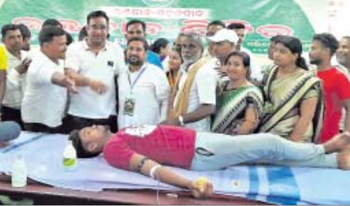
ବିଜେଡି ନେତୃବର୍ଗଙ୍କ ରକ୍ତ ସଂଗ୍ରହ ଅଭିଯାନ ।

କୋରୋନା ନିର୍ବାଚନ ପଣ୍ଡା ■ ବିଜେଡି ଶିବିର ଚଳଚଞ୍ଚଳ