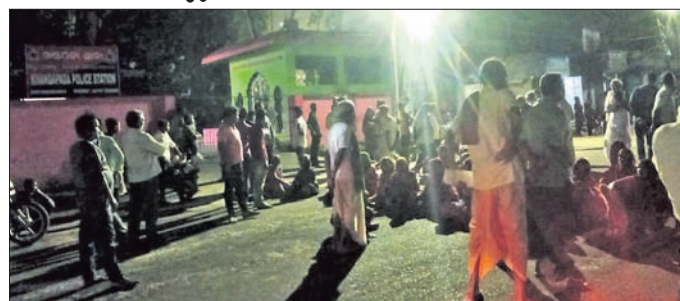
ଆନା ସମ୍ବୃଦ୍ଧି ଗ୍ରାମବାସୀ ରାସ୍ତା ଅବରୋଧ କରି ଦସିଛନ୍ତି ।

ଓଡ଼ିଶା ଲୋକ ସଭା ପ୍ରକଳ୍ପ ଉପ ପ୍ରାଥମିକ ବିଦ୍ୟାଳୟର ୩ ଶିକ୍ଷକଙ୍କୁ ଏକକାଳୀନ ସମ୍ବର୍ଦ୍ଧିତ କରାଯାଇଛି ।