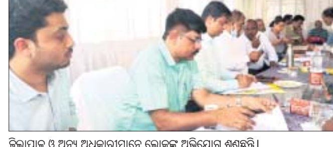
ଜିଲାପାଳ ଓ ଅନ୍ୟ ଅଧିକାରୀମାନେ ଲୋକଙ୍କ ଅଭିଯୋଗ ଶୁଣୁଛନ୍ତି।