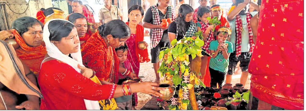
ଶ୍ରୀବତ୍ସ ମାସର ପ୍ରଥମ ସୋମବାରରେ ଭକ୍ତମାନେ ଧରଲେଶ୍ୱରଙ୍କୁ ଜଳଲାଗି କରୁଛନ୍ତି ।

ଧରଲେଶ୍ୱର ପୂର୍ବକୋଟି ନିର୍ମାଣ ପାଇଁ ଅନୁଷ୍ଠିତ ଶିଳାନ୍ୟାସ କାର୍ଯ୍ୟକ୍ରମରେ ଉପସ୍ଥିତ ଅତିଥିମଣ୍ଡଳ ।