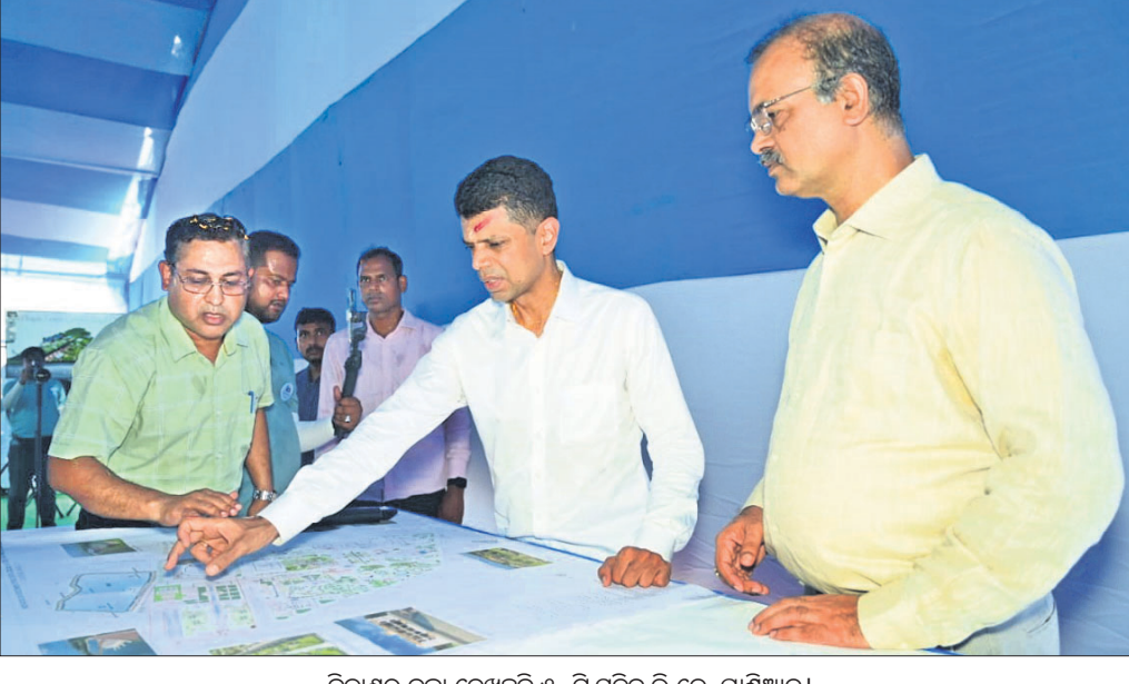
ବିକାଶର ନକ୍ସା ଦେଖୁଛନ୍ତି ୫-ଟି ସଚିବ ଭି.କେ. ପାଠିଆନ ।