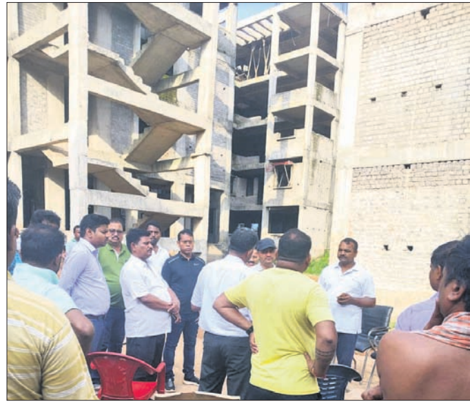
ଲୋକମାନଙ୍କ ସହ ଅଧିକାରୀମାନେ ଆଲୋଚନା କରୁଛନ୍ତି।

ଭୁବନେଶ୍ୱରରେ ଥିବା ବସ୍ତ୍ରପୁତ୍ରକର ଉନ୍ନତକରଣ ତଥା ବସ୍ତ୍ରବାସିନୀଙ୍କୁ ବିଭିନ୍ନ ଯୋଜନାରେ ଥଇଥାନ ନିମନ୍ତେ ଭୁବନେଶ୍ୱର ଉନ୍ନତକରଣ କର୍ମସଂସ୍ଥା (ବିତ୍ତ) ଓ ଭୁବନେଶ୍ୱର ମହାନଗର ନିଗମ (ବିଏମ୍‌ସି) ପକ୍ଷରୁ ନାନା ପଦକ୍ଷେପ ଗ୍ରହଣ କରାଯାଉଛି। ମାତ୍ର ନିର୍ଦ୍ଧାରିତ ସମୟ ମଧ୍ୟରେ ନିର୍ମାଣ କାର୍ଯ୍ୟ ସରୁ ନ ଥିବାରୁ ହିତାଧିକାରୀମାନେ ଲାଜବାନ ହୋଇପାରୁ ନାହାନ୍ତି। ରାଜ୍ୟ ଆବାସ ଯୋଜନା (ଇନ୍-ସିଟି ରିଡେଭେଲୋପମେଣ୍ଟ) ଅଧୀନରେ ନିର୍ମାଣ (ଆରମ୍ଭ) ନୋଡାଲ ଅଧିକାରୀଙ୍କୁ ବିଭିନ୍ନ ନିର୍ମାଣ କାର୍ଯ୍ୟ ଚାଲିଛି। ମାତ୍ର ଯେଉଁ କ୍ରମରେ ନିର୍ମାଣ କାର୍ଯ୍ୟ ସରିବା କଥା ଏ ଯାଏ ଚାହା ହୋଇପାରିନାହିଁ। ଏଠାରେ ମୋଟ ୫ଟି ବ୍ଲକ୍ ନିର୍ମାଣ କରାଯିବାକୁ ଥିବାବେଳେ ଏଯାବତ୍ ମାତ୍ର ୨ଟି ବ୍ଲକ୍ ନିର୍ମାଣ ହୋଇଛି। ତେଣୁ ନିର୍ମାଣ ଦାୟିତ୍ୱରେ ଥିବା 'ବ୍ରିକ୍ ଆଣ୍ଡ୍ ରୁଟ୍' ସଂସ୍ଥାକୁ ଭୁବନେଶ୍ୱର ନିର୍ମାଣ କର୍ମସଂସ୍ଥାରେ ବିଜୟ ଅନୁତମ କୁଳାବେ ନିର୍ଦ୍ଦେଶ ଦେଇଛନ୍ତି। ସେମାନଙ୍କୁ ନିର୍ଦ୍ଦେଶ ଦେଇଛନ୍ତି। ସେମାନଙ୍କୁ ନିର୍ଦ୍ଦେଶ ଦେଇଛନ୍ତି। ସେମାନଙ୍କୁ ନିର୍ଦ୍ଦେଶ ଦେଇଛନ୍ତି।