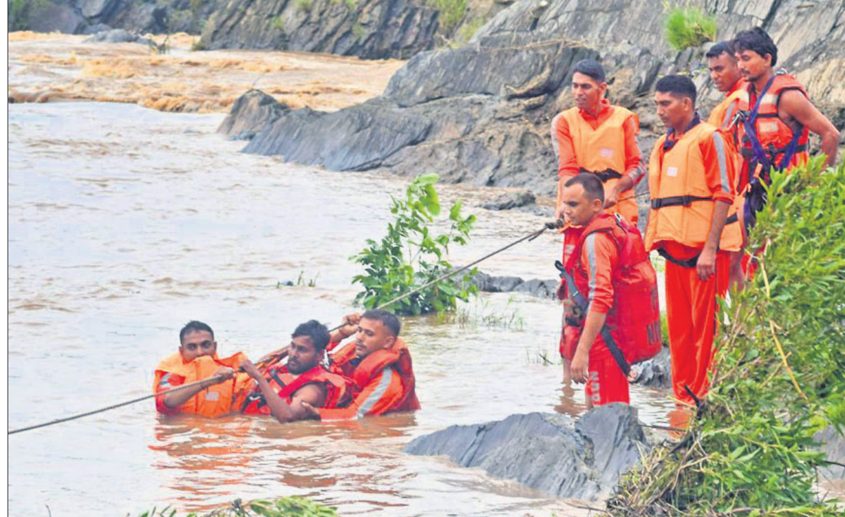
ନର୍ମଦା ନଦୀ ଜଳ ସ୍ଥଳିବା ପରେ ଫସିଥିବା ମସଜିଦ୍‌କୁ ଏନ୍ଡିଆରଏଫ୍ ଟିମ୍ ଉଦ୍ଧାର କରୁଛନ୍ତି।