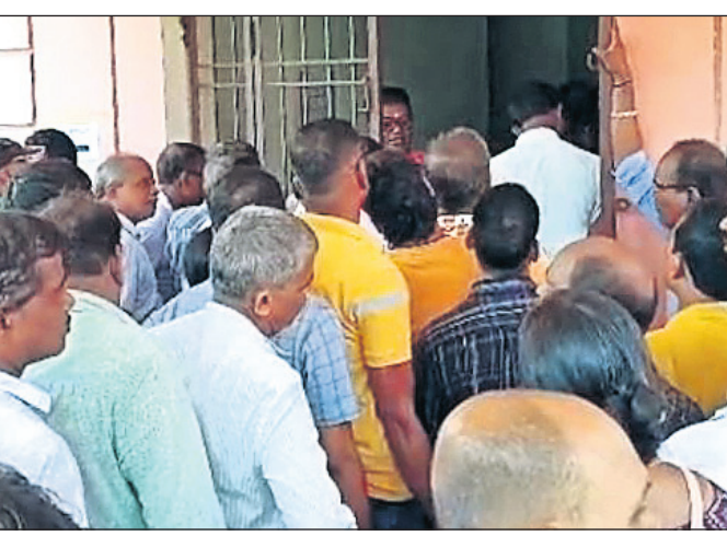
ମାଟ୍ରିକ ସାର୍ଟିଫିକେଟ ଡ୍ରଟି ସଂଗୋଧନ ପାଇଁ ଅଭିଭାବକଙ୍କ ଭିଡ ।