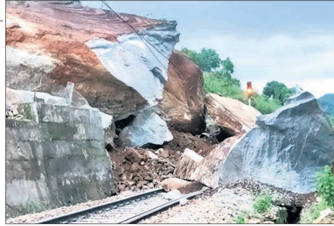
ରେଳ ଧାରଣା ଉପରକୁ ଖସିଥିବା ପଥର ।

କୋରାପୁଟ/ନନ୍ଦପୁର, ୧୦୭ (ଅନିଳଦାସ/ଶଙ୍କର ପୁଜାରୀ) ବିଶାଖାପାଟଣା କିରାଣୁଲ ରେଳ ଧାରଣାର କୋରାବାଲିଆ ଓ ବରା ଷ୍ଟେସନ ମଝିରେ ସୋମବାର ଅପରାହ୍ନରେ ପହାଡ଼ ଉପରୁ ଏକ ବିରାଟ ପଥର ରେଳ ଧାରଣାକୁ ଖସିଛି । ଫଳରେ ଏହି ରୁଟରେ ସମସ୍ତ ରେଳ ଚଳାଚଳ ସମ୍ପୂର୍ଣ୍ଣ ବନ୍ଦ କରାଯାଇଛି । ବିଶାଖାପାଟଣା କିରାଣୁଲ ରେଳ ଧାରଣାରେ ଏଭଳି ଅପରାହ୍ନ ଘଟଣା ଜଣାପଡ଼ିଛି । ପଥର ଖସିବା ସମୟରେ ଉକ୍ତ ଧାରଣା ବେଲ କୌଶିସି ଟ୍ରେନ ଚଳାଚଳ କରୁ ନ ଥିବାରୁ ଜିଲ୍ଲା ଗୁଣାଧର ଘଟଣା ସ୍ଥଳରେ ପହଞ୍ଚିଛି ।