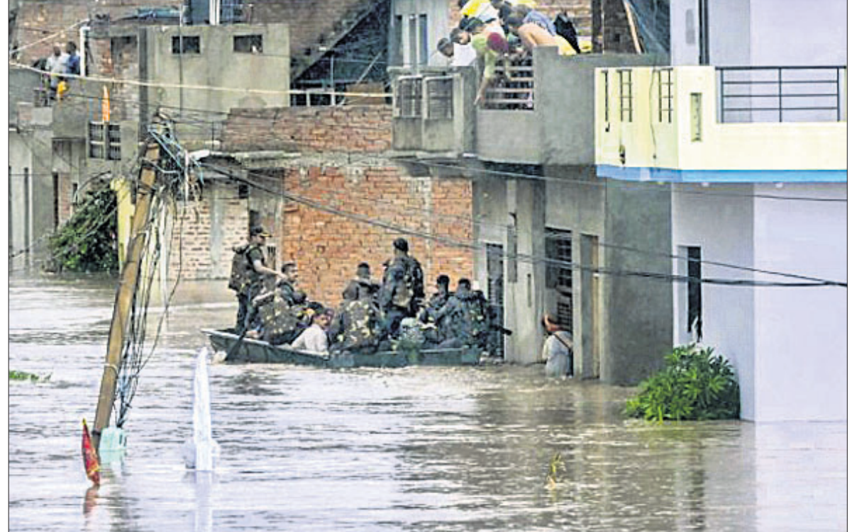
ବନ୍ୟା ଯୋଗୁଁ ପଡ଼ିଆଲା ଜିଲ୍ଲା ଗୋପାଳ କଲୋନୀରୁ ସ୍ଥାନୀୟ ଲୋକଙ୍କୁ ସୁରକ୍ଷିତ ସ୍ଥାନକୁ ସ୍ଥାନାନ୍ତର କରାଯାଇଛି ଆର୍ମି ସହାୟତା।