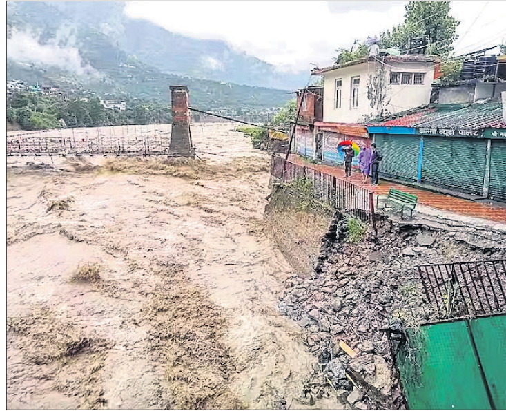
ବ୍ୟାସ ନଦୀରେ ବନ୍ୟାଜଳ ପ୍ରବାହିତ ହେବା ଯୋଗୁଁ ଭୂଖରା ଘାଟି ତ୍ରିକ୍ଟର ଅଧା ଭାଗ ଧୋଇ ହୋଇଯାଇଛି।