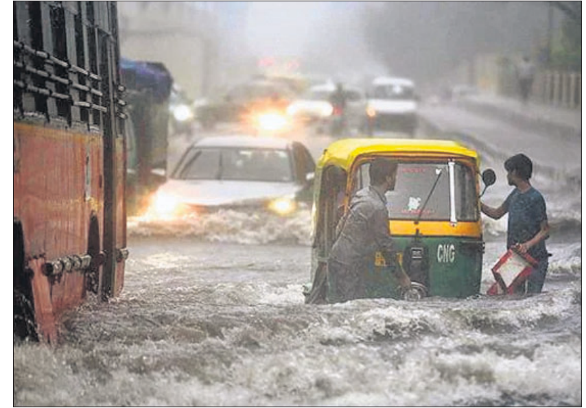
ପୂର୍ବ ଦିଲ୍ଲୀରେ ସୋମବାର ପାଣି ଜମିଥିବା ରାସ୍ତାରେ ଯିବାବେଳେ ଅଟୋ ଖରାପ ହୋଇଯାଇଛି।