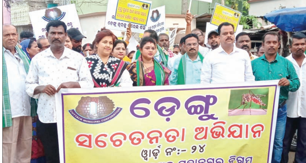
ସିଏମସି ୨୪ ନଂ ଖାର୍ଚ୍ଚରେ ଡେଇଁ ସଚେତନତା ଶୋଭାଯାତ୍ରା ।

କଟକ, ୧୦।୭ (ସୁପ୍ରିୟା ପ୍ରିୟଦର୍ଶିନୀ) କଟକ ମହାନଗର ନିଗମ (ସିଏମସି) ଅଧୀନ ୨୪ ନଂ ଖାର୍ଚ୍ଚରେ ସୋମବାର ଡେଇଁ ସଚେତନତା କାର୍ଯ୍ୟକ୍ରମ ଅନୁଷ୍ଠିତ ହୋଇଯାଇଛି । କର୍ପୋରେଟର ତଥା