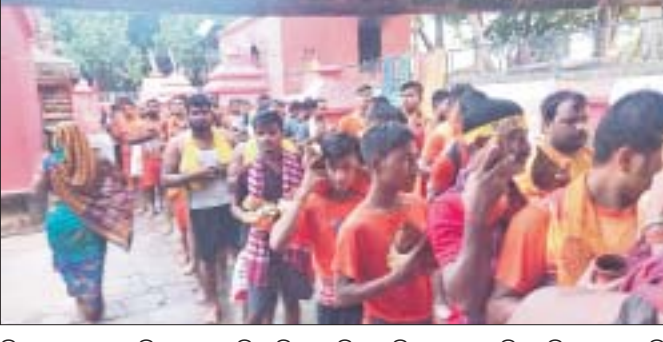
ସିଂହନାଥ ଦେବଙ୍କ ନିକଟରେ ପାଣି ଡାଳିବା ଲାଗି କାଉଡ଼ିଆମାନେ ଆଡ଼ିରେ ଠିଆ ହୋଇଛନ୍ତି।

ଶ୍ରାବଣ ମାସ ପ୍ରଥମ ସୋମବାର ପରିପ୍ରେକ୍ଷାରେ ବଡ଼ମ୍ବର ବିଭିନ୍ନ ଶ୍ରେଣି ପୀଠ ଚଳଚଞ୍ଚଳ ହୋଇଉଠିଛି। ରୋପାମାଥପୁର ନିକଟସ୍ଥ ମହାନଦୀ ମଧ୍ୟ ଭାଗରେ ଥିବା ପ୍ରଭୁ ସିଂହନାଥଦେବଙ୍କ ପୀଠରେ ଜଳଲାଗି ନିମନ୍ତେ କାଉଡ଼ିଆଙ୍କ ଭିଡ଼ ଜମିଛି।