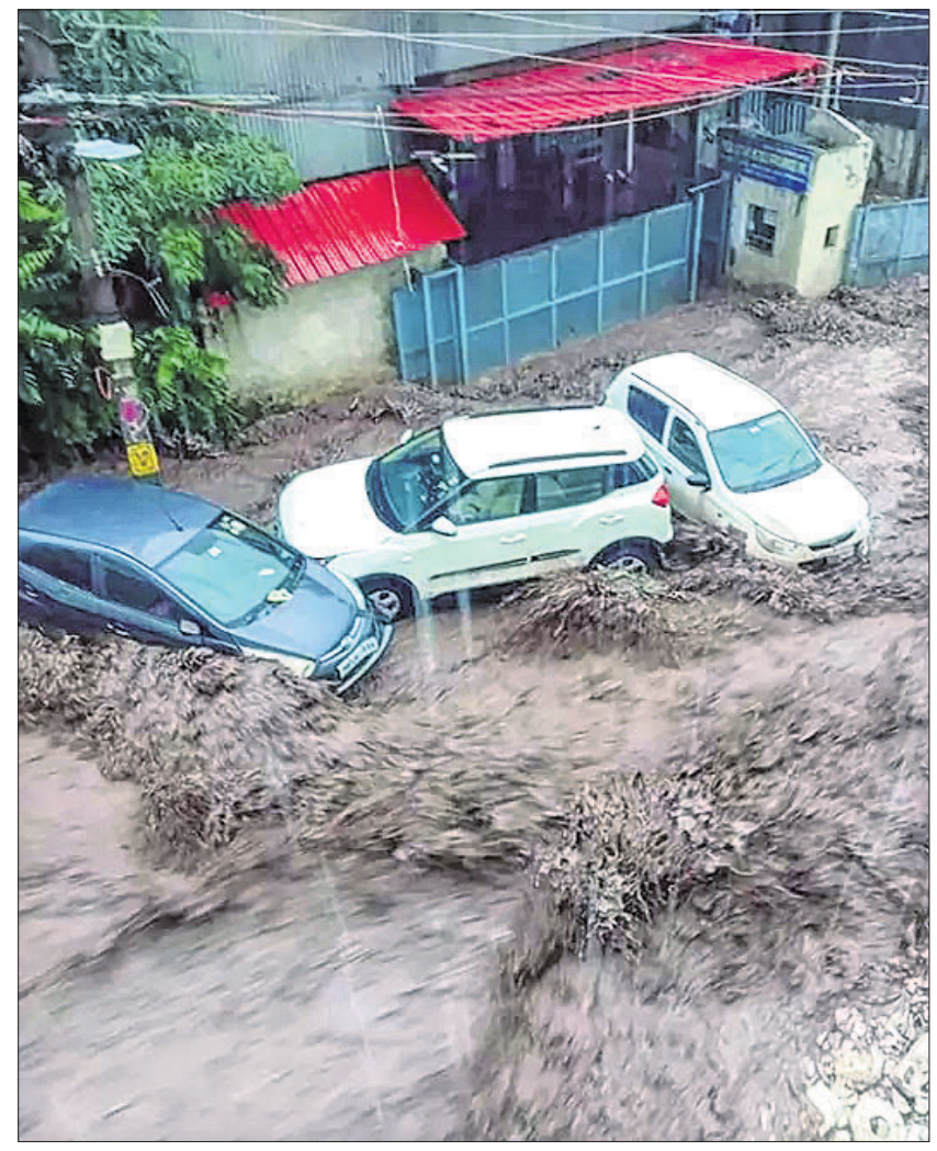
ହିମାଚଳ ପ୍ରଦେଶ ସୋଲାନରେ ବନ୍ୟା ଜଳରେ ଏକାଧିକ ଗାଡ଼ି ଭାସିଯାଇଛି।