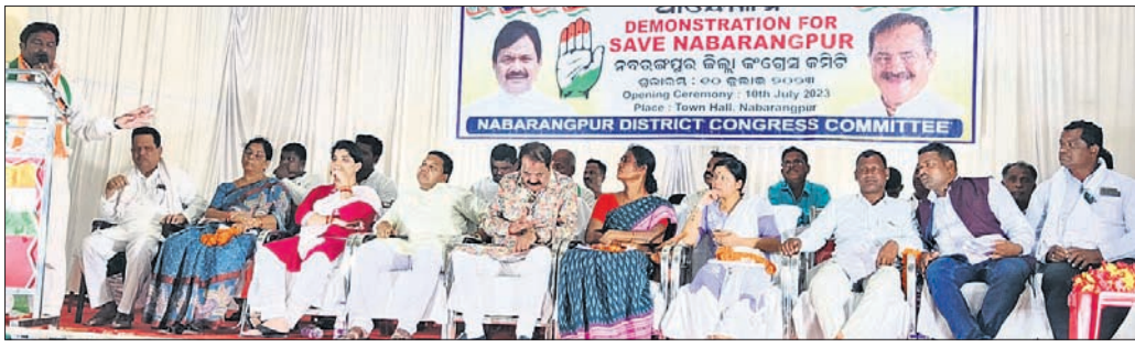
ନବରଙ୍ଗପୁର ବଞ୍ଚାଅ ଆନ୍ଦୋଳନ ଉପଲକ୍ଷେ ଆୟୋଜିତ ବୈଠକରେ ଉପସ୍ଥିତ କଂଗ୍ରେସ ନେତା ଓ ଦଳୀୟ କର୍ମୀ ।