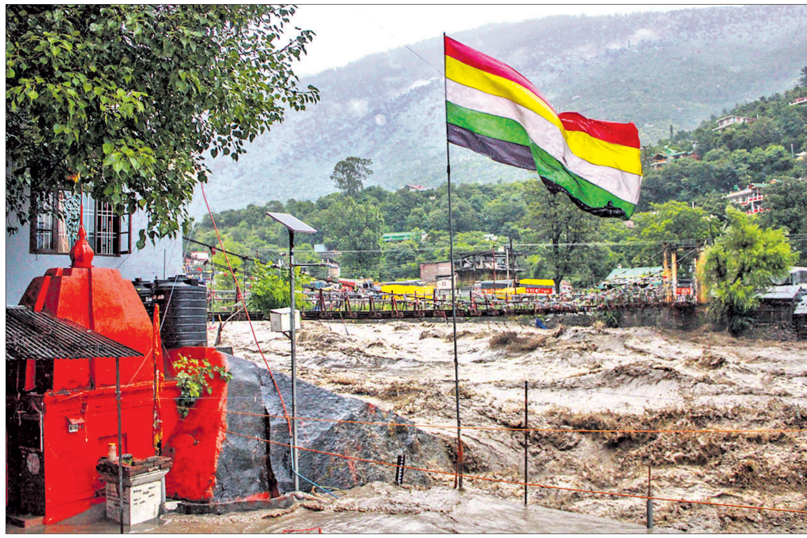
ହିମାଚଳ ପ୍ରଦେଶ କୁଲୁ ଜିଲ୍ଲା ବ୍ୟାସ ନଦୀରେ ବନ୍ୟା ଜଳ ପ୍ରବାହିତ ହେଉଛି।