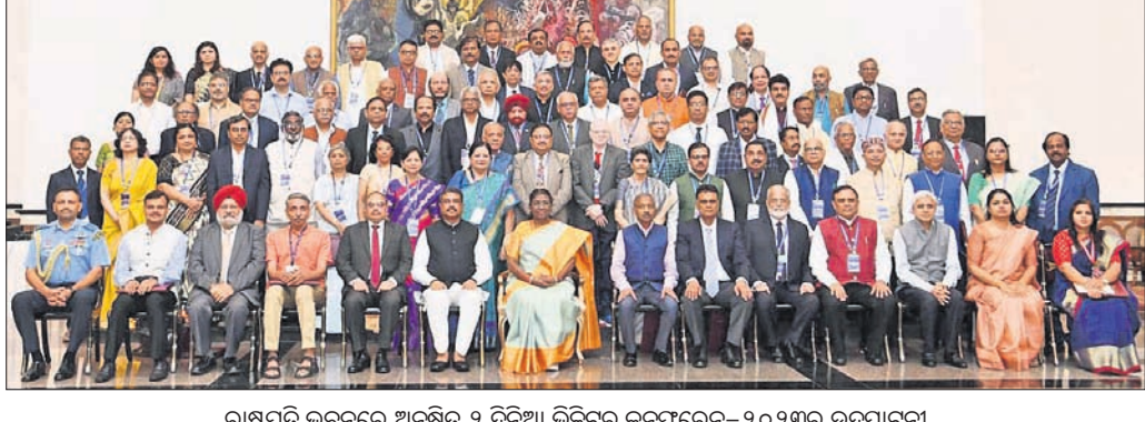
ରାଷ୍ଟ୍ରପତି ଭବନରେ ଅନୁଷ୍ଠିତ ୨ ଦିନିଆ ଭିଜିଟର କର୍ମସମେତ-୨୦୨୩ର ଉଦ୍‌ଘାଟନ ସମାରୋହରେ ରାଷ୍ଟ୍ରପତି ଟ୍ରୋପିକା ପୂର୍ଣ୍ଣ, କେନ୍ଦ୍ରମନ୍ତ୍ରୀ ଧର୍ମେନ୍ଦ୍ର ପ୍ରଧାନ ଓ ଅନ୍ୟମାନେ ।

ଜିଲ୍ଲା ମୁଖ୍ୟମନ୍ତ୍ରୀଙ୍କୁ ଭେଦରେ କ୍ରମାଂକିତ ଭାବରେ ନିର୍ବାଣକୁ ପ୍ରାଥମିକତା ଦିଆଯିବ । ସେମାନଙ୍କୁ ନୈତିକତା, ସମ୍ବେଦନଶୀଳତା ଏବଂ ପରୋପକାର ତଥା ଭାରତୀୟ ମୂଲ୍ୟବୋଧ ଆଧାରରେ ଶିକ୍ଷାର ଉପଯୋଗ କରିବା ପାଇଁ ସମର୍ଥ କରିବାକୁ ସୋମବାର ରାଷ୍ଟ୍ରପତି ଭବନରେ ଅନୁଷ୍ଠିତ ୨ ଦିନିଆ 'ଭିଜିଟର କର୍ମସମେତ-୨୦୨୩'ର ଉଦ୍‌ଘାଟନ ସମାରୋହରେ ରାଷ୍ଟ୍ରପତି