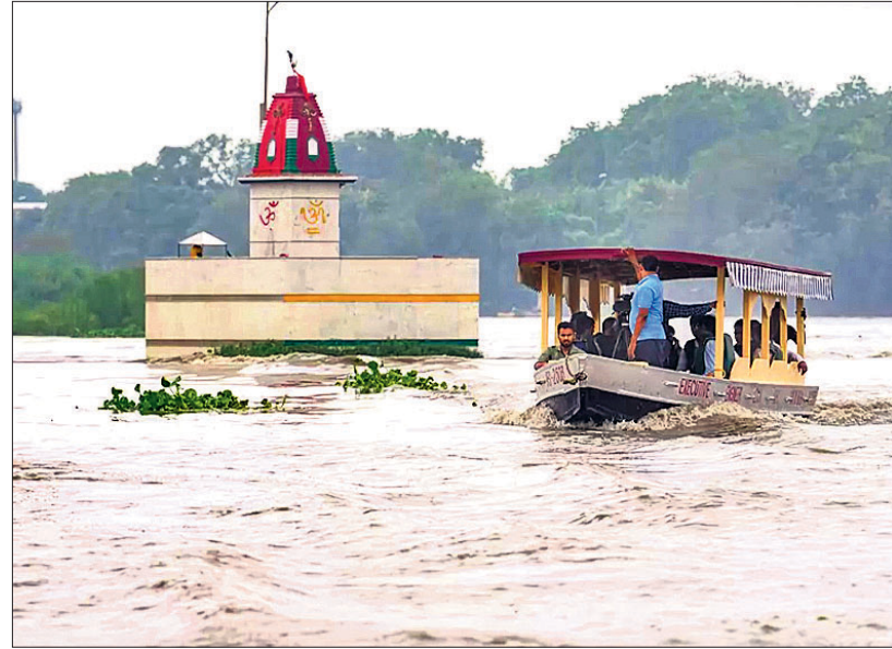
ଯମୁନା ନଦୀରେ ଜଳସ୍ତର ବଢ଼ିଥିବାବେଳେ ଲୋକମାନେ ବୋଟ୍ରେ ଯାଉଛନ୍ତି।

ପ୍ରଧାନମନ୍ତ୍ରୀ ନରେନ୍ଦ୍ର ମୋଦି ବରିଷ୍ଠ ମନ୍ତ୍ରୀ ଓ ଅଧିକାରୀମାନଙ୍କ ସହ କଥା ହୋଇ ସ୍ଥିତି ଅନୁଧ୍ୟାନ କରିଛନ୍ତି। ସ୍ଥାନୀୟ ପ୍ରଶାସନ, ଜାତୀୟ ବିପର୍ଯ୍ୟୟ ପ୍ରଶମନ ବଳ (ଏନ୍ଡିଆରଏଫ୍) ଏବଂ ରାଜ୍ୟ ବିପର୍ଯ୍ୟୟ ପ୍ରଶମନ ବଳ (ଏସ୍ଡିଆରଏଫ୍) ଟିମ୍ମଗୁଡ଼ିକ ପ୍ରଭାବିତ ଅଞ୍ଚଳରେ ଉଦ୍ଧାର ଓ ସହାୟତା କାର୍ଯ୍ୟରେ ନିଯୋଜିତ ଥିବା ପ୍ରଧାନମନ୍ତ୍ରୀଙ୍କ କାର୍ଯ୍ୟାଳୟ ପକ୍ଷରୁ କୁହାଯାଇଛି। ଉତ୍ତରାଖଣ୍ଡରେ ମଧ୍ୟ ଆକମ୍ପିକ ବନ୍ୟା ଓ ଭୂସ୍ଥଳ ଯୋଗୁଁ ସାଧାରଣ ଜୀବନଯାତ୍ରା ବ୍ୟାହତ ହୋଇଛି। ବିଭିନ୍ନ ନଦୀର ଜଳସ୍ତର ବିପଦ ସଙ୍କେତ ଅତିକ୍ରମ କରିଛି। ଲଗାଣ ବର୍ଷା ଯୋଗୁଁ ରାସ୍ତାରେ ପାଣି ଜମିରହିଥିବାରୁ ଅଞ୍ଚଳଗୁଡ଼ିକ ଜଳାଶୟ ହୋଇଛି। ଲଗାଣ ସୋମବାର ଦିନା ଓ ଗୁରୁଗ୍ରାମରେ ସ୍ଥଳଗୁଡ଼ିକ ବନ୍ଦ ରହିଥିଲା। ଗ୍ରାମିକ ଜାମ ଯୋଗୁଁ କର୍ପୋରେଟ ହାଉସଗୁଡ଼ିକ ସେମାନଙ୍କ କର୍ମଚାରୀମାନଙ୍କୁ ଘରେ ରହି କାମ କରିବାକୁ ପରାମର୍ଶ ଦେଇଛନ୍ତି। ହରିୟାଣା ହାଥନିକୁଣ୍ଡ ବ୍ୟାରେକ୍ଟର ଯମୁନା ନଦୀକୁ ଲକ୍ଷେ କ୍ୟୁସେକ୍ଟରୁ ଅଧିକ ଜଳ ନିଷ୍କାସନ କରିବାକୁ ଦିଲ୍ଲୀ ସରକାର ବନ୍ୟା ସ୍ଥିତି ଉପରେ ଟାଣ୍ଟୁ ନକର ପ୍ରଶମନ ବଳ (ଏନ୍ଡିଆରଏଫ୍) ରଖିଛନ୍ତି। ଏଥିପାଇଁ ୧୬ଟି କଣ୍ଟୋଲ ରୁମ୍ ଖୋଲାଯାଇଛି। ମୁଖ୍ୟମନ୍ତ୍ରୀ କେକ୍ରିଓଲ ଉଚ୍ଚସ୍ତରୀୟ ବୈଠକରେ ବନ୍ୟା ସ୍ଥିତିକୁ ନେଇ ଆଲୋଚନା କରିଛନ୍ତି। ଯମୁନା ଜଳସ୍ତର ବିପଦ ସଙ୍କେତ ଚପିଲେ ନଦୀ କୂଳବର୍ତ୍ତୀ ଲୋକମାନଙ୍କୁ ସୁରକ୍ଷିତ ସ୍ଥାନକୁ ସ୍ଥାନାନ୍ତର କରାଯିବ ବୋଲି ସେ କହିଛନ୍ତି। ଜମ୍ମୁ-କଶ୍ମୀରର କଠୁଆ ଓ ସାମ୍ବା ଜିଲ୍ଲାରେ ରେଡ୍ ଆଲର୍ଟ ଜାରି ହୋଇଛି। ରାଜସ୍ଥାନ, ପଞ୍ଜାବ ଓ ହରିୟାଣାରେ ଅତିକ୍ରମ କରିଛି। ଲଗାଣ ବର୍ଷା ଯୋଗୁଁ ପ୍ରବଳ ବର୍ଷା ଯୋଗୁଁ ଖାଲୁଆ ରାସ୍ତାରେ ପାଣି ଜମିରହିଥିବାରୁ ଅଞ୍ଚଳଗୁଡ଼ିକ ଜଳାଶୟ ହୋଇଛି। ଲଗାଣ ବର୍ଷା ଯୋଗୁଁ କ୍ଷତିଗ୍ରସ୍ତ ହୋଇଥିବା ରାଜ୍ୟଗୁଡ଼ିକୁ ପିଏମ୍ କେନ୍ଦ୍ରର ପାର୍ଶ୍ଵକୁ ଅତିରିକ୍ତ ସହାୟତା ଯୋଗାଇଦେବା ଲାଗି କଂଗ୍ରେସ୍ ଅଧକ୍ଷ ମଲ୍ଲିକାର୍ଜୁନ ଖାର୍ଗେ କେନ୍ଦ୍ର ସରକାରଙ୍କୁ କହିଛନ୍ତି।