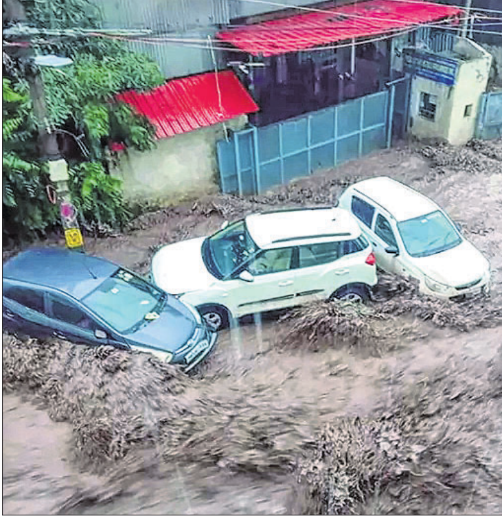
ହିମାଚଳ ପ୍ରଦେଶ ସୋଲାନରେ ବନ୍ୟା ଜଳରେ ଏକାଧିକ ଗାଡ଼ି ଭାସିଯାଇଛି।