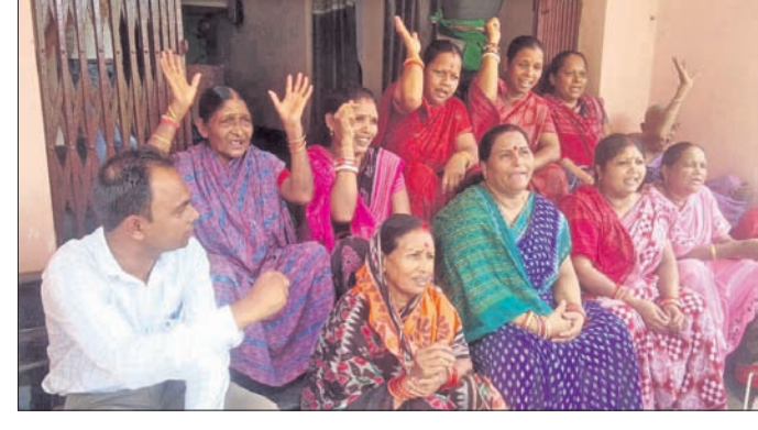
ପିଏଚ୍‌ଡି ପାଣି ଯୋଗାଣ ଦାବିରେ ଧାରଣା ।