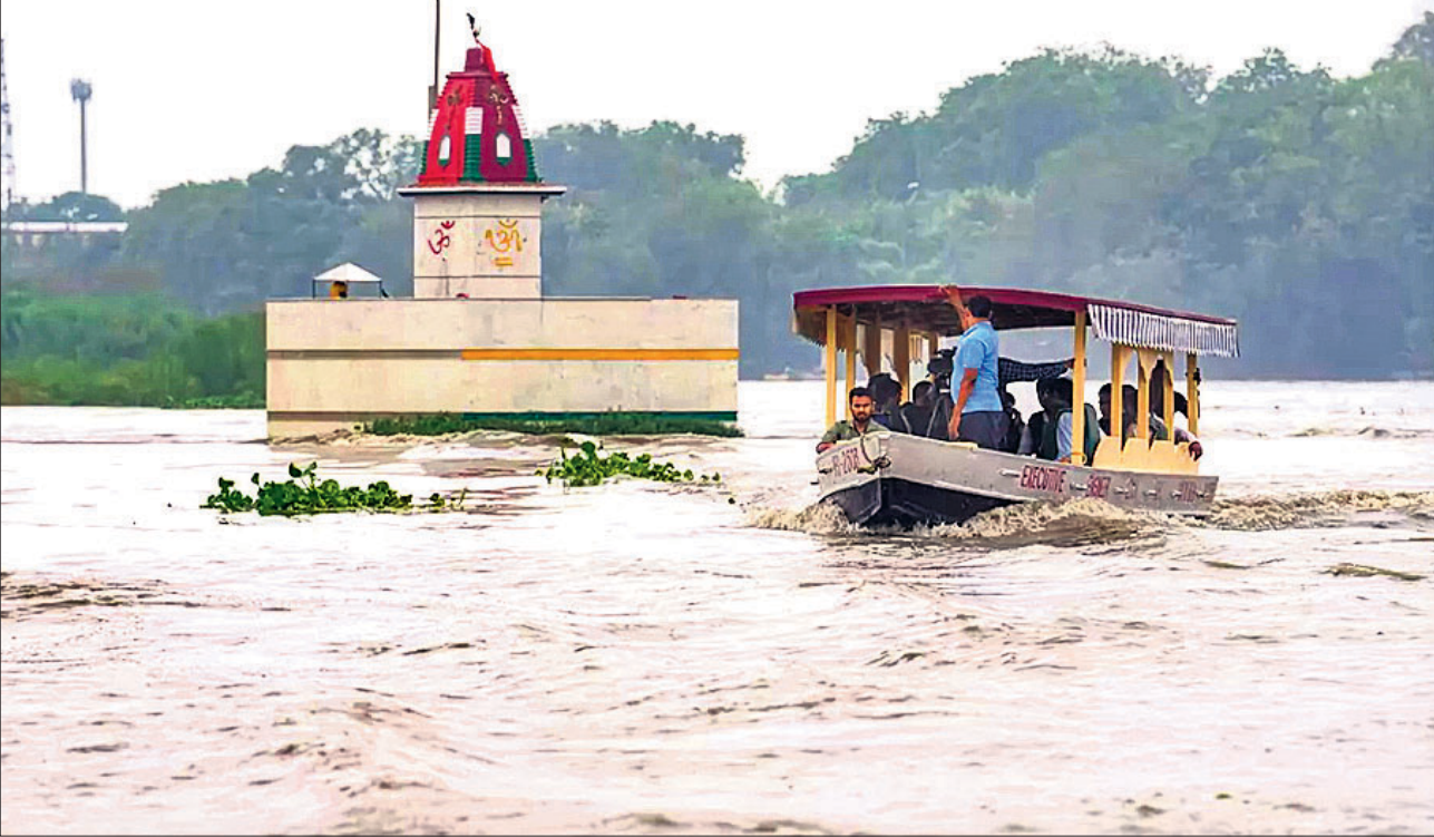
ଯମୁନା ନଦୀରେ ଜଳ ସ୍ତର ବଢ଼ିଥିବାବେଳେ ଲୋକମାନେ ବୋଟରେ ଯାଉଛନ୍ତି।