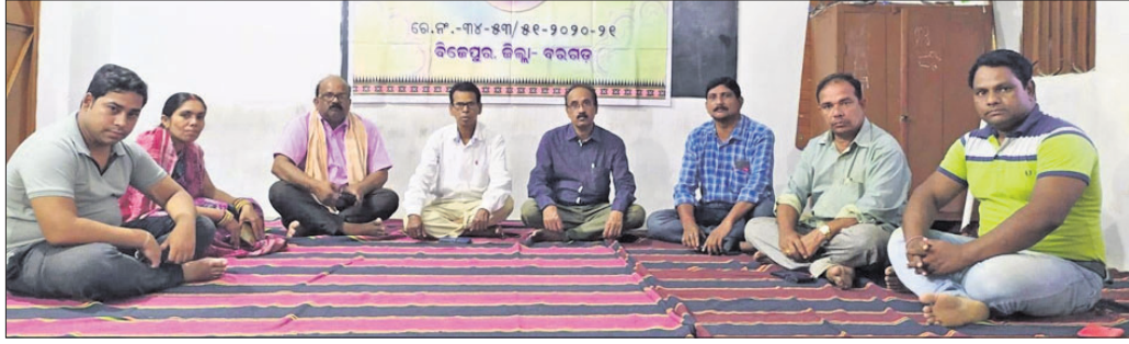
ବୈଠକରେ ପରିଷଦର କର୍ମକର୍ତ୍ତାଗଣ ।