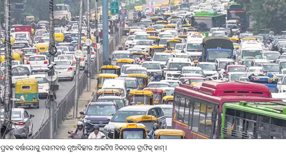
ପ୍ରବଳ ବର୍ଷାଯୋଗୁ ସୋମବାର ନୂଆଦିଲ୍ଲୀର ଆଇଟିଓ ନିକଟରେ ଗ୍ରାମିକ ଜାମ୍।

ଆଲୋଚନା କରିଛନ୍ତି। ଯମୁନା ଜଳସ୍ତର ବିପଦ ସଙ୍କେତ ଚପିଲେ ନଦୀ କୂଳବର୍ତ୍ତୀ ଲୋକମାନଙ୍କୁ ସୁରକ୍ଷିତ ସ୍ଥାନକୁ ସ୍ଥାନାନ୍ତର କରାଯିବ ବୋଲି ସେ କହିଛନ୍ତି। ୧୬ଟି କଣ୍ଠୋଲ ରୁମ୍ ଖୋଲାଯାଇଛି। ଜମ୍ମୁ-କଶ୍ମୀରର କଠୁଆ ଓ ସାମ୍ବା ଜିଲ୍ଲାରେ ରେଡ୍ ଆଲାର୍ଟ କାରି ହୋଇଛି। ରାଜସ୍ଥାନ, ପଞ୍ଜାବ ଓ ହରିୟାଣାରେ ପ୍ରବଳ ବର୍ଷା ଯୋଗୁ ଖାଲୁଆ ଅଞ୍ଚଳଗୁଡ଼ିକ ଜଳାଶୟ ହୋଇଛି। ଲଗାଣ ବର୍ଷା ଯୋଗୁ କ୍ଷତିଗ୍ରସ୍ତ ହୋଇଥିବା ରାଜ୍ୟଗୁଡ଼ିକୁ ପିଏମ୍ କେନ୍ଦ୍ରର ପାଣିକୁ ଅତିରିକ୍ତ ସହାୟତା ଯୋଗାଇଦେବା ଲାଗି କଂଗ୍ରେସ୍ ଅଧ୍ୟକ୍ଷ ମଲ୍ଲିକାର୍ଜୁନ ଖାର୍ଗେ କେନ୍ଦ୍ର ସରକାରଙ୍କୁ କହିଛନ୍ତି।