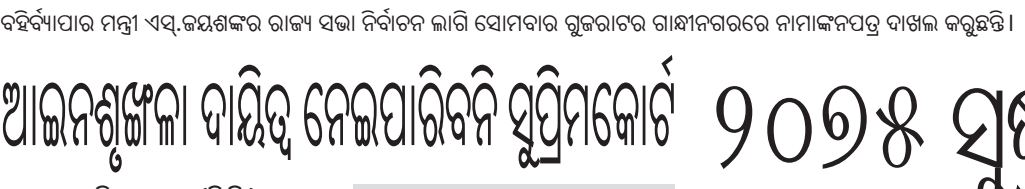
ବହିର୍ବ୍ୟାପାର ମନ୍ତ୍ରୀ ଏସ୍.ଜୟଶିଙ୍କର ରାଜ୍ୟ ସଭା ନିର୍ବାଚନ ଲାଗି ସୋମବାର ଗୁଜରାଟର ରାଜ୍ୟନଗରରେ ନାମାଙ୍କନପତ୍ର ଦାଖଲ କରୁଛନ୍ତି।