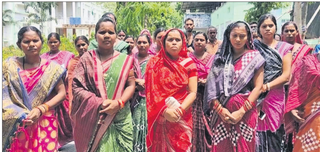
ଜିଲାପାଳଙ୍କୁ ଫେରାଦ ହୋଇଥିବା ଅଭିଭାବକମାନେ ।