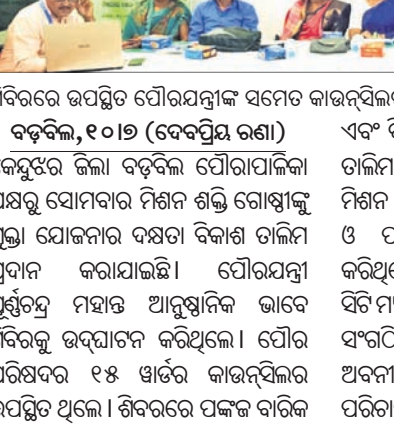
ଶିବିରରେ ଉପସ୍ଥିତ ଯୋଗସମ୍ପାଦକ ସମେତ କାର୍ଯ୍ୟକ୍ରମରେ ଅଂଶଗ୍ରହଣ କରୁଥିବା ଶ୍ରଦ୍ଧାଳୁମାନେ।

କେନ୍ଦୁଝର ଜିଲ୍ଲା ବଡ଼ବିଲ ଯୋଗସମ୍ପାଦକଙ୍କ ପକ୍ଷରୁ ଶ୍ରାବଣ ମାସ ପ୍ରଥମ ସୋମବାର ୧୫ ହଜାରରୁ ଊର୍ଦ୍ଧ୍ୱ ଶ୍ରଦ୍ଧାଳୁ ଜଳ ଲାଗି କରିଥିଲେ।