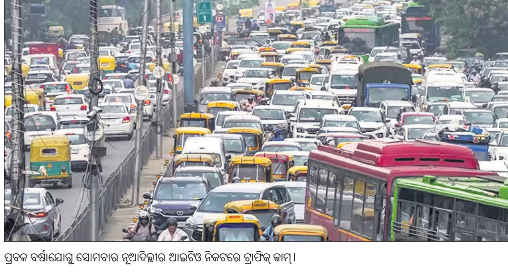
ପ୍ରବଳ ବର୍ଷାଯୋଗୁ ସୋମବାର ନୂଆଦିଲ୍ଲୀର ଆଇଟିଓ ନିକଟରେ ଗ୍ରାମିକ ଜାମ୍।

ଆଲୋଚନା କରିଛନ୍ତି। ଯମୁନା ଜଳସ୍ତର ବିପଦ ସଙ୍କେତ ଚପିଲେ ନଦୀ କୂଳବର୍ତ୍ତୀ ଲୋକମାନଙ୍କୁ ସୁରକ୍ଷିତ ସ୍ଥାନକୁ ସ୍ଥାନାନ୍ତର କରାଯିବ ବୋଲି ସେ କହିଛନ୍ତି। ୧୬ଟି କଣ୍ଟୋଲ ରୁମ୍ ଖୋଲାଯାଇଛି। ଜମ୍ମୁ-କଶ୍ମୀରର କଠୁଆ ଓ ସାମ୍ବା ଜିଲ୍ଲାରେ ରେଡ୍ ଆଲର୍ଟ କାରି ହୋଇଛି। ରାଜସ୍ଥାନ, ପଞ୍ଜାବ ଓ ହରିୟାଣାରେ ପ୍ରବଳ ବର୍ଷା ଯୋଗୁ ଖାଲୁଆ ଅଞ୍ଚଳଗୁଡ଼ିକ ଜଳାଶୟ ହୋଇଛି। ଲଗାଣ ବର୍ଷା ଯୋଗୁ କ୍ଷତିଗ୍ରସ୍ତ ହୋଇଥିବା ରାଜ୍ୟଗୁଡ଼ିକୁ ପିଏମ୍ କେନ୍ଦ୍ରର ପାଣିକୁ ଅତିରିକ୍ତ ସହାୟତା ଯୋଗାଇଦେବା ଲାଗି କଂଗ୍ରେସ୍ ଅଧ୍ୟକ୍ଷ ମଲ୍ଲିକାର୍ଜୁନ ଖାର୍ଗେ କେନ୍ଦ୍ର ସରକାରଙ୍କୁ କହିଛନ୍ତି।