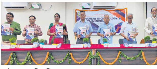
କାର୍ଯ୍ୟକ୍ରମରେ ଉପସ୍ଥିତ ଅତିଥିମାନେ।

ବାରିପଦା, ୧୦।୭(ନାଳଗିରି ବିହାରୀ ଦକ୍ଷପାଟ)- ବାରିପଦା ଚକଟପୁରସ୍ଥିତ ମହାରାଜା ଶ୍ରୀରାମଚନ୍ଦ୍ର ଭଞ୍ଜଦେଓ ବିଶ୍ୱବିଦ୍ୟାଳୟର ଜୈବ ପ୍ରଯୁକ୍ତି ବିଦ୍ୟା ବିଭାଗ ଦ୍ୱାରା ଆୟୋଜିତ ଏକ ସମ୍ବନ୍ଧିତ ପ୍ରଶିକ୍ଷଣ କାର୍ଯ୍ୟକ୍ରମ ଉଦଘାଟିତ ହୋଇଛି।