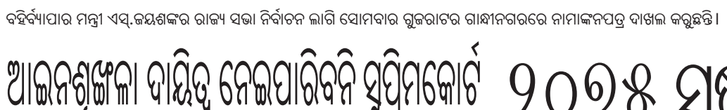
ବହିର୍ବ୍ୟାପାର ମନ୍ତ୍ରୀ ଏସ୍.ଜୟଶିଙ୍କର ରାଜ୍ୟ ସଭା ନିର୍ବାଚନ ଲାଗି ଘୋମବାର ଗୁଜୁରାଟର ଗାନ୍ଧୀନଗରରେ ନାମାଙ୍କନପତ୍ର ଦାଖଲ କରୁଛନ୍ତି।