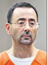
ଛୁରିରେ ଆକ୍ରମଣ କରିଥିଲେ। ଜଣେ ଦେଖଣୀହାତୀଙ୍କ କହିବା ଅନୁସାରେ ନାସାରଙ୍କ ପିଠି ଛାତିରେ ଗଭୀର ଆଘାତ

ଓଲିମ୍ପିକ୍, ୧୦୭ (ଏ.ପି) ଅଲିମ୍ପିକ୍ ପଦକ ବିଜେତାଙ୍କ ସମେତ ବହୁ ମହିଳା କ୍ରୀଡ଼ାଳୁ ଯୌନ ନିର୍ଯାତନା ଦେଇଥିବା ଅଭିଯୋଗରେ ଜେଲ ଦଣ୍ଡ ଭୋଗୁଥିବା କ୍ରୀଡ଼ାତାତ୍ତ୍ୱ ଲୀରି ନାସାରଙ୍କୁ ଛୁରା ମାଡ଼ ହୋଇଛି। ଫ୍ଲୋରିଡ଼ାରେ ଏକ ସଂଘୀୟ ବନ୍ଦୀଶାଳାରେ ଏହା ଘଟିଛି। କ୍ରୀଡ଼ା ତାତ୍ତ୍ୱରକ୍ ସହ ବନ୍ଦୀ ପରେ ଜେଲ୍‌ର ଜଣେ ଅନ୍ତେବାସୀ ତାଙ୍କୁ