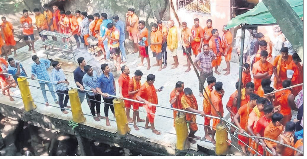
ପଞ୍ଚଲିଙ୍ଗେଶ୍ୱର ପୀଠରେ କାର୍ତ୍ତିକା ଛାଡ଼ିବା କର୍ମ।

ନାଳଗିରି, ୧୦।୭(ପ୍ରଶାନ୍ତ ବିଶ୍ୱାଳ) ଶ୍ରାବଣ ମାସର ପ୍ରଥମ ସୋମବାର। ଚଳଚଞ୍ଚଳ ହୋଇଉଠିଛି ବାବା ପଞ୍ଚଲିଙ୍ଗେଶ୍ୱର ଶୈବପୀଠ। ହର ହର ମହାଦେବ, ଓଁ ନମଃ ଶିବାୟ ଧ୍ୟାନରେ କର୍ମକ୍ରମ ଶୁଭେଚ୍ଚାଳିତ ହେଉଅଛି।