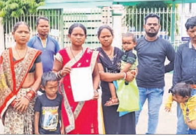
ବିଭୂତିକ ପରିବାର ସଦସ୍ୟ।

କେନ୍ଦୁଝର ସହର ଷଠିଘର ନିକଟରେ ଏନ୍.ଏସ୍.୨୦ରେ କୁନ୍.୨୭ବିକିଟର ରାତିରେ ବରଯାତ୍ରୀ ଉପରେ ଟ୍ରକ୍ ଚଢ଼ି ଯିବାରୁ ୫ ମୃତ୍ୟୁବରଣ କରିଥିଲେ।