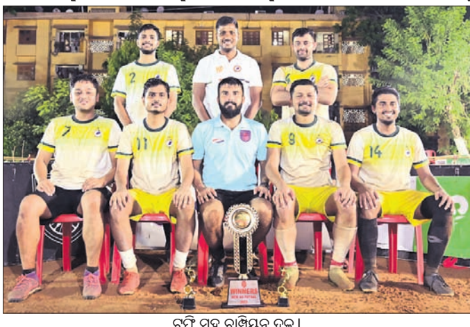
ଚୁଡ଼ି ସହ ଗାମ୍ପିୟନ ଦଳ।

ଭୁବନେଶ୍ୱର, ୧୦୭(ସେକେଟ କେନା) ଓଡ଼ିଶା ଫୁଟ୍‌ବଲ୍ କ୍ଲବ୍‌(ଏସ୍‌ସି) ପକ୍ଷରୁ ଆୟୋଜିତ ସିକ୍ସ ଏ ସାଇଡ୍ ଫୁଟ୍‌ବଲ୍ ଚୁନାମେଣ୍ଟରେ ଗାମ୍ପିୟନ ଆଖ୍ୟା ଅର୍ଜନ କରିଛି ନଟ୍ ଯେଟ୍ ଏସ୍‌ସି। ରିଲାଏଣ୍ଟ ଫାଉଣ୍ଡେସନ୍ ଓ ରୋଲ୍‌ନର୍ସ୍ ଏସ୍‌ସି ଆନୁକୂଲ୍ୟରେ ଏହି କଳୋନିରେ ଏହି ଚୁନାମେଣ୍ଟ ଲୁଲାଇ ୭୭୯ ଠାରେ ମଧ୍ୟରେ ଅନୁଷ୍ଠିତ ହୋଇଥିଲା। ସମଗ୍ର ରାଜ୍ୟକୁ ୩୨ ଦଳ ଏହି ଚୁନାମେଣ୍ଟରେ ଅଂଶଗ୍ରହଣ କରିଥିଲେ। ଫାଇନାଲ ମ୍ୟାଚ୍‌ରେ ନଟ୍ ଯେଟ୍ ଏସ୍‌ସି ୩-୧