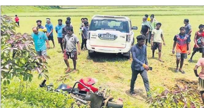
ଭୁବନେଶ୍ୱରସ୍ଥିତ ସ୍ୱର୍ପିତ ଧଳାରେ।

ନାଳଗିରି, ୧୦।୭(ପ୍ରଶାନ୍ତ ବିଶ୍ୱାଳ): ବାଲେଶ୍ୱର ଜିଲ୍ଲା ନାଳଗିରି ବ୍ଲକ ଅଧୋଧା ଫାଟି ଅଧୀନ ପାରଖା ପୋଲ ନିକଟରେ ସୋମବାର ପୂର୍ବାହ୍ନରେ ସ୍ୱର୍ପିତ ଧଳା ପଥକ ଧଳାରେ ମୃତ୍ୟୁ ହୋଇଥିଲା।