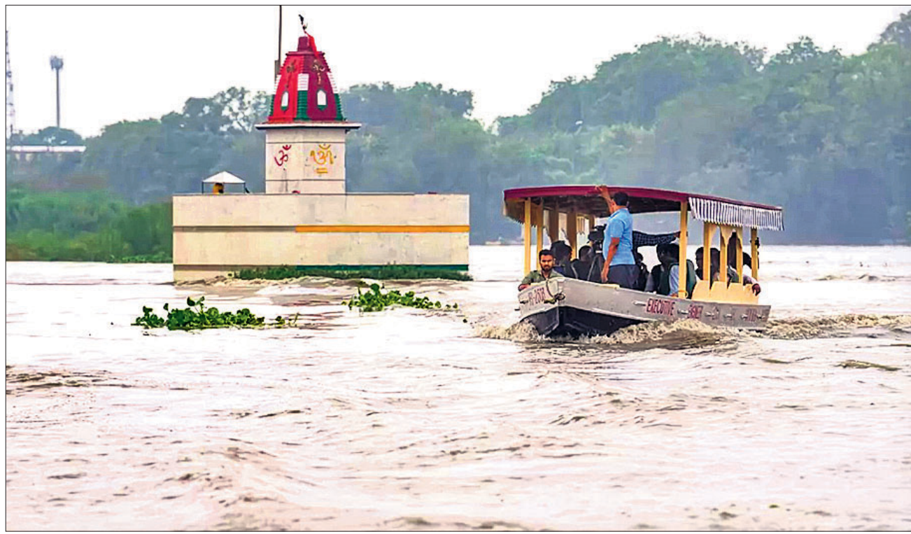
ଯମୁନା ନଦୀରେ ଜଳ ସ୍ତର ବଢ଼ିଥିବାବେଳେ ଲୋକମାନେ ବୋଟରେ ଯାଉଛନ୍ତି।