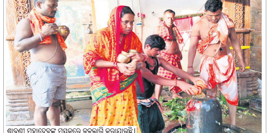
ଶ୍ରାବଣ ମହାଦେବଙ୍କ ମନ୍ତ୍ରକ୍ରେ ଜଳଲାଗି କରାଯାଇଛି।

ଆରଡ଼ି, ୧୦।୭(ବାସୁ ରଞ୍ଜନ ନାୟକ) ଜଗନ୍ନାଥ ପଞ୍ଚିକା ଅନୁସାରେ ବ୍ରତୀୟ ସୋମବାର ଭଦ୍ରକ ଜିଲ୍ଲା ଆରଡ଼ି ଆଖଣ୍ଡଳମଣି ପୀଠରେ ଶ୍ରାବଣ ମହାଦେବଙ୍କ ମନ୍ତ୍ରକ୍ରେ କାର୍ତ୍ତିକାମାନେ ଜଳଲାଗି କରିଛନ୍ତି।