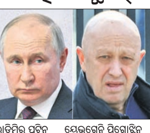
କ୍ରିମିଆର ପୁଟିନ୍ ସେଭଗେନି ପ୍ରିଗୋଡିନ

ମସ୍କୋ, ୧୦।୭: ରୁଷ୍ଟାୟ ସେନା ଓ ଫ୍ରେଜର ସେନା ମଧ୍ୟରେ ଦେଖିବାକୁ ମିଳିଥିବା ସ୍ୱଳ୍ପକାଳୀନ ବିଦ୍ରୋହର ୫ ଦିନ ପରେ ରାଷ୍ଟ୍ରପତି କ୍ରିମିଆର ପୁଟିନ୍ ଫ୍ରେଜର ମୁଖ୍ୟ ସେଭଗେନି ପ୍ରିଗୋଡିନଙ୍କୁ ଢେରିଥିବା ଘୋମବାର କ୍ରେମଲିନ ପକ୍ଷରୁ କୁହାଯାଇଛି। ଏହି ସାକ୍ଷାତ୍ କରୁ ୨୯ରେ ହୋଇଥିବା କ୍ରେମଲିନ ମୁଖ୍ୟପତ୍ର ଡିମିଟ୍ରି ପେସ୍କୋଭ ସୂତ୍ରୀ ଦେଖିଛନ୍ତି। ବୈଠକରେ ମୋଟ ୩୫ ଜଣ ସାମିଲ ଥିବାବେଳେ ୩ ଘଣ୍ଟା ଧରି ଆଲୋଚନା ଚାଲିଥିଲା। ପୁଟିନ୍ଙ୍କ ପାଇଁ ଫ୍ରେଜର ସେନା ଲଢ଼ିବାକୁ ପ୍ରସ୍ତୁତ ବୋଲି ଯୁଦ୍ଧ କମାଣ୍ଡର କହିଥିଲେ।