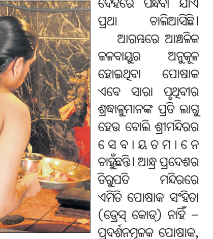
ମନ୍ଦିର ଭକ୍ତି ଅପେକ୍ଷା ଶରୀରର ଅଙ୍ଗ ପ୍ରଦର୍ଶନ ଯାହାର ଉଦ୍ଦେଶ୍ୟ ତାହା ବାରଣ-ତାଳିକାରେ ଅଛି, କିନ୍ତୁ ଲୋକଙ୍କ ଛି ଛାକର ଏହାକୁ ନିୟନ୍ତ୍ରଣ କରେ, ସେବାୟତମାନଙ୍କ ଦ୍ୱାରା ପ୍ରବର୍ତ୍ତନ ଡ୍ରେସ୍ କୋଡ୍ ନୁହେଁ। ଗୋଟିଏ କମ୍ପାନୀ ବା ଗୋଟିଏ ସ୍କୁଲର ଯୁଗିନୀ ସାମିତ ଓ ସ୍ଥାନୀୟ (ଆଞ୍ଚଳିକ)- ସେପରି ପୋଷାକ ଲାଗୁ କରିବା ଏକ କ୍ଷୁଦ୍ର ପରିସରରେ ସାମିତ, ଶ୍ରୀମନ୍ଦିର ଭଳି ବିଶ୍ୱପ୍ରସିଦ୍ଧ ଦେବାକନ୍ୟାରେ ଯେଉଁଠିକୁ ପୃଥିବୀର ବିଭିନ୍ନ ଦେଶରୁ ଶ୍ରଦ୍ଧାଳୁମାନେ ଆସି ସେମାନଙ୍କୁ ଅନୁଭବ ପକାଇବ। ଆରବ ମରୁଭୂମି, ମଙ୍ଗୋଲିଆ ବା ସାନ୍ତାଲଣ୍ଡର ଆରବ ମରୁଭୂମିର ବାଲି ବାପୁକୁ ଆସୁଥିବା ଭକ୍ତଙ୍କ ପାଇଁ କ'ଣ ବାରଣ କରିବା ନା ପୋଷାକ ଯୋଗାଇବାର ଗୋଦାମ

ପତଳା ଧଳା ଗୋପିତ୍ୟ ପୁଷ୍ପରେ ଦେଇ) ପୂଜା କ'ଣ ମଞ୍ଜିବର ମାନୀର ଉପରକୁ ଉଠିବ? ଆମ ଦେଶର ଦକ୍ଷିଣ ପ୍ରବେଶଗୁଡ଼ିକରେ, ବିଶେଷତଃ କନ୍ୟାକୁମାରୀ ପାଖ ଅଞ୍ଚଳରେ, ଲୋକେ ତ ଧୋତିକୁ ଲୁଗା ଭଳି ପିନ୍ଧନ୍ତି! କାରଣ ପବନ ଯା' ଆସ କରିପାରୁଥିବା ଭିନ୍ନ ପୋଷାକ ଖାଲକୁ ଉଡ଼ାଇଦେବ ତ ଦେହ ଅଣ୍ଡା ରହିବ! ପ୍ରବେଶ ପାଇଁ କନ୍ୟାକୁମାରୀର ସୂତାସୂତା ମନ୍ଦିରରେ ଭଡ଼ାରେ ମନ୍ଦିର ଭଣ୍ଡାରରୁ ଲୁଗା ଓ ଗଞ୍ଜି ପିନ୍ଧିବାଠାରୁ ହିମାଳୟର କେଦାରନାଥଠାରେ ବହୁ ପରସ୍ତ ଗରମ ପୋଷାକ ଦୁଇ ତିନି ଦିନର ଅଧିକାଂଶ ଦେହରେ ପିନ୍ଧିବା ଯାଏ ପ୍ରଥା ରାଜିଆସିଛି। ଆରମ୍ଭରେ ଆଞ୍ଚଳିକ ଜଳବାୟୁର ଅନୁକୂଳ ହୋଇଥିବା ପୋଷାକ ଏବେ ସାରା ପୃଥିବୀର ଶ୍ରଦ୍ଧାଳୁମାନଙ୍କ ପ୍ରତି ଲାଗୁ ହେଉ ବୋଲି ଶ୍ରୀମନ୍ଦିରର ସ୍ୱ.ପ. ଯ.ତ.ମ।.ନେ. ଗାନ୍ଧିଙ୍କୁ ଆଶ୍ର ପ୍ରବେଶ ଚିତ୍ରପତି ମନ୍ଦିରରେ ଏମିତି ପୋଷାକ ସଂହିତା (ଡ୍ରେସ୍ କୋଡ୍) ନାହିଁ - ପ୍ରଦର୍ଶନମୂଳକ ପୋଷାକ, ପ୍ରବର୍ତ୍ତନମୂଳକ ପୋଷାକ, ମନର ଭକ୍ତି ଅପେକ୍ଷା ଶରୀରର ଅଙ୍ଗ ପ୍ରଦର୍ଶନ ଯାହାର ଉଦ୍ଦେଶ୍ୟ ତାହା ବାରଣ-ତାଳିକାରେ ଅଛି, କିନ୍ତୁ ଲୋକଙ୍କ ଛି ଛାକର ଏହାକୁ ନିୟନ୍ତ୍ରଣ କରେ, ସେବାୟତମାନଙ୍କ ଦ୍ୱାରା ପ୍ରବର୍ତ୍ତନ ଡ୍ରେସ୍ କୋଡ୍ ନୁହେଁ। ଗୋଟିଏ କମ୍ପାନୀ ବା ଗୋଟିଏ ସ୍କୁଲର ଯୁଗିନୀ ସାମିତ ଓ ସ୍ଥାନୀୟ (ଆଞ୍ଚଳିକ)- ସେପରି ପୋଷାକ ଲାଗୁ କରିବା ଏକ କ୍ଷୁଦ୍ର ପରିସରରେ ସାମିତ, ଶ୍ରୀମନ୍ଦିର ଭଳି ବିଶ୍ୱପ୍ରସିଦ୍ଧ ଦେବାକନ୍ୟାରେ ଯେଉଁଠିକୁ ପୃଥିବୀର ବିଭିନ୍ନ ଦେଶରୁ ଶ୍ରଦ୍ଧାଳୁମାନେ ଆସି ସେମାନଙ୍କୁ ଅନୁଭବ ପକାଇବ। ଆରବ ମରୁଭୂମି, ମଙ୍ଗୋଲିଆ ବା ସାନ୍ତାଲଣ୍ଡର ଆରବ ମରୁଭୂମିର ବାଲି ବାପୁକୁ ଆସୁଥିବା ଭକ୍ତଙ୍କ ପାଇଁ କ'ଣ ବାରଣ କରିବା ନା ପୋଷାକ ଯୋଗାଇବାର ଗୋଦାମ