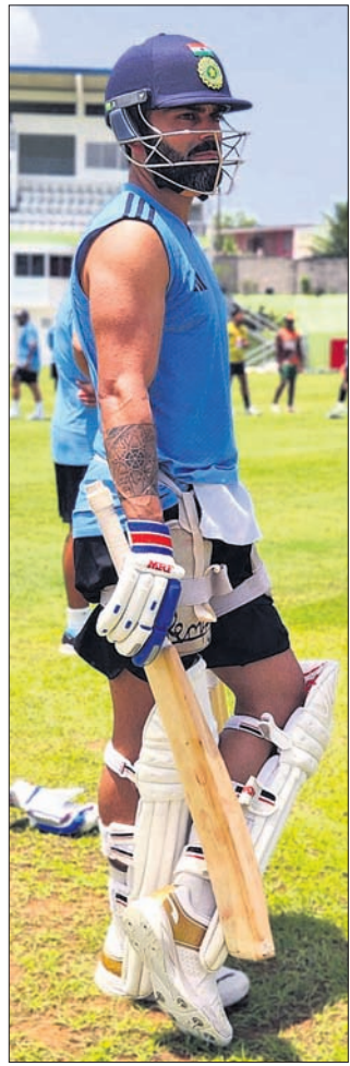
ନେତୃ ସେବନରେ ବିରାଟ କୋହଲି।

ଭାରତ ଓ ଫ୍ରେଣ୍ଡ୍‌ସ୍‌ସ୍‌ସ୍‌ ମଧ୍ୟରେ ଏହା ପୂର୍ବରୁ ମୋଟ ୨୪ଟି ଚେଷ୍ଟା ସିରିଜ୍ ଅନୁଷ୍ଠିତ ହୋଇଛି। ଏଥିରୁ ଫ୍ରେଣ୍ଡ୍‌ସ୍‌ସ୍‌ଙ୍କ ୧୨ଟିରେ ବିଜୟ ହୋଇଥିବାବେଳେ ଭାରତ ୧୦ଟି ସିରିଜ୍ ଜିତିଛି। ଅବଶିଷ୍ଟ ୨ଟି ସିରିଜ୍ ଡ୍ର ରହିଛି। ତେବେ ଏଥିରେ ଫ୍ରେଣ୍ଡ୍‌ସ୍‌ସ୍‌ଙ୍କ କ୍ରିକେଟ୍ ସୁବର୍ଣ୍ଣ ଯୁଗର ପ୍ରତିଫଳନ ରହିଛି। ମାତ୍ର ନିକଟ ଅତୀତର ପ୍ରଦର୍ଶନକୁ ଦେଖିଲେ ଭାରତ ଗତ ୮ଟି ସିରିଜ୍ରେ ଅପରାଜେୟ ରହିଛି। ଅର୍ଥାତ୍ ୨୦୦୨/୦୩ରୁ ଏପର୍ଯ୍ୟନ୍ତ ଭାରତ ଗୋଟିଏ ହେଲେ ସିରିଜ୍ ହାରିନାହିଁ।