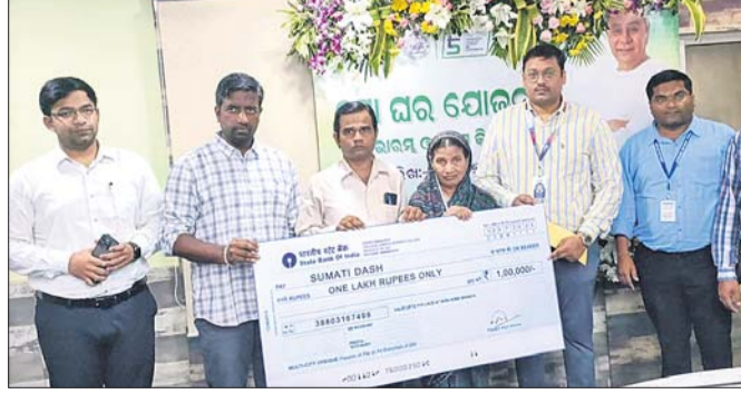
ଜଣେ ହିତାଧିକାରୀଙ୍କୁ 'ମୋ ଘର' ଯୋଜନାର ଚେକ୍ ବ୍ୟବସ୍ଥା କରାଯାଇଛି ।

ଗଞ୍ଜାମ ଜିଲ୍ଲାର 'ମୋ ଘର' ଯୋଜନାରେ ନୂତନ ଗୃହ ନିର୍ମାଣ ସମାପ୍ତ ହେବାକୁ ଆବେଦନ କରିଥିବା ହିତାଧିକାରୀଙ୍କୁ ବ୍ୟାଙ୍କ ରଣ ସହିତ ସରକାରଙ୍କ ସହଯୋଗ ରାଶିକୁ