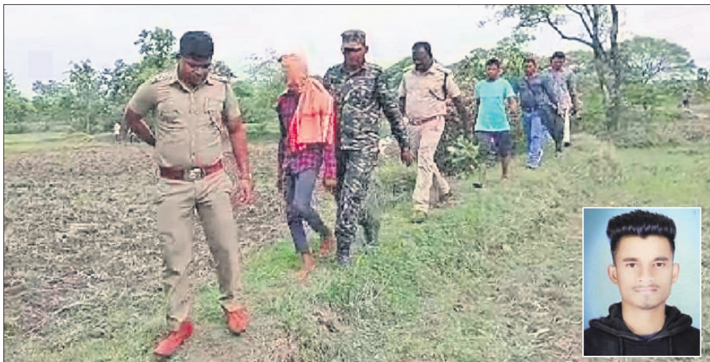
ସିଲେଟପତା ଗାଁ ନିକଟ କ୍ଷେତ୍ରରେ ଅଟକ ମୃତକଙ୍କୁ ନେଇ ପୋଲିସ୍ ତଦନ୍ତ କରୁଛି। ଇନ୍ଦ୍ରସେନର ମୃତ ରକତ ପ୍ରଧାନ।