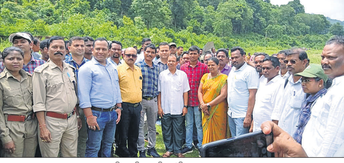
ସୀମା ଚିହ୍ନଟ କରିବାକୁ ଆସିଥିବା ଓଡ଼ିଶା, ଆନ୍ଧ୍ର ଅଧିକାରୀମାନେ।