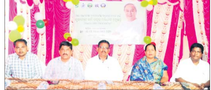
କାର୍ଯ୍ୟକ୍ରମରେ ଉପସ୍ଥିତ ଅତିଥି ।

ବୁରୁଡ଼ା, ୧୨୭୭ (କାଳି ତରଣ ଦାଶ) ପ୍ରସାଦ ପଞ୍ଚା ଛିଡ଼ି ଓ କନଫରେନ୍ସ କରୁଥିବା ଉପସ୍ଥିତ ଅତିଥି ।