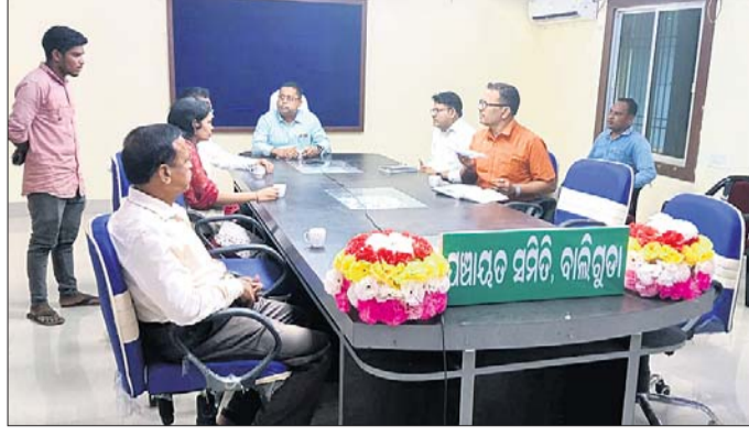
ବାଲିଗୁଡ଼ାରେ ଅନୁଷ୍ଠିତ ସମୀକ୍ଷା ବୈଠକରେ ଅଧିକାରୀମାନେ ।

କର୍ମମାଳିକା ଜିଲ୍ଲାକୁ ସୁରକ୍ଷିତ ରାସ୍ତାରେ ଆସିଥିବା ରାଜ୍ୟ ଇଲେକ୍ଟ୍ରିକ୍ସ ଓ ପୁରୀ ପ୍ରଯୁକ୍ତି ବିଦ୍ୟା ବିଭାଗର ଉପଦେଷ୍ଟା