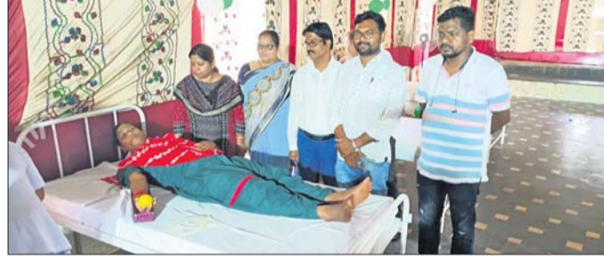
ଶିବିରରେ ରକ୍ତଦାନ କରୁଥିବା ଜଣେ ମହିଳା ଓ ଅନ୍ୟମାନେ ।