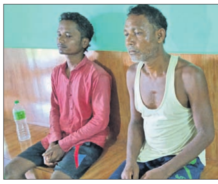
ଗିରଫ ହୁଏ ଅଭିଯୁକ୍ତ

ଦାରିଦ୍ର୍ୟ(ନୀଳାଦ୍ରି ବିହାରୀ ବନ୍ଧୁପାଟ) / ବଡ଼ସାହି(ସମିତ କୁମାର ରାଉତ / ଦୀପକ କୁମ୍ଭକର), ୧୨୭୭