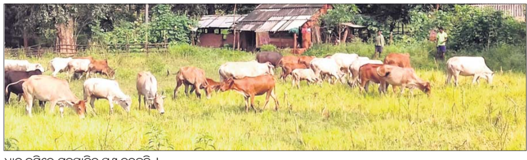
ଧାନ ଜମିରେ ଗୃହପାଟି ପଶୁ ଚରୁଛନ୍ତି ।

ବାଲିଗୁଡ଼ା, ୧୨୭୭ (ସଞ୍ଜୟ କୁମାର ପାଣିଗ୍ରାହୀ) ଆସିବା ସମ୍ପ୍ରଦାୟର ଶ୍ରୀକୃଷ୍ଣ ଚଳାଇବା ହେଲେ ନିଅଣ୍ଟିଆ ବର୍ଷା ପାଇଁ ଚାଷ କାର୍ଯ୍ୟ ଘୋର ବାଧା ସୃଷ୍ଟି ହୋଇଛି ।