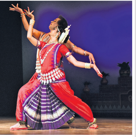
କଳାଶ୍ରମ ପକ୍ଷରୁ ଭୁବନେଶ୍ୱର ରବୀନ୍ଦ୍ର ମଞ୍ଚରେ ଚାଲିଥିବା ୧୮ତମ ଗୁରୁ ଦକ୍ଷିଣା କାର୍ଯ୍ୟକ୍ରମର ରୂପାବରଣ ଉଦ୍‌ଯୋଗନ ଅବସରରେ ଅତିଥିମାନେ ଗୁରୁ ସଂସ୍କୃତା ଦାଶଙ୍କୁ ସମର୍ଥନ କରୁଛନ୍ତି। କାର୍ଯ୍ୟକ୍ରମରେ ଦୁଇ ଶିଳ୍ପୀଙ୍କ ନୃତ୍ୟ ପରିବେଷଣ।