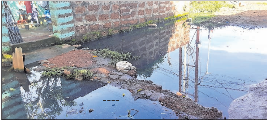
ଖୋର୍ଦ୍ଧା ଅଞ୍ଚଳର ଏକ ସାହିରେ ନାଳପାଣି କମିଛି।