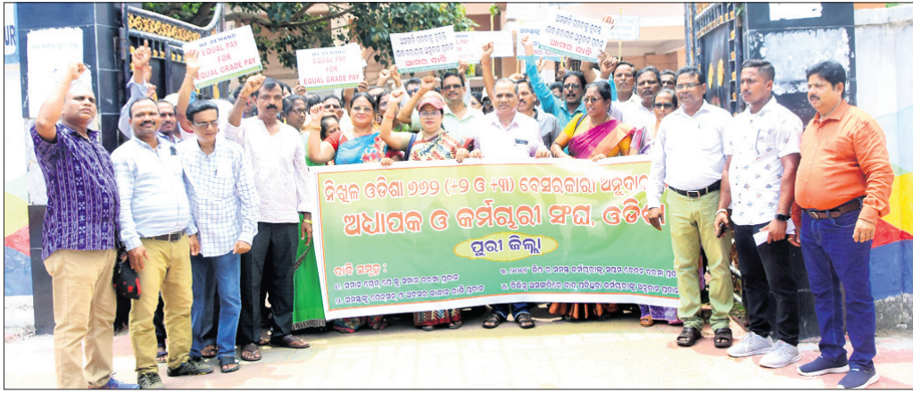
୬୬୨୨ ବର୍ଷ କଲେଜ ସଂଘ ପକ୍ଷରୁ ବିଭିନ୍ନ ଦାଦି ନେଇ ଜିଲ୍ଲାପାଳଙ୍କ କାର୍ଯ୍ୟାଳୟ ଯେରାଉ କରାଯାଇଛି।

ପୁରୀ ଜିଲାର ୬୬୨୨ ବର୍ଷ କଲେଜ ସଂଘ ପକ୍ଷରୁ ବିଭିନ୍ନ ଦାଦି ନେଇ ଗୁଣ୍ଡାବାର ପୁଷ୍ୟମନ୍ତ୍ରୀଙ୍କ ଉଦ୍ଦେଶ୍ୟରେ ଜିଲ୍ଲାପାଳଙ୍କୁ ଏକ ଦାଦିପତ୍ର ଦିଆଯାଇଛି। ଅଧ୍ୟାପକାଣ୍ଡ ଆଧ୍ୟାପକମାନେ ଶୋଭାଯାତ୍ରାରେ ଜିଲ୍ଲାପାଳଙ୍କ କାର୍ଯ୍ୟାଳୟକୁ ଆସି ଏହି ଦାଦିପତ୍ର ପ୍ରଦାନ କରିଛନ୍ତି। ଉକ୍ତ ପତ୍ରରେ ଉଲ୍ଲେଖ ରହିଛି ଯେ, ବିଭିନ୍ନ ଦାଦି ନେଇ ସଂଘର କର୍ମଚାରୀମାନେ ଗତ ଫେବୃଆରୀ ୧୩ରୁ ଭୁବନେଶ୍ୱର ଲୋୟର ପିଏମଜିରେ ଦିବାରାତ୍ର ଧାରଣାରେ ବସିଛନ୍ତି। ପୂର୍ବରୁ ସଂଘ ଧର୍ମଦା ଦାଦି ବିଷୟରେ ସରକାରଙ୍କ ଦୃଷ୍ଟି ଆକର୍ଷଣ କରିଥିଲେ ମଧ୍ୟ କେବଳ ଏକ ମନୁଆୟତା କମିଟି ଗଠନ କରି ସରକାର ରୂପ ବସିଛନ୍ତି। ସରକାର ଏହି ବର୍ଷର କର୍ମଚାରୀଙ୍କୁ ଗୋଟିଏ ବର୍ଷ ସମାନ ଗ୍ରେଡ୍ ଯେ ଆଧାରରେ ସମାନ ଦରମା ଦେବା ପରେ ପୁଣି ଏହି ନିୟମକୁ ପରିବର୍ତ୍ତନ କରି ଅସଙ୍ଗତ ଦୃଷ୍ଟି କରିଛନ୍ତି। ଏହି ବର୍ଷର କର୍ମଚାରୀମାନେ ଦୀର୍ଘ ୩୦ ବର୍ଷରୁ ଉର୍ଦ୍ଧ୍ୱକାଳ ଉଚ୍ଚଶିକ୍ଷା ବିଭାଗର ୭୦ ଭାଗ ଦାୟିତ୍ୱ ବହନ କରିଆସୁଥିବାବେଳେ ଏ ପର୍ଯ୍ୟନ୍ତ ଯେଉଁସବୁ ପରିସରଭୁକ୍ତ ହୋଇପାରି ନାହାନ୍ତି। ବାରମ୍ବାର