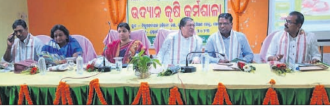
କର୍ମଶାଳାରେ ଉପସ୍ଥିତ ବିଧାୟକ ଓ ଅନ୍ୟ ଅତିଥି।