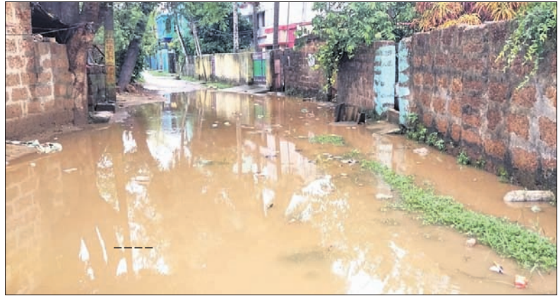
ଓଡ଼ିଶା ଡ୍ରେନ ପାଣି ରାସ୍ତାରେ ଭାସୁଛି।