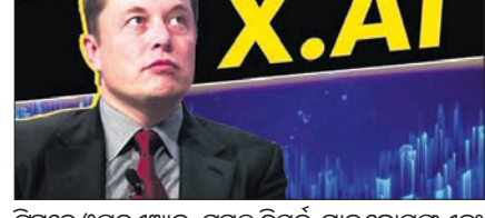
ଟିଏମ୍ସିର ଓପ୍‌ଏଆଇଏଲ୍, ଭୁବନେଶ୍ୱର, ମାଲଦାକୁ ଏବଂ ଡିପ୍‌ଆଇଏଲ୍ ଭଳି ଅଗ୍ରଣୀ ଏଆଇ ପ୍ଲାଟଫର୍ମରେ ଉତ୍କଳ କାର୍ଯ୍ୟକ୍ଷେତ୍ର ପ୍ରମାଣିତ କରିଥିବା ସଦସ୍ୟମାନଙ୍କୁ ସାମ୍ପାଦି କରାଯାଇଛି। ଏକ୍ସଏଆଇ ଏହି ପ୍ରତିଦ୍ୱନ୍ଦ୍ୱୀ ସଂସ୍ଥାକୁ ଚଳେ ଦେଇ ଆଗକୁ ବଢ଼ିବ ବୋଲି କୁହାଯାଇଛି।