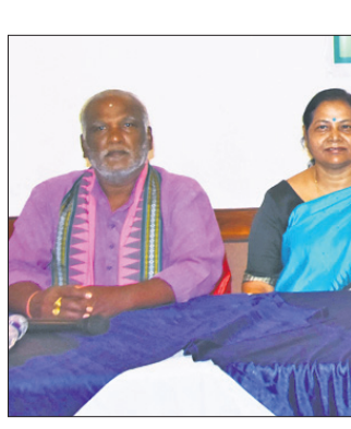
ଖବରଦାତା ସମ୍ମିଳନୀରେ ଉକ୍ତ ଉପକ୍ରମ ସଂକାର୍ଯ୍ୟ ମହାସଂଘର କର୍ମକର୍ମୀମାନେ ସୂଚନା ଦେଉଛନ୍ତି।

କୋଣାର୍କ, ୧୨।୭ (କୋଟିରାଜ ମହାନ୍ତି) ଗୋପ ବ୍ଲକ୍ ବରଲାଳ ପଞ୍ଚାୟତ ପାଞ୍ଚେଶା ଗାଁରେ ଗ୍ରାମବାସୀଙ୍କ ଦ୍ୱାରା ନିଜକୁ ବଞ୍ଚାଇବା ପାଇଁ ଗାଁରେ ୧୦୦୦ ଆମ୍ବ ଓ ୧୦୦ ନଡ଼ିଆ ଚାରା ରୋପଣ କରାଯାଇଛି। ମୁଖ୍ୟ ଉଦ୍ଦେଶ୍ୟ ପ୍ରକଳ ଖରା ଓ ବୃଦ୍ଧିକୁ ନିରୋଧ କରିବା ଲାଗି ଲୋକେ ରକ୍ଷା ପାଇବେ ବର୍ଷା ଉତ୍ତର ହେବ, ବାତ୍ୟା ବନ୍ୟା ସମୟରେ ଚାରା ଯାହା ଗ୍ରହଣ କରିବେ, ଏସବୁକୁ ଲାଖ୍ୟ ରଖି ଗ୍ରାମବାସୀ ଏକାଠି ଲଗାଉଛନ୍ତି ଆମ୍ବ ଓ ନଡ଼ିଆ ଗଛ। ଏପରି ମହତ କାର୍ଯ୍ୟ ପାଇଁ ୧୧ ଶହ ଗଛ ଦେଇଛି ଭୁବନେଶ୍ୱରର କାବନ ବାମା ସାହା ଗ୍ରହଣ। ପାଞ୍ଚେଶା ଗାଁରେ ଖରା ପ୍ରଭାବ ଅଧିକ ଥିବାରୁ ଗ୍ରାମବାସୀ ତତ୍ତ୍ୱା କରି କାବନ ବିମା ସାହା ଗ୍ରହଣ ସହ ଆଲୋଚନା କରିଥିଲେ। କାବନ ବିମା ସାହା ଗ୍ରହଣ ପରାମର୍ଶ ଦେଇଥିଲେ (ଗଛ ହିଁ ଜୀବନ) ଜଣେ ଜଣେ ୫୦ଟି ଗଛ ଲଗାଇଲେ ପ୍ରକଳ ଖରାକୁ ରକ୍ଷା ପାଇବେ। ଚାରାକ କଥାକୁ ମନି ପାଞ୍ଚେଶା ଗାଁର ୫୫୫ ଜଣେ ଖରା ପ୍ରଭାବ ଅଧିକ ଥିବାରୁ ଗ୍ରାମବାସୀ ତତ୍ତ୍ୱା କରି କାବନ ବିମା ସାହା ଗ୍ରହଣ ସହ ଆଲୋଚନା କରିଥିଲେ।