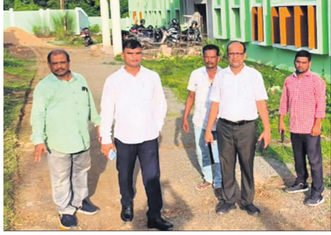
ଜିଲ୍ଲା ଶିକ୍ଷା ଅଧିକାରୀ ଏବଂ ଅନ୍ୟମାନେ ଏକ ବିଦ୍ୟାଳୟ ପରିଦର୍ଶନ କରୁଛନ୍ତି।

ଖୋର୍ଦ୍ଧା, ୧୨.୭.୨୩ (ପ୍ରଭାତ ପାଣିଗ୍ରାହୀ): ସଦର ଥାନା ଅନ୍ତର୍ଗତ ୧୨୩ ନଂ ଗ୍ରାମପଞ୍ଚାୟତର ସଭା ଶେଷ ହୋଇଛି।