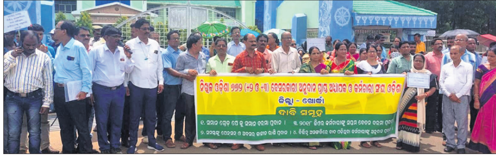
ନିଖୁଳ ଓଡ଼ିଶା ବେସରକାରୀ ଅଧ୍ୟାପକ କର୍ମଚାରୀ ସଂଘ ପକ୍ଷରୁ ଡିମା ଦାବି ନେଇ ଜିଲ୍ଲାପାଳଙ୍କ କାର୍ଯ୍ୟାଳୟ ଆଗରେ ବିରୋଧ କରାଯାଇଛି।