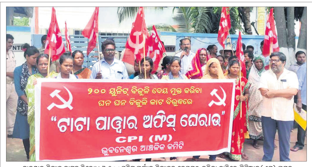
ବାରମ୍ବାର ବିଦ୍ୟୁତ୍ କାଟକୁ ବିରୋଧ ଓ ୨୦୦ୟୁନିଟ୍ ପର୍ଯ୍ୟନ୍ତ ବିଦ୍ୟୁତ୍ ଦେୟମୁକ୍ତ କରିବା ଦାବିରେ ସିପିଆଇ(ଏମ୍) ପକ୍ଷରୁ ଭୁବନେଶ୍ୱର ପାଞ୍ଚାଳ ହାଇଭ୍ ଇକ୍ସପ୍ରେସ୍ ଟାଣା ପାଞ୍ଚାଳ ଅଞ୍ଚଳରେ ଉପସ୍ଥାପନ କରାଯାଇଛି।

ଭୁବନେଶ୍ୱର, ୧୨।୭ (ଅନୁରାଧା ମହାରଣା): ରତ ମାଧ୍ୟମିକ ଶିକ୍ଷା ପରିଷଦ ପରିଚାଳିତ ଯୁକ୍ତ ୨ କଳା, ବିଜ୍ଞାନ, ବାଣିଜ୍ୟ ଓ ଧର୍ମାନୁଶିଳ୍ପ ବିଷୟରେ ପ୍ରଥମ ପର୍ଯ୍ୟାୟ ନାମଲେଖା ପ୍ରକ୍ରିୟା ଗୁରୁବାର ଶେଷ ହେବ। ତେବେ ୧୨ ତାରିଖ ରାତି ୧୦ଟା ସୁଦ୍ଧା ମାଲ୍ ୧୯ ହଜାର ଛାତ୍ରଛାତ୍ରୀ ନାମଲେଖା ଉପରେ ଜଣାପଡିଛି। ରାଜ୍ୟର ୨୧୫୮ଟି କୁଳିୟର କଲେଜରେ ପ୍ରଥମ ପର୍ଯ୍ୟାୟରେ କଳାରେ ୨ଲକ୍ଷ ୨ ହଜାର ୧୨୮୮ ଜଣ ଛାତ୍ରଛାତ୍ରୀ ନାମଲେଖା ଉପରେ କେଳି ୮୭ ହଜାର ୧୨୦୮ଟି ସିଟ୍ ବଳକା ରହିଛି। ସେହିପରି ବିଜ୍ଞାନରେ ୮୮,୧୪୪ ଜଣ ନାମଲେଖା ଉପରେ କେଳି ୬୭୦୫୧ ସିଟ୍ ବଳକା ରହିଛି। ବାଣିଜ୍ୟରେ ୧୯୪୫୮ ଜଣ ନାମଲେଖା ଉପରେ କେଳି ୧୯୭୩୧ ସିଟ୍ ଖାଲି ରହିଛି। ସେହିପରି ସଂସ୍କୃତରେ ୫୩୨୯୯ ଜଣ ପିଲା ନାମଲେଖା ଉପରେ କେଳି ୨୭୭୯ ସିଟ୍ ବଳକା ରହିଛି। ଧର୍ମାନୁଶିଳ୍ପ ବିଷୟରେ ୩୭୪୨୯ ଜଣ ନାମଲେଖା ଉପରେ କେଳି ୬୭୫୦ ସିଟ୍ ଖାଲି ରହିଥିବା ଜଣାପଡିଛି। ଚଳିତବର୍ଷ ପ୍ରଥମ ପର୍ଯ୍ୟାୟରେ ୪ ଲକ୍ଷ ୭୨ ହଜାର ୨୭୯ ସିଟ୍ ମଧ୍ୟରୁ ୪ ଲକ୍ଷ ୧୨ ହଜାର ୩୭୮ ପିଲାଙ୍କୁ ସିଟ୍ ଆବେଶ କରାଯାଇଛି।