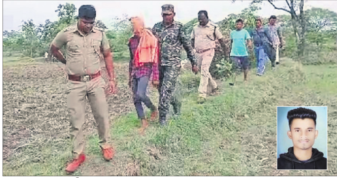
ସିଲେଟପଡା ଗାଁ ନିକଟ କ୍ଷେତରେ ଅଟକ ମୁତକଙ୍କୁ ନେଇ ପୋଲିସ ତଦନ୍ତ କରୁଛି। ଇନ୍ସପେକ୍ଟର ମୁତ ରକତ ପ୍ରଧାନ।

ରେଳଲାଭନ୍ କଡ଼ରୁ ମୁତକଙ୍କ ମୃତଦେହ ଜବତ ଘଟଣା ■ ଏକ କୁଅରୁ ମିଳିଲା ମୁତକଙ୍କ ଘୋରାଭଲ ଫୋନ୍ ■ ବଳାଙ୍ଗୀର ପୋଲିସ, ରେଳଖେ ପୋଲିସ ଏବଂ ଓଡ୍ରାପ୍ ଟିଏମ୍ସି ତଦାଘନୀ