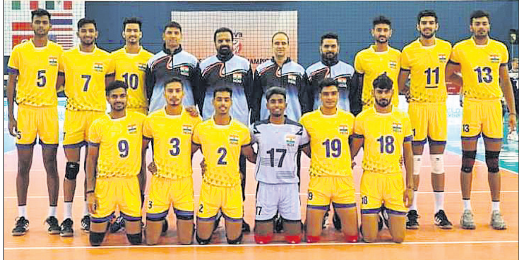
ବିଜୟା ଭାରତୀୟ ଭଲିବଲ୍ ଦଳ।