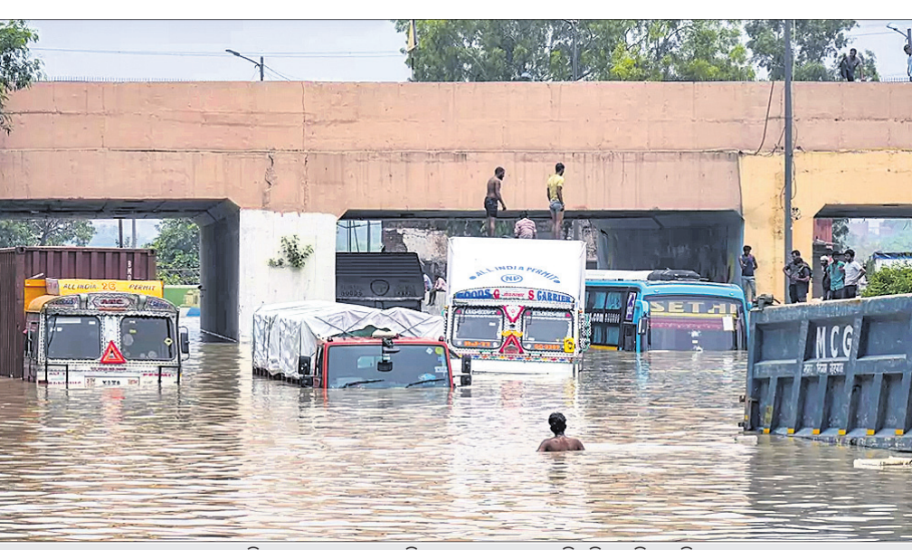
ଦୁଆଦିଲ୍ଲୀର ପୁରୁଣା ଯମୁନା ବ୍ରିଜ୍ ଅକ୍ଷେପାୟରେ ଗାଡ଼ିଗୁଡ଼ିକ ବୁଡ଼ିଯାଇଛି।

ଦୁଆଦିଲ୍ଲୀ, ୧୩୭ ଯମୁନା ନଦୀ ଜଳସ୍ତର ବୃଦ୍ଧିରୁ ରାଜିରେ ଅଧିକ ବଢ଼ିବା ଫଳରେ ଦିଲ୍ଲୀରେ ବନ୍ୟା ସ୍ଥିତି ସୃଷ୍ଟି ହୋଇଛି। ଖାଲୁଆ ଅଞ୍ଚଳଗୁଡ଼ିକରେ ଲୋକଙ୍କ ଘରେ ପାଣି ପଶିଯାଇଛି। ରାସ୍ତାଘାଟ ପାଣିରେ ବୁଡ଼ିରହିଥିବାରୁ ପରିବହନ ସେବା ଗୁରୁତର ବାଧାପ୍ରାପ୍ତ ହୋଇଛି। ବନ୍ୟାରେ ଦିଲ୍ଲୀର ୬ଟି ଜିଲ୍ଲା ପ୍ରଭାବିତ ହୋଇଛି। ବନ୍ୟାସ୍ଥିତି ଯୋଗୁ ଲାଲ୍ କିଲ୍ଲା ଗୁରୁତର ମଧ୍ୟାହ୍ନ ଶୁକ୍ରବାର ପର୍ଯ୍ୟନ୍ତ ପର୍ଯ୍ୟଟକଙ୍କ ପାଇଁ ବନ୍ଦ ଘୋଷଣା କରାଯାଇଛି। ହରିୟାଣାର ହାଥଲକ୍ଷ୍ମ ବ୍ୟାରେଜ୍ଟୁ ଜୁମାଗତ ଜଳ ନିଷାଧନ ଯୋଗୁ ଗୁରୁତର ଅପରାହ୍ନରେ