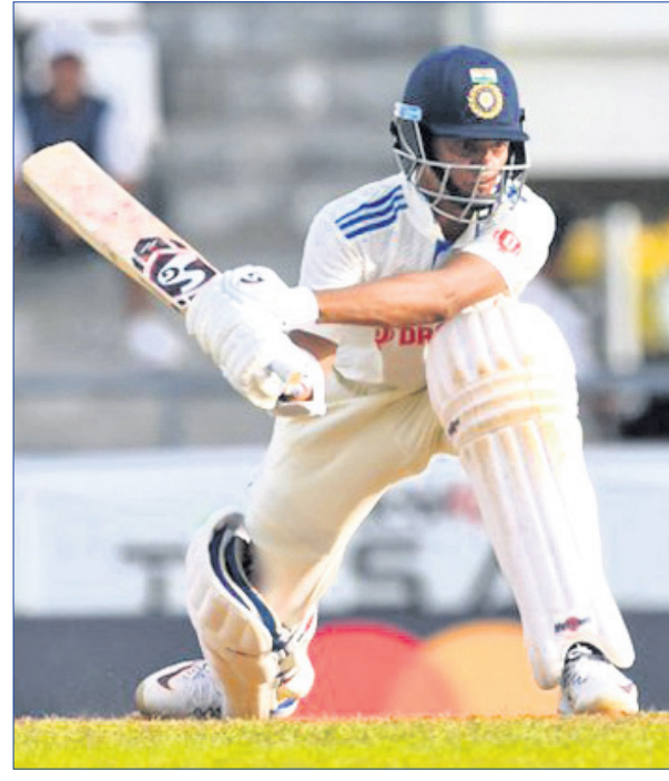
ଅର୍ଦ୍ଧଶତକୀୟ ଇନିଂସ ଅବସରରେ ଯଶସୀ ଜୟସାଲ ଓ ରୋହିତ ଶର୍ମା।

ପ୍ରଥମ ଦିନର ଅସମାପ୍ତ ଷ୍ଟୋକ୍‌ ୮୦/୦ରୁ ଖେଳ ଆରମ୍ଭ କରିଥିଲା ଭାରତ। ଉଭୟ ରୋହିତ ଓ ଜୟସାଲ ଟମହାର ଢଙ୍ଗରେ ବ୍ୟାଟିଂ କରିବା ସହ ଭାରତୀୟ ଇନିଂସ ଆଗକୁ ବଢ଼ାଇଥିଲେ। ପ୍ରଥମ ଟେଷ୍ଟ ଖେଳୁଥିବା ଜୟସାଲ ଅର୍ଦ୍ଧଶତକ ହାସଲ କରିବା ସହିତ ପଦାର୍ପଣକୁ ସ୍ମରଣାୟକ କରିଥିଲେ। ଅନ୍ୟ ପକ୍ଷରେ ଦୀର୍ଘ ଦିନ ପରେ ଏକ ଅର୍ଦ୍ଧଶତକ ସହିତ ପର୍ଯ୍ୟନ୍ତ ଫେରିବାର ସଙ୍କେତ ଦେଇଥିଲେ ରୋହିତ। ଜୟସାଲ ୧୬୭ ବଲ୍‌ ଖେଳି ୬୨ ରନ୍‌ ସ୍କୋରରେ ବ୍ୟାଟିଂ କରୁଛନ୍ତି। ଏହି ଇନିଂସରେ ୬ ଟୋକା ସୀମିତ ଥିଲା। ଅନ୍ୟ ପକ୍ଷରେ