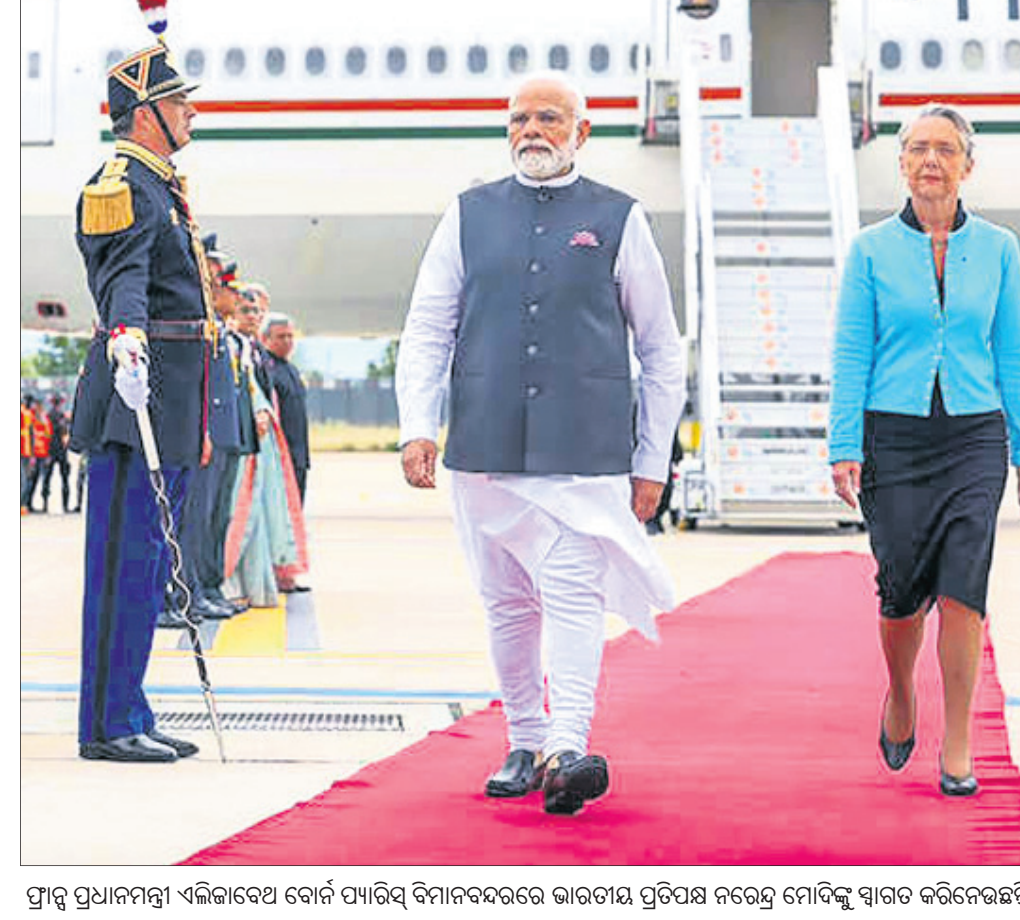
ଫ୍ରାନ୍ସ ପ୍ରଧାନମନ୍ତ୍ରୀ ଏଲିଜାବେଥ୍ ବୋର୍ନ ପ୍ୟାରିସ୍ ବିମାନବନ୍ଦରରେ ଭାରତର ପ୍ରତିପକ୍ଷ ନରେନ୍ଦ୍ର ମୋଦିଙ୍କୁ ସ୍ୱାଗତ କରିନେଉଛନ୍ତି।

ଆଧିଗ୍ରହଣକୁ ଭାରତର ମଞ୍ଜୁରୀ ପ୍ରଧାନମନ୍ତ୍ରୀ ନରେନ୍ଦ୍ର ମୋଦିଙ୍କ ହାଇପ୍ରୋଫାଇଲ୍ ଫ୍ରାନ୍ସ ଗସ୍ତବେଳେ ଭାରତ ଏହି ବନ୍ଧୁତାସ୍ତୁ ୨୬ଟି ନାଭାଲ୍ ଭାରିଆଣ୍ଟ ରାଫାଲ ଜେଟ୍ ଓ ୩ ସୋପିଆନ୍ ଶ୍ରେଣୀର ବୁଡ଼ାକାହାଳ ଅଧିଗ୍ରହଣକୁ ମଞ୍ଜୁରୀ ଦେଇଛି। ପ୍ରତିରକ୍ଷା ମନ୍ତ୍ରୀ ରାଜନାଥ ସିଂହ ଅଧିଗ୍ରହଣ ପ୍ରତିରକ୍ଷା ଅଧିଗ୍ରହଣ ପରିଷଦ (ଡିଏସି) ଏହି ପ୍ରସ୍ତାବକୁ ଅନୁମୋଦନ କରିଛି। ରୁକ୍ମି ସମ୍ପାଦନର ୩ ବର୍ଷ ମଧ୍ୟରେ ଏହି ଏୟାରକ୍ରାଫ୍ଟଗୁଡ଼ିକ ଭାରତକୁ ଆସିବ। ଭାରତ ପାଖରେ ବର୍ତ୍ତମାନ ୩୬ଟି ରାଫାଲ ସି (ଏୟାର ଫୋର୍ସ) ଭାରିଆଣ୍ଟ ଜେଟ୍ ଥିବାବେଳେ ୨୬ଟି ରାଫାଲ ଏମ୍ (ନୋରାଇଜ୍) ଆସିବ। ଦାସଲ୍ ଆଭିଏଶନ୍ ଦ୍ୱାରା ନିର୍ମିତ ରାଫାଲ ଏମ୍ କୁ ନୌସେନା ପାଇଟର୍ସଙ୍କ ପାଇଁ ଅନ୍ୟତମ ଅତ୍ୟାଧୁନିକ ସୁବିଧାନ ବିବେଚନା କରାଯାଉଛି।