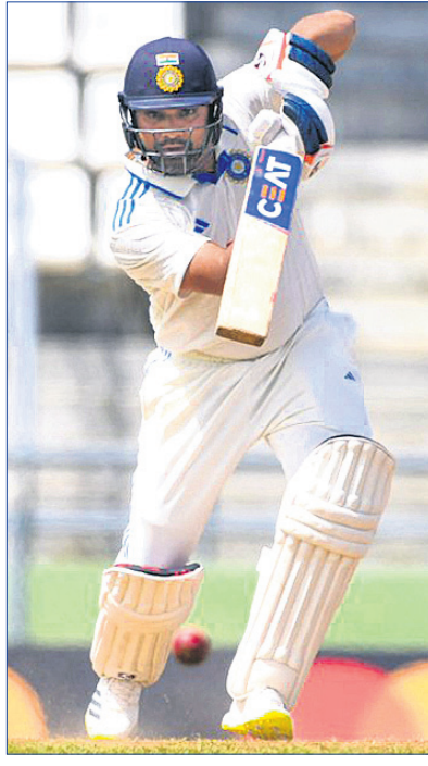
ଉତ୍ତରରେ ୧୫୦/୧୦(ଆଲିକ୍ ଆଠନାଜେ-୪୭, କ୍ରେଗ୍ ବ୍ରାଥୱେଡ୍-୨୦, ରାହନା କର୍ନିଝାଲ-୧୯, ଆର. ଅଶ୍ୱିନ-୫/୬୦, ରବୀନ୍ଦ୍ର ଜାଡେଜା-୩/୨୬, ଶାର୍ଦ୍ଦୂଳ ଠାକୁର-୧/୧୫)। ଭାରତ ପ୍ରଥମ ଇନିଂସ ୫୫ ଓଭରରେ ୧୪୬/୦(ରୋହିତ ଶର୍ମା-୬୮, ଯଶସୀ ଜୟସାଲ-୬୨)।

ରୋହିତ ୧୬୩ ବଲ୍‌ ଖେଳି ୬୮ ଟୋକା ଓ ୨ ଛକା ସହିତ ୬୮ ରନ୍‌ରେ ବ୍ୟାଟିଂ କରୁଛନ୍ତି। ଫ୍ରେଣ୍ଡ୍‌ସ୍‌ସ୍‌ ପକ୍ଷରୁ ୬ ଖଣ୍ଡ ବୋଲରଙ୍କୁ ନିୟୋଜିତ କରାଯାଇଥିଲେ ହେଁ ସଫଳତା ମିଳି ନ ଥିଲା। ତୋପିନିକାରେ ୬ ବର୍ଷ ପରେ ଟେଷ୍ଟ ଖେଳା ଯାଇଥିବା ବେଳେ ଟେଷ୍ଟ ଇତି ପ୍ରଥମେ ବ୍ୟାଟିଂ ନିଷ୍ପତ୍ତି ଫ୍ରେଣ୍ଡ୍‌ସ୍‌ସ୍‌ ପ୍ରଥମ ଇନିଂସ ୬୪.୩ ଓଭରରେ ୧୫୦/୧୦(ଆଲିକ୍ ଆଠନାଜେ-୪୭, କ୍ରେଗ୍ ବ୍ରାଥୱେଡ୍-୨୦, ରାହନା କର୍ନିଝାଲ-୧୯, ଆର. ଅଶ୍ୱିନ-୫/୬୦, ରବୀନ୍ଦ୍ର ଜାଡେଜା-୩/୨୬, ଶାର୍ଦ୍ଦୂଳ ଠାକୁର-୧/୧୫)। ଭାରତ ପ୍ରଥମ ଇନିଂସ ୫୫ ଓଭରରେ ୧୪୬/୦(ରୋହିତ ଶର୍ମା-୬୮, ଯଶସୀ ଜୟସାଲ-୬୨)।