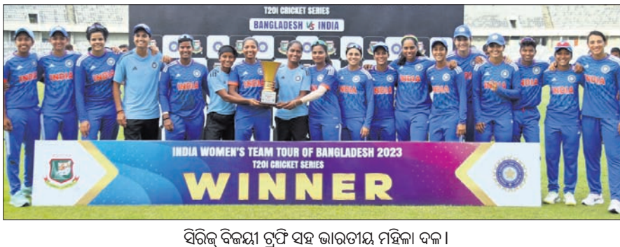
ସିରିଜ୍ ବିଜୟୀ ଟ୍ରଫି ସହ ଭାରତୀୟ ମହିଳା ଦଳ।

ମାନପୁର, ୧୩୭ (ପି.ଟି.) ବାଂଲାଦେଶ ବିପକ୍ଷ ୩ ମ୍ୟାଚ୍ ବିଶିଷ୍ଟ ମହିଳା ଟି୨୦ ସିରିଜ୍‌ର ଅଜିମ ମ୍ୟାଚ୍ ହାରିଯାଇଛି ଭାରତ। ପୂର୍ବରୁ ପ୍ରଥମ ଦୁଇ ମ୍ୟାଚ୍ ଜିତି ସାରିଥିବା ଭାରତ ୨-୧ରେ ସିରିଜ୍‌କୁ ଜିତି ନେଇଛି। ଗୁରୁବାର ପ୍ରଥମେ ବ୍ୟାଟିଂ କରିଥିବା ଭାରତ ୯ ଉଇକେଟ୍‌ରେ ୧୦୨ ରନ୍ କରିଥିବା ବେଳେ ବାଂଲାଦେଶ ୧୮.୨ ଓଭରରେ ୬ ଉଇକେଟ୍‌ ହରାଇ ୧୦୩ ରନ୍ କରି ସାହନାମୂଳକ ବିଜୟ ହାସଲ କରିଥିଲା।