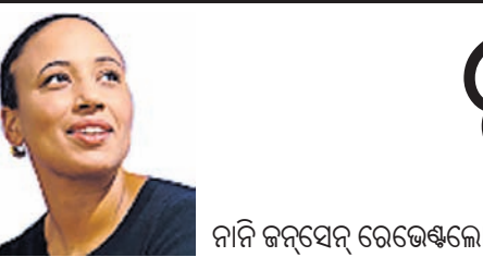
ନାନି ଜନ୍ମସେନ ରେଭେଣ୍ଡେଲୋ

ଶେଷରେ, ସୁରୋପାୟ ଦେଖିବାକୁ ସେମାନଙ୍କର ଉପନିବେଶିତ ଉତ୍ତରାଧିକାରୀଙ୍କର ଉପସ୍ଥାପନାକୁ ସୁଦୃଢ଼ୀଭାବେ ସମର୍ଥନ ଦେବା ଆରମ୍ଭ କରିଛନ୍ତି। ନେତୃତ୍ୱରେ ସରକାର ବିଶ୍ୱସ୍ତରାୟ କ୍ରୀତଦାୟ ବେପାରରେ ଦେଶର ଭୂମିକାକୁ ନେଇ କ୍ଷମା ପ୍ରାର୍ଥନା କରିଛନ୍ତି। ଏହି ଦେଶର ରାଜା ମଧ୍ୟ କ୍ଷମା ମାଗିଛନ୍ତି। ଆଦିବାସୀଙ୍କ ଅଧିକାର ଉପରେ କାଟିବାଦର ସ୍ୱତନ୍ତ୍ର ଦୃଢ଼ ଗ୍ରାହଣରେ ଉପନିବେଶକରଣର ନିରାଶ୍ରୟ ପ୍ରଭାବକୁ ସମାଧାନ କରିବାକୁ ଡେଇଁବାକୁ ନିର୍ଦ୍ଦେଶ ଦିଆଯାଇଛି। ଏହା ସହ ବିଦେଶରେ ଗଣମାଧ୍ୟମ ସମ୍ପ୍ରଦାୟ, ଇଂଲଣ୍ଡର ଚର୍ଚ୍ଚ ଏବଂ ମାକ୍‌ଲେନ୍‌ସ୍‌ଟ୍ରୀର ଭଲ ସହର ସେମାନଙ୍କର ଧନ ଏବଂ ଶକ୍ତି କ୍ରୀତଦାୟମାନଙ୍କ ଦ୍ୱାରା ସମ୍ଭବ ହୋଇଛି ବୋଲି ସ୍ୱୀକାର କରିଛନ୍ତି। ଉକ୍ତ ପଦକ୍ଷେପକୁ ଐତିହାସିକ ବୋଲି ସ୍ୱୀକାର କରାଯାଉଥିବାବେଳେ ପ୍ରଭାବିତ ସମ୍ପ୍ରଦାୟଙ୍କ ସହ ଆଲୋଚନାର ଅଭାବ ଏବଂ ଏଥିରେ ଗୁରୁତ୍ୱପୂର୍ଣ୍ଣ ସୁଧାର ଆଣିବାରେ ସମ୍ପୂର୍ଣ୍ଣ ନିଷ୍ପ୍ରୟତାକୁ ନେଇ ସମାଲୋଚନାର ସ୍ୱର ମଧ୍ୟ ଉଠିଛି। ଅବଶ୍ୟ, ଏହିସବୁ ମନ୍ତବ୍ୟ ଏବଂ କ୍ଷମାପାତ୍ରତା ଧାରା ଉପନିବେଶକରଣର ପ୍ରଭାବ ଉପରେ କି ସୁଧାର ଅଣାଯାଇପାରିବ ତାହାକୁ ଅଣଦେଖା କରିଆସିଛି। ଏହା ନିଶ୍ଚିତ ଯେ, ଏଭଳି ସାର୍ବଜନୀନ କ୍ଷମା ପ୍ରାର୍ଥନା ସମ୍ପର୍କରେ ଆଲୋଚନା କରାଗଲେ ତାହା ସାଧାରଣରେ ସମାଜିକବାଦର ଭୟାବହତା ସମ୍ପର୍କରେ ସଚେତନତା ବଢ଼ାଇବାରେ ସାହାଯ୍ୟ କରିବ। ତେବେ ସେମାନଙ୍କ ପ୍ରୋପାଗାଣ୍ଡାରେ ହେଉଥିବା ଆଲୋଚନା ଗୁରୁତ୍ୱପୂର୍ଣ୍ଣ ଏବଂ ସମ୍ଭବତଃ ଏହା ଯେ, ସେହି ସବୁ ଆଲୋଚନା ସୁରୋପାୟ ପ୍ରତିଷ୍ଠିତ ସମ୍ପ୍ରଦାୟ ମଧ୍ୟ ରାଜପ୍ରସାଦ, ମୁକ୍ତିଦାୟ, ବହୁ ପୁରୁଣା ପ୍ରତିଷ୍ଠାନ ଓ ଗଣମାଧ୍ୟମ ସମୂହରେ ହିଁ ଅନୁଷ୍ଠିତ ହେଉଛି। କୁଟନୀୟ ହେବ ଯେ, ଏଭଳି ଆଲୋଚନା ଏକ କ୍ଷତିକାରକ ଇତିହାସକୁ ଗୁପ୍ତ ରଖିବା ପାଇଁ ନିରବଚ୍ଛିନ୍ନ ପ୍ରୟାସର ପ୍ରମାଣକୁ ସୂଚିତ କରୁଛି। କିନ୍ତୁ ଜର୍ଜଟାଉନ ସୁନିଭିସିଟିର ପ୍ରାଧିପତ୍ୟ