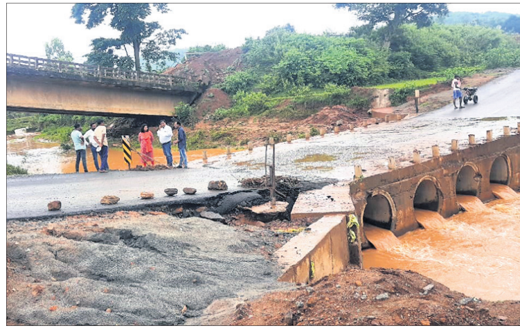
ନିର୍ବାହୀଯତ୍ନୀ ଘଟଣାସ୍ଥଳ ଅନୁଧ୍ୟାନ କରୁଛନ୍ତି।