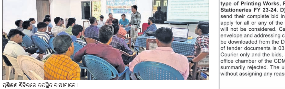
ପ୍ରଶିକ୍ଷଣ ଶିବିରରେ ଉପସ୍ଥିତ ଚାଷୀମାନେ।