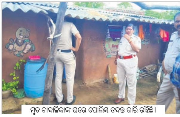
ମୃତ ନାବାଳିକାଙ୍କ ଘରେ ପୋଲିସ୍ ଚଢ଼ଢ଼ କାରି ରହିଛି।

ଘରକୁ ଆସିଥିଲେ। ଘରେ ପହଞ୍ଚିବା ପରେ ଶେଷାମ୍ବିକା ଚଳଣି କରିବା ପାଇଁ ପୁଲିସ୍ ନାମ ଗ୍ରହଣ କରିଥିଲେ। ଏହାର ପ୍ରତ୍ୟାଶା ନେଇ କେହି ଘରେ ପଶି ଏକ ଧାତୁଆ ଅସ୍ତ୍ରରେ ତାଙ୍କ ଚଷ୍ମିକାଟି ସହ ମୃତ୍ୟୁ, ବେକ ଏବଂ ଶରୀରର ଅନ୍ୟ ସ୍ଥାନରେ ଆଘାତ କରିଥିଲେ। ଅପରାଧୀଙ୍କୁ ୧୫ରେ ମାଡ଼ାପିତା କାମକୁ