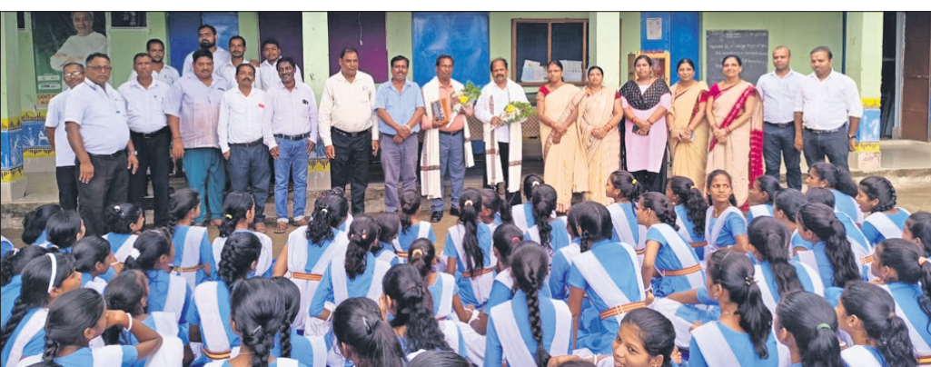
୩ ଶିକ୍ଷକଙ୍କୁ ବିଦାୟକାଳୀନ ସମ୍ବର୍ଦ୍ଧନା ଦିଆଯାଇଛି ।