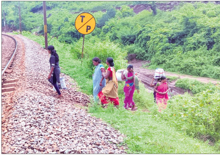
ପାଠୁଆ-ସିରିସଗୁଡ଼ା ଭୂତଳ ସେତୁ ନିର୍ମାଣ ଦାରି

ପ୍ରଶାସନକୁ ଅନୁରୋଧ କରିଛନ୍ତି। ରେଳ ବିଭାଗ ଏଥିପ୍ରତି ଦୃଷ୍ଟି ଦେଇ ପାଠୁଆଠାରୁ