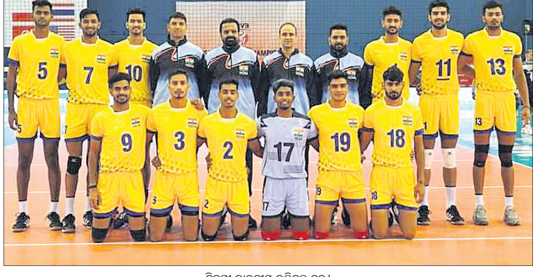
ବିଜୟା ଭାରତୀୟ ଭଲିବଲ୍ ଦଳ ।