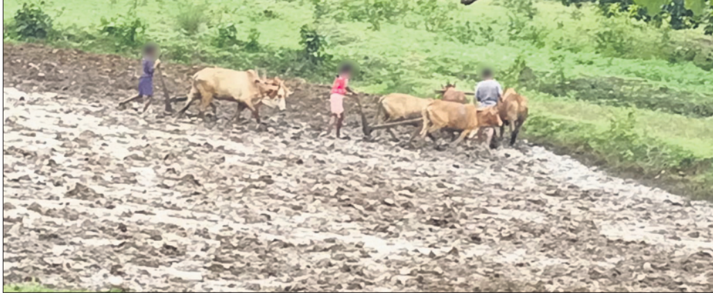
ହଳ ଲଗାଇ ଧରି ଜମି କାଦୁଅ କରୁଛନ୍ତି ପିଲାମାନେ ।