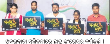
ଖବରଦାତା ସମ୍ମିଳନୀରେ ଛାତ୍ର କଂଗ୍ରେସର କର୍ମକର୍ତ୍ତା।

ବେକାର ସାଙ୍ଗଠନିକ ବୈଠକ କରିଥିଲେ। ଦଳର ସାଧାରଣ ସମ୍ପାଦକ ଏବଂ ଅନ୍ୟ ନେତୃବୃନ୍ଦଙ୍କ ସହ ଦଳର ସଙ୍ଗଠନ କିପରି ରାଜ୍ୟରେ ଅଧିକ ମଜବୁତ ହୋଇପାରିବ ସେନେଇ ଆଲୋଚନା କରିଛନ୍ତି। ସେହିପରି ଶୁକ୍ରବାର ବଂଶଲ ଦଳ ଗତ ସାଧାରଣ ନିର୍ବାଚନରେ ପରାଜିତ ହୋଇଥିବା ୧୩ ଲୋକ ସଭା କ୍ଷେତ୍ରକୁ ନେଇ ଏକ ବୈଠକ କରିବେ। ଉକ୍ତ ୧୩ ଲୋକ ସଭା ନିର୍ବାଚନସମ୍ପର୍କରେ ଦାୟତ୍ୱରେ ଥିବା ପ୍ରଭାବୀ, ସହପ୍ରଭାବୀ, ସଂସ୍ପାଦକ ଏହି ବୈଠକରେ ଯୋଗଦେବେ। ସେହି ଲୋକ ସଭା ଆସନଗୁଡ଼ିକୁ କିପରି ଜିତି ହେବ ସେନେଇ ଆଲୋଚନା ଓଡ଼ିଶାକୁ ଯାଇଥିବା ସେହି ୧୨୦ ଜଣଙ୍କ ସହ ବଂଶଲ ବସି ଦୀର୍ଘ ସମୟ ଆଲୋଚନା କରିଛନ୍ତି। ତେବେ ସେମାନଙ୍କୁ ବିଫଳ ହେଲା ସେନେଇ ମଧ୍ୟ ବଂଶଲ ଗ୍ରାମୀଣ ନେତୃବୃନ୍ଦ ଉପରେ ଚାହୁଁଥିବା