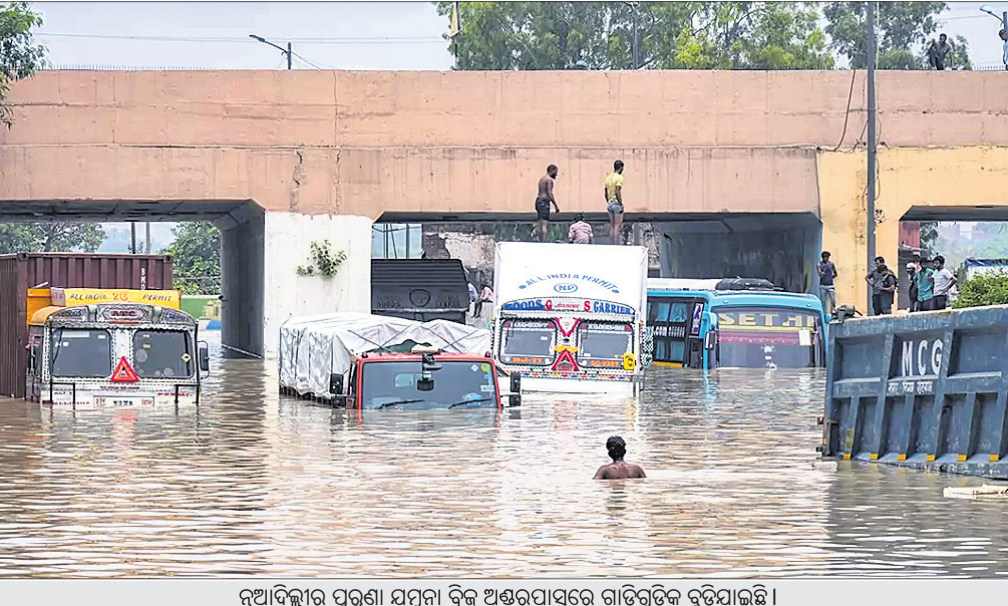
ନୂଆଦିଲ୍ଲୀର ପୁରୁଣା ଯମୁନା ବ୍ରିଜ୍ ଅକ୍ଷୟପାତ୍ରେ ଗାଡ଼ିଗୁଡ଼ିକ ବୁଡ଼ିଯାଇଛି।

ଚନ୍ଦ୍ରଯାନ-୩ ଉଦ୍ଦେଶ୍ୟରେ ମାଧ୍ୟମ ହେବାକୁଥିବା ଏଲ୍‌ଭିଏମ୍-୩ (ଦି ଲକ୍ଷ ଭେଜିକଲ ମାକ୍-୩)ର ଲମ୍ବ ୪୩.୫ ମିଟର। ଏହି ରକେଟ୍‌କୁ 'ଫ୍ୟାଟ୍ ବୟ' କୁହାଯାଏ। ଏଲ୍‌ଭିଏମ୍-୩ ରକେଟ୍ ପ୍ରପାଳନ, ଲ୍ୟାଣ୍ଡର ଏବଂ ରୋଭର ମୋଡ୍ୟୁଲ୍‌କୁ ନେଇ ଗଠିତ। ସର୍ବନିମ୍ନ ଉଚ୍ଚତାରେ ରକେଟ୍ ପ୍ରଥମ ଉଡ଼ାଣ ଭରିବ। ଏହା ଶେଷ ହୋଇଲେ ଲିଫ୍ଟର୍ ଟୁଏଲ୍ ଜରିଆରେ ଏଲ୍‌ଭିଏମ୍ ଆଉ କିଛି ଦୂର ଯିବ। ଶେଷ ପର୍ଯ୍ୟାୟରେ କ୍ରିଉଜେନ୍‌କ୍ ଇଞ୍ଜିନ୍ ତରଳ ହାଇଡ୍ରୋଜେନ୍ ଓ ଅକ୍ସିଜେନ୍ ଦ୍ୱାରା ରକେଟ୍ ଚନ୍ଦ୍ରଯାନ-୩କୁ ଚନ୍ଦ୍ର ପୃଷ୍ଠରେ ପହଞ୍ଚାଇବ। ଉଦ୍ଦେଶ୍ୟରେ ପ୍ରଥମ ୧୬ ମିନିଟ୍‌ରେ ରକେଟ୍ ୧୭୯ କି.ମି. ଉଚ୍ଚତାକୁ ଉଠିବ। ୫ରୁ ୬ ଥର ପାଖାପାଖି ୧୭୦ କି.ମି. ପର୍ଯ୍ୟନ୍ତ ପୃଥିବୀ ଚାରିପଟେ ଘୁରିବା ପରେ ୩୬,୫୦୦ କି.ମି. ବେଗରେ ଚନ୍ଦ୍ର କକ୍ଷପଥ ଅଭିଯୁକ୍ତ ଏଲ୍‌ଭିଏମ୍-୩ ଅଗ୍ରସର ହେବ। ଲିଫ୍ଟ୍ ରକେଟ୍‌କୁ ଭାରତୀୟ ମହାକାଶ ଗବେଷଣା ସଙ୍ଗଠନ ପକ୍ଷରୁ ନିର୍ମାଣ କରାଯାଇଛି। ଏହି ରକେଟର ମୂଳ ଉଦ୍ଦେଶ୍ୟ ଇଓଷ୍ଟେଶନାରି ଅର୍ବ୍‌ରେ ଯୋଗାଯୋଗ ସାଚେଲାଭିକ୍‌ସ୍‌ଟ୍ରିକ୍ ଲକ୍ଷ କରିବା। ଭିଷ୍ଣ୍ୟତରେ ଏଲ୍‌ଭିଏମ୍-୩ ରକେଟ୍ ଲୋକଙ୍କୁ ନେଇ ଉଡ଼ାଣ ଭରିବାର ଯୋଜନା ରହିଛି। ୨୦୧୪ ଡିସେମ୍ବର ୧୮ରେ ଏଲ୍‌ଭିଏମ୍‌ର ସଫଳ ପରୀକ୍ଷଣ କରାଯାଇଥିଲା। ଏହାର ନିର୍ମାଣରେ ମୋଟ ୨,୬୬୨.୬୮ କୋଟି ଟଙ୍କା ବ୍ୟୟ କରାଯାଇଥିଲା।