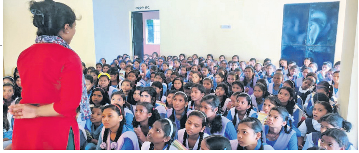
ଛାତ୍ରମାନଙ୍କୁ ବିଭିନ୍ନ ବିଷୟରେ ଅବଗତ କରାଉଛନ୍ତି ସଖାର ମହିଳା ଅଧିକାରୀ।

ଖୁଲ ଓ ମାମି ମାଗାମ ଛାତ୍ରା ମାନଙ୍କୁ ସଚେତନ କରିଥିଲେ। ୧୮ ବର୍ଷରୁ କମ୍ ବାଲିକାଙ୍କ ଉପରେ ହେଉଥିବା ନିର୍ଯାତନା ସମ୍ପର୍କରେ ସେମାନେ