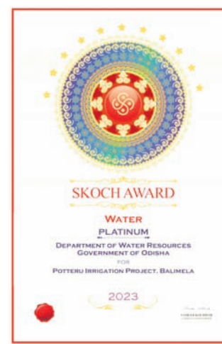
ବାଲିମେଳା, ୧୩୧୭(ଶିବଦତ୍ତ ସାହୁ)

ମାଲକାନଗିରି ଜିଲ୍ଲାରେ ଥିବା ପୋଖରୀ ଜଳସେଚନ ପ୍ରକଳ୍ପ ଜାତୀୟସ୍ତରରେ ଏକ୍ସଲେଣ୍ଟ ଓ ସିଏଚ୍‌ଏସ୍‌ଏସ୍‌ଏସ୍‌ ପୁରସ୍କାର ସମ୍ମାନରେ ସମ୍ମାନିତ ହୋଇଛି। ଜଳସେଚନ ପ୍ରକଳ୍ପର କାର୍ଯ୍ୟକାରୀତା ଏବଂ ଓକ୍‌ସିଏସ୍‌ରେ ଗଠାଯାଇଥିବା ପଞ୍ଚାୟତ ଓ କେନାଲ ପରିଚାଳନା ଆଦି ପାଇଁ ବାଲିମେଳା ଜଳସେଚନ ପ୍ରକଳ୍ପକୁ ଜାତୀୟସ୍ତରରେ ପୁରସ୍କାର ଆର୍ଜୀରେ ସମ୍ମାନିତ କରାଯାଇଛି। ମୁଖ୍ୟ ନିର୍ମାଣ ସମ୍ପ୍ରଦାୟ ପ୍ରକଳ୍ପର ମିଶ୍ଟ୍ର କହିଛନ୍ତି, ଏ ପୁରସ୍କାର ପାଇଁ ପୋଖରୀ ପ୍ରକଳ୍ପର ସମସ୍ତ କର୍ମଚାରୀଙ୍କ ଅବଦାନ ରହିଛି। ବିଶେଷ ଭାବେ ଜଳସେଚନ ଗ୍ରାମଗୁଡ଼ିକରେ ପାଣି ପଞ୍ଚାୟତ ଗଠନକରି ଆମ କର୍ମଚାରୀ ଓ ଚାଷୀମାନେ ମିଶି ଜଳ ସୁପରିଚାଳନା କରିବା ଦ୍ୱାରା ଆଜି ଜିଲ୍ଲାର ସମସ୍ତ ଚାଷୀ