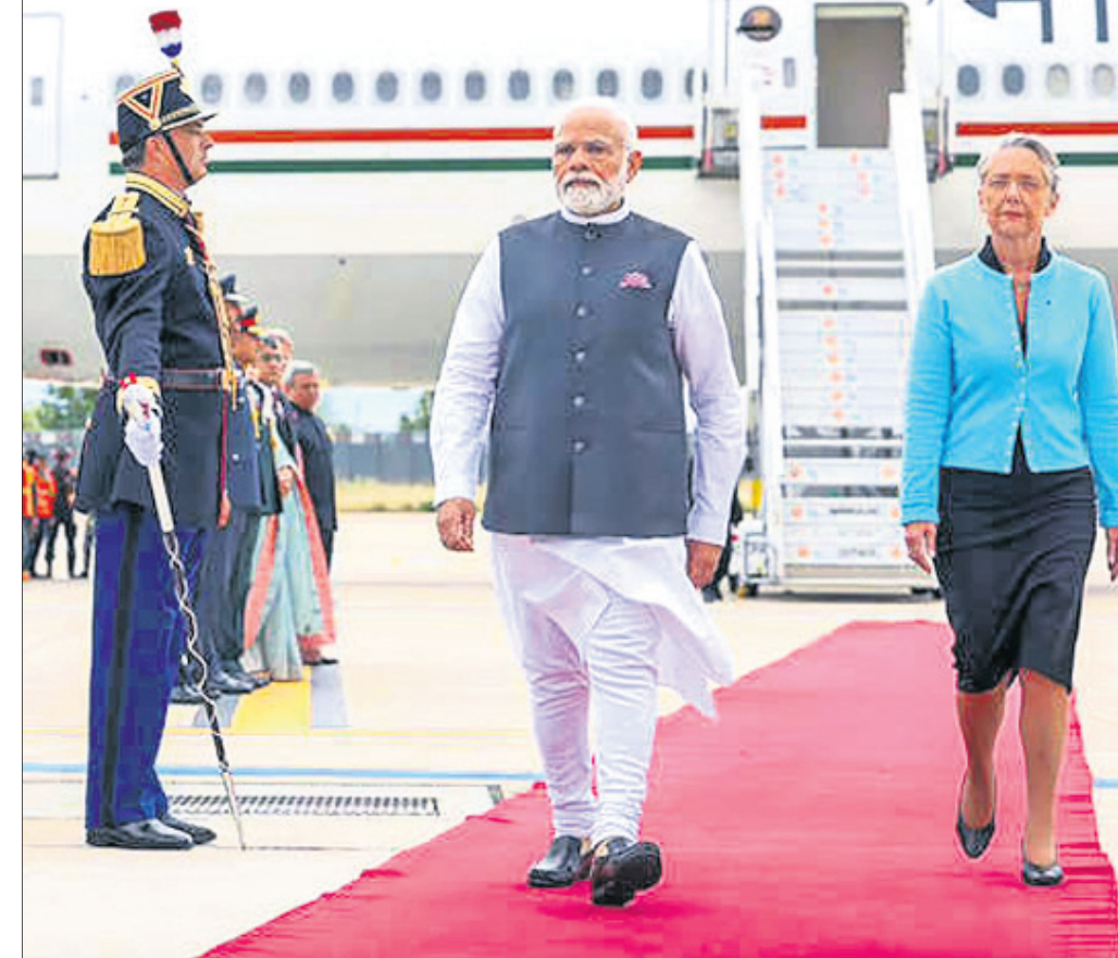
ଫ୍ରାନ୍ସ ପ୍ରଧାନମନ୍ତ୍ରୀ ଏଲିଜାବେଥ୍ ବୋର୍ନ ପ୍ୟାରିସ୍ ବିମାନବନ୍ଦରରେ ଭାରତର ପ୍ରତିପକ୍ଷ ନରେନ୍ଦ୍ର ମୋଦିଙ୍କୁ ସ୍ୱାଗତ କରିନେଇଛନ୍ତି।

ଅଧିଗ୍ରହଣକୁ ଭାରତର ମଞ୍ଜୁରୀ ପ୍ରଧାନମନ୍ତ୍ରୀ ନରେନ୍ଦ୍ର ମୋଦିଙ୍କ ହାଇପ୍ରୋଫାଇଲ୍ ଫ୍ରାନ୍ସ ଗସ୍ତବେଳେ ଭାରତ ଏହି ବହୁରାଷ୍ଟ୍ର ୨୬ଟି ନାଭାଲ୍ ଭାରିଆଣ୍ଟ ରାଫାଲ୍ ଜେଟ୍ ଓ ୩ ସୋପିଆନ୍ ଶ୍ରେଣୀର ବୁଡ଼ାକାହାଳ ଅଧିଗ୍ରହଣକୁ ମଞ୍ଜୁରୀ ଦେଇଛି। ପ୍ରତିରକ୍ଷା ମନ୍ତ୍ରୀ ରାଜନାଥ ସିଂହ ଅଧିଗ୍ରହଣ ପ୍ରତିରକ୍ଷା ଅଧିଗ୍ରହଣ ପରିଷଦ (ଡିଏସି) ଏହି ପ୍ରସ୍ତାବକୁ ଅନୁମୋଦନ କରିଛି। ରୁକ୍ମି ସମ୍ପାଦନର ୩ ବର୍ଷ ମଧ୍ୟରେ ଏହି ଏୟାରକ୍ରାଫ୍ଟଗୁଡ଼ିକ ଭାରତକୁ ଆସିବ। ଭାରତ ପାଖରେ ବର୍ତ୍ତମାନ ୩୬ଟି ରାଫାଲ୍ ସି (ଏୟାର ଫୋର୍ସ) ଭାରିଆଣ୍ଟ ଜେଟ୍ ଥିବାବେଳେ ୨୬ଟି ରାଫାଲ୍ ଏମ୍ (ନୋରାଇଜ୍) ଆସିବ। ଦାସଲ୍ ଆଭିଏଣ୍ଟ ଦ୍ୱାରା ନିର୍ମିତ ରାଫାଲ୍ ଏମ୍'କୁ ନୌସେନା ଫାଇଟର୍ସଙ୍କ ପାଇଁ ଅନ୍ୟତମ ଅତ୍ୟାଧୁନିକ ସୁଧିବିମାନ ବିବେଚନା କରାଯାଉଛି।