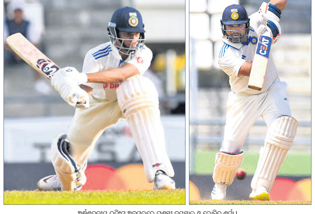
ଅର୍ଦ୍ଧଶତକୀୟ ଜନିତ୍ ଅବସରରେ ସମସ୍ତ ଜୟସାଲ ଓ ରୋହିତ ଶର୍ମା ।

ଡୋମିନିକା, ୧୩୭ ଡୋମିନିକାରେ ଅନୁଷ୍ଠିତ ଭାରତ ଓ ଫ୍ରେଞ୍ଚାଇଜିଟ୍ ଟେଷ୍ଟ ସିରିଜର ପ୍ରଥମ ମ୍ୟାଚରେ ଦୃଢ଼ ସ୍ଥିତିରେ ଭ୍ରମଣକାରୀ ଦଳ । ପ୍ରଥମ ଦିନରେ ଫ୍ରେଞ୍ଚାଇଜିଟ୍ ୧୫୦ ରନ୍ରେ ସାମିତ ରଖିବା ପରେ ଦ୍ୱିତୀୟ ଦିନ ପ୍ରଥମ ସେସନ ପୂର୍ଣ୍ଣ ଭାବେ ଦିନା ଯିତରେ ୧୪୬ ରନ୍ କରିଛି । ଭାରତ ପକ୍ଷରୁ ଅଧିନାୟକ ରୋହିତ ଶର୍ମା ଓ ପଦାର୍ପଣକାରୀ ଜୟସାଲ ଜୟସାଲ ଅପରାଜିତ ଅର୍ଦ୍ଧଶତକ ହାସଲ କରିଛନ୍ତି । ଭାରତୀୟ ଦଳ ମାତ୍ର ୪ ରନ୍ ପଛରେ ରହିଥିବା ବେଳେ ଏକ ବଡ଼ ସ୍କୋର ଆଡ଼କୁ ଦଳ ଗ୍ରହଣ ହେଉଛି ।