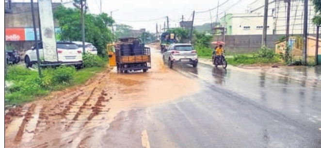
ଜାତୀୟ ରାଜପଥ କଡ଼ରେ କାଦୁଅ ।