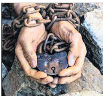
ଉପନିବେଶବାଦର ପ୍ରଭାବ ଓ ବିପଦଗୁଡ଼ିକ ସ୍ୱୀକାର ନ କରି କେବଳ ଏଗୁଡ଼ିକୁ ମନେପକାଇବା ଓ କ୍ଷମା ମାଗିବା ଅର୍ଥ ଡାକ୍ଷିଣ୍ୟ ଅସମ୍ଭବତାକୁ ଜାରି ରଖିବା। ଉପନିବେଶବାଦ ଅତ୍ୟାଚାର ଆର୍ଥିକ ବ୍ୟବସ୍ଥାକୁ ସହଯୋଗ କରିଥିଲା। କୃଷିକାର ସୁବିକଳ ଅତ୍ୟଧିକ ଅପରାଧୀକରଣ, ଅତ୍ୟଧିକ ଅଣଶେଷାଳ ମାତ୍ର ମୂଲ୍ୟହୀନ, କର୍ମଚ୍ଛେଦନ ଅସମ୍ଭବତା, ପ୍ରବାସୀଙ୍କ ପାଇଁ ସାମାଜିକ ସେବାର ସୀମିତ ଉପଲବ୍ଧତା ଏବଂ ସୁରୋପରେ ରାଜକୀୟ ବ୍ୟବସ୍ଥାର ସାମାଜିକ ଓ ରାଜନୈତିକ

କ୍ଷମତାର ପ୍ରୟୋଗ ହିଁ ସୁରୋପକୁ ସମୃଦ୍ଧ କରିଥିବା ପାରିବାସିକ ସାମ୍ରାଜ୍ୟବାଦ ପରିଣାମର ଗୋଟିଏ ଗୋଟିଏ ଅଂଶ। ଏହି ଅନ୍ୟାୟକୁ ଦୂରକରିବା ପାଇଁ ଆମକୁ ସ୍ୱୀକାର କରିବାକୁ ହେବ ଯେ ଯେତେବେଳେ ବିଷୟରେ ସାମ୍ପ୍ରତିକ ବିଚାରରେ ଆର୍ଥିକ ପୁନଃ ସ୍ଥାପନ ଉପରେ ଯେଉଁ ଗୁରୁତ୍ୱ ଦିଆଯାଇଛି ସେଥିରେ ସମସ୍ୟା ରହିଛି। ଯଦି ଆମେ ସତର୍କ ନାହୁଁ, ସରକାର ଏବଂ ଅନୁଷ୍ଠାନଗୁଡ଼ିକ ନିଜ ଦାୟିତ୍ୱକୁ କୌଣସି ପ୍ରକାରେ ବାହାରିଯିବାକୁ ଯିବେ ତେବେ ଆମେ ଅତ୍ୟାଚାରୀଙ୍କୁ ବ୍ୟବହାର କରିପାରିବୁ। କାରଣ ଆମେ ଅତ୍ୟାଚାରୀଙ୍କୁ ଆଇନକୁ ଖାଲି ଯେ ଆଇନ, ନୀତି ଏବଂ କାର୍ଯ୍ୟକାରୀତାରେ ସଂଶୋଧନ କରିବା ଭଳି ମହତ୍ତ୍ୱପୂର୍ଣ୍ଣ ପଦକ୍ଷେପ ନେବା ପରିବର୍ତ୍ତେ ଦେଶଗୁଡ଼ିକ ମାନବିକ ଅଧିକାରର ଉଲ୍ଲଙ୍ଘନ ପାଇଁ ଯିବେ ତେବେ ଆମେ ସତର୍କତା ସହ କାର୍ଯ୍ୟ କରିବା। ଆମ କାର୍ଯ୍ୟକଳାପର ମୌଳିକ ଛୁଟି ସଫଳତାକୁ ନିର୍ଦ୍ଦେଶ କରିବା ସହ ଏକ ନ୍ୟାୟପୂର୍ଣ୍ଣ ପ୍ରଣାଳୀ ପାଇଁ ଧନ ପୁନଃ ଆବଶ୍ୟକ ଗୁରୁତ୍ୱପୂର୍ଣ୍ଣ ଭୂମିକାକୁ ନିର୍ଦ୍ଦେଶ ଦେବା ପାଇଁ ଆମେ ସତର୍କତା ସହ କାର୍ଯ୍ୟ କରିବା। ଆମ କାର୍ଯ୍ୟକଳାପର ମୌଳିକ ଛୁଟି ସଫଳତାକୁ ନିର୍ଦ୍ଦେଶ କରିବା ସହ ଏକ ନ୍ୟାୟପୂର୍ଣ୍ଣ ପ୍ରଣାଳୀ ପାଇଁ ଧନ ପୁନଃ ଆବଶ୍ୟକ ଗୁରୁତ୍ୱପୂର୍ଣ୍ଣ ଭୂମିକାକୁ ନିର୍ଦ୍ଦେଶ ଦେବା ପାଇଁ ଆମେ ସତର୍କତା ସହ କାର୍ଯ୍ୟ କରିବା। ଆମ କାର୍ଯ୍ୟକଳାପର ମୌଳିକ ଛୁଟି ସଫଳତାକୁ ନିର୍ଦ୍ଦେଶ କରିବା ସହ ଏକ ନ୍ୟାୟପୂର୍ଣ୍ଣ ପ୍ରଣାଳୀ ପାଇଁ ଧନ ପୁନଃ ଆବଶ୍ୟକ ଗୁରୁତ୍ୱପୂର୍ଣ୍ଣ ଭୂମିକାକୁ ନିର୍ଦ୍ଦେଶ ଦେବା ପାଇଁ ଆମେ ସତର୍କତା ସହ କାର୍ଯ୍ୟ କରିବା। ଆମ କାର୍ଯ୍ୟକଳାପର ମୌଳିକ ଛୁଟି ସଫଳତାକୁ ନିର୍ଦ୍ଦେଶ କରିବା ସହ ଏକ ନ୍ୟାୟପୂର୍ଣ୍ଣ ପ୍ରଣାଳୀ ପାଇଁ ଧନ ପୁନଃ ଆବଶ୍ୟକ ଗୁରୁତ୍ୱପୂର୍ଣ୍ଣ ଭୂମିକାକୁ ନିର୍ଦ୍ଦେଶ ଦେବା ପାଇଁ ଆମେ ସତର୍କତା ସହ କାର୍ଯ୍ୟ କରିବା।