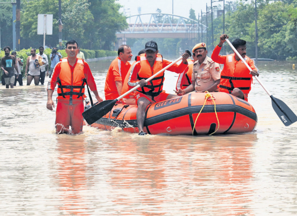
ଯମୁନା ନଦୀ ବନ୍ୟାଜଳରେ ଦିଲ୍ଲୀ ରାସ୍ତା ଜଳାଶୁଷ୍କ । ଉଦ୍ଧାର କାର୍ଯ୍ୟରେ ଏନ୍ଡିଆର୍କସ୍ ଟିମ୍ ।

ଦିଲ୍ଲୀ, ୧୩୭ ଯମୁନା ନଦୀ ଜଳସ୍ତର ବୃଦ୍ଧିର ଫଳରେ ରାଜ୍ୟରେ ଅଧିକ ବର୍ଷା ପାଣିରେ ଦିଲ୍ଲୀରେ ବନ୍ୟା ହେଉଛି । ଖାଲୁଆ ଅଞ୍ଚଳଗୁଡ଼ିକରେ ଲୋକଙ୍କ ଘରେ ପାଣି ପଶିଯାଇଛି । ରାସ୍ତାଘାଟ ପାଣିରେ ବୁଡ଼ିଯିବାକୁ ପଡ଼ିବାର ସେବା ଗୁରୁତର ବାଧାପ୍ରାପ୍ତ ହୋଇଛି । ବନ୍ୟାରେ ଦିଲ୍ଲୀର ୬ଟି ଜିଲ୍ଲା ପ୍ରଭାବିତ ହୋଇଛି । ବନ୍ୟାସ୍ଥିତି ଯୋଗୁ ଲାଲ୍ କିଲକ୍ ରୁକୁବାର ମଧ୍ୟାହ୍ନ