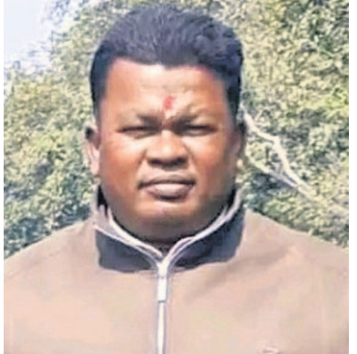
ଉଲ୍ଲେଖ ରହିଛି । ହେଲେ କେଉଁ କାରଣରୁ ଜଣେ ପୋଲିସ ଏସ୍.ଆଇ.ଙ୍କ ମନରେ ହତ୍ୟା କରିବା ଭଳି ଭାବନା ଆସିଲା ତାହାକୁ କ୍ରାଇମ୍‌ସ୍‌ଟ୍ରାଷ୍ଟ ସ୍ପଷ୍ଟ

■ ଶାସ୍ତ୍ର ଜିଲା ଜଜ୍ଙ୍କ ପାଖରେ ଚାର୍ଜ୍‌ସ୍ତେମ୍ପ୍ ■ ଖୋଲୁନି ହତ୍ୟା ରହସ୍ୟ