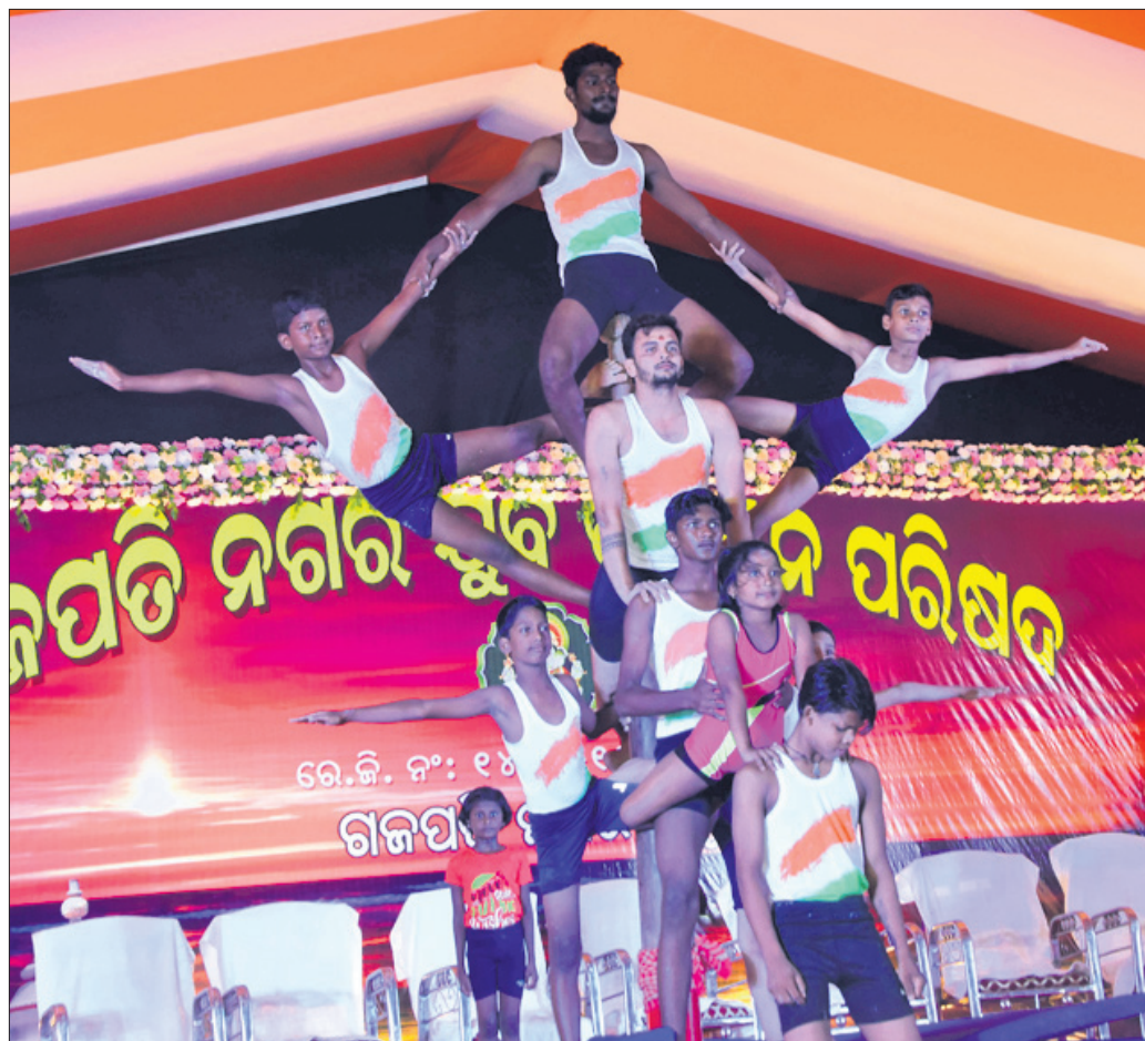
ପୁରୀ ଗଜପତିନଗର ଯୁବ ପରିଷଦ ପକ୍ଷରୁ ବିନାୟକ ବିଗ୍ରହ ଉତ୍ସବ ଅବସରରେ ଅନୁଷ୍ଠିତ ସାଂସ୍କୃତିକ ଉତ୍ସବରେ ମାଲଖମ ପ୍ରଦର୍ଶନ କରୁଛନ୍ତି।