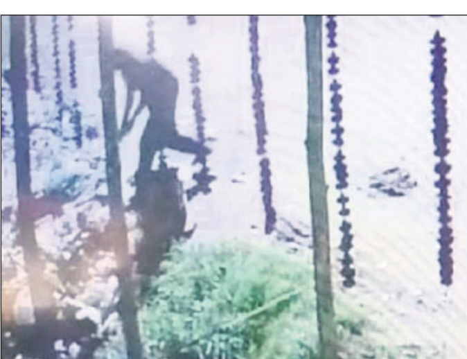
ଜବତ କରିବା ସହ ନିକଟରେ ଲାଗିଥିବା ରୂପବାର ରାତି ୧୩ ୨୫ରେ ମହିଳା ସିଟିଭି ଫୁଟେଜକୁ ଯାଞ୍ଚ କରିଥିଲା। ଜଣକ ଅଳିଆଗଦାକୁ ଲିଙ୍ଗି ଖାଦ୍ୟ