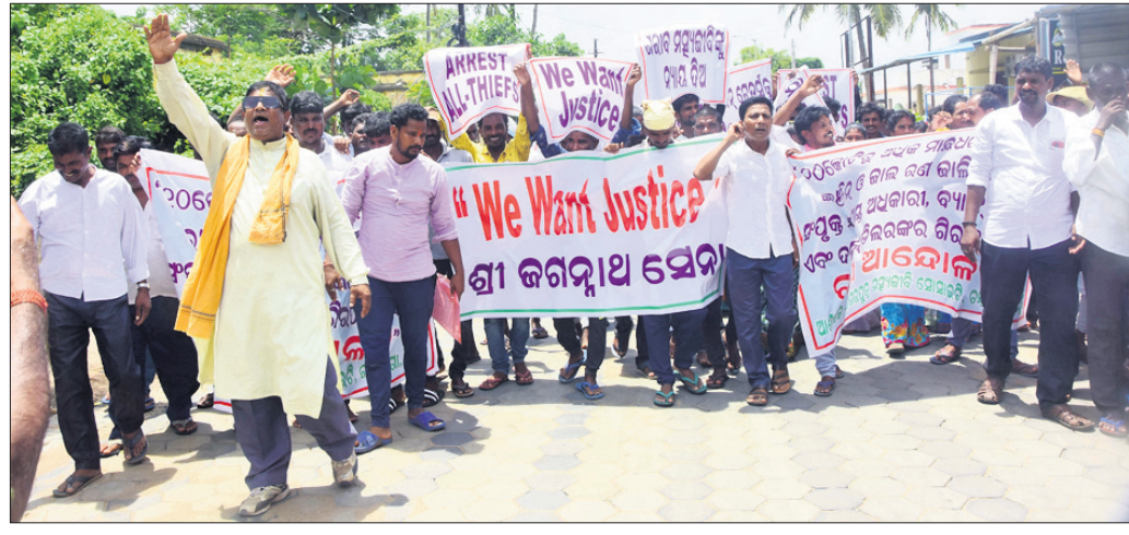
ମହାଧର୍ମାଦେବୀଙ୍କ ନାମରେ ବ୍ୟାଙ୍କରୁ ୧୦ କୋଟି ଟଙ୍କା ନେଇ ଆତ୍ମସାତ୍ କରିଥିବା ଅଭିଯୋଗ ହୋଇଛି।

■ କାର୍ଯ୍ୟାନୁଷ୍ଠାନ ଦାବି କଲା ମହାଧର୍ମାଦେବୀ ସଂଘ ■ ମହାଧର୍ମାଦେବୀଙ୍କ ନାମରେ ବ୍ୟାଙ୍କ ରାଶି ନେଇ ଆତ୍ମସାତ୍ କରିଥିବା ଅଭିଯୋଗ ହୋଇଛି। ସାମଗ୍ରୀୟ ମହାଧର୍ମାଦେବୀ ସଂଘ ଏହି ଅଭିଯୋଗ ଆଣି ଗୁରୁବାର ମହାଧର୍ମାଦେବୀଙ୍କ ନାମରେ ବ୍ୟାଙ୍କରୁ ୧୦ କୋଟି ଟଙ୍କା ନେଇ ଆତ୍ମସାତ୍ କରିଥିବା ଅଭିଯୋଗ ହୋଇଛି। ସାମଗ୍ରୀୟ ମହାଧର୍ମାଦେବୀ ସଂଘ ଏହି ଅଭିଯୋଗ ଆଣି ଗୁରୁବାର ମହାଧର୍ମାଦେବୀଙ୍କ ନାମରେ ବ୍ୟାଙ୍କରୁ ୧୦ କୋଟି ଟଙ୍କା ନେଇ ଆତ୍ମସାତ୍ କରିଥିବା ଅଭିଯୋଗ ହୋଇଛି। ସାମଗ୍ରୀୟ ମହାଧର୍ମାଦେବୀ ସଂଘ ଏହି ଅଭିଯୋଗ ଆଣି ଗୁରୁବାର ମହାଧର୍ମାଦେବୀଙ୍କ ନାମରେ ବ୍ୟାଙ୍କରୁ ୧୦ କୋଟି ଟଙ୍କା ନେଇ ଆତ୍ମସାତ୍ କରିଥିବା ଅଭିଯୋଗ ହୋଇଛି।