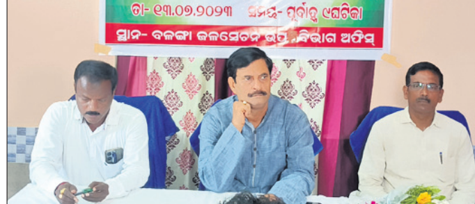
ବୈଠକରେ ବିଧାୟକ ସମୀକ୍ଷା କଲେ ଅଧିକାରୀ ଦାୟୀ