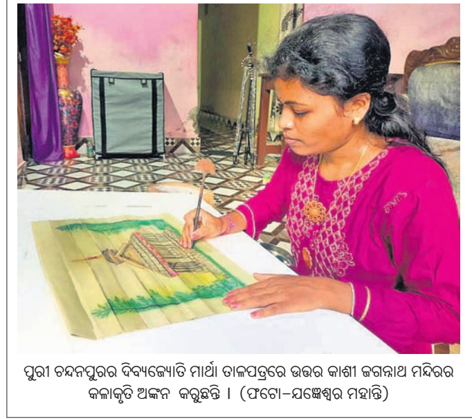
ପୁରୀ ଚନ୍ଦ୍ରପୁର ବିଦ୍ୟାଳୟର ମାଆ ଚାଳପତ୍ରରେ ଉତ୍ତର କାଶୀ ଜଗନ୍ନାଥ ମନ୍ଦିରର କଳାକୃତି ଅଙ୍କନ କରୁଛନ୍ତି।

ନିୟୁତ ଗ୍ରାମବାସୀଙ୍କ ଭାଇତାରି ପ୍ରତି ଇର୍ଷାଦିତ ହୋଇ ଗ୍ରାମରେ କଳାକୃତକୌର୍ତ୍ତ, ଉକ୍ତ ବ୍ୟକ୍ତିଙ୍କୁ ନିଆଁପାଣି ବାସନ୍ଦ ଆଦି ଅପପ୍ରଚାର କରାଯାଉଛି ବୋଲି ଗ୍ରାମ କମିଟି ଅଭିଯୋଗ କରିଛି। ଗ୍ରାମର ଭାଇତାରିଙ୍କୁ ନେଇ କୁସାଧାରଣତା କରୁଥିବା ନିୟୁତକ ବିରୋଧରେ ଦୃଢ଼ କାର୍ଯ୍ୟାନୁଷ୍ଠାନ ଗ୍ରହଣ କରାଯିବ ପାଇଁ ଗ୍ରାମବାସୀ ଜିଲ୍ଲାପାଳ ଓ ଏସପିଙ୍କ ନିକଟରେ ଲିଖିତ ଭାବେ ଦାବି ଜଣାଇଛନ୍ତି। ଏ ନେଇ ଲକ୍ଷକୋମିଟିକୁ ମନାମତି କାରିଗର ହୋଇଥିବାକୁ ଏବେବେ ସେ ଗ୍ରାମର ବିଭିନ୍ନ ଲୋକଙ୍କ ଘରକୁ ଯାଇ କାର୍ଯ୍ୟ କରୁଛନ୍ତି। ଏପରି ଅବସ୍ଥାରେ କେତେକ