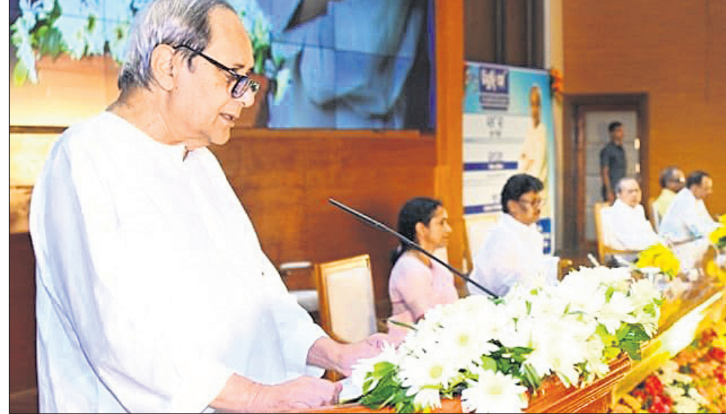
ନବନିମ୍ନୁଲ୍ଲ ଅଧିକାରୀମାନଙ୍କୁ ମୁଖ୍ୟମନ୍ତ୍ରୀ ନବୀନ ପଟ୍ଟନାୟକ ପରାମର୍ଶ ଦେଉଛନ୍ତି।

ରାଜ୍ୟ ସରକାରଙ୍କ ୩ ଦିନିଆରେ ୧୮୧ ଜଣଙ୍କୁ ନୂଆ ନିମ୍ନୁଲ୍ଲ ମିଳିଛି। ସେମାନଙ୍କ ମଧ୍ୟରେ ୧୦୪ ଶିକ୍ଷକ ପ୍ରଶିକ୍ଷକ, ୬୨ ସହକାରୀ ନିର୍ଦ୍ଦେଶକ (ସିଏ) ଏବଂ ୧୫ ସହକାରୀ ପରିସଂଖ୍ୟାନ ନିର୍ଦ୍ଦେଶକଙ୍କୁ ନିମ୍ନୁଲ୍ଲ ଦିଆଯାଇଛି। ଗୁରୁତାର ଲୋକସେବା ଭବନ କର୍ମଚାରୀଙ୍କ ସେକ୍ସରେ ଅନୁଷ୍ଠିତ ଏହି ନିମ୍ନୁଲ୍ଲ ପର୍ବ କାର୍ଯ୍ୟକ୍ରମରେ ଯୋଗ ଦେଇ ମୁଖ୍ୟମନ୍ତ୍ରୀ ନବୀନ ପଟ୍ଟନାୟକ ଓଡ଼ିଶାର ରୂପାନ୍ତରକୁ ଆହୁରି ଦ୍ରୁତ ବେଗରେ ଆଗେଇ ନେବା ପାଇଁ ଉଦ୍ୟମ କରିବାକୁ ନବନିମ୍ନୁଲ୍ଲ ଅଧିକାରୀମାନଙ୍କୁ ପରାମର୍ଶ ଦେଇଛନ୍ତି। ମୁଖ୍ୟମନ୍ତ୍ରୀ କହିଛନ୍ତି ଯେ ଓଡ଼ିଶାର ରୂପାନ୍ତରକୁ ଦ୍ରୁତ ଗତିରେ ଆଗେଇ ନେବାକୁ ଆମ ସମସ୍ତଙ୍କ ଏକତ୍ର ଲକ୍ଷ୍ୟ ହେବା ଦରକାର।