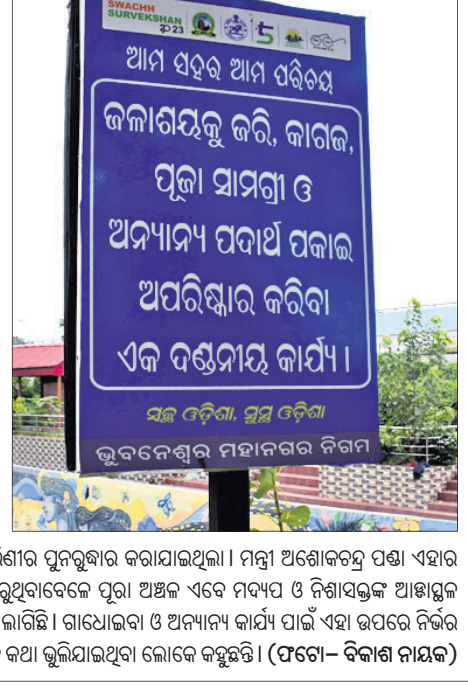
ଭୁବନେଶ୍ୱର ମହାନଗର ନିଗମ