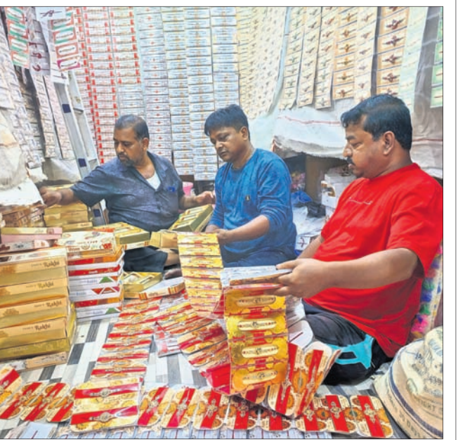
କଟକ ଚୌଧୁରୀ ବଜାରରେ ଥିବା ଏକ ପାଇକାରୀ ରାକ୍ଷା ଦୋକାନରୁ ସ୍ଥୁରୁରା ବ୍ୟବସାୟୀମାନେ ରାକ୍ଷା କିଣୁଛନ୍ତି।