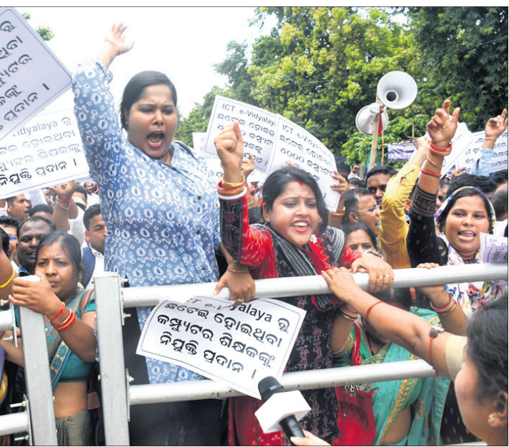
ସ୍ଥାନୀୟ ନିଯୁକ୍ତି ସହ ୩ ଦମ୍ପା ଦାବି ନେଇ କମ୍ପ୍ୟୁଟର ଶିକ୍ଷକମାନେ ଗୁରୁବାର ଭୁବନେଶ୍ୱର ଲୋକସଭା ପିଏମ୍‌ଡିରେ ବିରୋଧ ଶୋଭାଯାତ୍ରାରେ ବିଧାନସଭା ଅଭିଯୁକ୍ତେ ଯାଉଥିବାବେଳେ ପୋଲିସ୍ ବ୍ୟାରିକେଡ୍ ପକାଇ ଅବରୋଧି।