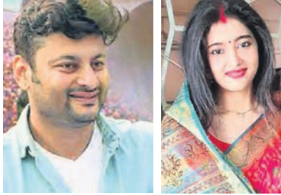
ଅନୁଭବ-ବର୍ଷା ବିବାହ ବିଚ୍ଛେଦ ମାମଲାର ଦ୍ୱିତୀୟ ଶୁଣାଣି ମାମଲା

କଟକ ପରିବାର ଅଦାଲତରେ ଏମ୍ପି ତଥା ଅଭିନେତା ଅନୁଭବ ମହାନ୍ତି ଓ ତାଙ୍କ ସ୍ତ୍ରୀ ଅଭିନେତ୍ରୀ ବର୍ଷା ପ୍ରିୟଦର୍ଶିନୀଙ୍କ ଛାଡ଼ପତ୍ର ମାମଲାର ରାୟ ପ୍ରକାଶ ୩ ମାସ ମଧ୍ୟରେ କରିବାକୁ ହାଇକୋର୍ଟ ଗୁରୁବାର ନିର୍ଦ୍ଦେଶ ଦେଇଛନ୍ତି । ପରିବାର ଅଦାଲତରେ ମାମଲାର ଶୁଣାଣି ବିକୟ ହେଉଥିବା ଦର୍ଶାଇ ଅନୁଭବଙ୍କ ପକ୍ଷରୁ ଆଗତ ଆବେଦନର ଶୁଣାଣି କରି ହାଇକୋର୍ଟର ମୁଖ୍ୟ ବିଚାରପତି ଡ. ଏସ୍. ମୁରଲୀଧରଙ୍କ ଖଣ୍ଡପାଠ ଉପରୋକ୍ତ ନିର୍ଦ୍ଦେଶ ଦେଇଛନ୍ତି । ଏଥିସହ ଜୁଲାଇ ୩୧ ସୁଦ୍ଧା ବର୍ଷାଙ୍କ ସାକ୍ଷ୍ୟଗ୍ରହଣ ଶେଷ କରିବାକୁ ମଧ୍ୟ କଟକ ପରିବାର ଅଦାଲତକୁ ହାଇକୋର୍ଟ ନିର୍ଦ୍ଦେଶ ଦେଇଛନ୍ତି ।