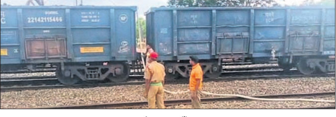
ଅଗ୍ନିଶମ କର୍ମଚାରୀ ନିଆଁ ଲିଭାଇଛନ୍ତି।

କେନ୍ଦୁଝର, ୧୩୭ (ନଗରୀ ଚନ୍ଦ୍ର ପଟ୍ଟନାୟକ) ଯାଜପୁର ଜିଲ୍ଲା ସୁକିୟାକୁ କୋଇଲା ବୋହେଇ କରି କେନ୍ଦୁଝର ଜିଲ୍ଲା ବାଂଶପାଣିକୁ ଆସୁଥିବା ମାଲବାହୀ ଟ୍ରେନ୍‌ରେ ଯାତ୍ରୀ-ବାଂଶପାଣି ରେଳପଥରେ ନିଆଁ ଲାଗିଛି। ହରିଚନ୍ଦନପୁର ଅଗ୍ନିଶମ ବିଭାଗ ପକ୍ଷରୁ ନିଆଁ ଲିଭାଇବା ପରେ ଟ୍ରେନ୍ ଗନ୍ତବ୍ୟ ସ୍ଥଳକୁ ଯାଇଥିଲା। ଲୋକପାଇଲଟଙ୍କ ଉପସ୍ଥିତ ବୁଦ୍ଧି ଯୋଗୁ ବଡ଼ ଦୁର୍ଘଟଣା ଏଡ଼ାଇ ଯାଇଥିଲା। ସୂଚନା ଅନୁଯାୟୀ, ବାଂଶପାଣି ଅଭିଯୁକ୍ତ ଯାଇଥିବା କୋଇଲା ବୋହେଇ ଟ୍ରେନ୍‌ର ୬ଟି ବଗିଚା ଗୁରୁତାର ଅପରାହ୍ଣରେ ଧୂଆଁ ବାହାଉଥିବା