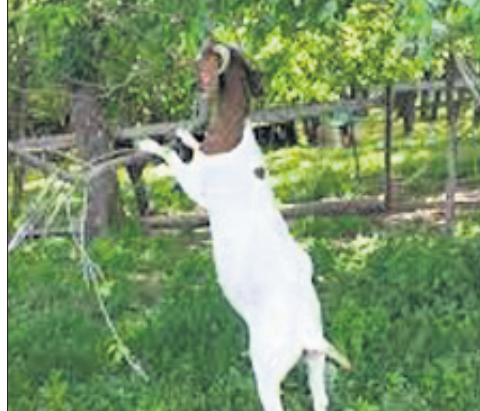
ବୁଝାଇବାକୁ ପଡ଼ିଲା ଯେ ବୁଲା ଗୋରୁ, ଛେଳି ମେଣ୍ଟାଙ୍କ ଦାଉରୁ ଗଛକୁ ରକ୍ଷା କରିବା ପାଇଁ ଏକ ବ୍ୟବସ୍ଥା କରାଯାଇଛି। ସେଦିନ କ୍ଷେତ୍ର ପରିବର୍ତ୍ତନ କଲାବେଳେ ସେ ମହାଶୟ ତାଙ୍କର ଅନୁଭୂତି ବର୍ଣ୍ଣନା କରିବା ବେଳେ ରୋଚକ ଭଙ୍ଗରେ କହିଲେ, ତାଙ୍କ ଦେଶରେ ଗୋପହିଷାଦି ପ୍ରାଣୀମାନଙ୍କୁ ଆବକ କରି ରଖାଯାଏ, ମାତ୍ର ଆମ ଦେଶରେ ଗଛମାନଙ୍କୁ ଆବକ କରି ରଖାଯାଉଛି, ଏତିକି ହିଁ ପାର୍ଥକ୍ୟ। ଯେହେତୁ ସବୁବେଳେ ତାହା ଏକ ନିରୁପଦ୍ରୁତ ବ୍ୟବସ୍ଥା ନୁହେଁ ଆମର ବିଭାଗୀୟ ଅଧିକାରୀମାନେ ଏପରି ଗଛ ଲଗେଇବାକୁ ଚାହୁଁଛନ୍ତି, ଯାହାକି ଗାଈ ବା ଛେଳି ଖାଇବେ ନାହିଁ। ଏହି କ୍ରମରେ ଭଲ ଗଛ ବା ଫଳଗଛ ପ୍ରାୟତଃ ରୋପଣ ହେଉନାହିଁ। ଯେଉଁ ସଂସ୍କୃତି ବଢ଼ିବା ଗଛମାନ ଲଗାଯାଉଛି ତାହା ଭୂତକ ଜଳସ୍ତର ଶୋଷି ନେବାରେ ପ୍ରସାଣ। ଆମର ପୂର୍ବପୁରୁଷମାନେ ରାସ୍ତା କଡ଼ରେ କେତେ ଫଳଗଛ ରୋପଣ କରିଥିଲେ। ରାସ୍ତା ପ୍ରଶସ୍ତାକରଣ ନାଁରେ ଆମେ ସେସବୁ ଗଛକୁ ବହୁଳାଂଶ ଲୋପ