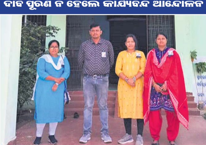
ଛତ୍ରପୁରରେ କଳାବ୍ୟାଜ୍ ପରିଧାନ କରିଥିବା କୃଷି କର୍ମଚାରୀମାନେ ।