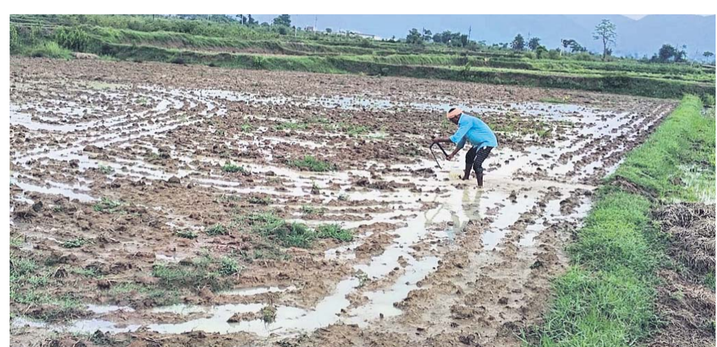
କଣେ ଚାଷୀ ଜମିରେ ଚାଷ କାର୍ଯ୍ୟରେ ବ୍ୟସ୍ତ।

ଗଜପତି ଜିଲ୍ଲାର ପ୍ରାୟ ୮୦ ପ୍ରତିଶତରୁ ଅଧିକ ଲୋକ ଚାଷ ଉପରେ ନିର୍ଭର କରିଥାନ୍ତି। କିଏ ଅର୍ଥକାରୀ ଫସଲ ତ ଆଉ କିଏ ପରିବା ଚାଷ କରନ୍ତି। ମୋଟ ୮୪୮୩୩ ହେକ୍ଟର ଚାଷଜମି ମଧ୍ୟରୁ ୮୨ .୧୨୫ ହେକ୍ଟର ଚାଷଜମି ଖରିଫ ଫସଲ ଉପଯୋଗୀ ରହିଛି। ସେଥିମଧ୍ୟରୁ ୩୫୧୨୧ ହେକ୍ଟର ଚାଷଜମି ଜଳିସେଚନର ସୁବିଧା ରହିଛି। ଜିଲ୍ଲାର ଭାତ ହାଣ୍ଡି କୁହାଯାଉଥିବା ଗୋଷାଣି ବ୍ଲକରେ ସର୍ବାଧିକ ଧାନ ଚାଷ ଉପରେ ନିର୍ଭର କରିଥାନ୍ତି। ସେହି ବ୍ଲକରେ ହିଁ ଅଧିକ ଜଳସେଚିତ ଜମି ରହିଛି। ଅନ୍ୟ ବ୍ଲକରେ ମୁଖ୍ୟତଃ ସମତଳ ଅଞ୍ଚଳକୁ ଛାଡି ବେଲେ ଧାନଚାଷ ଉପଯୋଗୀ ନଥିବାରୁ କେବଳ ଗୋଷାଣି ଓ କାଶାନଗର ବ୍ଲକ ଅଞ୍ଚଳରେ ୨୧୪୬୧ ହେକ୍ଟର ଜମିରେ ଧାନଚାଷ କରାଯାଏ, ଯାହାକି ଜିଲ୍ଲାରେ ମୋଟ ଜଳସେଚିତ ଚାଷଜମିର ୫୦ ପ୍ରତିଶତରୁ ଅଧିକ।