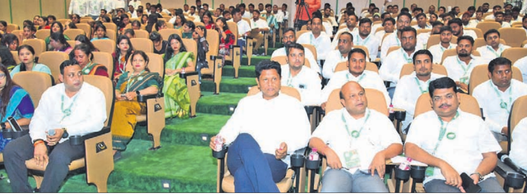
ଶଙ୍ଖଭବନଠାରେ ଶୁକ୍ରବାର ଅନୁଷ୍ଠିତ ବିଜୁ ଛାତ୍ର ଜନତା ଦଳର ରାଜ୍ୟସ୍ତରୀୟ କାର୍ଯ୍ୟକାରୀତା କମିଟି ବୈଠକରେ ଉପସ୍ଥିତ ନେତୃବୃନ୍ଦ।

ଭୁବନେଶ୍ୱର, ୧୪୬୭(ଅନିଲ ଦାସ) ଛାତ୍ରମାନଙ୍କୁ ନେତୃତ୍ୱ ଦେଖିବାକୁ ଛାତ୍ରମାନଙ୍କୁ ସମ୍ମୁଖ କରିବା ପାଇଁ ରାଜ୍ୟ ସରକାର ଶିକ୍ଷା ଓ ଚାଲିମ ଉପରେ ଗୁରୁତ୍ୱ ଦେଉଛନ୍ତି। ଲୋକମାନଙ୍କୁ ଦିଗ୍ରାହ କରିବା ପାଇଁ ବିରୋଧୀ ଦଳ ଅନେକ ଭ୍ରମ ସୃଷ୍ଟି କରୁଛନ୍ତି। ଭୁବନେଶ୍ୱରରେ ପ୍ରତିଷ୍ଠିତ କରିବାକୁ ସାମାଜିକ ଗଣମାଧ୍ୟମରେ ସକ୍ରିୟ ରହିବାକୁ ହେବ। ଏହାକୁ ପ୍ରତିଷ୍ଠିତ କରିବା ସହ ଲୋକମାନଙ୍କ ନିକଟରେ ପ୍ରକୃତ ସୂଚନା ପହଞ୍ଚାଇବାକୁ ବିଭିନ୍ନ ସଭାପତି ତଥା ପୁଞ୍ଜୀମାନଙ୍କୁ ନବୀନ ପଦକ୍ଷେପ ଛାତ୍ରକର୍ମୀମାନଙ୍କୁ ପରାମର୍ଶ ଦେଇଛନ୍ତି।