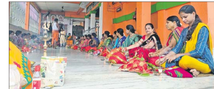
ମହିଳାମାନେ କୁଳୁମ ପୂଜା କରୁଛନ୍ତି।

ପବିତ୍ର ଶ୍ରାବଣ ମାସ ଶୁକ୍ରବାର ପୋଲସରା ପରତନା ମହାମୟୀ ମନ୍ଦିର ପରିସରରେ ଥିବା ଶ୍ରୀରାମଲିଳା ଚୌତେଶ୍ୱରୀ ମନ୍ଦିରରେ ଦେବାଘୁଲୁ ସମ୍ପ୍ରଦାୟର ୪୦୦୦ ଅଧିକ ମହିଳା କୁଳୁମ ପୂଜା କରିଥିଲେ। ସକାଳୁ ମନ୍ଦିରରେ ମା'ଙ୍କ ରାତିନାତି ଅନୁସାରେ ସମସ୍ତ ପୂଜାର୍ଚ୍ଚନା କରିବା ପରେ ସାଢ଼େ ୯ଟାରେ କଳ୍ୟ ଯାତ୍ରା ହୋଇଥିଲା। ମହିଳାମାନେ ଶୋଭାଯାତ୍ରାରେ ବାହାରି ପୁଣ୍ୟତୋୟା ଓ