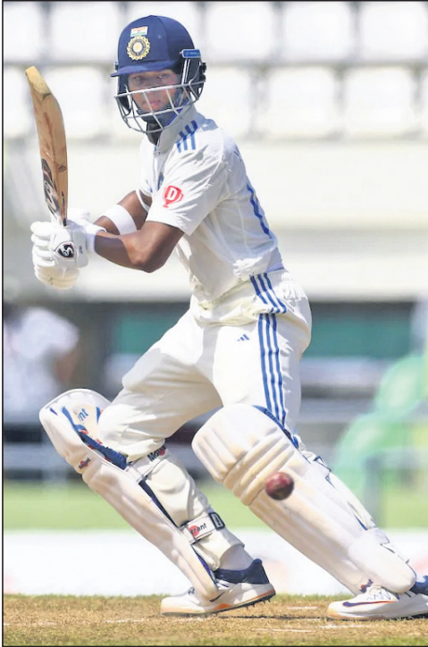
ଶତ ଖେଳିବା ଅବସରରେ ବିରାଟ କୋହଲି ଓ ଯଶସୀ ଜୟସାଲ।