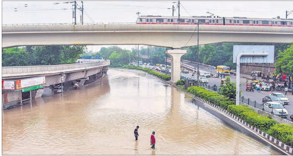
ନୂଆଦିଲ୍ଲୀସ୍ଥିତ ଆଇଏସ୍‌ପିଟି ନିକଟ ରାସ୍ତା ବନ୍ୟା ଜଳରେ ବୁଡ଼ିଯାଇଛି।

ଭଙ୍ଗାଳ/ନୂଆଦିଲ୍ଲୀ/ପ୍ୟାରିସ୍, ୧୫୭ (ପ୍ରକୃତି: ବୃତ୍ତୋପନ ମିଶ୍ର)