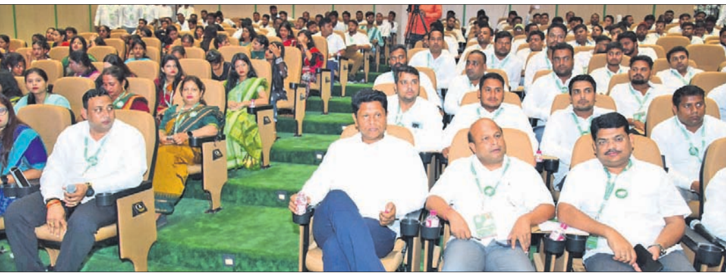
ଶଙ୍ଖଭବନଠାରେ ଶୁକ୍ରବାର ଅନୁଷ୍ଠିତ ବିଜୁ ଛାତ୍ର ଜନତା ଦଳର ରାଜ୍ୟସ୍ତରୀୟ କାର୍ଯ୍ୟକାରୀତା କମିଟି ବୈଠକରେ ଉପସ୍ଥିତ ନେତୃବୃନ୍ଦ।

ଭୁବନେଶ୍ୱର, ୧୪୬୭(ଅନିଲ ଦାସ) ଛାତ୍ରମାନେ ଦେଶର ଭବିଷ୍ୟତ। ଛାତ୍ରମାନଙ୍କୁ ସଶକ୍ତ କରିବା ପାଇଁ ରାଜ୍ୟ ସରକାର ଶିକ୍ଷା ଓ ଚାଲି ଉପରେ ଗୁରୁତ୍ୱ ଦେଉଛନ୍ତି। ଲୋକମାନଙ୍କୁ ଦୈନିକ କରିବା ପାଇଁ ବିରୋଧୀ ଦଳ ଅନେକ ଛାତ୍ର ସୃଷ୍ଟି କରୁଛନ୍ତି। ଭୁବନେଶ୍ୱରରେ ପ୍ରତିଷ୍ଠିତ କରିବାକୁ ସାମାଜିକ ଗଣମାଧ୍ୟମରେ ସକ୍ରିୟ ରହିବାକୁ ହେବ। ଏହାକୁ ପ୍ରତିଷ୍ଠିତ କରିବା ସହ ଲୋକମାନଙ୍କ ନିକଟରେ ପ୍ରକୃତ ସୂଚନା ପହଞ୍ଚାଇବାକୁ ବିଭିନ୍ନ ସଭାପତି ତଥା ପୁସ୍ତକାଳୟ ନବୀନ ପଢ଼ନାୟକ ଛାତ୍ରକର୍ମୀମାନଙ୍କୁ ପରାମର୍ଶ ଦେଇଛନ୍ତି।