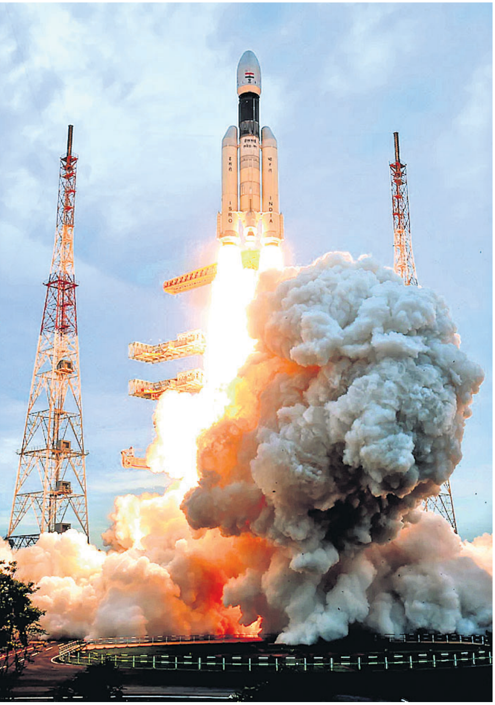
ଶ୍ରୀହରିକୋଟାସ୍ଥିତ ସତୀଶ ଧାଓନ ସେସ୍ ସେଣ୍ଟରରୁ ଏଲଜିଏସ୍-୩ ରକେଟ୍ ଜରିଆରେ 'ଚନ୍ଦ୍ରୟାନ-୩'ର ଉତ୍ତ୍ରେକ୍ଷେପଣ କରାଯାଇଛି।

ହୋଇଥିଲା। ମାଙ୍କ ଚିତା ସହ ଲଢ଼େଇ ବେଳ ଚେକ୍‌ସ୍ ଗୁରୁତର ଆଘାତ ପାଇଥିଲା, ଯେଉଁଥିରୁ ସେ ସ୍ୱଳ୍ପ ହେବା ସମ୍ଭବ ହୋଇ ନ ଥିଲା ବୋଲି ବ୍ୟବଚ୍ଛେଦ ରିପୋର୍ଟରୁ ଜଣାପଡ଼ିଥିଲା। ଗତ ମାର୍ଚ୍ଚ ୨୭ରେ ସାଣ୍ଟା ନାମକ ମାଙ୍କ ଚିତାର କିର୍ଦ୍ଦୀ ଖରାପ କାରଣରୁ ମୃତ୍ୟୁ ହୋଇଥିଲା। କାର୍ତ୍ତିଓ-ପୁଲମୋନାରି ଫେଲୋସ୍‌ର ଯୋଗୁ ଏପ୍ରିଲ ୨୩ରେ ଉଦୟ ପ୍ରାଣ ହରାଇଥିବାବେଳେ ମେ ୯ରେ ପୁରୁଷ ଚିତା ସହ ସଂଘର୍ଷ ଜାଣିବା ପାଇଁ ଉଦ୍ୟମ କରାଯାଉଥିବା ସମ୍ବନ୍ଧରେ ପ୍ରାଣ ହରାଇବାରେ ଏହା ଅଧିକ ତଥ୍ୟ ପ୍ରଦାନ କରିଥିଲା। ଗତ ୪ ମାସ ମଧ୍ୟରେ ପ୍ରାଣ ହରାଇବାରେ ଏହା ଅଧିକ ତଥ୍ୟ ପ୍ରଦାନ କରିଥିଲା। ଗତ ମଙ୍ଗଳବାର ଜାତୀୟ ପାର୍କରେ ତେଜସ୍ୱ ନାମକ ଅଣ୍ଡିରା ଚିତାର ମୃତ୍ୟୁ ଫ୍ରେସ୍‌ପ୍ୟା-୨