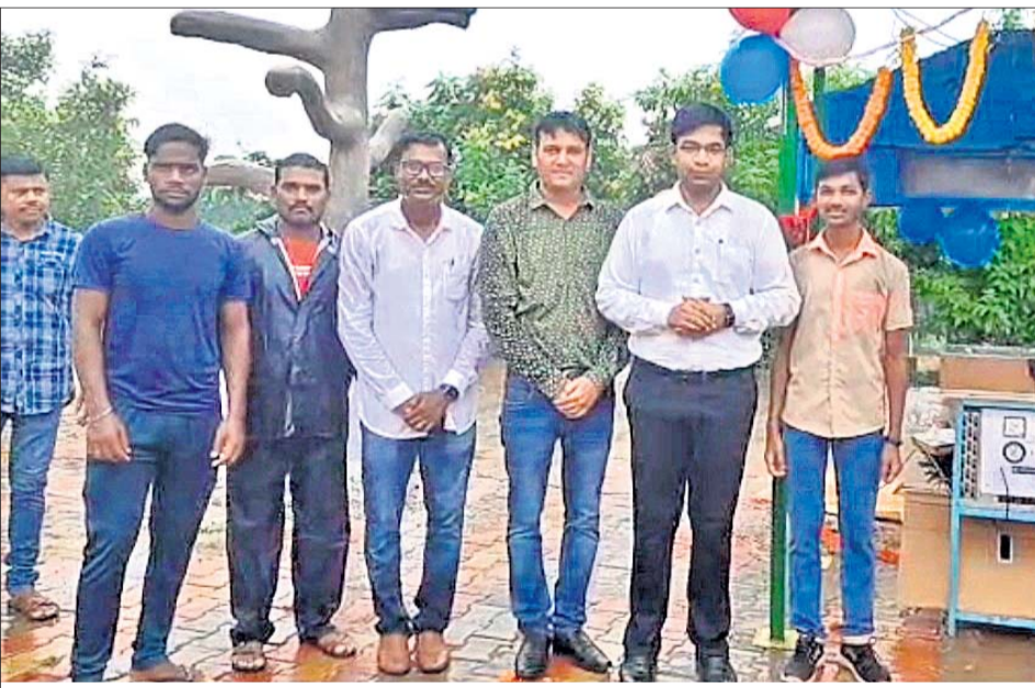
ସୋଲାର ଚାର୍ଜିଂ ଷ୍ଟେସନ ଉଦଘାଟନ କରାଯାଇଛି।

ଯାନର ଚାର୍ଜିଂ ପାଇଁ ହୋଇଥିବା ଷ୍ଟେସନ ନିର୍ମାଣକୁ ସେ ଭୂୟାସ ପ୍ରଂଶସା କରିଥିଲେ। ଏହି ଷ୍ଟେସନକୁ ଆଇଟିଆଇର ଶିକ୍ଷୟତ୍ରୀ ଶିକ୍ଷକଙ୍କ ତତ୍ତ୍ୱାବଧାନରେ ଛାତ୍ରାଛାତ୍ରୀମାନଙ୍କ ଦ୍ୱାରା ନିର୍ମାଣ କରାଯାଇଛି। ବ୍ରହ୍ମପୁର ଆଇଟିଆଇ ପ୍ରତିଷ୍ଠାତ୍ର ପ୍ରସିଦ୍ଧ ପଟ୍ଟନାୟକ କାର୍ଯ୍ୟକ୍ରମ ସଂଯୋଜନା କରିଥିଲେ।