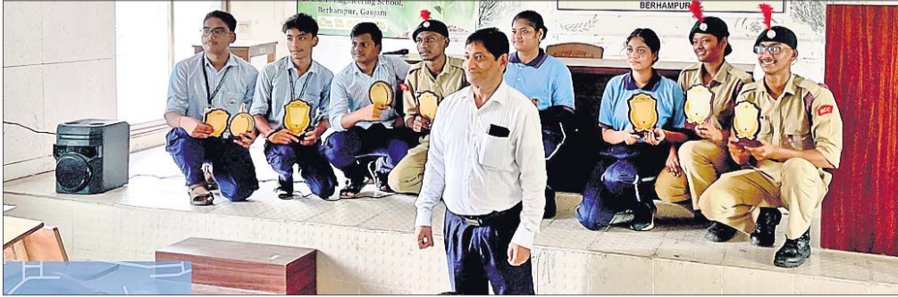
ଇଞ୍ଜିନିୟରିଂ ସ୍କୁଲରେ ବିଶ୍ୱ ଯୁବ ଦକ୍ଷତା କାର୍ଯ୍ୟକ୍ରମ।

ଆହୁରିକି ଶିକ୍ଷକ ଶିକ୍ଷୟତ୍ରୀ ସହଯୋଗ କରିଥିଲେ।