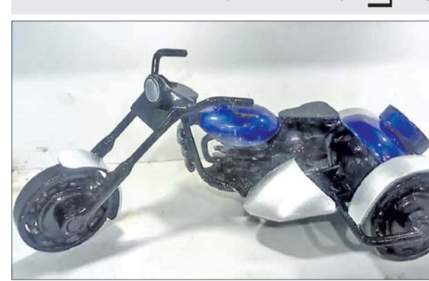
ଆଇଟିଆଇ ପକ୍ଷରୁ ପ୍ରସ୍ତୁତ କରାଯାଇଥିବା ଭିନ୍ନଚେତ ବାଇକ ମଡେଲ।

ଆଇଟିଆଇ ଅଧ୍ୟକ୍ଷ କହିଛନ୍ତି। ଆଇଟିଆଇ ଛାତ୍ରାଛାତ୍ରୀଙ୍କ ପକ୍ଷରୁ ନିର୍ମିତ ହୋଇଥିବା ଏହି ଭିନ୍ନଚେତ ମୋଟର ସାଇକେଲ ମଡେଲ ଘର ସାଜସଜ୍ଜା, ବିଭିନ୍ନ କାର୍ଯ୍ୟାଳୟ, ଇଞ୍ଜିନିୟର ତେକନୋଲୋଜିରେ ସାଜସଜ୍ଜା କ୍ଷେତ୍ରରେ ସହାୟକ ହେବ। ସୂଚନା ଥାଉ ଡି, ଆଇଟିଆଇର ବିଭିନ୍ନ ଗ୍ରେଡର ଛାତ୍ରାଛାତ୍ରୀମାନେ ଏହାକୁ ନିର୍ମାଣ କରିଛନ୍ତି।