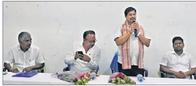
ପ୍ରସ୍ତୁତି ବୈଠକରେ ଯୋଗଦେଇଥିବା ବିଜେଟି କର୍ମକର୍ତ୍ତା ।