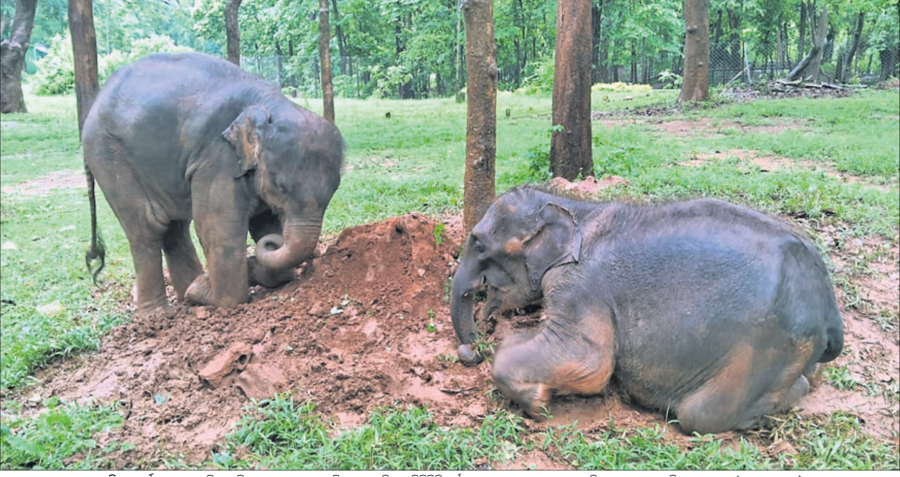
ଖୁସିର ମୁହୂର୍ତ୍ତ: ଦେଶୀୟ ଜିଲ୍ଲା କର୍ମଚାରୀ ପ୍ରାଣୀଖଣ୍ଡରେ ପରିସରରେ ଶନିବାର ଡିପ୍ରେସିଭ ବର୍ଷରେ ୨ ଜୁଆ ହାତୀ ଶାମା ଏବଂ ଶିବା କାବୁଅରେ ଖେଳିବାରେ ବ୍ୟସ୍ତ। (ଫଟୋ-ରଚନ)

କୋଲକାତା, ୧୫୭୭ ପୁଅକ୍ ହତ୍ୟା ମାମଲାରେ କାରାଦଣ୍ଡ ଭୋଗୁଛନ୍ତି