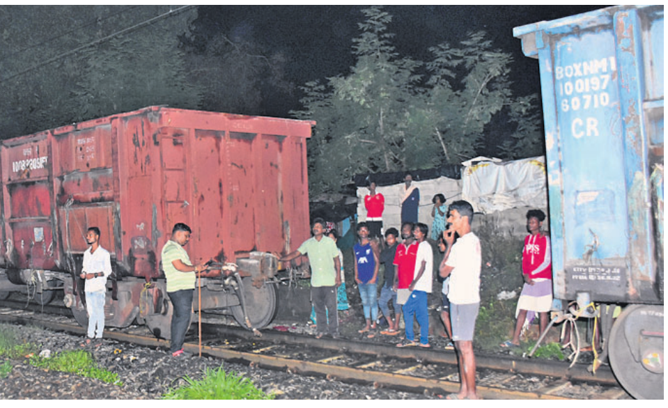
ଶନିବାର ସନ୍ଧ୍ୟାରେ ବାଣୀବିହାର ଷ୍ଟେଶନରେ ମାଲବାହୀ ଟ୍ରେନ୍‌ରୁ ଅଲଗା ହୋଇଥିବା ବର୍ତ୍ତି।