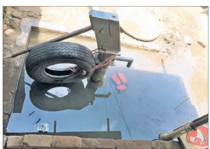
ନଳକୂପ ପରିସରରେ ଜମିଥିବା ଆବର୍ଜନା ପାଣି ।

ପାଣି ନିକଟରେ ଥିବା ଠାକୁରଙ୍କ ଚନ୍ଦନ ପୋଖରୀର ନବାବରଣ କାର୍ଯ୍ୟ ଯୋଗୁ ଏହି ନିଷାସନ ପଥ ମଧ୍ୟ ବନ୍ଦ ହୋଇ ଯାଇଛି । ଫଳରେ ନଳକୂପର ପାଣି ସହିତ ସଂପୃତି ବର୍ଷା ପାଣି ସେଠାରେ ଜମା ରହି ଦୃଷ୍ଟିତ ପରିବେଶ ସୃଷ୍ଟି କରିଛି । ସେଥିପାଇଁ ଲୋକେ ଉଚ୍ଚ ନଳକୂପରୁ ପାଣି ନେବା ପାଇଁ ଅନିଚ୍ଛା ପ୍ରକାଶ କରୁଛନ୍ତି । ବର୍ଷା ଋତୁ ଯୋଗୁ ନିକଟସ୍ଥ ମହାନଦୀର ପାଣି ଗୋଲିଆ ହୋଇଥିବାରୁ ଉଚ୍ଚ ନଳକୂପରୁ ପାନୀୟ ଜଳ ସଂଗ୍ରହ କରୁଥିବା ଜନସାଧାରଣ ନାନା ସମସ୍ୟା ମଧ୍ୟରେ ଗତି କରୁଛନ୍ତି । ତେବେ ନଳକୂପ ଚତୁର୍ଦ୍ଦିଗରେ ଜମି ରହିଥିବା ପାଣି ଓ ନର୍ଦ୍ଦମା ପାଣିକୁ ନିଷାସନ କରିବା ପାଇଁ ସାଧାରଣରେ ଦାବି ହେଉଛି । ତେବେ ଏ ସମ୍ପର୍କରେ କୌଣସି ସରପଞ୍ଚ ଶ୍ରୀଯୁକ୍ତାଗଣ ସହ ଯୋଗାଯୋଗ କରାଯାଇନାହିଁ । ଅଭିଯୋଗ ପରେ ଏ ଦିଗରେ ପଦକ୍ଷେପ ନେବା ପାଇଁ ଜଣେ ଖାର୍ଡ ସଭ୍ୟଙ୍କୁ ଦାୟିତ୍ୱ ଦିଆଯାଇଛି । ଖୁବ୍ଶୀଘ୍ର ସମସ୍ୟାର ସମାଧାନ ହେବ ବୋଲି ସେ ସୂଚନା ଦେଇଛନ୍ତି ।