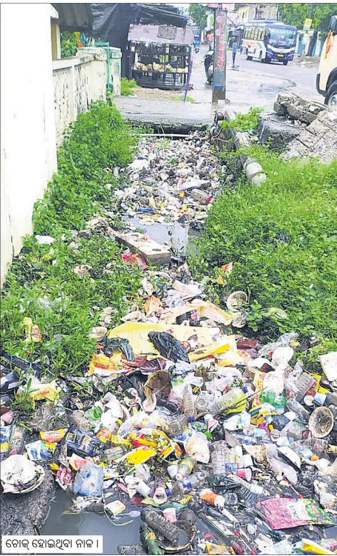
ଟୋକ୍ ହୋଇଥିବା ନାଳ ।

ନୟାଗଡ଼ ଭାଜପା ଜିଲ୍ଲା କାର୍ଯ୍ୟାଳୟ ସମ୍ମୁଖରେ ବଲାଙ୍ଗୀର-ଖୋର୍ଦ୍ଧା ୫୭ ନଂ. ଜାତୀୟ ରାଜପଥ କଡର ଟ୍ରେନ ଅଧା ସଫେଇ କରି ଛାଡି ଦେବା ପରେ ଟୋକ୍ ହୋଇ ରହିଛି । ଟ୍ରେନ କଳ ଟ୍ରେନରେ ନ ଯାଇ ରାସ୍ତା ଉପରେ ଦେଇ ୧୨୦. ଖାର୍ଡ ନୟାଗଡ଼ ବାଲିକା ଉଚ୍ଚ ବିଦ୍ୟାଳୟ ପଛ ପାଖରେ ଅଟକିଯାଇଛି । ଝିପି ଝିପି ବର୍ଷାରେ ଟ୍ରେନେକ କଳ ରାସ୍ତା ଉପରେ ଲହଡ଼ି ମାରିଲାଣି । ଜୋରରେ ବର୍ଷା ହେଲେ ଟ୍ରେନ କଳ ଘରେ ପଶିବ । ନାରଣ ଟ୍ରେନ ଠିକ୍ରେ ନିର୍ମାଣ ନ କରିବା ଓ ଟ୍ରେନକୁ ସଫେଇ କରାଯାଇ ନ ଥିବାରୁ ୧୨୦. ଖାର୍ଡରେ କୁଟ୍ରିମ ବନ୍ୟା ଭୟ ଲାଗି ରହିଛି । ଶୁକ୍ରବାର ରାତି ଓ ଶନିବାର ସକାଳ ବର୍ଷାରେ ପୁଣି ଭୟ ଆରମ୍ଭ ହୋଇ ଯାଇଛି ।