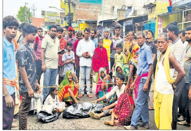
କ୍ଷତିପୂରଣ ଦାବିରେ ରାସ୍ତାରେ ମୃତଦେହ ରଖି ରାଜ୍ୟ ଲୋକେ ଆନ୍ଦୋଳନ କରୁଛନ୍ତି ।