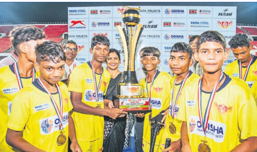
ଚୁପ୍ଟା ସହ ବାଳକ ବିଭାଗ ଚାମ୍ପିୟନ କ୍ରୁଡା ଦଳ।