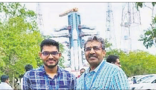
ନିଜ ସହଯୋଗୀଙ୍କ ସହ ଶୁଭାଶିଷ (ବାମ) ।