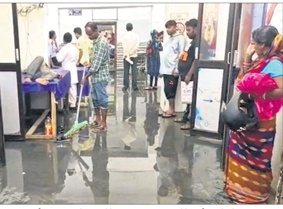
ଶନିବାର ଜଗାଣ ବର୍ଷା ଫଳରେ ଭଦ୍ରକ ଜିଲାର ମୁଖ୍ୟ ଚିକିତ୍ସାଳୟର ଆଉତରୋ ଓ ମେଡିସିନ ଖର୍ଚ୍ଚରେ ପାଣି ପଶିଯାଇଥିଲା। ଡ୍ରେନେଜ ବ୍ୟବସ୍ଥାରେ ତ୍ରୁଟି ଓ ଡ୍ରେନ୍ ସଫା ହୋଇ ନ ଥିବା କାରଣରୁ ଜଳ ନିଷ୍କାସନ ହୋଇ ନ ପାରି ଏପରି ସ୍ଥିତି ସୃଷ୍ଟି ହୋଇଛି।