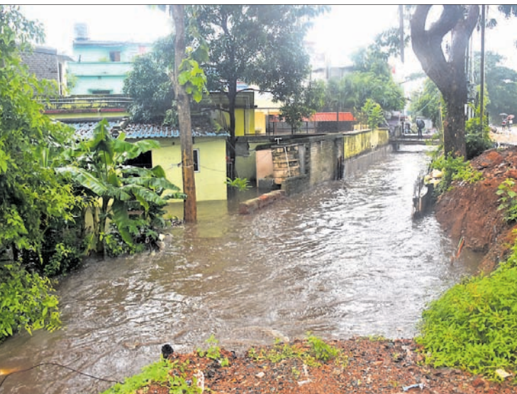
ଲକ୍ଷ୍ମୀସାଗର କେନାଲ ରୋଡ଼।