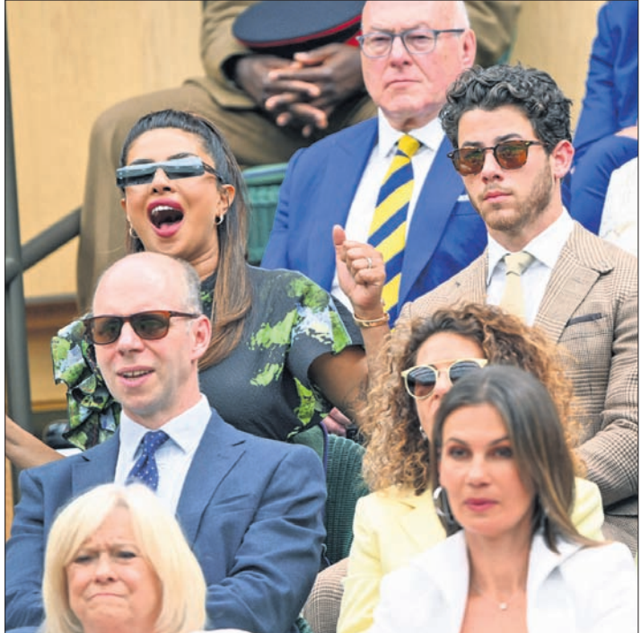
ଅଲ ଇଲଡ୍ କ୍ଲବର ଦର୍ଶକ ସ୍ତରରେ ପ୍ରସିଦ୍ଧା ଚୋପ୍ରା ଓ ନିକ୍ କୋବାସ୍କା

ସେ ଅଲ ଇଲଡ୍ କ୍ଲବରେ ଫାଇନାଲ ମ୍ୟାଚ୍ ଖେଳି ପରାଜିତ ହୋଇଛନ୍ତି। ଗତବର୍ଷ ଏଲିନା ରିବାକିନାକ୍ ଠାରୁ ହାରି ଯାଇଥିବା ବେଳେ ପ୍ରଥମ ଆରବ ମହିଳା ଭାବେ ଫାଇନାଲରେ ପ୍ରବେଶ କରିଥିବା ରଚିଛନ୍ତି। ତୃତୀୟ ଥର ପାଇଁ ଗ୍ରାଣ୍ଡସ୍ଲାମ ଫାଇନାଲରେ ପ୍ରବେଶ କରିଥିଲେ ମଧ୍ୟ ଗଜେଲ ହାସଲରେ ବିଫଳ ହୋଇଛନ୍ତି କାବେର। କ୍ରମାଗତ ଭାବେ