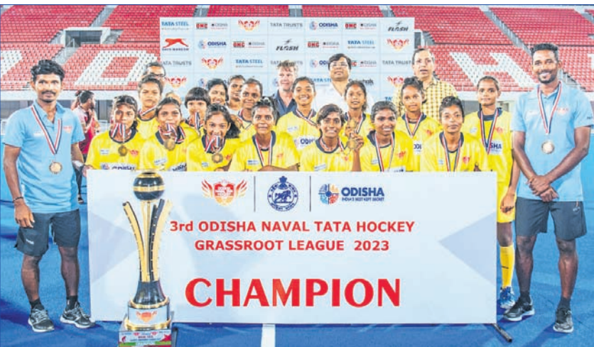
ଅତିଥିକ ସହ ବାଳିକା ବିଭାଗ ଚାମ୍ପିୟନ ଦଳ।