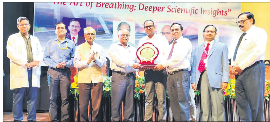
ପ୍ରତିଷ୍ଠା ଦିବସ ସମାରୋହରେ ଉପସ୍ଥିତ ଅତିଥି ।