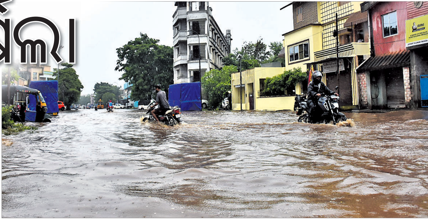
ପୁରୁଣା ଭୁବନେଶ୍ୱର ରୋସାରୋରେ ଛକରେ ବର୍ଷା ପାଣି ପୁଅ ହୁଏ।

ସାଙ୍ଗକୁ ଖରାପ ରାସ୍ତା ଲୋକଙ୍କ ଦୁର୍ଦ୍ଦଶାକୁ ଦ୍ୱିଗୁଣିତ କରିଥିଲା। କେବଳ ସେତିକି ନୁହେଁ, ସହରର ଅନ୍ୟତମ ପ୍ରମୁଖ ସ୍ଥାନ କୁହାଯାଉଥିବା କମିଶନରେଟ୍ ପୋଲିସ୍ ପୁଖ୍ୟାଳୟ ସମ୍ମୁଖରେ ମଧ୍ୟ ଆଶ୍ଚର୍ଯ୍ୟ ଉଚ୍ଚ ପାଣି ଜମା ହୋଇଥିଲା। ବଡ଼ କଥା ହେଉଛି ସେଠାରେ ବର୍ଷା ପାଣି ତ୍ରେନ୍‌କୁ ନ ଯାଇ ଓଲଟି ତ୍ରେନ୍ ପାଣି ରାସ୍ତା ଉପରକୁ ଉଠୁଥିଲା। ଯେଉଁ କାରଣରୁ ଲୋକମାନେ ଯାତାୟାତ କରିବାରେ ଅସୁବିଧାର ସମ୍ମୁଖୀନ ହୋଇଥିଲେ। ସେହିପରି ରସୁଲଗଡ଼, ବନିଖାଲ ରାସ୍ତାର ଅବସ୍ଥା ମଧ୍ୟ ସମାନ। ତ୍ରେନ୍‌କୁ ସମସ୍ୟାର ସ୍ଥାୟୀ ସମାଧାନ ହେଉ ନ ଥିବାରୁ ବର୍ଷା ସମୟ ଆସିଲେ ରାଜଧାନୀବାସୀ ଏଭଳି ଅସୁବିଧା ଭୋଗୁଛନ୍ତି। ତିରାଚିର ଉପରେ ଭଙ୍ଗା ମାଟିର ସମ୍ମୁଖରେ ମଧ୍ୟ ବର୍ଷା ପାଣି ଲହଡ଼ି ଭାଙ୍ଗିଥିଲା। ସକାଳୁ ଆରମ୍ଭ ହୋଇଥିବା ବର୍ଷାରେ