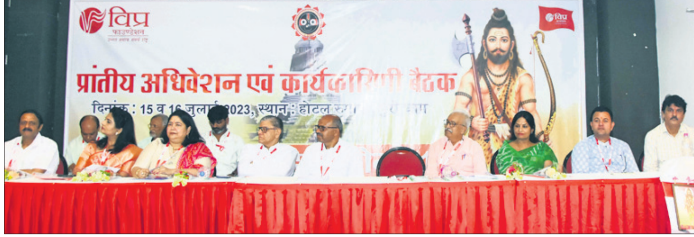
ପୁରୀସ୍ଥିତ ଏକ ହୋଟେଲରେ ଶନିବାର ବିଶ୍ୱ ଫାଉଣ୍ଡେଶନର ପ୍ରାଦେଶିକ ସମ୍ମିଳନୀରେ ଉପସ୍ଥିତ ଅତିଥିମାନେ ।

ସାଥୀଙ୍କ ସହ ସେ ଏକ ରୁମ୍ରେ ଶୋଇଥିବା ସମୟରେ, ଅଭିଯୁକ୍ତ ଏବଂ ତାଙ୍କ ଜଣେ ସହଯୋଗୀ ଘରେ ପଶି ମୋବାଇଲ ଫୋନ୍ ଚୋରି କରି ଘଟଣାସ୍ଥଳକୁ ଖସିଯିବା ଲାଗି ଉଦ୍ୟମ କରିବା ବେଳେ ଅଭିଯୁକ୍ତ ପୂର୍ଣ୍ଣ ଛାତ୍ର ଉପରୁ ତଳେ ପଡ଼ିଯାଇଥିଲେ । ତଳେ ପଡ଼ିଯିବା କାରଣରୁ ଅଭିଯୁକ୍ତ ଗୁରୁତର ଆହତ ହୋଇଥିଲେ । ଏହି ସମୟରେ ଅଭିଯୋଗକାରୀ ଏବଂ ଅନ୍ୟ ସାଥୀମାନେ ତାଙ୍କୁ କାହାଣୀ ପିସିଆର ସହାୟତାରେ ଥାନା ଜିନା ଦେବା ସହ ଅଭିଯୁକ୍ତଙ୍କ ବିରୁଦ୍ଧରେ ଲିଖିତ ଜଣକ ମୁଦାବର ଆଇନଗତ ଆଠରେ ଅଭିଯୋଗ କରିଥିଲେ । ତେବେ ଏହି ଗାଳିଥିବା ଏକ କନଷ୍ଟ୍ରେସନ ସାଇଟରେ କାମ କରନ୍ତି । ଶୁକ୍ରବାର ରାତିରେ ଅନ୍ୟ