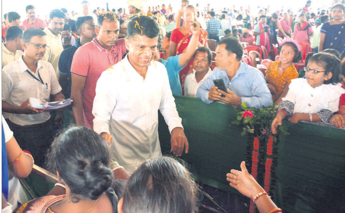
ଲୋକକୁ ଭେଟୁଛନ୍ତି ୫-ଟି ସଚିବ ଉ.କେ.ପାଣ୍ଡିଆନ୍ ।