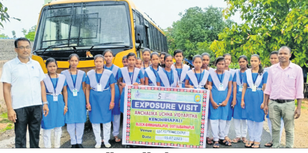
ଏକପୋକର ଭିତରରେ କେନଟ୍ରିଆପାଲି ହାଇସ୍କୁଲର ଛାତ୍ରମାନେ ।

ଅମରପାଲି, ୧୬୭୭ (ପାଟାୟର ସାହୁ) ସୁବର୍ଣ୍ଣପୁର ଜିଲ୍ଲା ବାରମହାରାଜପୁର ବ୍ଲକ୍ ଅନ୍ତର୍ଗତ କେନଟ୍ରିଆପାଲି ହାଇସ୍କୁଲ ଛାତ୍ରମାନଙ୍କୁ ନେଇ ଏକପୋକର ଭିତର କରାଯାଇଛି । ସ୍କୁଲର ପ୍ରାୟ ୪୫ଜଣ ଛାତ୍ରୀ ସୋନପୁର ସରକାରୀ ପଲିଟେକନିକ୍ କଲେଜକୁ ଯାଇ ବିଶ୍ୱ ଦକ୍ଷତା ଦିବସ ପାଇଁ ଅବସରରେ ହେଉଥିବା କାର୍ଯ୍ୟକ୍ରମରେ ଅଂଶଗ୍ରହଣ କରିଥିଲେ ।