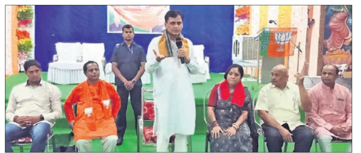
ବୌଦ୍ଧ ଚାଉଳହଲରେ କେନ୍ଦ୍ର ଗୃହ ରାଷ୍ଟ୍ରମନ୍ତ୍ରୀ ଦକ୍ଷୀଣ ନେତାଙ୍କୁ ଉଦ୍‌ବୋଧନ ଦେଉଛନ୍ତି ।