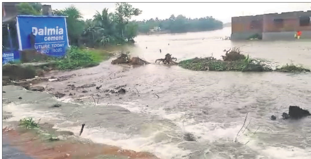
ତରିବୁଦଠାରେ ସୃଷ୍ଟି ହୋଇଥିବା ଘାଇ।

ବିନାଗାଠାରୁ ଜଗତସିଂହପୁର ଦେଇ ଲମ୍ବିଥିବା ମାଛଗାଁ କେନାଲ ତରିବୁଦ ଓ ଦଲେଇଘାଟ ନିକଟରେ ଯଥାକ୍ରମେ ୨୦ ଓ ୧୫ ଫୁଟର ଘାଇ ହୋଇଛି। ଫଳରେ ଜଗତସିଂହପୁର-କନ୍ଦରପୁର ୫୫ ନଂ ଜାତୀୟ ରାଜପଥରେ ୩ ଫୁଟ ଉଚ୍ଚରେ ଜଳ ପ୍ରବାହିତ ହେବା ସହ ପାଖାପାଖି ୧ ଘଣ୍ଟା ପର୍ଯ୍ୟନ୍ତ ଗମନାଗମନ ଠିକ୍ ହୋଇ ଯାଇଥିଲା। କେବଳ ଏତିକି ନୁହେଁ, ଏହା ଏକ କୃତ୍ରିମ ବନ୍ୟା ପରିସ୍ଥିତି ସୃଷ୍ଟି କରିଛି। ତରିବୁଦ ବନ୍ଦର ଅଧିକାଂଶ ଦୋକାନରେ ପାଣି ପଶିଯାଇଛି। ଫଳରେ ବ୍ୟାପକ କ୍ଷୟକ୍ଷତି ହୋଇଛି। ସେହିପରି ତରିବୁଦ ପାଣି, ସାନ୍ଧ୍ୟ କେନ୍ଦ୍ର ଓ ଲୋକଙ୍କ ଘରେ ପାଣି ପଶିବା ସହ ଶତାଧିକ ହେକ୍ଟର ଜମି ଜଳାଶୁନ୍ନ ହୋଇଯାଇଛି। ଏବେଲେ କ୍ଷତିପୂରଣ ଦାବିରେ ତରିବୁଦ ବନ୍ଦରର ବ୍ୟବସାୟୀମାନେ ଆନ୍ଦୋଳନ କରିଛନ୍ତି।