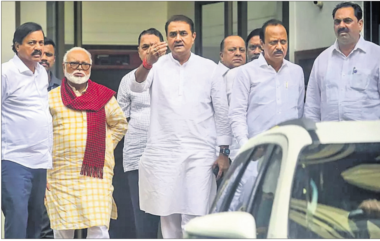
ଏନସିପି ଅଧ୍ୟକ୍ଷ ଶରଦ୍ ପାଞ୍ଚାମାଳୀଙ୍କୁ ଭେଟି ଫେରୁଛନ୍ତି ବିଦ୍ରୋହୀ ନେତା ଛଗନ ଭୁଜବଳ, ପ୍ରମୁଖ ପତେଲ, ଅଜିତ ପାଞ୍ଚାମାଳୀ ଓ ଅନ୍ୟମାନେ।

ଏନସିପିରେ ବିଦ୍ରୋହ ପରେ ମହାରାଷ୍ଟ୍ର ଉପମୁଖ୍ୟମନ୍ତ୍ରୀ ଅଜିତ ପାଞ୍ଚାମାଳୀ ଏକ ଆଶ୍ଚର୍ଯ୍ୟ ଘଟଣାକ୍ରମରେ ଦଳର ଅଧ୍ୟକ୍ଷ ଶରଦ୍ ପାଞ୍ଚାମାଳୀ ଉପସାହାୟ ଭେଟିଲେ। ତାଙ୍କ ସହ ପ୍ରମୁଖ ପତେଲ, ଛଗନ ଭୁଜବଳ ଓ ଅନ୍ୟ ଏନସିପି ମନ୍ତ୍ରୀମାନେ ପାଞ୍ଚାମାଳୀଙ୍କୁ ମୁମ୍ବାଇରେ ଫୁଲିଲେ। ତତକ୍ଷଣାତ୍ ସେ ଗୋଷ୍ଠୀରେ ଭେଟିଲେ। ବିଦ୍ରୋହ ପରେ ଶରଦ୍ ପାଞ୍ଚାମାଳୀ ଏବଂ ଅଜିତ ପାଞ୍ଚାମାଳୀ ଗୋଷ୍ଠୀ ମଧ୍ୟରେ ଏହା ପ୍ରଥମ ସାକ୍ଷାତ୍। ଅଜିତଙ୍କ ନେତୃତ୍ୱରେ ଏନସିପିର ୮ ଜଣ ବିଧାୟକ ଶରଦ୍ ପାଞ୍ଚାମାଳୀଙ୍କ ବିରୋଧରେ ବିଦ୍ରୋହ କରି ଜୁଲାଇ ୨ରେ ଏକନାଥ ଶିନ୍ଦେ ସରକାରରେ ସାମିଲ ହୋଇଥିଲେ। ମହାରାଷ୍ଟ୍ର ବିଧାନସଭାରେ ମୋଦିଙ୍କୁ ଅଧିବେଶନର ଦିନକୁ ପୂର୍ବରୁ ଦିନା ଆପ-ଏକ୍ସପ୍ରେସରେ ଅଜିତ ଗୋଷ୍ଠୀ ପାଞ୍ଚାମାଳୀଙ୍କୁ ଭେଟିଲେ। ଏନସିପି ଅଧ୍ୟକ୍ଷଙ୍କ ଆଶୀର୍ବାଦ ନେବା ପାଇଁ ଆସିଥିଲେ। ଏନସିପିକୁ ଏକାଠି ରଖିବା ପାଇଁ ଆମେ ତାଙ୍କୁ ନିବେଦନ କରିଛୁ ବୋଲି ପ୍ରମୁଖ ପତେଲ କହିଛନ୍ତି। ଶରଦ୍ ପାଞ୍ଚାମାଳୀ ଦଳର ନେତା ହୋଇଥିବାରୁ ଅଜିତ ଗୋଷ୍ଠୀ ତାଙ୍କୁ ଭେଟିବାକୁ ଯାଇଥିଲେ। ତେବେ କୌଣସି ବଡ଼ ଚଳା ଛାଳି ନ ଥିବା ଭାବରେ ନେତା ତଥା ଉପମୁଖ୍ୟମନ୍ତ୍ରୀ ଦେବେନ୍ଦ୍ର ଫଡ଼ନବିସ କହିଛନ୍ତି।