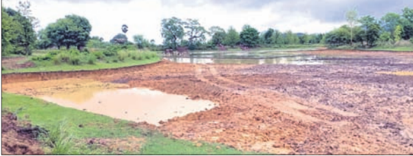
କିନରକେଲା ଗ୍ରାମର କେନ୍ଦୁକଟା ପୋଖରୀ।