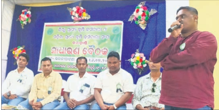
ବୈଠକରେ ଉପସ୍ଥିତ ଜିଲ୍ଲା ଗ୍ରାମ୍ୟ କୃଷି କର୍ମଚାରୀ ସଂଘ କର୍ମଚାରୀ।

କଳାହାଣ୍ଡି ଜିଲ୍ଲା ଭବାନୀପାଟଣା ଅମଳା ଭନଠାରେ ଜିଲ୍ଲା ଗ୍ରାମ୍ୟ କୃଷି କର୍ମଚାରୀ ଓ ମହିଳା ଗ୍ରାମ୍ୟ କୃଷି କର୍ମଚାରୀ ସଂଘ ପକ୍ଷରୁ ଏକ ସାଧାରଣ ବୈଠକ ଅନୁଷ୍ଠିତ ହୋଇଯାଇଛି। ସରକାର ନ୍ୟାୟୋଚିତ ଦାବି ପୂରଣରେ ଅଥବା କାଳକ୍ଷେପଣ ଓ ପାତରାଧର ନ କରି ଆଲୋଚନା ମାଧ୍ୟମରେ ଦାବି ପୂରଣ ନ ହେବ ଆସନ୍ତା ୧ ଚାରିଖରୁ ଅନିର୍ଦ୍ଦିଷ୍ଟକାଳ ଯାଏଁ ଆନ୍ଦୋଳନ କରାଯିବ ବୋଲି କର୍ମକର୍ତ୍ତାମାନେ ସରକାରଙ୍କୁ ଜଣାଇ ଦେଇଛନ୍ତି। ଗ୍ରାମ୍ୟ କୃଷି କର୍ମଚାରୀମାନଙ୍କ ରାଜିବରେ ଯୋଗଦେବାର ମୂଳ ଶିକ୍ଷାଗତ ଯୋଗ୍ୟତା ଇଞ୍ଜନିୟରୀ ଯାକ୍ତ ବଦଳରେ ଯାକ୍ତ ଡିଗ୍ରୀ ରଖିବା, ଗ୍ରାମ୍ୟ କୃଷି କର୍ମଚାରୀ ସଦସ୍ୟର ନାମ ପରିବର୍ତ୍ତନ କରିବା, ଗ୍ରେଡ୍ ପେ ୨୦୦୦ ଟଙ୍କାରୁ ୪୨୦୦ ଟଙ୍କାକୁ ବୃଦ୍ଧି, ଚାକିରି କାଳ ମଧ୍ୟରେ ସର୍ବନିମ୍ନ ୩ଟି ପଦୋତ୍ତରଣ ଦେବା ଓ ସର୍ବୋପରି ବନ୍ଧୁ ପ୍ରତ୍ୟାଶିତ କ୍ୟାଡର ପୁନର୍ଗଠନ ପ୍ରଭୃତି ପ୍ରମୁଖ ଦାବି ସମେତ ୬ ବର୍ଷିକା ନିରୀକ୍ଷିତ ସମୟକୁ ମୂଳ ରାଜିବରେ ଗଣନା କରି ୬ଟି ନ୍ୟାଶନାଲ ଇଞ୍ଜିନିୟରୀ ପ୍ରଦାନ କରିବା ଆଦି ଦାବିକୁ ନେଇ ରାଜ୍ୟ ସରକାର, କୃଷି ବିଭାଗକୁ ବାରମ୍ବାର ନିବେଦନ କରାଯାଇଛି। କିନ୍ତୁ ଦୁଃଖ ଓ ଦୁର୍ଭାଗ୍ୟର