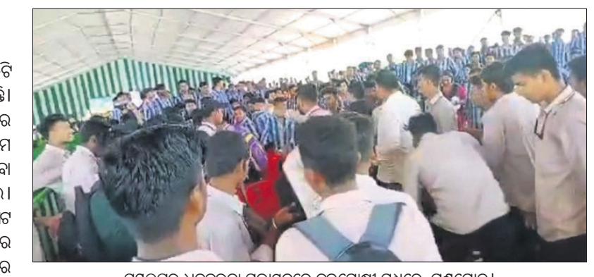
ସମ୍ବଲପୁର ଧନକଉଡ଼ା ସଭାସଭାରେ ବୁଇକଣ ଗୋଷ୍ଠୀ ମଧ୍ୟରେ ଗଣତୋଳ।