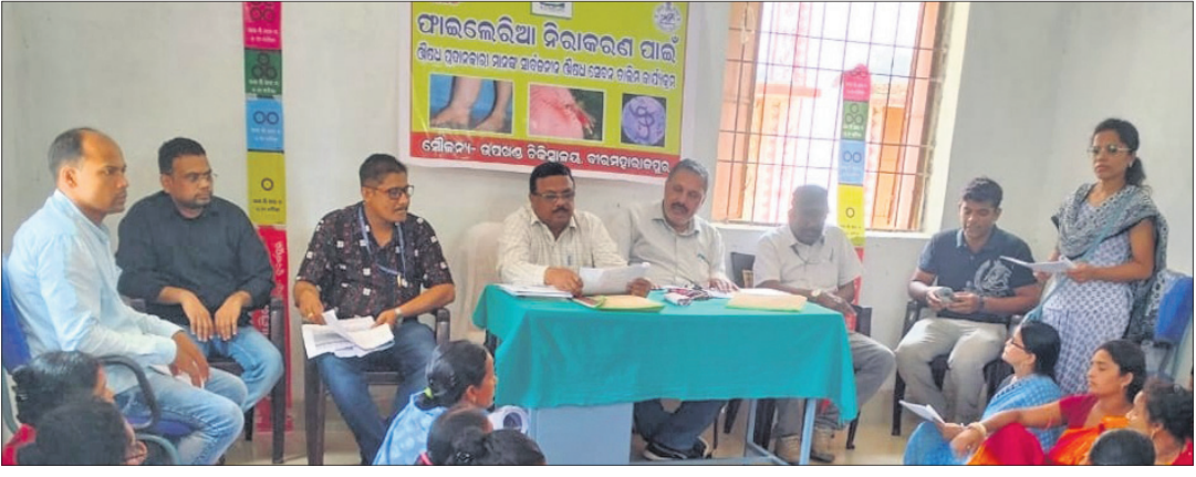
ଆଶାକର୍ମୀମାନଙ୍କୁ ତାଲିମ ଦେଉଛନ୍ତି ।