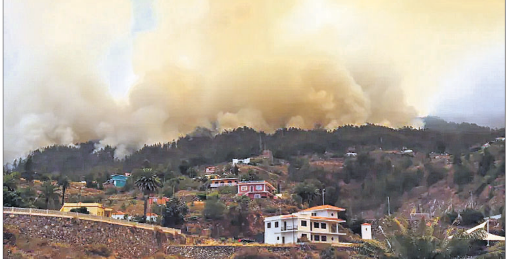
ସ୍ୱେନ୍ କାନାରି ଆଇଲ୍ୟାଣ୍ଡର ଲା ପାଲମାରେ ବନାଗ୍ନି ଯୋଗୁଁ ତିକାରାଫୋର୍ ସହର ଧୂଆଁମୟ ହୋଇଯାଇଛି। ତୁରନ୍ତ ପୁରୁଣିତ ସ୍ଥାନକୁ ନିଆଯାଇଥିଲା। ଜଙ୍ଗଲ ନିଆଁରେ ୧୩ ଘର ପୋଡ଼ିଯାଇଥିବାବେଳେ ପାଖାପାଖି ୪,୦୪୦ ହେକ୍ଟର (୧୧,୪୯୦ ଏକର) ଖେତରୁ ନିଆଁ ଲାଗି ଯାଇଛି।

ସ୍ୱେନ୍ କାନାରି ଆଇଲ୍ୟାଣ୍ଡର ଲା ପାଲମାରେ ବନାଗ୍ନି ସ୍ଥିତି ଅଣାୟତ୍ତ ହେବାରେ ଲାଗିଛି। ପୁରୁଣାକୁ ଦୃଷ୍ଟିରେ ରଖି ସ୍ଥାନାନ୍ତର ଅଞ୍ଚଳକୁ ପାଖାପାଖି ୪୦୦୦ ଲୋକଙ୍କୁ ସ୍ଥାନାନ୍ତର କରାଗଲାଣି। ଲାପାଲମାରେ ସମାନ ସ୍ଥିତି ଲାଗି ରହୁଥିବାରୁ ସ୍ଥାନାନ୍ତର ଶୀଘ୍ର ଉପାଦାନ ବାଧାପ୍ରାପ୍ତ ହୋଇଛି। ଶନିବାର ସକାଳେ ଆଇଲ୍ୟାଣ୍ଡର ଉତ୍ତରାଞ୍ଚଳର ଏଲ୍ ପିନାର ଅଞ୍ଚଳର ଜଙ୍ଗଲରେ ପ୍ରଥମେ ନିଆଁ ଲାଗିଥିଲା। କମ୍ ସମୟରେ ନିଆଁ ଦ୍ରୁତ ବେଗରେ ବ୍ୟାପିବାକୁ ନେଇ ନିକଟସ୍ଥ ଗ୍ରାମ ପୁଣ୍ୟଗୋର୍ଡ଼ ଏବଂ ତିକାରାଫୋର୍ ଲୋକଙ୍କୁ ସ୍ଥାନାନ୍ତର କରାଯାଇଥିଲା।