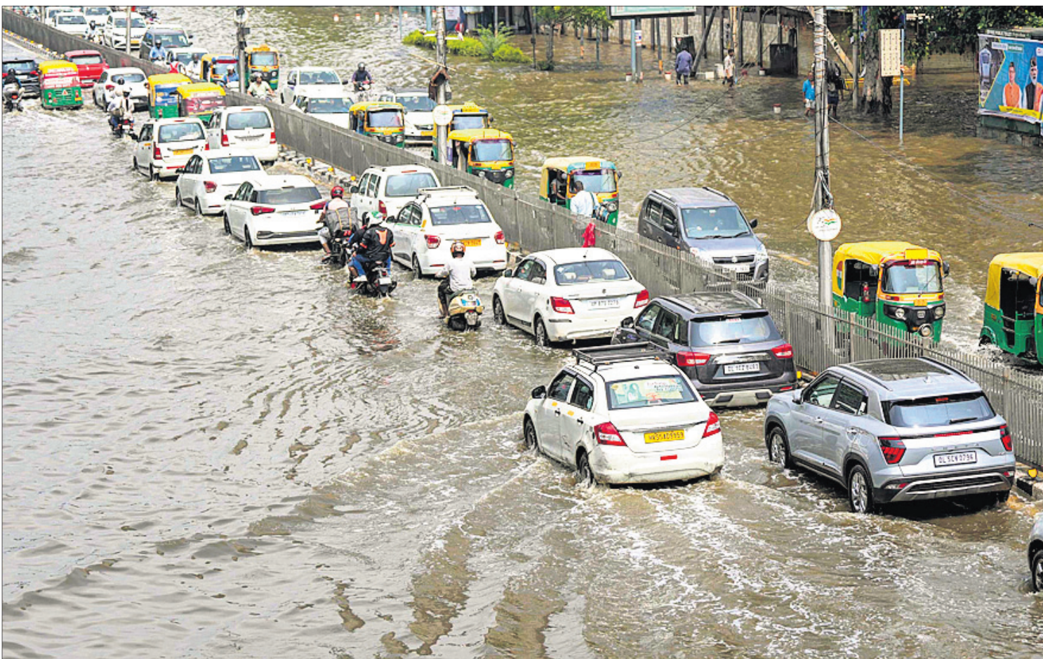
ନୂଆଦିଲ୍ଲୀରେ ଯମୁନା ନଦୀର ଉଚ୍ଚଳା ପାଣି ରାସ୍ତାରେ ଲହଡ଼ି ମାରୁଥିବାବେଳେ ଗାଡ଼ିଗୁଡ଼ିକ ପାଇଁ ଯାତାୟାତରେ ସମସ୍ୟା ସୃଷ୍ଟି ହୋଇଛି।

୨୧ ଯାଏ ବର୍ଷା ଆଜି ୮ ଜିଲ୍ଲାରେ ଘଡ଼ଘଡ଼ି ସହ ପ୍ରବଳ ବର୍ଷା ସମ୍ଭାବନା ଭୁବନେଶ୍ୱର, ୧୬୭୭ (ଅନୁରାଧା ମହାରଣା) ଓଡ଼ିଶା ସଂଲଗ୍ନ ଉତ୍ତର ପଶ୍ଚିମ ବଙ୍ଗୋପସାଗରରେ ସୃଷ୍ଟି ହୋଇଥିବା ଯୁକ୍ତିବଳୟ ପ୍ରଭାବରେ ରାଜ୍ୟରେ ବର୍ଷା ଜାରି ରହିଛି। ରବିବାର ବୌଦ୍ଧ ଜିଲ୍ଲାରେ ସର୍ବାଧିକ ୫୪.୦ ମିମି ବର୍ଷା ହୋଇଥିବାବେଳେ ରାଉରକେଲାରେ ୩୨.୧ ମିମି, ନୂଆପଡ଼ା ୩୦.୪ ମିମି, ସୋନପୁର ୨୮.୮ ମିମି ଓ ରାୟଗଡ଼ାରେ ୨୧.୮ ମିମି ବର୍ଷା ରେକର୍ଡ କରାଯାଇଛି। ତେବେ ଆସନ୍ତା ୨୧ ତାରିଖ ଯାଏ ସାରା ରାଜ୍ୟରେ ଝିପିଝିପି ବର୍ଷା ଲାଗି ରହିବା ସହ କେତେକ ସ୍ଥାନରେ ପ୍ରବଳ ବର୍ଷା ହେବ ବୋଲି ଆଞ୍ଚଳିକ ପାଣିପାଗ ବିଜ୍ଞାନ କେନ୍ଦ୍ର ପକ୍ଷରୁ ପୂର୍ବାନୁମାନ କରାଯାଇଛି। ସୋମବାର ସୁନ୍ଦରଗଡ଼, ଝାରସୁଗୁଡ଼ା, ସମ୍ବଲପୁର, ବରଗଡ଼, ନୂଆପଡ଼ା, ସୋନପୁର, ବଲାଙ୍ଗୀର ଓ ବେବଗଡ଼ ଆଦି ୮ ଜିଲ୍ଲାରେ ଘଡ଼ଘଡ଼ି ସହ ପ୍ରବଳରୁ ଅତି ପ୍ରବଳ ବର୍ଷା ୧୧ ପୃଷ୍ଠା-୪ ଆଜିର ସମ୍ବାଦକାରୀ ଆୟ ରହିର୍ତ୍ତୁ