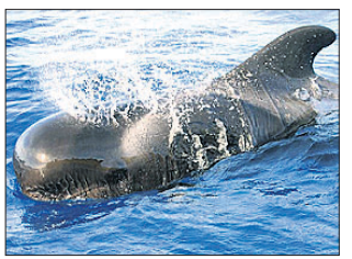
୭୮ ଲକ୍ଷ ତୋଟା ଥିବା ପାଇଲଟ୍ ଡିମି ଓସନିକ ତଳପିନ୍ଦର ଏକ ପ୍ରକାରି।

ଫାରୋ ଆଇଲ୍ୟାଣ୍ଡସ୍‌ର ରାଜଧାନୀ ଗୋର୍ଲାଭନ ନିକଟରେ ଯାତ୍ରୀମାନଙ୍କ ସମ୍ମୁଖରେ ୭୮ ଡିମି ପାଇଲଟ୍ ଡିମିଙ୍କୁ ନିର୍ମମ ଭାବେ ହତ୍ୟା କରାଯାଇଛି। ଏହାପାଇଁ କୁଳ୍ କାହାକ ପକ୍ଷରୁ ରବିବାର ଯାତ୍ରୀମାନଙ୍କୁ କ୍ଷମା ମଗାଯାଇଛି। ଫାରୋ ଆଇଲ୍ୟାଣ୍ଡସ୍‌ରେ ପାଇଲଟ୍ ଡିମି ଶିକାର ବହୁତ ପସନ୍ଦ କରାଯାଏ। ତେବେ ଗତ ୯ ତାରିଖରେ ହଜାର ହଜାର ଯାତ୍ରୀଙ୍କ ଆଗରେ ଏତେ ସଂଖ୍ୟାରେ ଡିମିଙ୍କୁ ମାରିଦିଆଯିବା ସେମାନଙ୍କୁ ବ୍ୟତୀତ ଓ ଭୟଭୀତ କରିଥିଲା। ଫାରୋ ଆଇଲ୍ୟାଣ୍ଡସ୍‌ରେ କାହାକି ଅତି ରହିଥିବାବେଳେ ଗୋଟିଏ ଗ୍ରୁପ୍ ସେମାନଙ୍କ ନିୟମିତ ଡିମି ଶିକାରରେ ସାମିଲ ଥିଲେ। ବ୍ରିଟିଶ୍ କ୍ଲବ୍ ଶିକାର ଅପରେଟର ଟୁଡର ଯୋଗେ ଯାତ୍ରୀଙ୍କୁ କ୍ଷମା ମାଗିଛନ୍ତି।