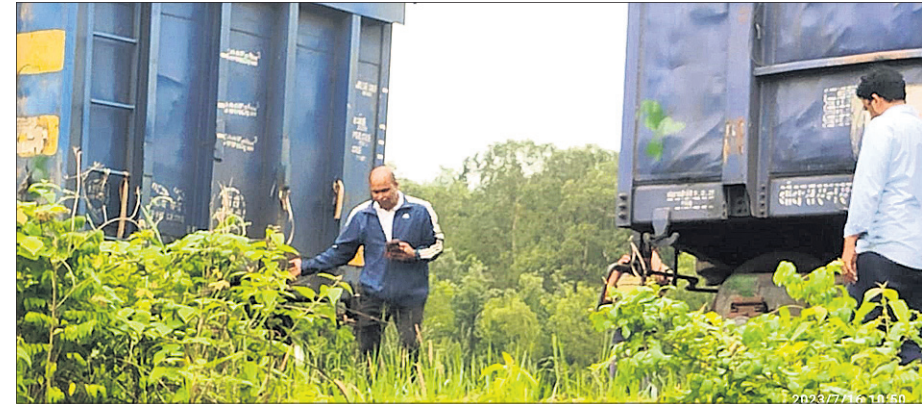
ମାଲବାହୀ ଟ୍ରେନରୁ ଅଲଗା ହୋଇଯାଇଥିବା ବଗି।

ନନ୍ଦପୁର, ୧୬୭୭(ଶଙ୍କର ପୂଜାରୀ) କୋରାପୁଟ ଜିଲ୍ଲା ନନ୍ଦପୁର ବ୍ଲକ୍ ଦେଇ ଯାଇଥିବା ବିଶାଖାପାଟଣା-କିରାଣ୍ଡଲ ରେଳ ଧାରଣୀରେ ପୁଣି ରେଳଖିନି ବଗିକୁ ଛାଡି ଚାଲିଯିବା ପରି ଘଟଣା ଦେଖିବାକୁ ମିଳିଛି। ରବିବାର ପୂର୍ବାହ୍ନ ୯ଟାରେ ପାଠୁଆ ଷ୍ଟେଶନ ନିକଟରେ ବିଶାଖାପାଟଣା ଯାଉଥିବା ଏକ ମାଲବାହୀ ଟ୍ରେନର ଇଞ୍ଜିନ ବଗିକୁ ଛାଡି ପ୍ରାୟ ୨୫୫ ମିଟର ଦୂରକୁ ଚାଲିଯାଇଥିଲା। ଟ୍ରେନର ଗାଡ଼ି ଓ ଲୋକୋ ପାଇଲଟଙ୍କ ଉପସ୍ଥିତ ବୁଝି ଯୋଗୁ ଧାର ଗତିରେ ଗଡ଼ିଯାଉଥିବା ଏହି ମାଲବାହୀ ଟ୍ରେନକୁ ଅଟକାଇ ବଗିଗୁଡ଼ିକର ପୁନଃ ସଂଯୋଗ କରାଯାଇଥିଲା। ପରେ ଏହା ଗଡ଼ିବେ ଛାଡି ଯାତ୍ରା କରିଥିଲା। ଅନ୍ୟପକ୍ଷରେ ଗତ ମାସକ ମଧ୍ୟରେ ଇଞ୍ଜିନ-ବଗି ଅଲଗା ହେବାପରି ଏକାଧିକ ଘଟଣା ଘଟିଲାଣି। ପୂର୍ବରୁ ବାଲିପୁଟ ଓ ମାଛକୁଣ୍ଡ ଷ୍ଟେଶନରେ ସମାନ ଘଟଣା ଘଟିଥିଲା। ତେବେ ଏନେଇ କୌଣସି ଅଘଟଣ ଘଟି ନ ଥିବା କିମ୍ପା କିଛି ବଡ଼ଧରଣର କ୍ଷତି ହୋଇ ନ ଥିବା ବେଳେ ବିଭାଗ ପକ୍ଷରୁ କୁହାଯାଇଛି। ଏବେ ରେଳଧାରଣାଗୁଡ଼ିକର ୧୧ ପୃଷ୍ଠା-୪