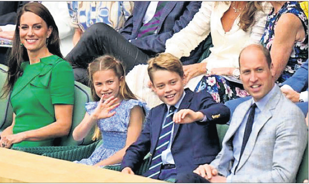
ଫ୍ରିଲେଣ୍ଡସ୍‌ ଉପଲକ୍ଷେ ଉପସାହାୟକ ପରିବାର ପରିବାରକର୍ମୀଙ୍କ ସହ ପୁରୁଷ ସିଙ୍ଗଲ୍ ପାଇନାଲ ଉପଭୋଗ କରୁଛନ୍ତି ଫ୍ରେଣ୍ଡ୍ ପ୍ରିଭେଟ୍ କମ୍ପାନିର ଓ ପ୍ରିଭ୍ ଫ୍ରିଲେଣ୍ଡସ୍ ।