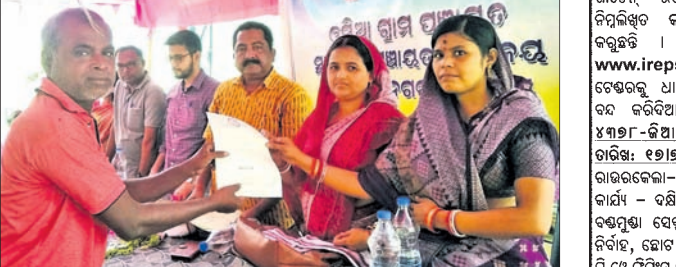
ଅଭିଯୋଗପତ୍ରକୁ ପ୍ରଶାସନିକ ଅଧିକାରୀ ଓ ଅଧ୍ୟକ୍ଷମାନେ ଗ୍ରହଣ କରୁଛନ୍ତି।

ରାଜନଗର, ୧୭୭୭ (ଭାସ୍କର ରାଉତରାୟ): ରାଜନଗର କୁଳ ଓଡ଼ିଆ ପଞ୍ଚାୟତ କାର୍ଯ୍ୟାଳୟ ପରିସରରେ ପଢ଼ାରେ ପ୍ରଶାସନ କାର୍ଯ୍ୟକ୍ରମ ଯୋଜନା ଅନୁଷ୍ଠିତ ହୋଇଛି।