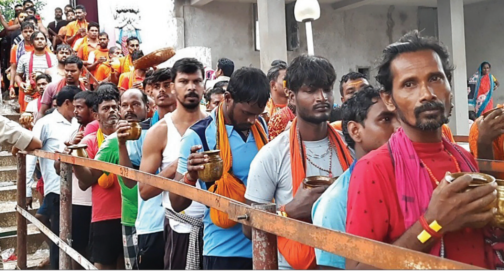
ଶରଣକୁଳରେ କାଉଡ଼ିଆମାନେ ଲଢ଼ୁବାବାଙ୍କୁ ଜଳ ଲାଗି କରିବାକୁ ଲାସ ଧାଡ଼ିରେ ଠିଆ ହୋଇଛନ୍ତି ।