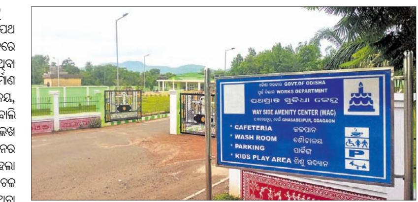
ଓଡ଼ିଶାରେ ଥିବା ପଥପ୍ରାନ୍ତ ସୁବିଧା କେନ୍ଦ୍ର।

ଓଡ଼ିଶା, ୧୭୭୭ (ଅକ୍ଷୟ କୁମାର ମହାରଣା) ଓଡ଼ିଶା ସରକାର ଉପକ୍ରମଣ ୨୧ ନମ୍ବର ରାଜ୍ୟପଥ ପାର୍ଶ୍ୱରେ ଥିବା ପଥପ୍ରାନ୍ତ ସୁବିଧା କେନ୍ଦ୍ରରେ ଲୋକେ ମୌଳିକ ସୁବିଧାରୁ ବଞ୍ଚିତ ହୋଇଥିବା ଜଣାଯାଇଛି।