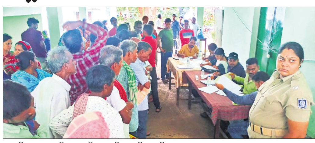
ପ୍ରଶାସନିକ ଅଧିକାରୀଙ୍କ ନିକଟରେ ଅଭିଯୋଗ କରିବାକୁ ଆସିଥିବା ଅଭିଯୋଗକାରୀମାନେ।

ଖଣ୍ଡପଡ଼ା, ୧୭୭୭ (ଅକ୍ଷୟ କୁମାର ମହାରଣା) ନୟାଗଡ଼ ଜିଲ୍ଲା ପ୍ରଶାସନ ସମ୍ବନ୍ଧୀୟ ଖଣ୍ଡପଡ଼ା ରୁକ୍ମ ସମ୍ମିଳନୀ କକ୍ଷରେ ଯୋଜନା କରାଯାଇଥିବା ଏକ ଜନଶୁଣାଣି ଚଳିଥିଲା।