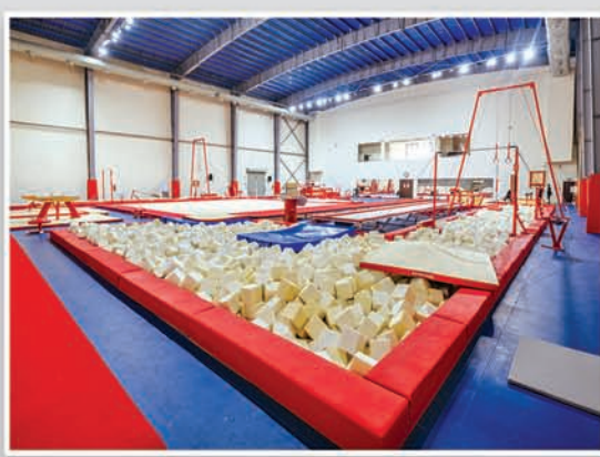
ଜିମ୍ନାଷ୍ଟିକ୍ସ ଉଚ୍ଚ ପ୍ରଦର୍ଶନ କେନ୍ଦ୍ର

“କ୍ରୀଡ଼ା ଦୃଶ୍ୟପଟର ରୂପାନ୍ତରଣ, କ୍ରୀଡ଼ାବିତଙ୍କ ସଶକ୍ତିକରଣ”