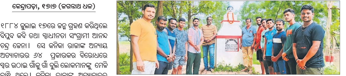
କେନ୍ଦ୍ରାପଡ଼ା, ୧୭୭୭