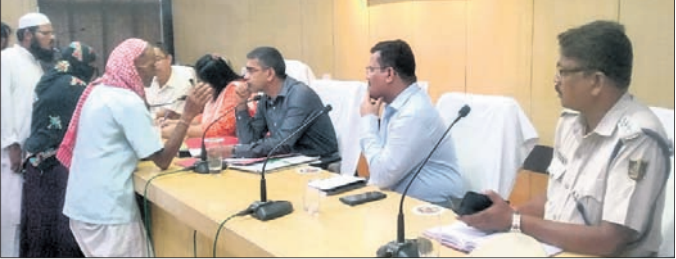
ପ୍ରଶାସନିକ ଅଧିକାରୀଙ୍କ ନିକଟରେ ଜଣେ ବୃଦ୍ଧ ଅଭିଯୋଗ କରୁଛନ୍ତି।

କରତ୍ୱିୟ, ୧୭୭୭ (ପ୍ରଶାସନ କୁମାର ନାୟକ) ଲିମ୍ପାପାଳଙ୍କ କାର୍ଯ୍ୟାଳୟ ପରିସର ସହକାରୀ ସଭାକ୍ରମରେ ମୁଖ୍ୟମନ୍ତ୍ରୀ ଅଭିଯୋଗ ଶୁଣାଣି ଶିବିର ଅନୁଷ୍ଠିତ ହୋଇଥିଲା। ଏଥିରେ ମୋଟ ୧୦୭ ଅଭିଯୋଗ ପଞ୍ଜୀକୃତ ହୋଇଥିଲା।