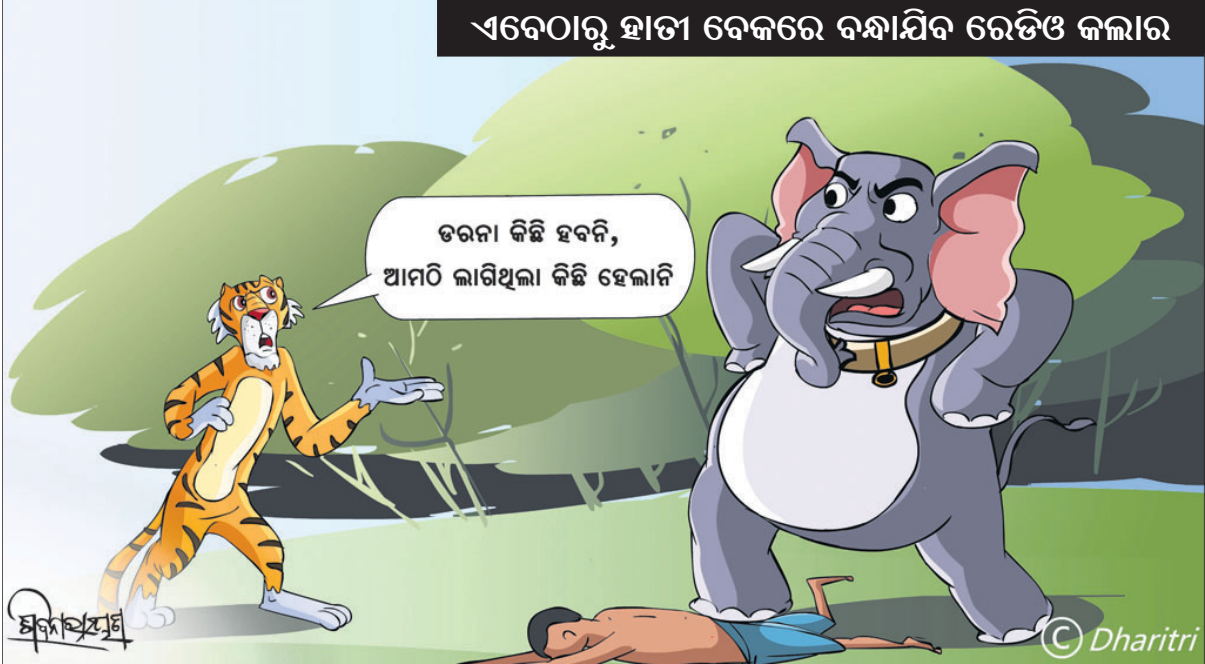
ଏବେଠାରୁ ହାତୀ ବେକରେ ବନ୍ଦୀଧିବ ରେଡିଓ କଲାର

କାବି ଦଶାରେ ମଣିଷ ନିକଟୁ ଅତ୍ୟନ୍ତ ଶକ୍ତିଶାଳୀ ବୋଲି ମନେ କରିଥାଏ। କିନ୍ତୁ ସେ ଯେତେବେଳେ ମୃତ୍ୟୁର ସନ୍ଦେଶ ଶୁଣି, ସେତେବେଳେ ଭଗବାନଙ୍କୁ ସହାୟ ହେବା ପାଇଁ ନିବେଦନ ଜଣାଏ। ଭଗବାନ ହିଁ ମଣିଷର ମୃତ୍ୟୁକାଳୀନ ସହାୟକ ବୋଲି ଏଠାରେ ପ୍ରକାଶ କରାଯାଇଛି। ଓଡ଼ିଆ ଜଗଜ୍ଞାନ ଓ ରୁଚି ପ୍ରୟୋଗ - ଏ.କେ. ମିଶ୍ର ପବ୍ଲିଶର୍ସ ପ୍ରା:ଲିଃ