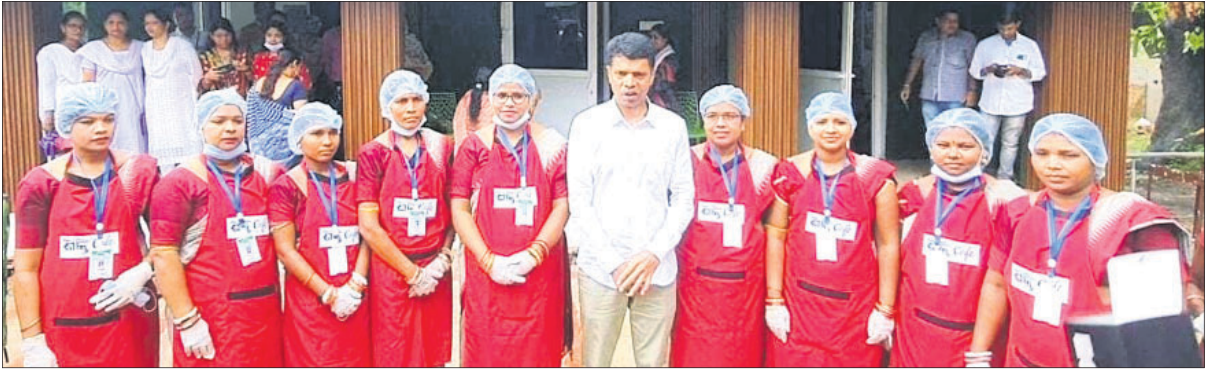
ମିଶନ ଶକ୍ତି କାଫେରେ ୫-ଟି ସପ୍ତକ ଭି.କେ. ପାଞ୍ଚଦିନ।

କରାଯିବା ସହ ଗାଧ ଜମିକୁ ଜଳ ଓ ପାନୀୟ ଜଳ ପ୍ରକଳ୍ପ ମଧ୍ୟ ଅଗ୍ରାଧିକାର ଦିଆଯିବ ବୋଲି ଏହି ଅବସରରେ କହିଥିଲେ। ଜିଲ୍ଲାର ବିଭିନ୍ନ ଗ୍ରାମରେ ପରିସେଠ ଅବସ୍ଥାରେ ପଡ଼ିଥିବା ସରକାରୀ ସହାୟତା ଉତ୍ସାହିତ କରିବାକୁ ଉତ୍ସାହିତ କରିଥିଲେ। ଏହାପରେ ସେ ଆଦିବାସୀ ଅଧିକାର କଂସର, ପାରଦୋଧି, ତିଆମାଳ ବ୍ଲକର ଛତାବର (ନାଉଲିପତା) ଓ ବାରକୋଟ ବ୍ଲକର ବଳମ ଆଦର୍ଶ ଖେଳ ପଡ଼ିଆରେ ଆୟୋଜିତ ସଭାରେ ଯୋଗଦେଇ ଜନସାଧାରଣଙ୍କ ଠାରୁ ବିଭିନ୍ନ ସମସ୍ୟା ସମ୍ପର୍କିତ ସରକାରୀ ସହାୟତା ଦାବି କରିବା ପାଇଁ ପ୍ରତିଶ୍ରୁତି ଦେଇଥିଲେ। ବିଶେଷ ଭାବେ ମନ୍ଦିର, ମସଜିଦ୍ ସମେତ ସମସ୍ତ ଧର୍ମାନ୍ୱୟାନ ବିକାଶ ଓ କମ୍ୟୁନିଟି ସେଣ୍ଟର ସମ୍ପର୍କିତ ଦାବିକୁ ଆରାମ୍ଭ କରିବା ଏବଂ ସହାୟତା ଦେବାକୁ ପ୍ରସ୍ତୁତ ହେବେ ବୋଲି ସୁନା କରାଯିବ ବୋଲି ସେ ପ୍ରତିଶ୍ରୁତି ଦେଇଥିଲେ।