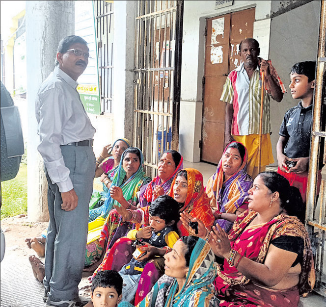
ବିତଠି ଧାରଣାକାରୀଙ୍କ ସହ ଆଲୋଚନା କରୁଛନ୍ତି ।

ଆବାସ ହିତାଧିକାରୀ ଚନ୍ଦନରେ ଅନିୟମିତତା ହୋଇଥିବା ନେଇ ବେରୁହାଁବାରୀ ପଞ୍ଚାୟତରେ ମହିଳାପୁରୁଷମାନେ ଧାରଣାରେ ବସିଥିଲେ । କିନ୍ତୁ ଦୀର୍ଘ ୧୯ ଦିନ ପରେ ବି ସେମାନଙ୍କୁ ନ୍ୟାୟ ନ ମିଳିବାରୁ ଧାରଣାକାରୀମାନେ ସୋମବାର ପଞ୍ଚାୟତ କାର୍ଯ୍ୟାଳୟ ଆସି ନୂଆଗାଁ ବ୍ଲକ୍ କାର୍ଯ୍ୟାଳୟରେ ଧାରଣାରେ ବସିଥିଲେ । ଦୀର୍ଘ ୫ ଦିନ ବସିବା ପରେ ଆସନ୍ତା ୨୪ ତାରିଖରେ ନୂଆଗାଁ ବ୍ଲକ୍ରେ ଜିଲ୍ଲାପାଳଙ୍କ ଜଣଶୁଣାଣିରେ ସମସ୍ୟାର ସମାଧାନ କରିବା ନେଇ ବିତଠକ୍‌ଠାକୁ ପ୍ରତିଶ୍ରୁତି ପାଇ ଧାରଣାରୁ ଉଠିଥିଲେ । ନୟାଗଡ଼ ଜିଲ୍ଲା ନୂଆଗାଁ ବ୍ଲକ୍ ବେରୁହାଁବାରୀ ପଞ୍ଚାୟତରେ ଆବାସ ବୃହତ ଚାଲିକାରୁ ବାଦ୍ ପଡ଼ିଥିବା ୧୫ ଜଣରୁ ଉର୍ଦ୍ଧ୍ୱ ମହିଳାପୁରୁଷ ପଞ୍ଚାୟତ କାର୍ଯ୍ୟାଳୟରେ ଧାରଣାରେ ବସିଥିଲେ । ଧାରଣାର ୫ ଦିନ ପରେ କେହି ନ ଶୁଣିବାରୁ ୬୫ ଦିନକୁ