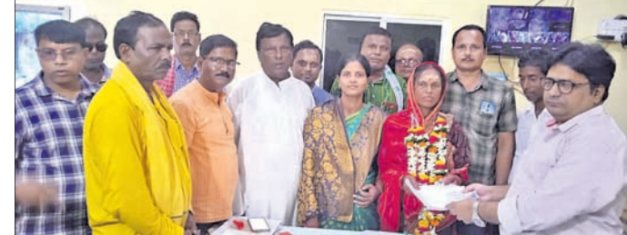
କେନ୍ଦ୍ରାପଡ଼ା, ୧୭୭୭ (କରନାଥ ଧଳ)

ପଞ୍ଚାୟତ ସମିତିର ପଞ୍ଚାୟତର ସମିତିସଭା ଚଳିବା ପାଇଁ ଉପନିର୍ବାଚନ ଆରମ୍ଭ ୯ ତାରିଖରେ ଅନୁଷ୍ଠିତ ହେବାର ଯୋଜନା। ଏହି ପଞ୍ଚାୟତର କଂଗ୍ରେସ ସମର୍ଥକ ସମିତିସଭା ପୁସ୍ତକତା ବାକି ଅକାଳ ବିୟୋଗ ଯୋଗୁଁ ଉପନିର୍ବାଚନ ଅନୁଷ୍ଠିତ ହେଉଛି।