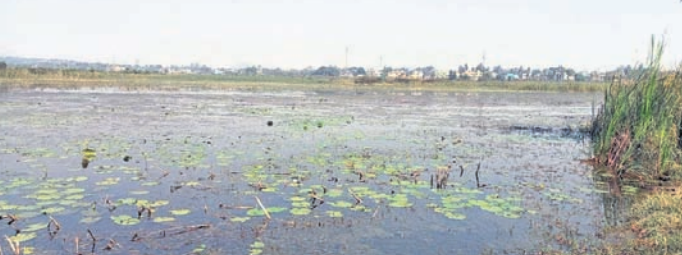
ପୁନରୁଦ୍ଧାର ଅପେକ୍ଷାରେ ଥିବା ହଳଦିଆକଟା ପୋଖରୀ