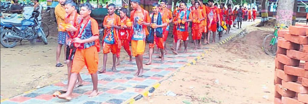
ଦେଈାନାଳ ଜିଲ୍ଲା ଭୁବନ ବୃଦ୍ଧଙ୍କର ଶ୍ରେୟାଠକ୍ କଳାକାରି ପାଇଁ ସୋମବାର କାଉଡ଼ିଆମାନେ ବ୍ରାହ୍ମଣୀ ନଦୀରୁ ପାଣି ନେଇ ଆସୁଛନ୍ତି।