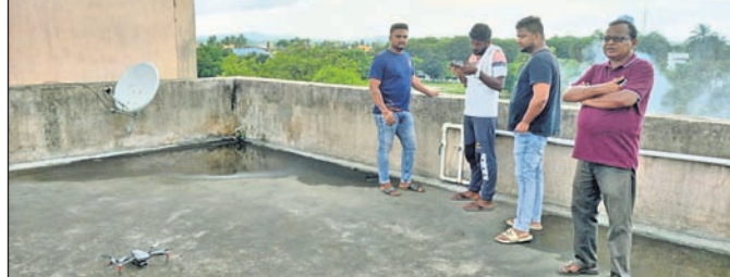
ପୋଖରୀ ପୁନରୁଦ୍ଧାର ନିମନ୍ତେ ଡ୍ରୋନ୍ କରାଯିବ ସର୍ବେ କରାଯାଇଛି।

ପରିଚ୍ୟକ୍ତ ପୋଖରୀଗୁଡ଼ିକର ହେବ ପୁନରୁଦ୍ଧାର। ଫଳରେ ଅନୁଗୋଳ ସହରରେ ଆଉ ଜଳଭଣ୍ଡ ନେଇ ସମସ୍ୟା ରହିବ ନାହିଁ। ଏପରି କି ପରିଚ୍ୟକ୍ତ ଅବସ୍ଥାରେ ଥିବା ପୋଖରୀରୁ ଆସୁଥିବା ଦୂର୍ଗନ୍ଧ ମଧ୍ୟ ଲୋକଙ୍କ ନାକରେ ବାଜିବ ନାହିଁ।