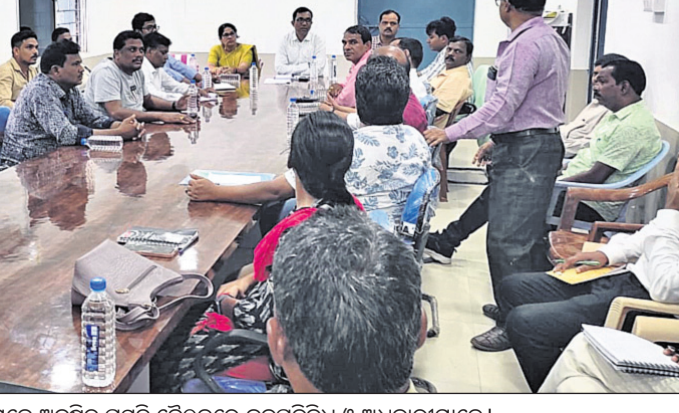
ଉପଖଣ୍ଡସଭା ସାଧନା ଦିବସ ପାଳନ ନିମନ୍ତେ ଅନୁଷ୍ଠିତ ପ୍ରସ୍ତୁତି ବୈଠକରେ ଉପସ୍ଥିତ ଅଧିକାରୀମାନେ।