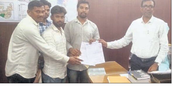
ଉପଜିଲ୍ଲାପାଳଙ୍କୁ ଦାରିପତ୍ର ପ୍ରଦାନ କରାଯାଇଛି।

ତାଳଚେର, ୧୭୧୭ (ମନୋଜ ନନ୍ଦ) କର୍ମକର୍ତ୍ତା ଉପଯୁକ୍ତ ଥିଲେ। ବୈଠକରେ ନୂତନ ପଞ୍ଜୀକରଣ ନିୟମ ଅନୁଯାୟୀ ପ୍ରତ୍ୟେକ ପୂଜା କମିଟି ସଭାପତି ଓ ସମ୍ପାଦକ ସଭ୍ୟ ଦେୟ ଦାଖଲ କରିବା ପରେ ନୂତନ କର୍ମକର୍ତ୍ତା ଚୟନ ପ୍ରକ୍ରିୟା ଆରମ୍ଭ ହେବ।