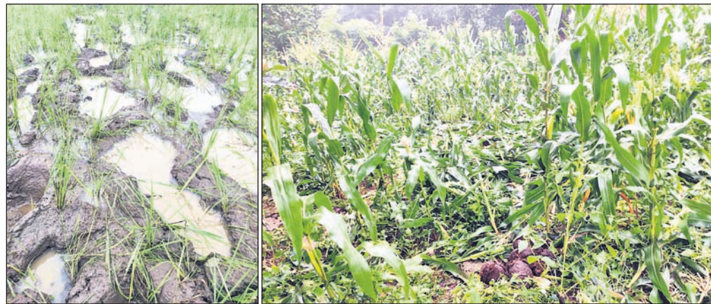
ଧାନ ଚଳିବୁ ହାତୀ ଦଳି ଦେଇଛି।