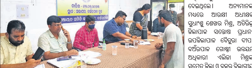
ଶିବିରରେ ଉପସ୍ଥିତ ଜିଲ୍ଲାପାଳଙ୍କ ସମେତ ଅନ୍ୟ ଅଧିକାରୀମାନେ।