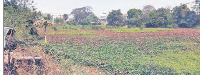
ଅନୁଗୋଳ ସହର ଖୁର୍ଦ୍ଧ ନଂ. ୪ରେ ଥିବା କିଆବନ୍ଧ ପୋଖରୀ।